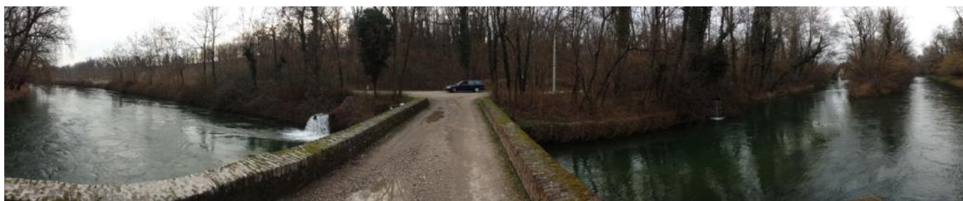
panoramica 04 vista dal ponte sul Naviglio Sforzesco; i terreni del lotto 2a iniziano di fronte all'automobile