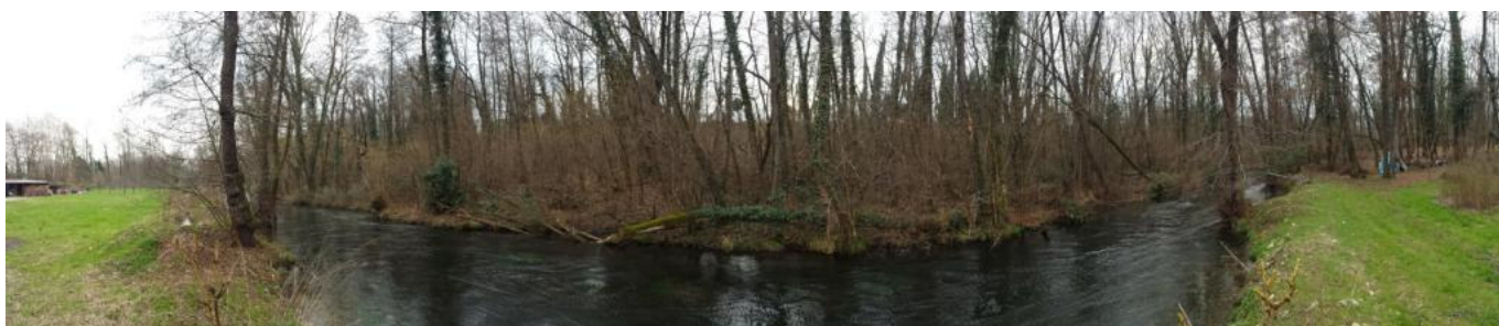
panoramica 08 aree boscate in prossimità della Roggia Molinara