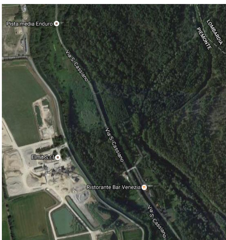
Cartografia di riferimento