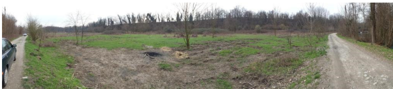
panoramica 05 terreni del lotto 2a visti da strada vicinale Cimaplone Valle Ticino