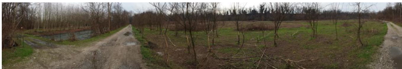
panoramica 06 terreni del lotto 2a visti da strada vicinale Cimaplone Valle Ticino, sulla Sx Naviglio Sforzesco