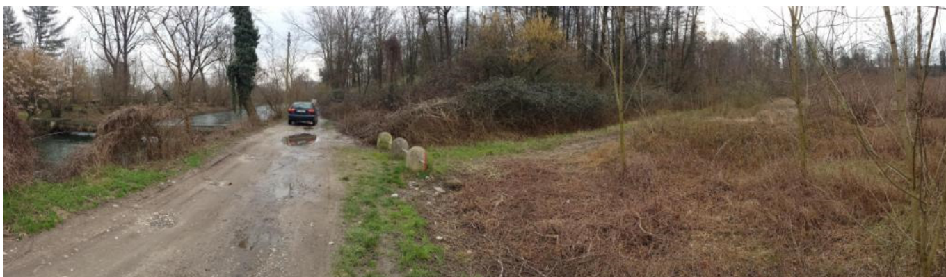
panoramica 07 terreni del lotto 2a visti da strada vicinale Cimaplone Valle Ticino, sulla Sx Naviglio Sforzesco

telefono mobile 348 9280086 e-mail adriano@structurapiu.it