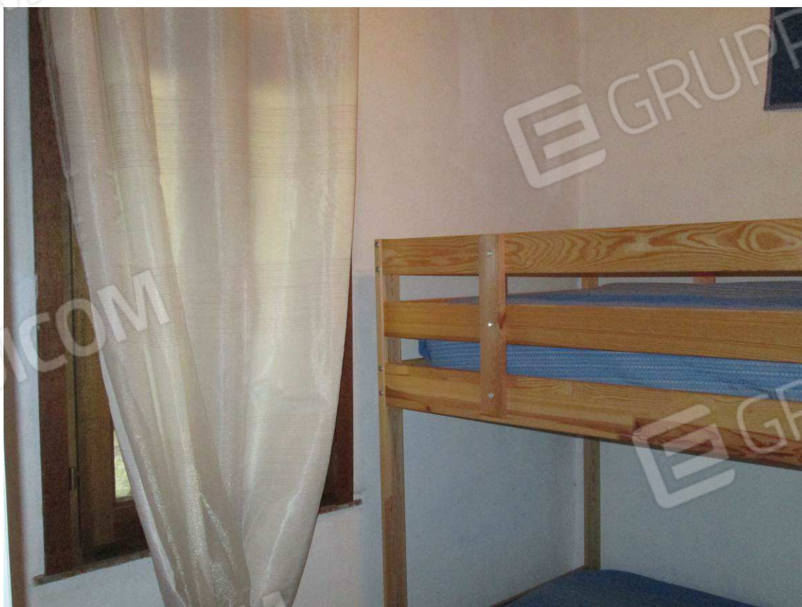
14 – Vista sulla camera –