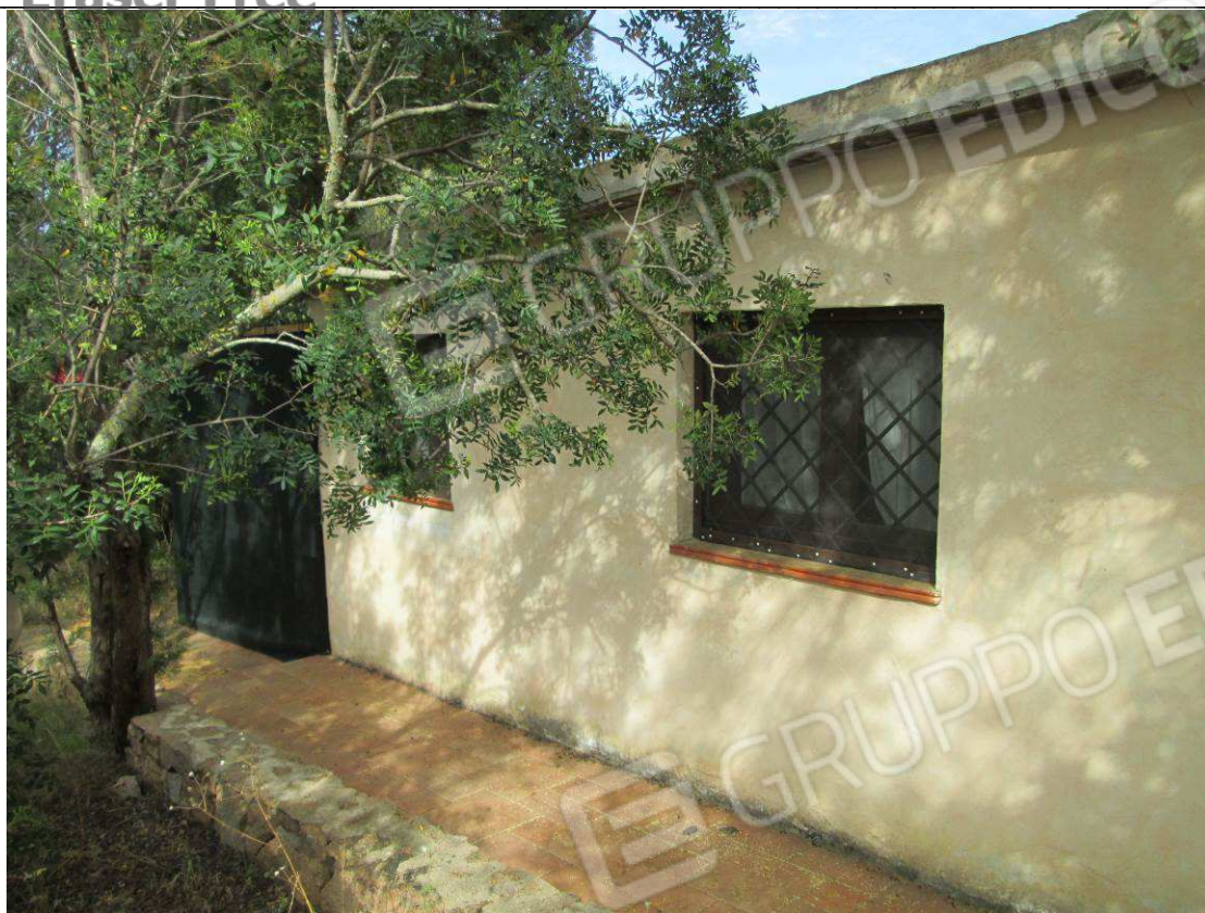
15 – Vista sulla dependance da demolire –