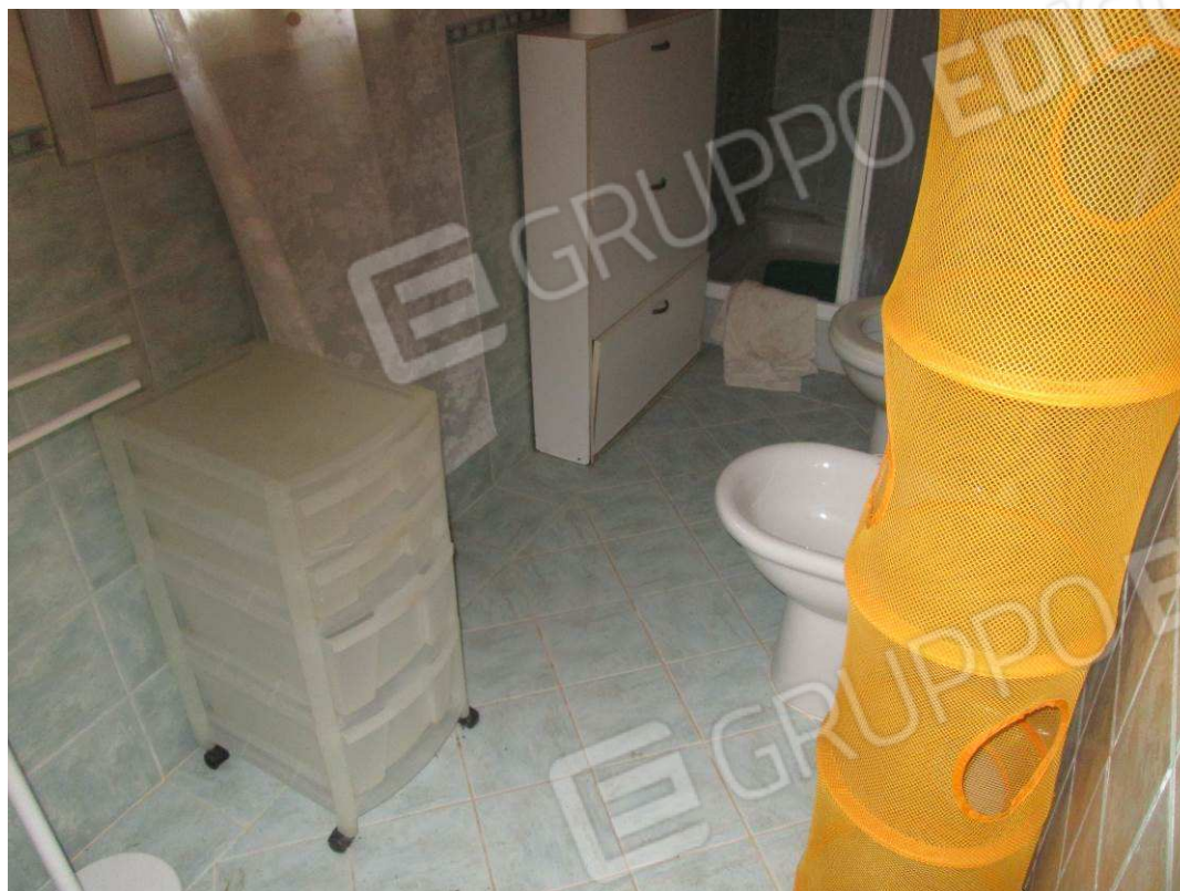
17 – Vista sul bagno dependance –