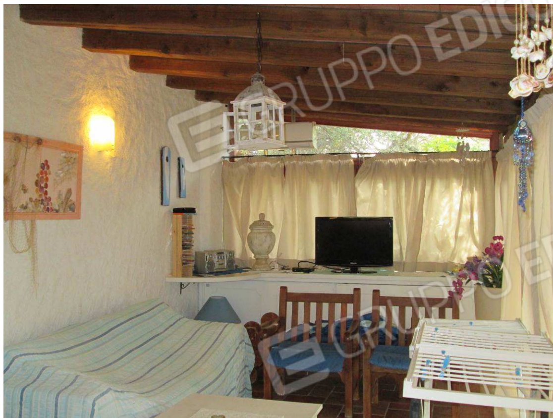
13 – Vista sulla veranda chiusa con infissi –