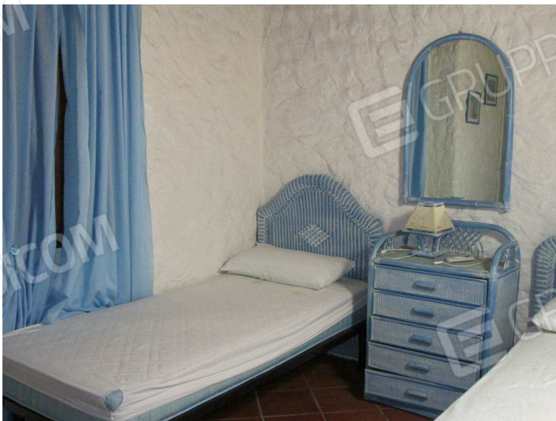
12 – Vista sulla camera –