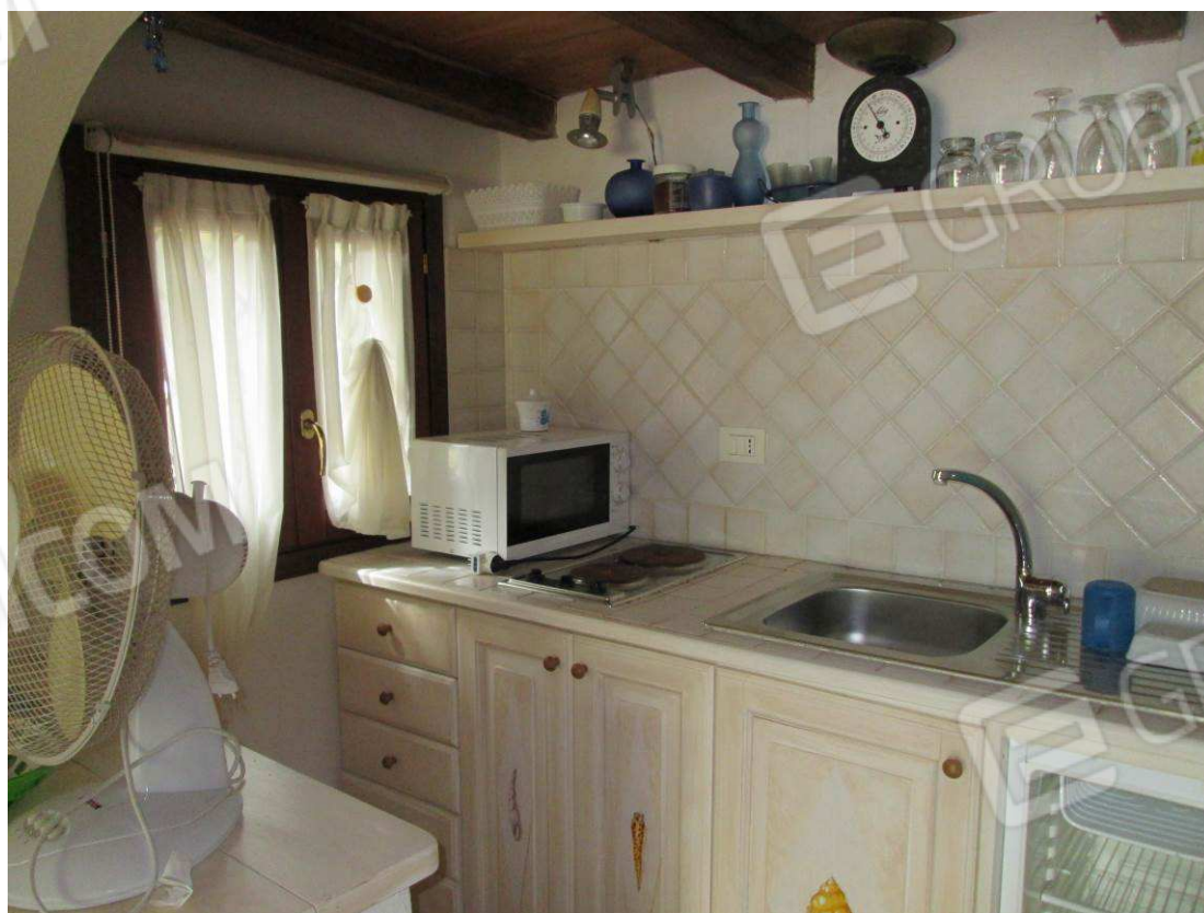
16 – Vista sulla parete attrezzata dependance –