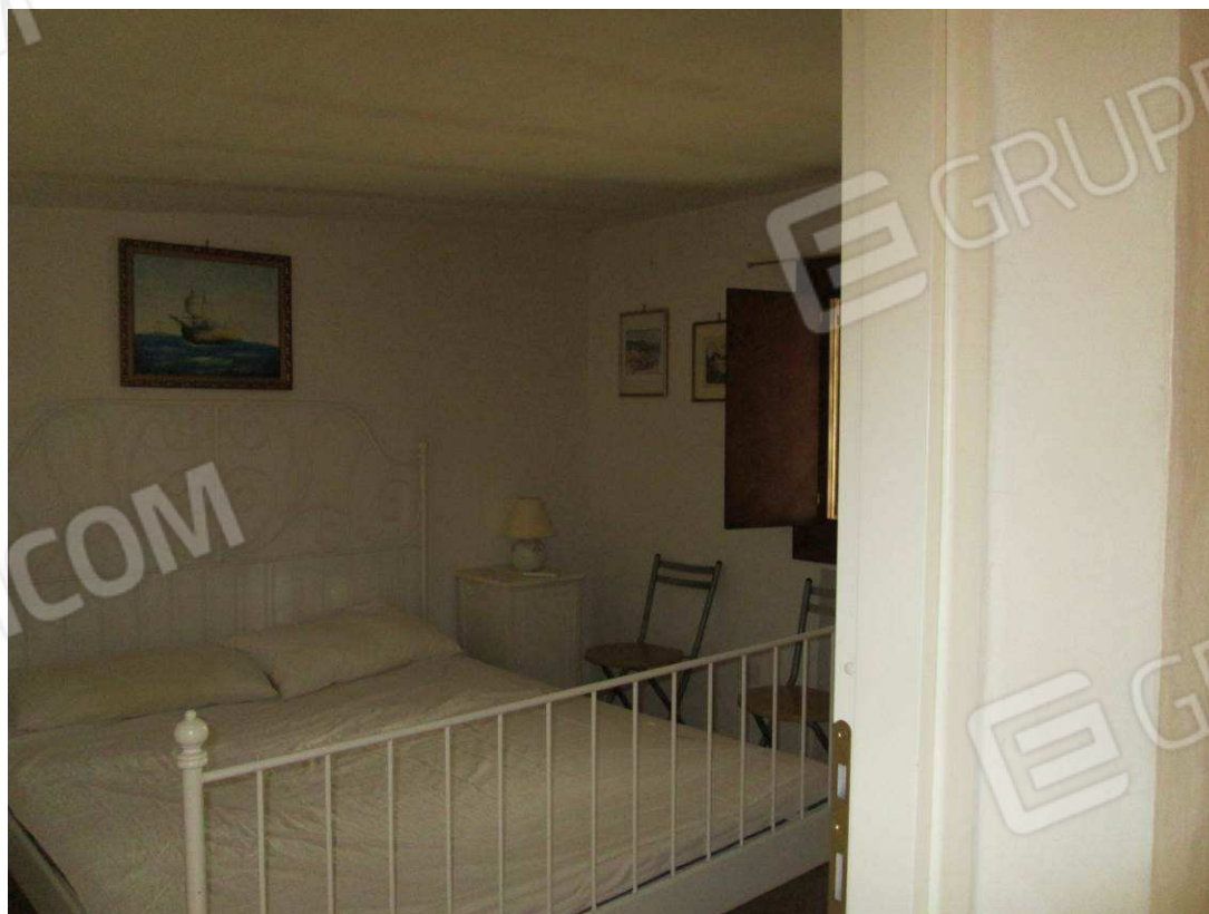
18 – Vista sul bagno dependance –