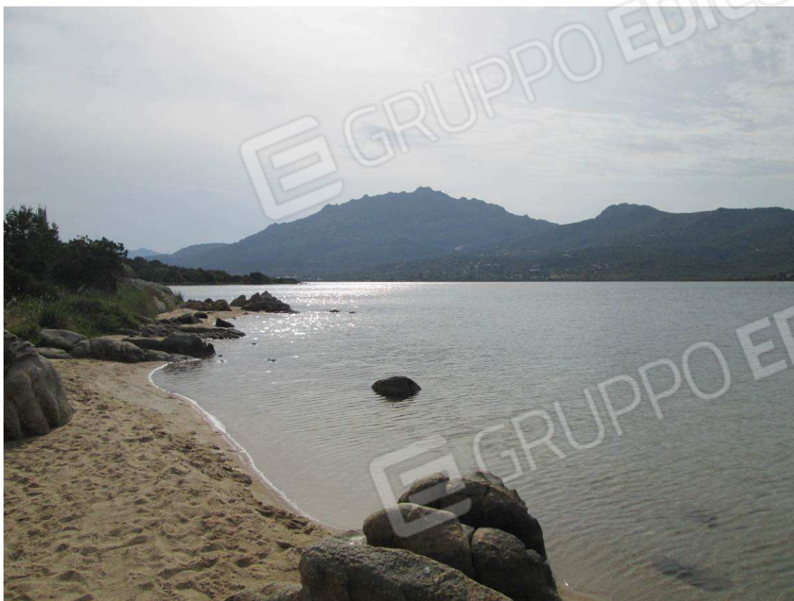
21 – Vista sul mare Golfo di Cugnana –