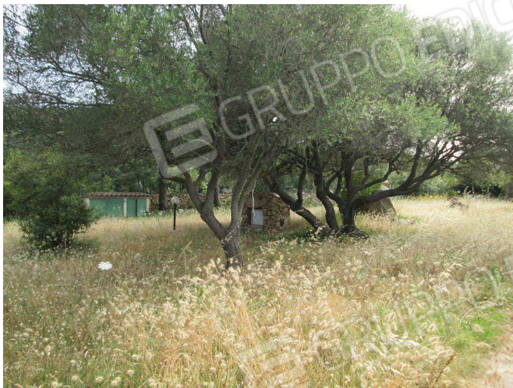
19 – Vista sul terreno foglio 3 mappale 180 –