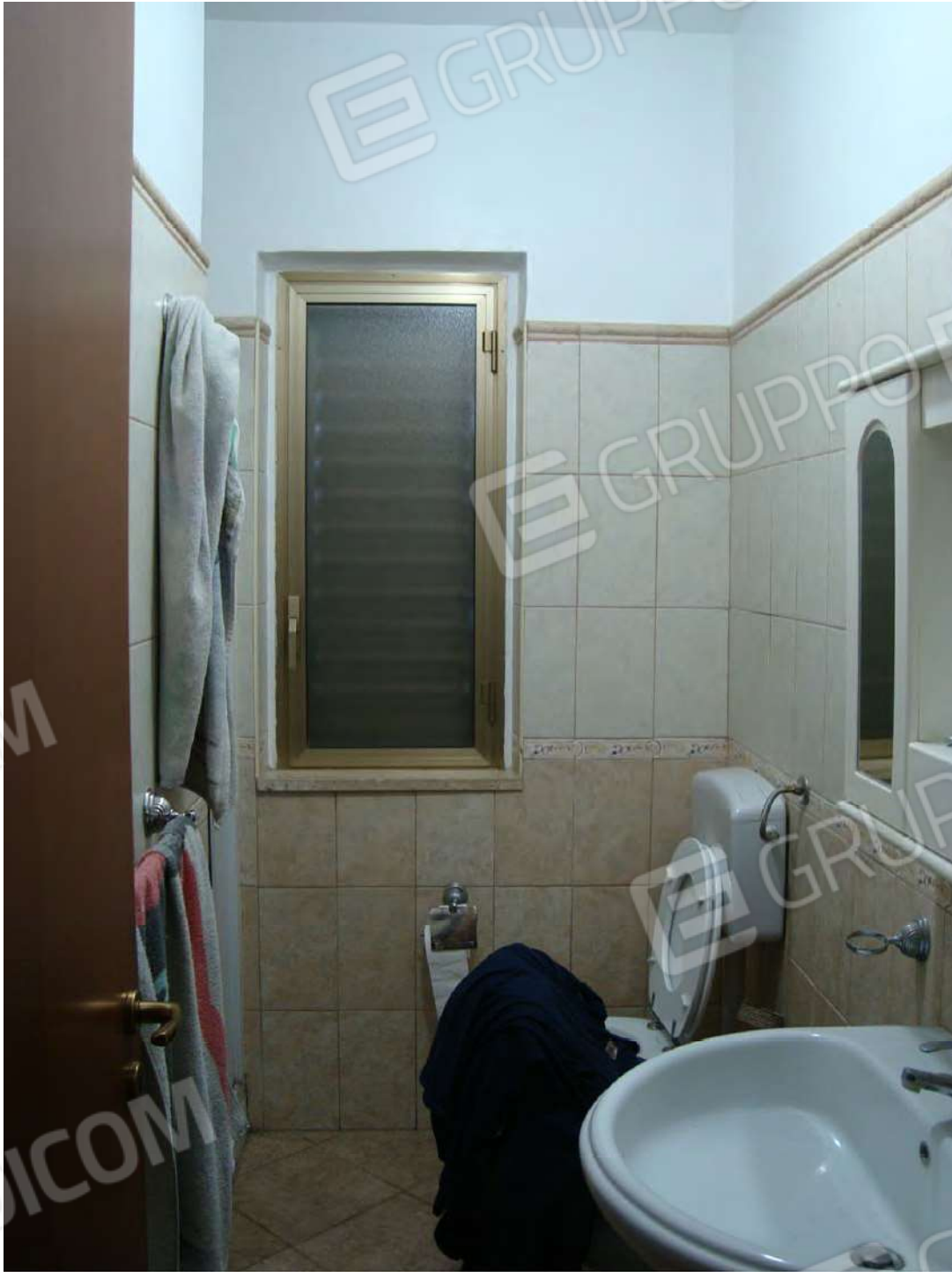
Vista locale w.c.