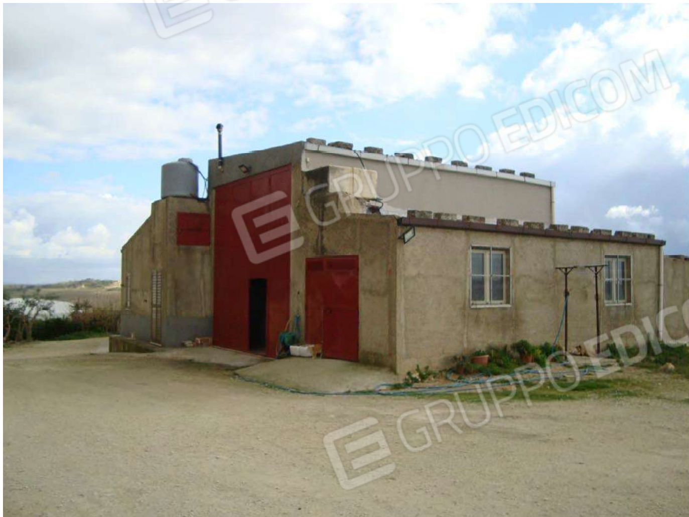
Fabbricato per civile abitazione ed uso agricolo in Naro Fg. 191 part. 610 (ex part. 53 F.R.) cat. A/4