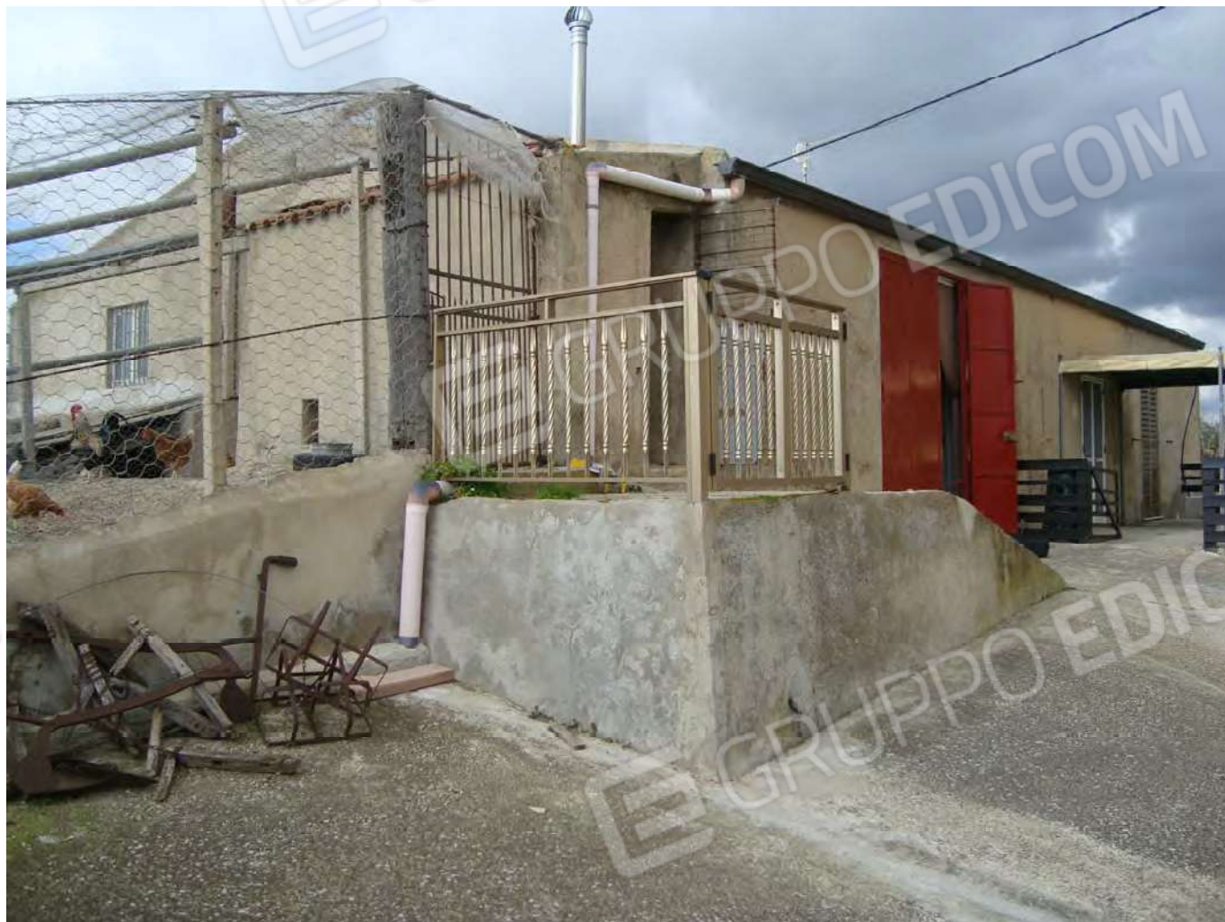
Fabbricato per civile abitazione ed uso agricolo in Naro Fg. 191 part. 610 (ex part. 53 F.R.) cat. A/4