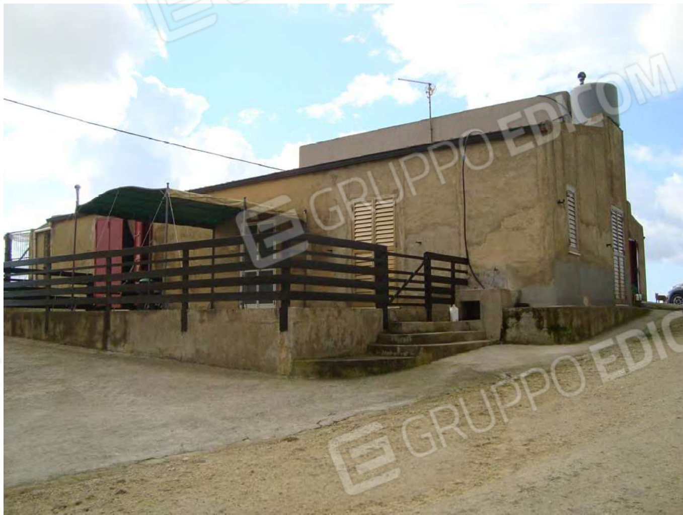
Fabbricato per civile abitazione ed uso agricolo in Naro Fg. 191 part. 610 (ex part. 53 F.R.) cat. A/4