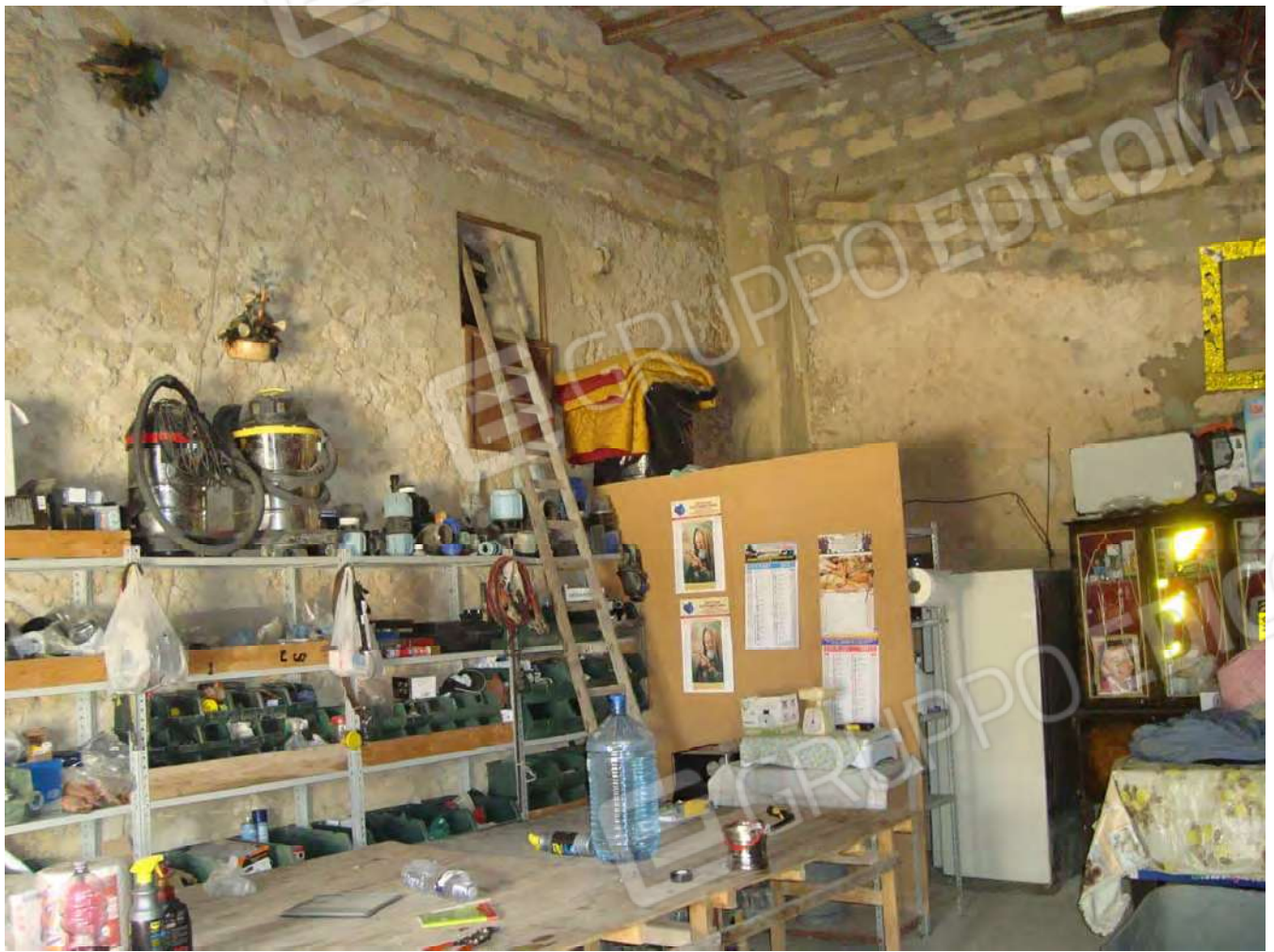
Vista locale vano "2"