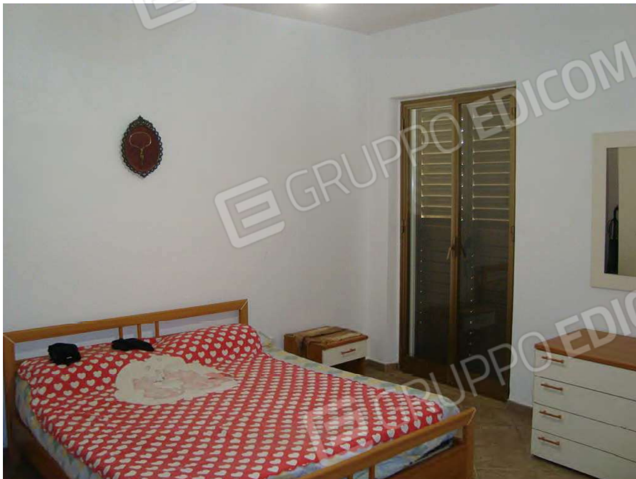
Vista locale letto