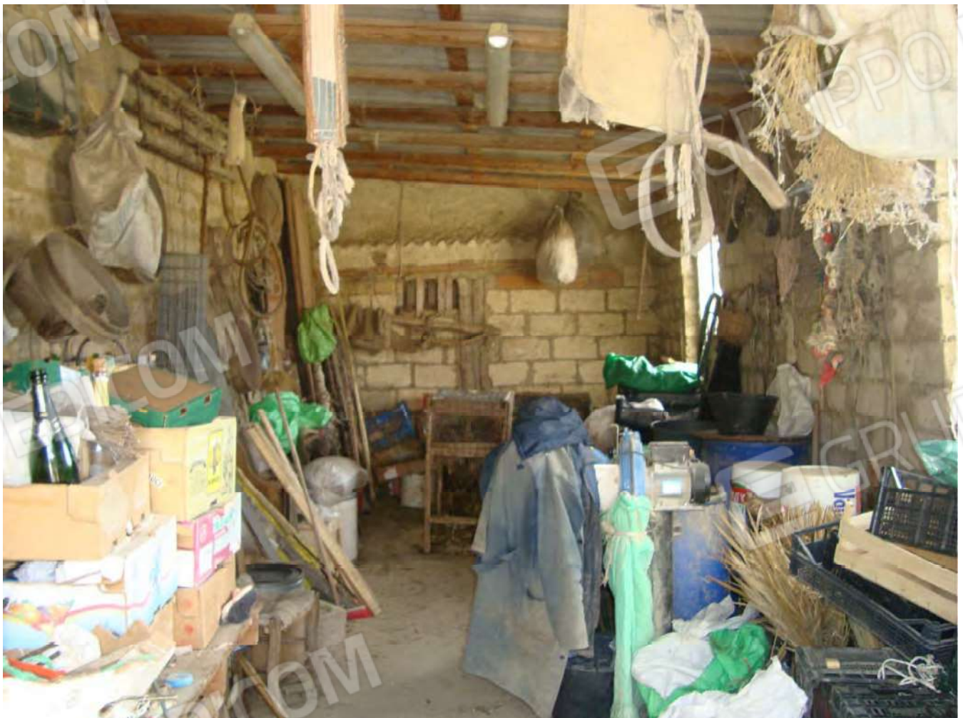
Vista locale vano "3"