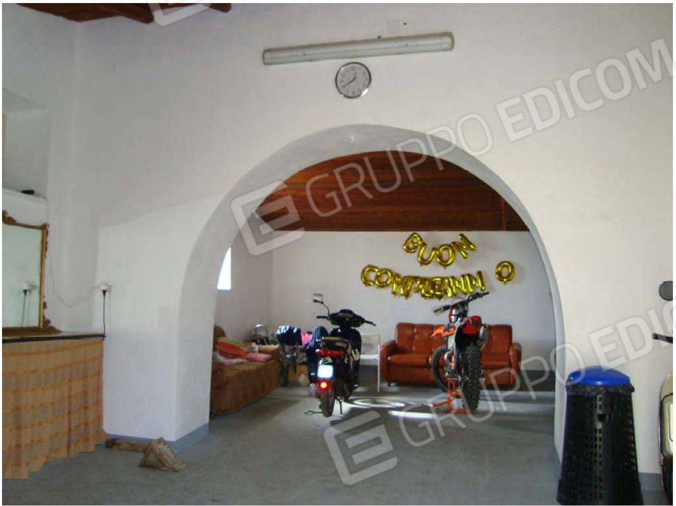
Vista locale vano "1"