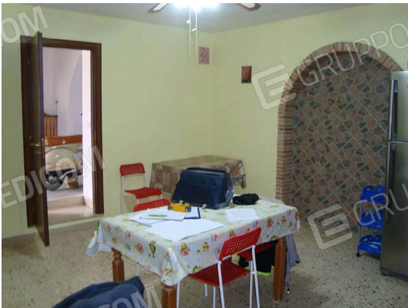
Vista locale cucina