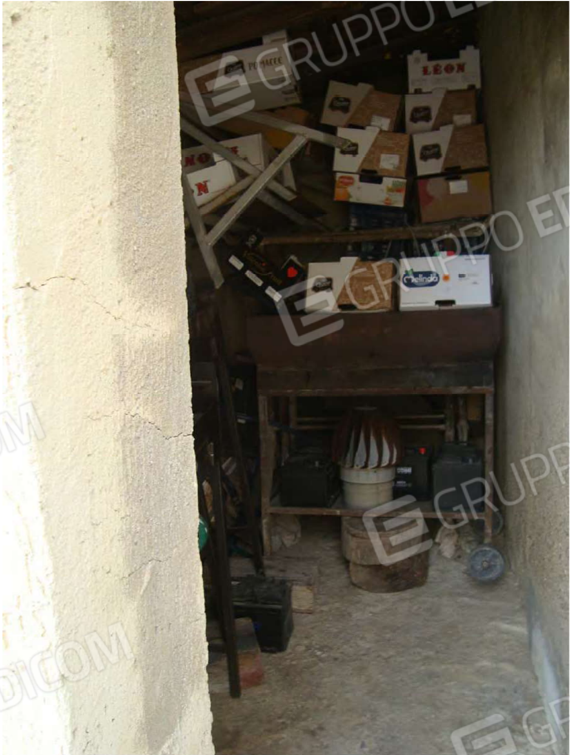
Vista rip. "1"