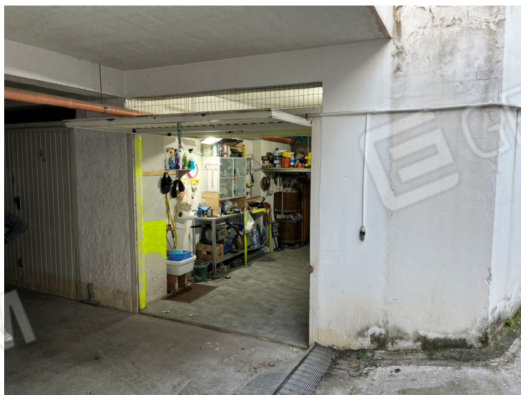
Foto 19 - box auto int. 1 -