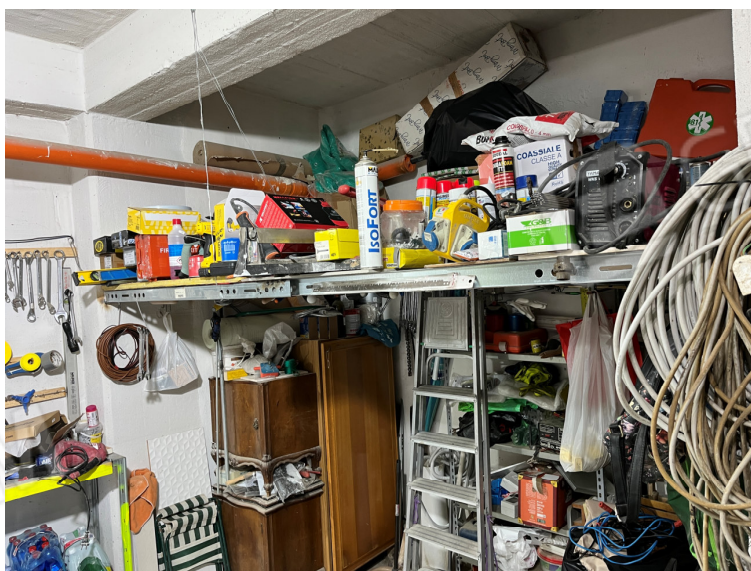
Foto 21 - vista prospettica interno box .-