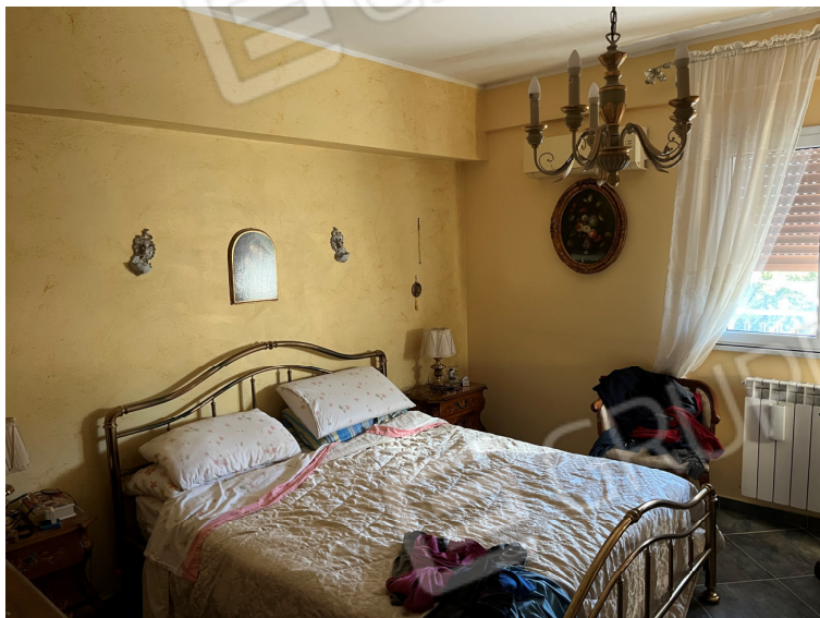
Foto 14 - Camera da letto doppia