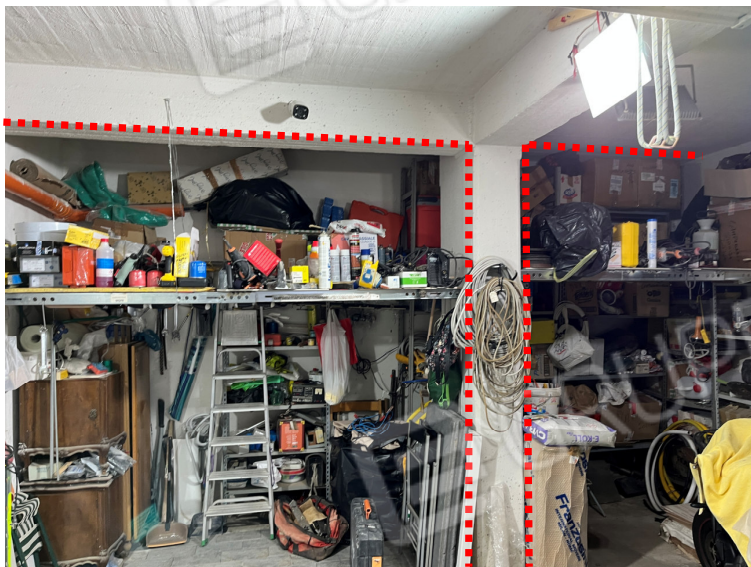
Foto 20 - box auto (assenza del setto murario che funge da intercapedine fondale)