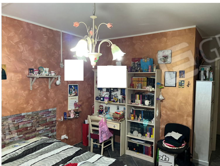
Foto 11 - Camera da letto singola -