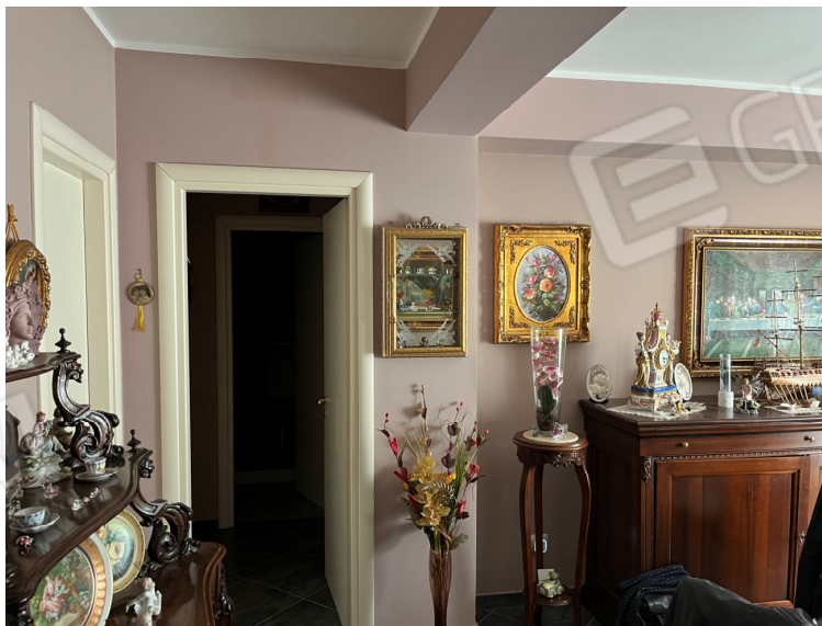
Foto 3 - Ingresso Soggiorno -