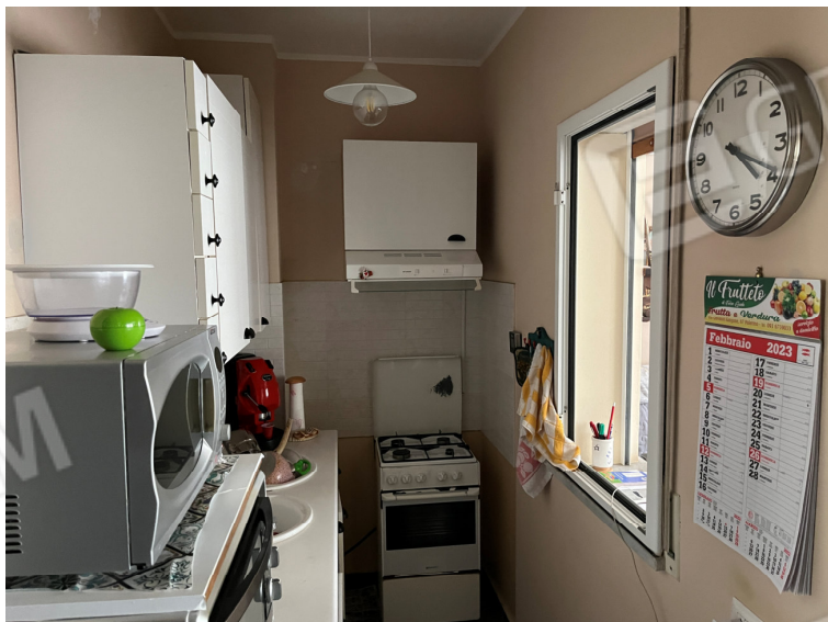
Foto 5 - Angolo cucina.-