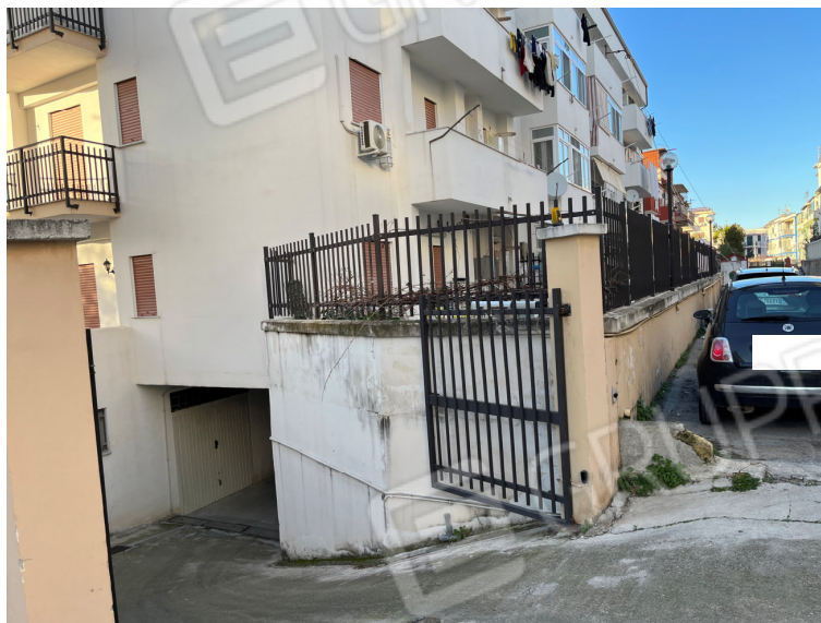
Foto 18 Ingresso carrabile scantinato