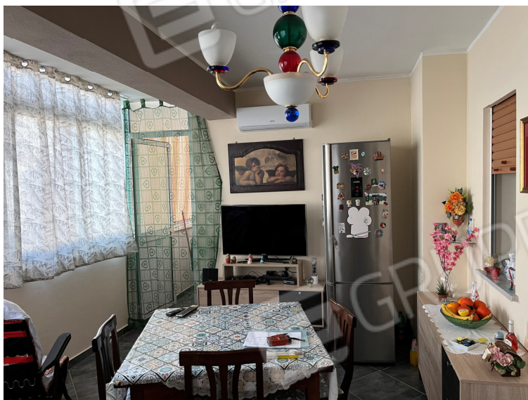
Foto 6 - Vista prospettica porzione di balcone annesso alla cucina chiuso a veranda -