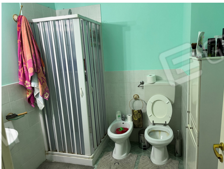
Foto 13 - WC doccia -