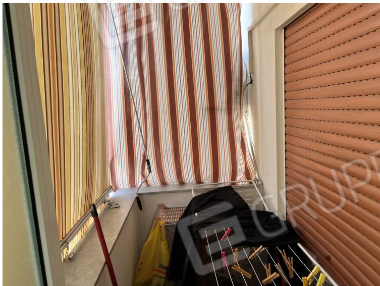
Foto 8 - porzione di balcone lato cucina - non chiuso a veranda -