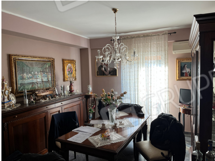
Foto 4 - Soggiorno -