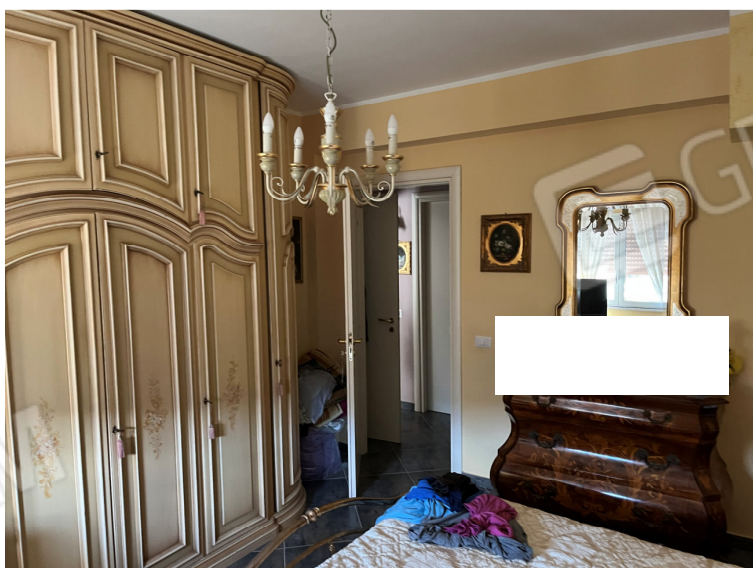
Foto 15 - Camera da letto doppia