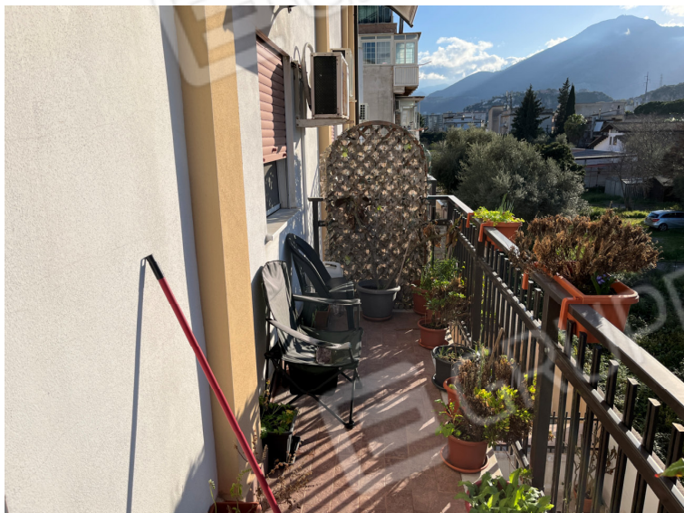
Foto 16 - balcone su cortile interno -