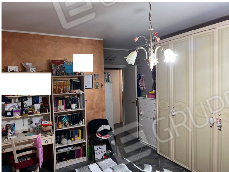
Foto 12 - Camera da letto singola -