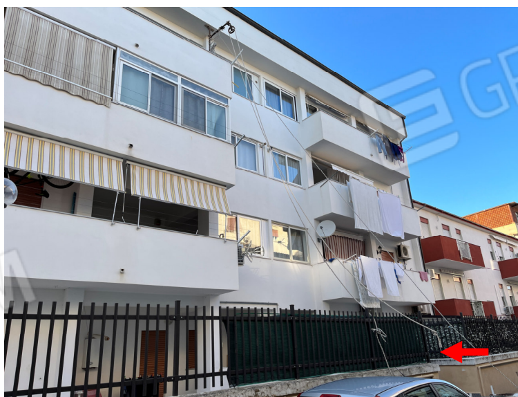
Foto 1 - Vista prospettica su via Domenico Macaluso n. 34 -