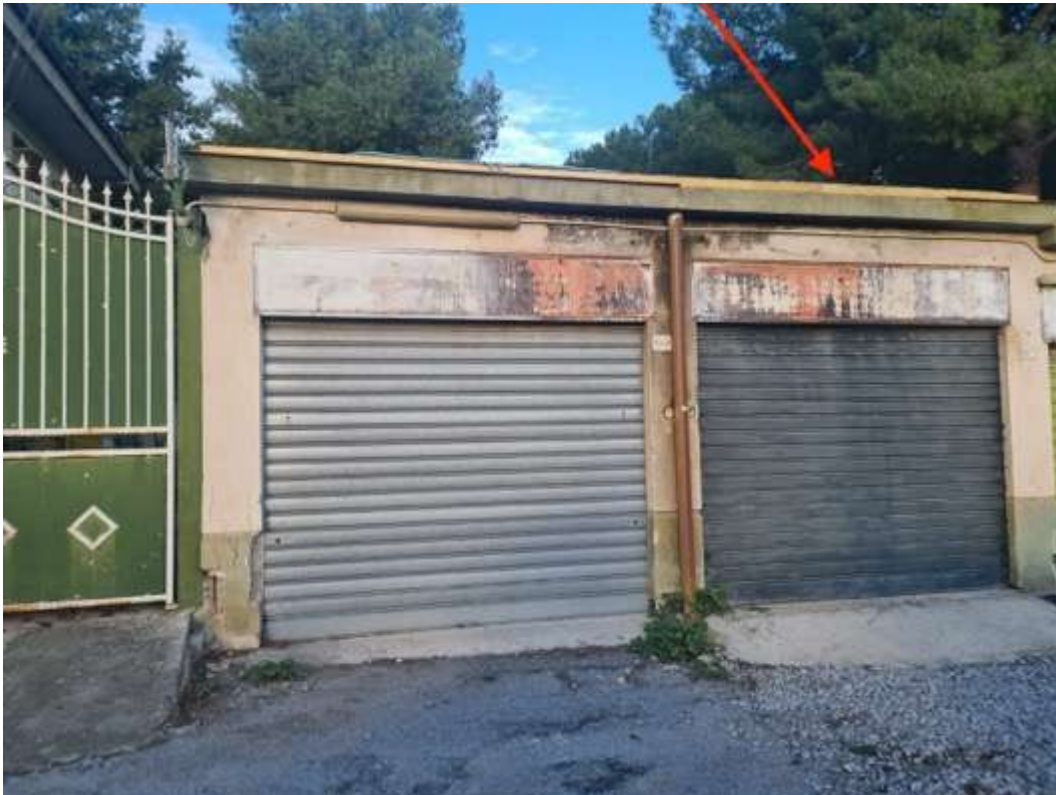
Foto dell'immobile sito in Palermo via Germania n. 67

Esso ricade in una zona residenziale periferica della città di Palermo, in prossimità di una zona ricca di servizi e attività commerciali e delle vie di esodo e accesso alla città.