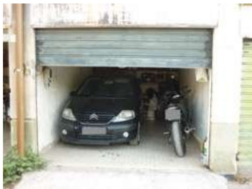
Locale garage: vista esterna

Il locale è provvisto di impianto elettrico fuori traccia con adeguata canaletta ed impianto idrico (Foto 4 e 5)