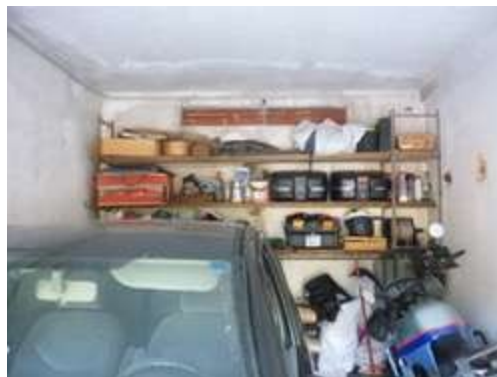
Locale garage: vista interna

La superficie lorda commerciale del locale è costituita dalla superficie coperta che comprendente anche i muri perimetrali e metà dei muri di confine: