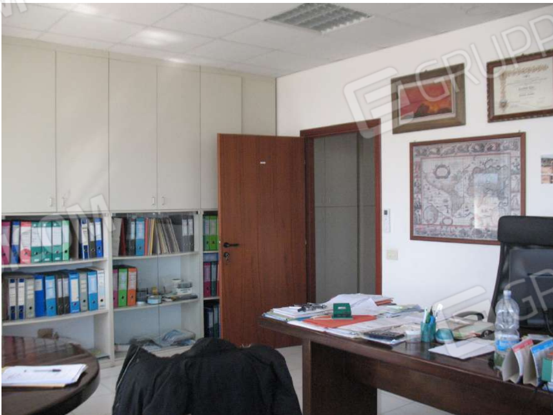
Foto 18 - Corpo uffici e servizi (B) piano primo (Sub 3): Ufficio 1