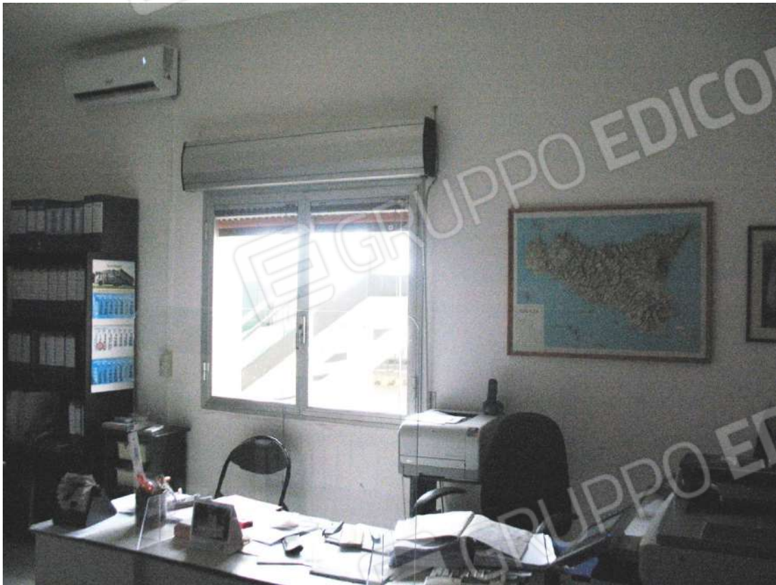
Foto 13 - Corpo uffici e servizi (B) piano terra (Sub 4): Ufficio 3