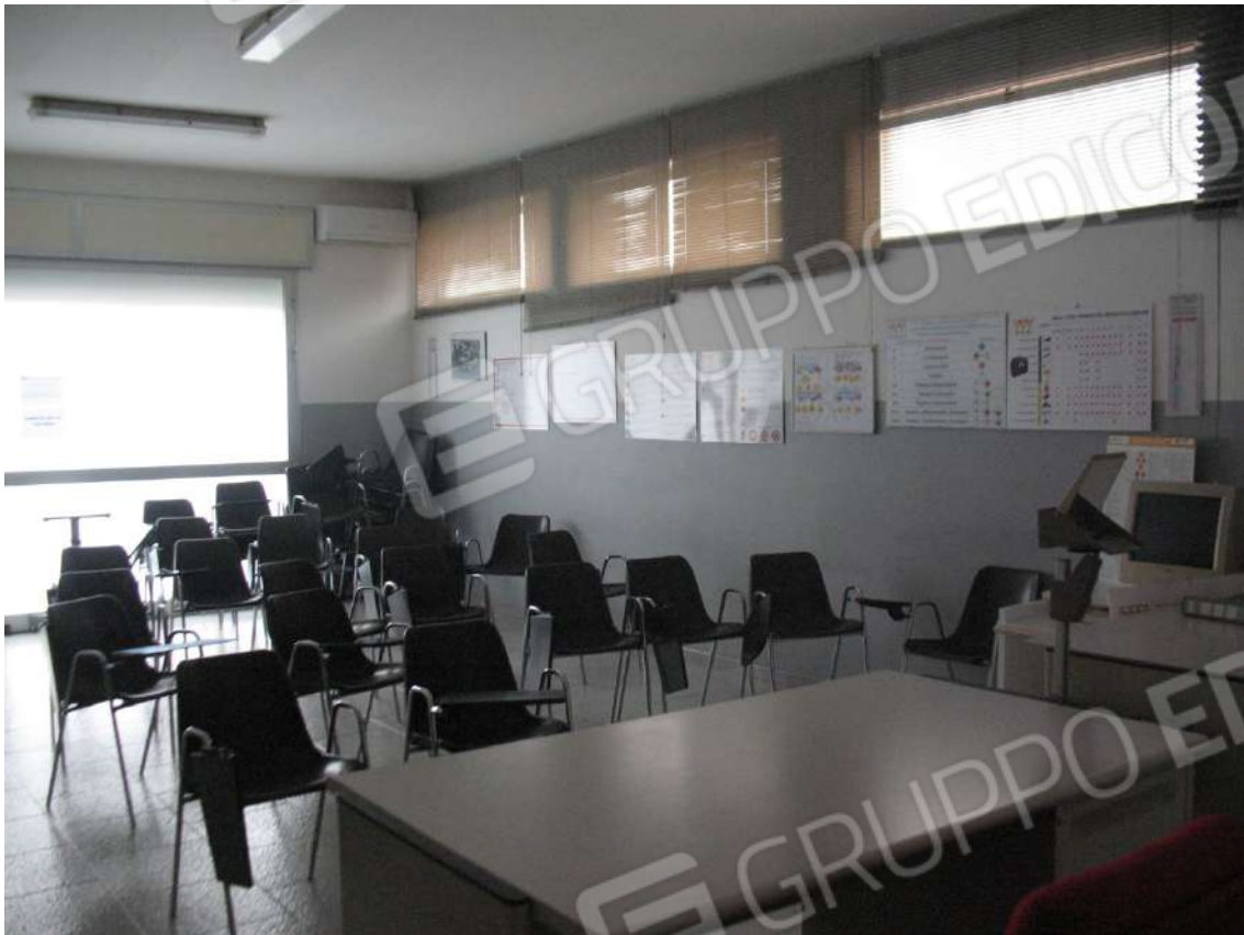
Foto 15 - Corpo uffici e servizi (B) piano terra (Sub 5): Aula formazione