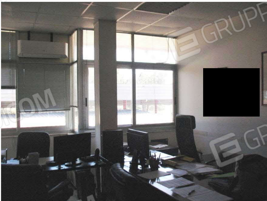
Foto 24 - Corpo uffici e servizi (B) piano primo (Sub 3): Ufficio 3