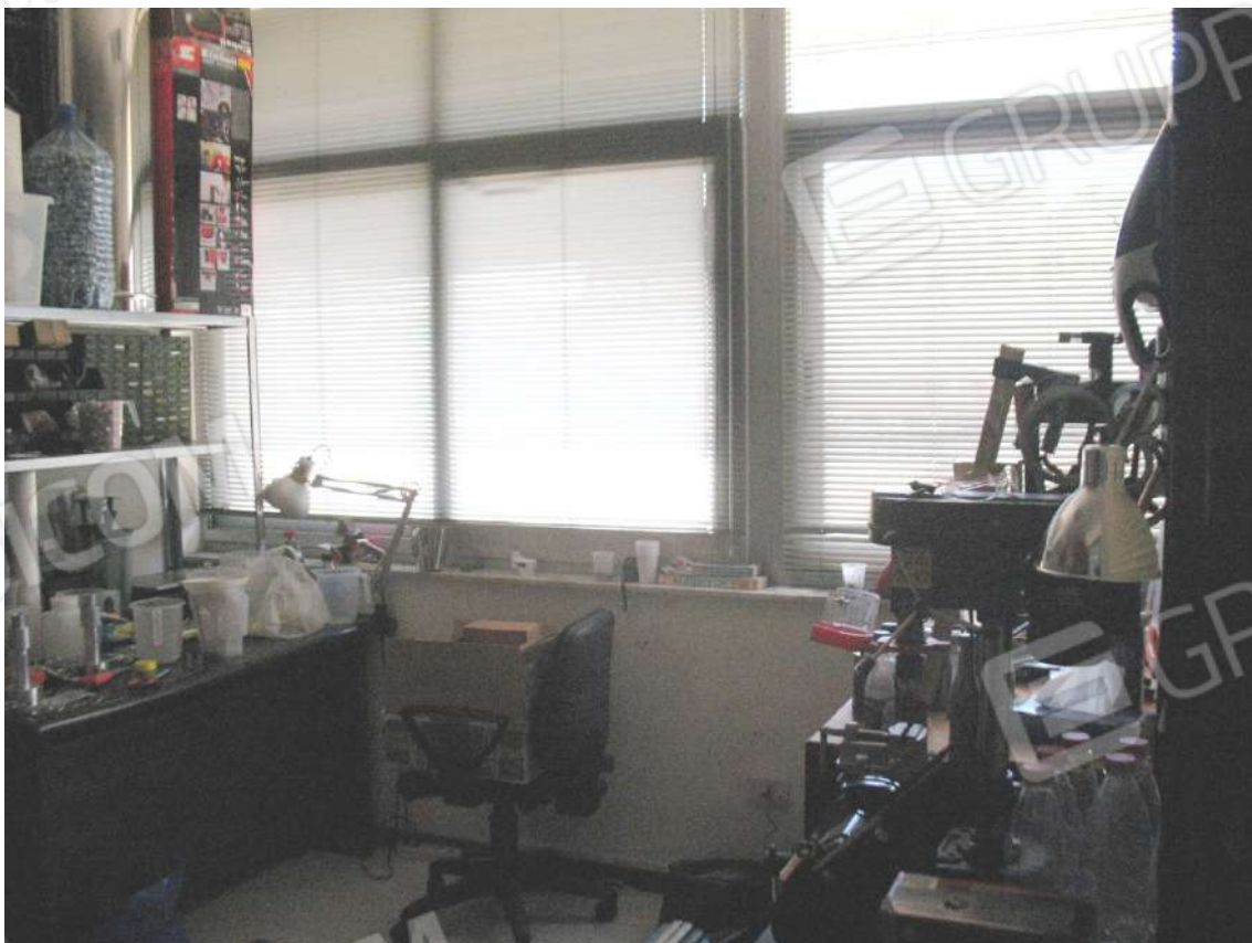
Foto 20 - Corpo uffici e servizi (B) piano primo (Sub 3): Laboratorio