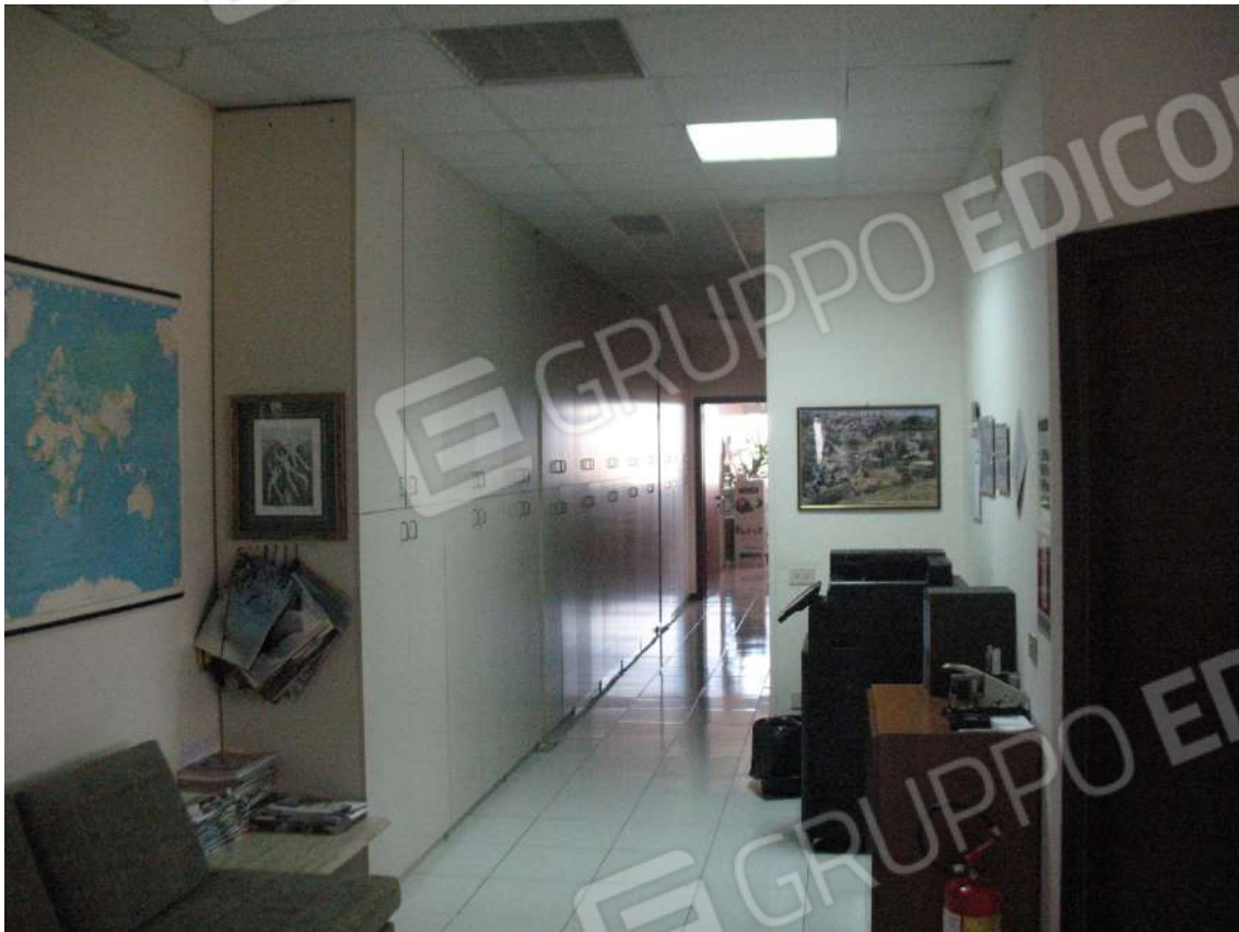
Foto 21 - Corpo uffici e servizi (B) piano primo (Sub 3): Disimpegno