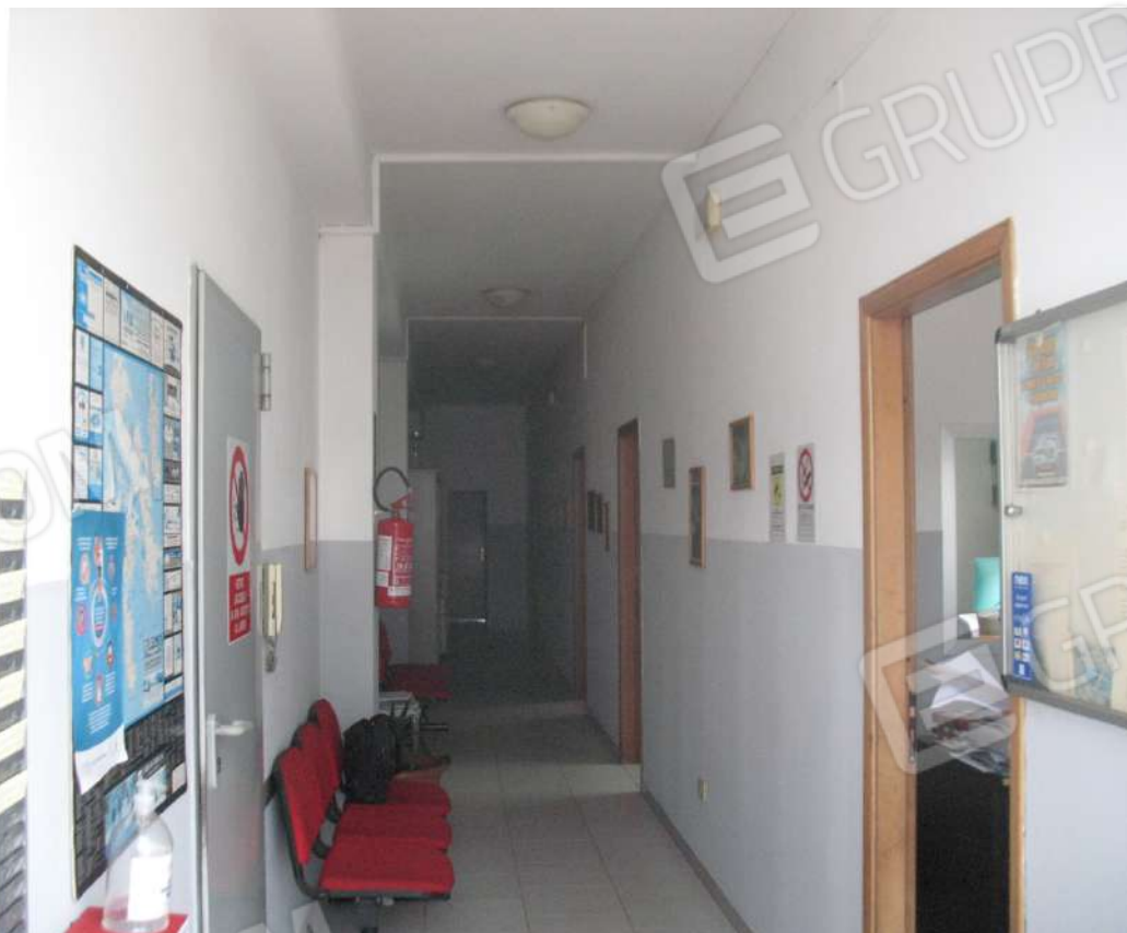
Foto 10 - Corpo uffici e servizi (B) piano terra: Ingresso-disimpegno