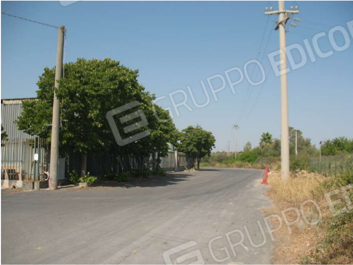
Foto 1 - Vista Confine Nord del lotto di terreno parte integrante del compendio oggetto di stima