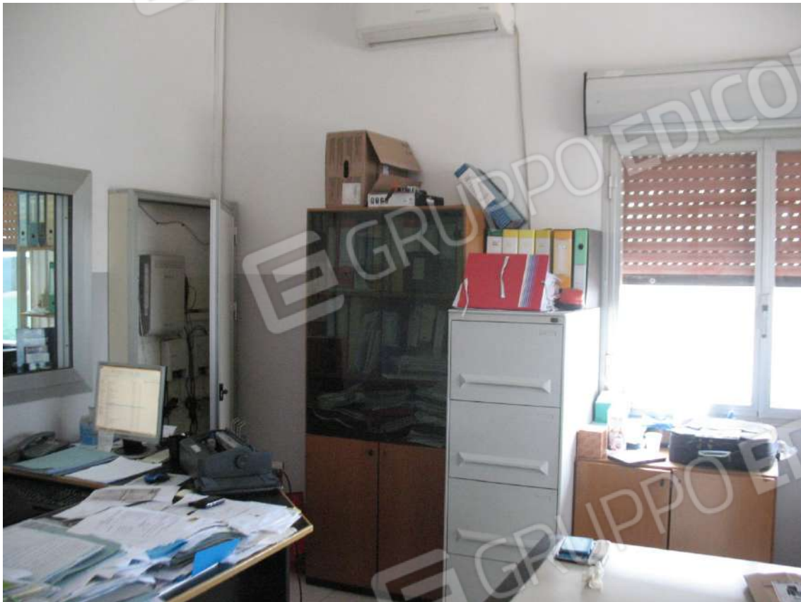
Foto 11 - Corpo uffici e servizi (B) piano terra (Sub 4) : Ufficio 1