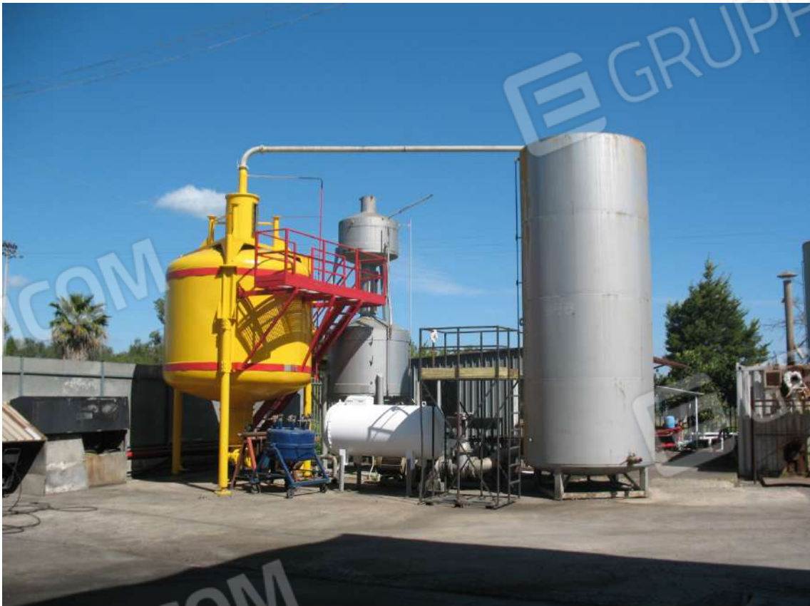
Foto 28 - Stazione metrologica (C): Serbatoi campione per la gestione metrologica