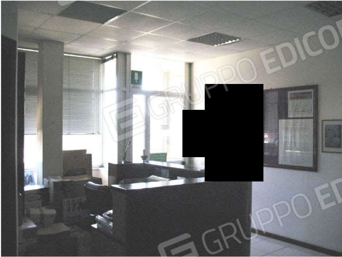
Foto 17 - Corpo uffici e servizi (B) piano primo (Sub 3): Ingresso - Reception