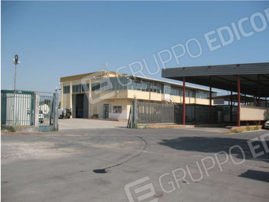
Foto 3 - Accesso carrabile e pedonale insistente sul lato Est dell'area recintata del compendio oggetto di stima