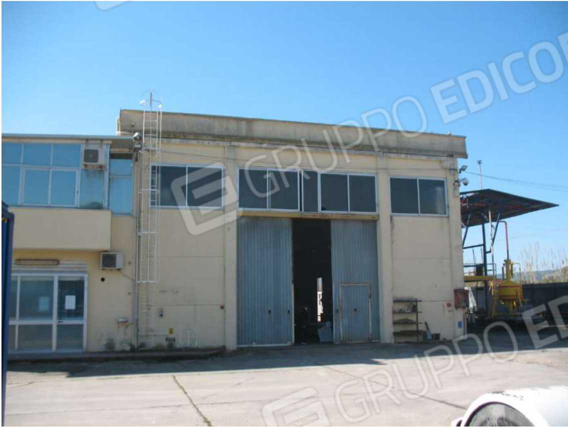
Foto 5 - Prospetto Nord: Capannone (A) + Corpo uffici e servizi (B)