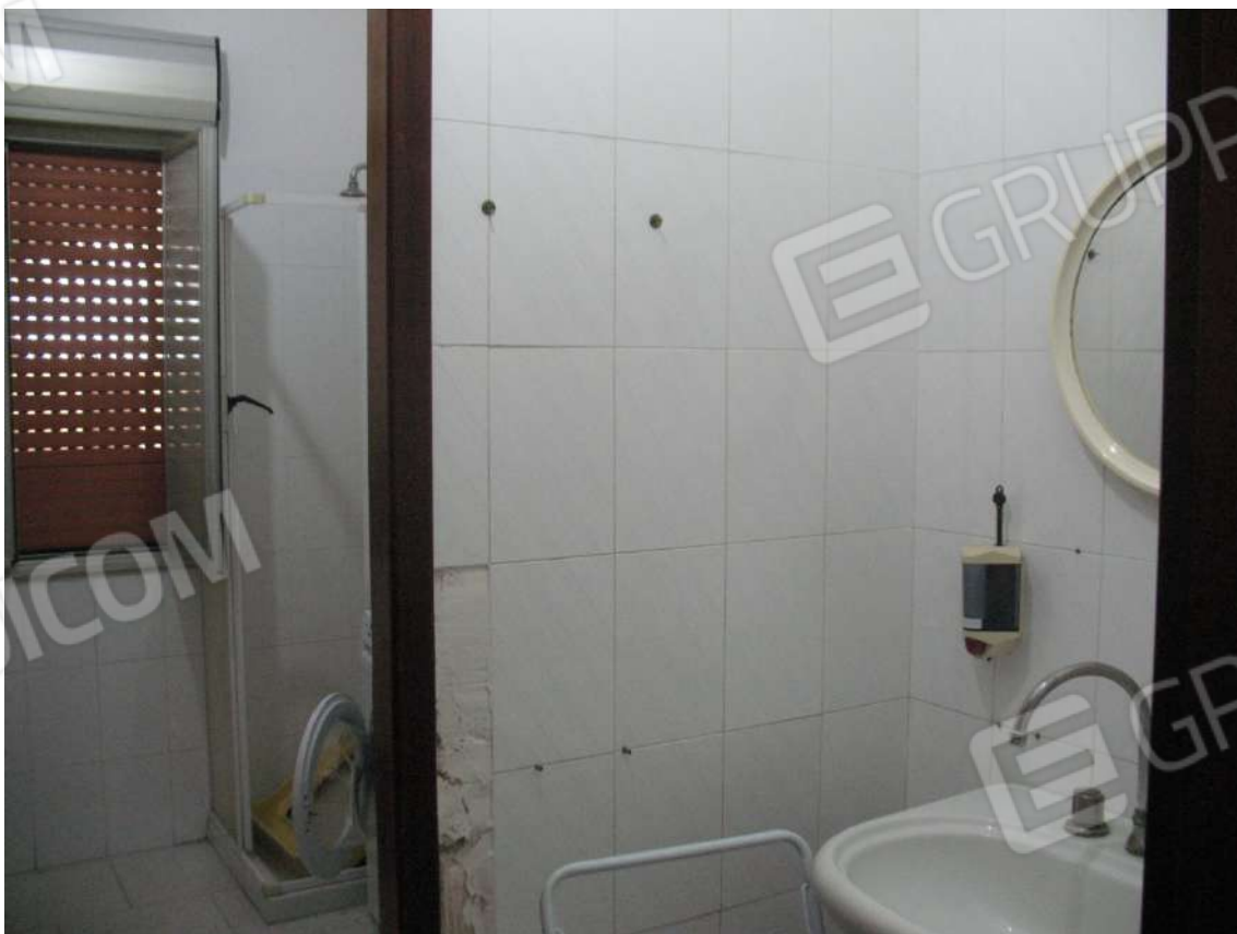
Foto 16 - Corpo uffici e servizi (B) piano terra (Sub 5): Antibagno + Bagno