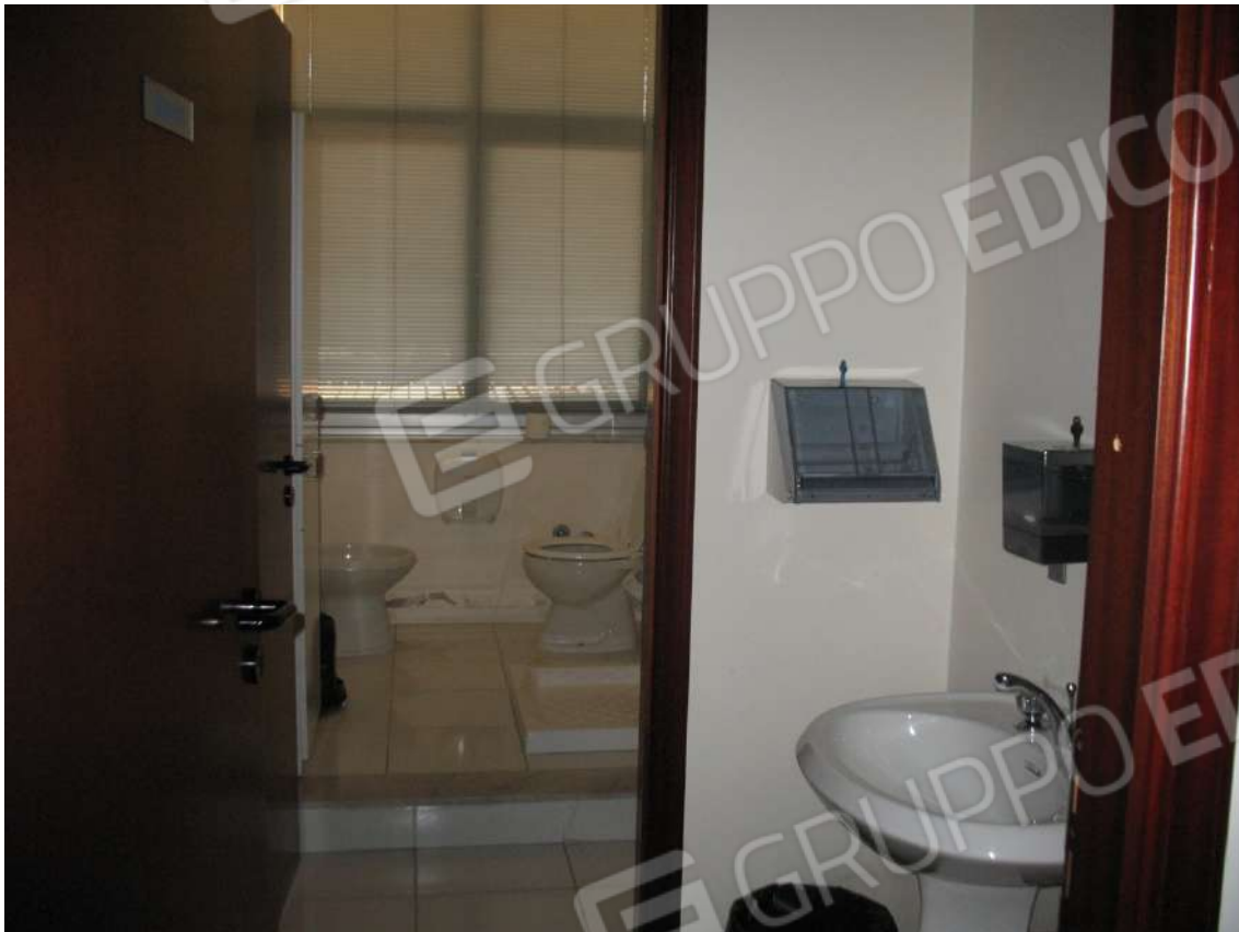
Foto 23 - Corpo uffici e servizi (B) piano primo (Sub 3): Antibagno + Bagno donne