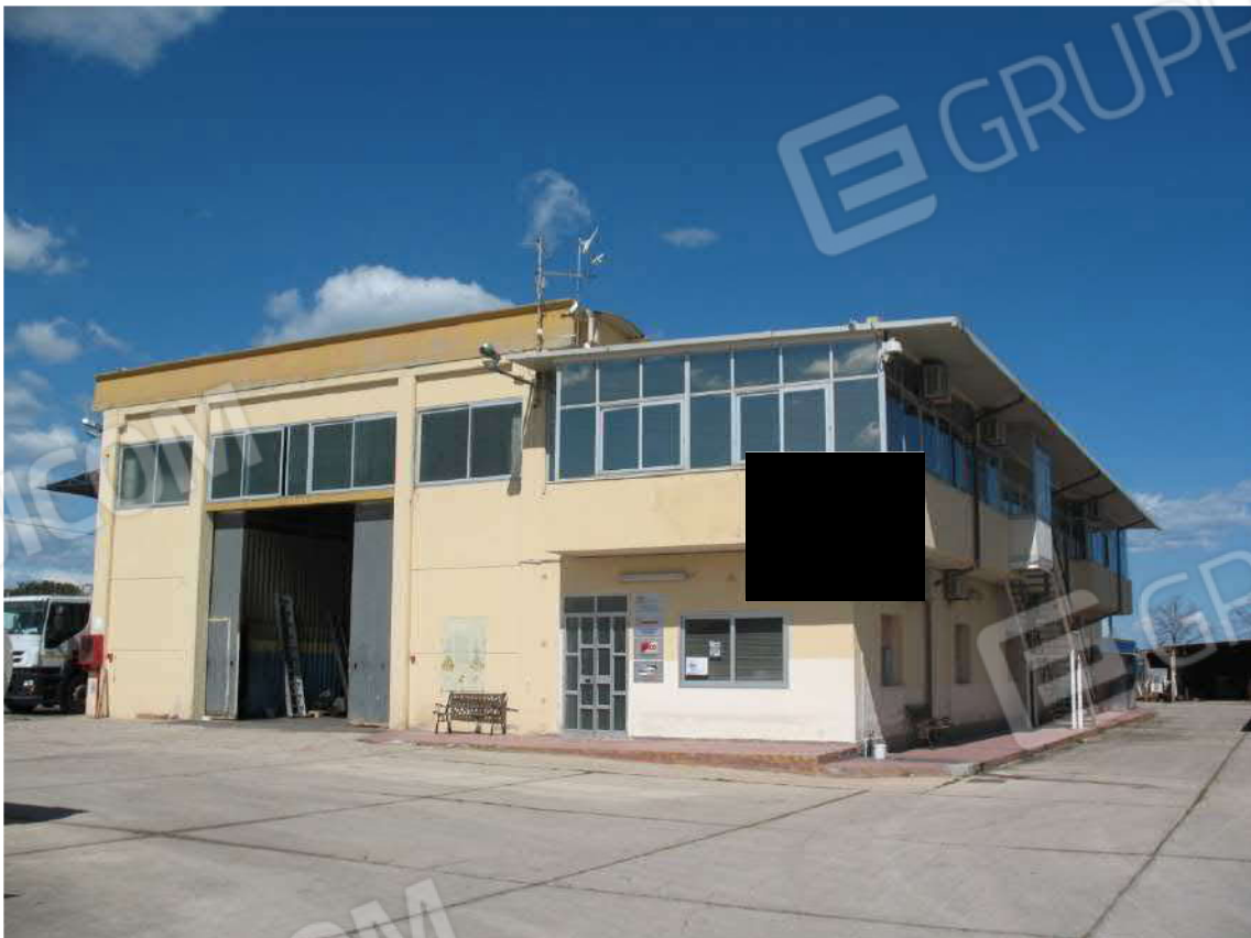
Foto 4 - Prospetto Sud: Capannone (A) + Corpo uffici e servizi (B)