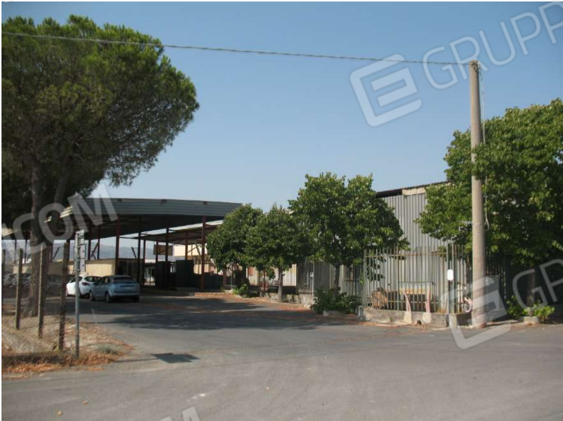
Foto 2 - Varco di accesso alla strada privata interna al lotto di terreno parte integrante del compendio oggetto di stima