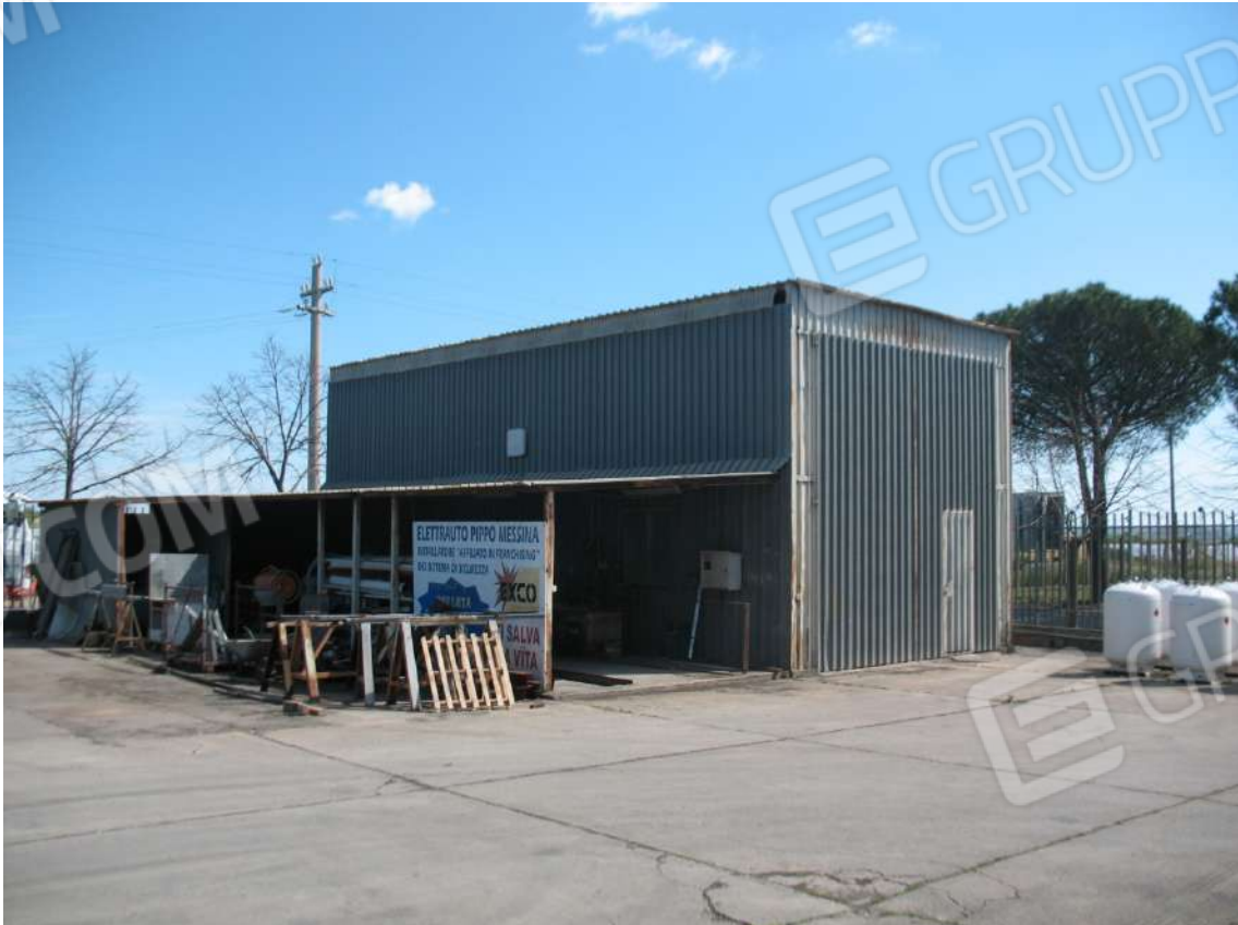
Foto 34 - Magazzino (G2) + Tettoia (H) (Officina meccanica all'aperto)