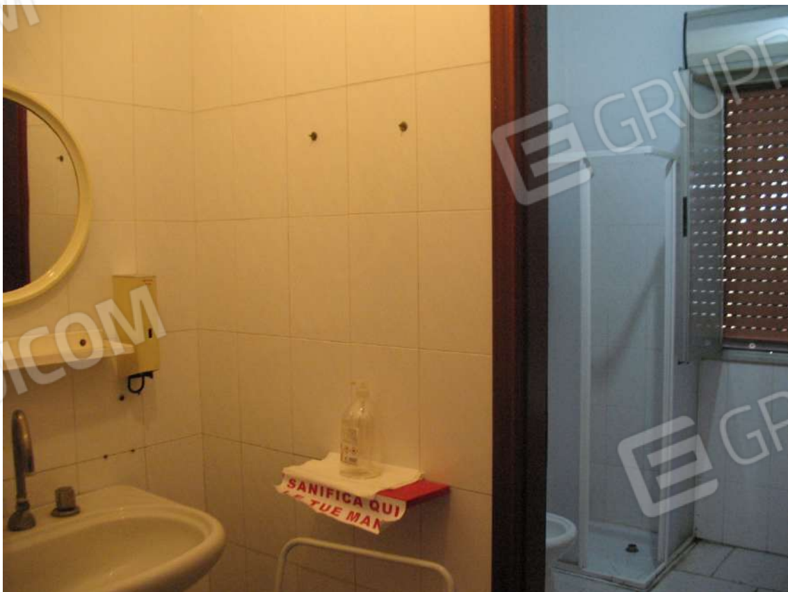
Foto 14 - Corpo uffici e servizi (B) piano terra (Sub 4): Antibagno + Bagno