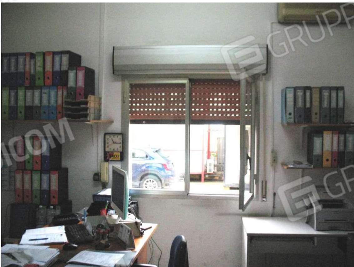
Foto 12 - Corpo uffici e servizi (B) piano terra (Sub 4): Ufficio 2