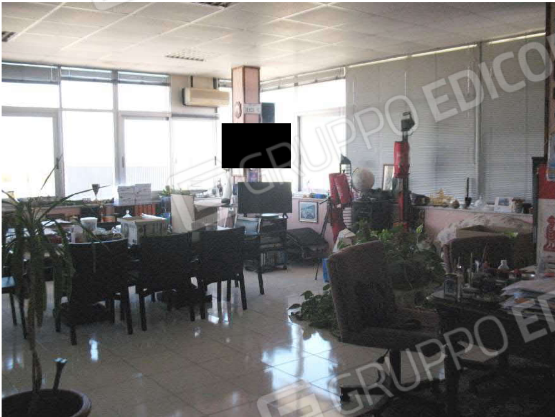
Foto 25 - Corpo uffici e servizi (B) piano primo (Sub 3): Sala riunione