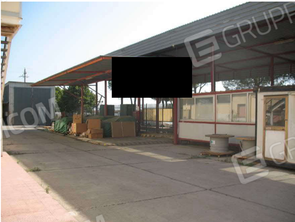
Foto 30 - Stazione revisione veicoli pesanti (D): In evidenza zona revisione veicoli inferiori a 35 tonnellate + cabina operatore