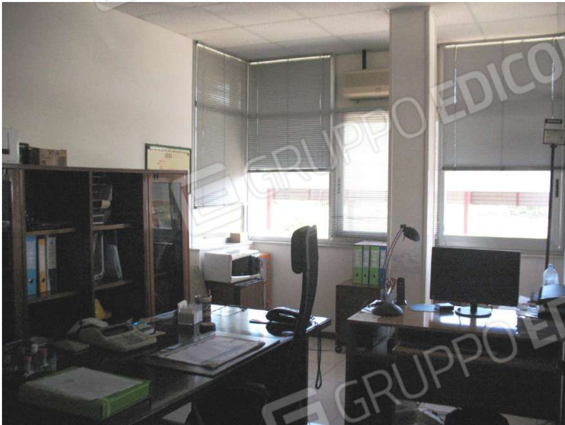
Foto 19 - Corpo uffici e servizi (B) piano primo (Sub 3): Ufficio 2