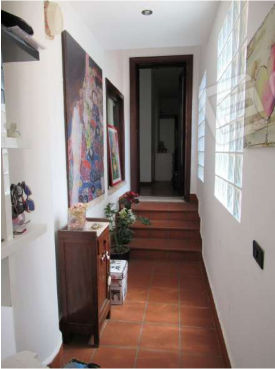
Foto 39_ Corridoio