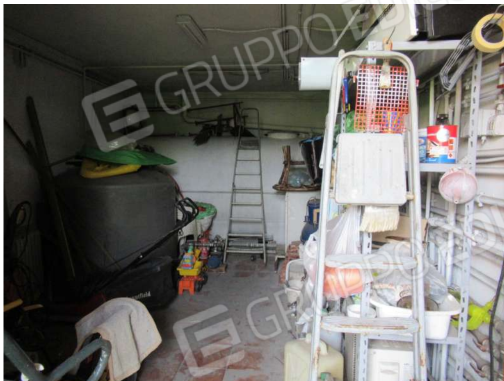
Foto 24_ Locale Caldaia