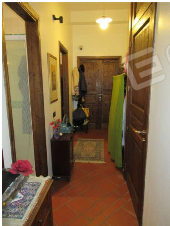
Foto 20_ Corridoio