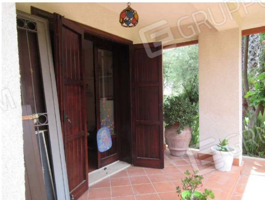
Foto 49_ Veranda