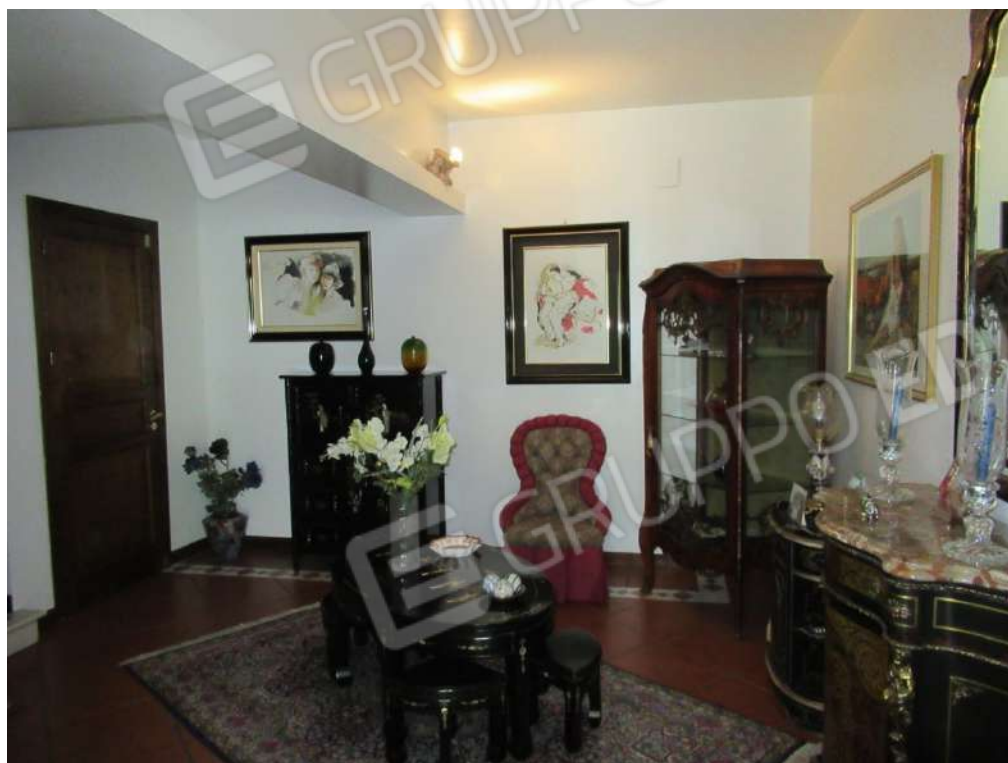
Foto 26_ Ingresso