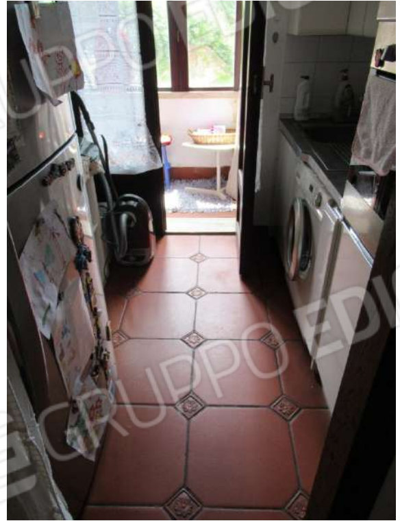
Foto 43_ Lavanderia