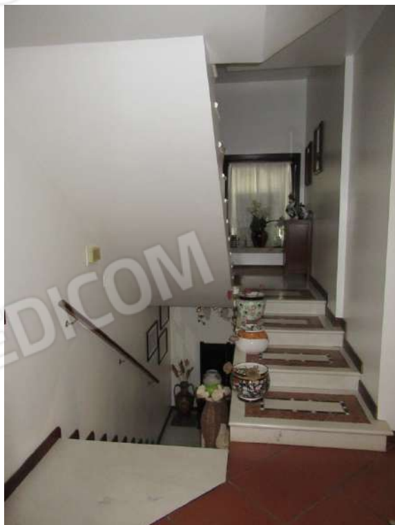
Foto 27_ Vano scala