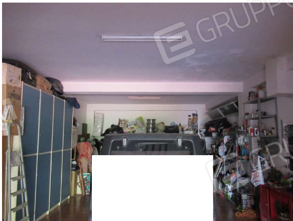
Foto 25_ Garage