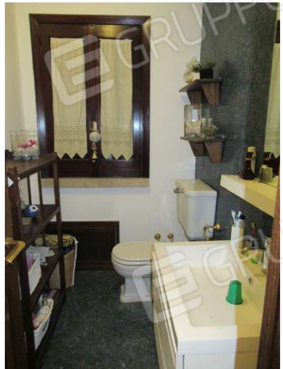
Foto 47_ Bagno