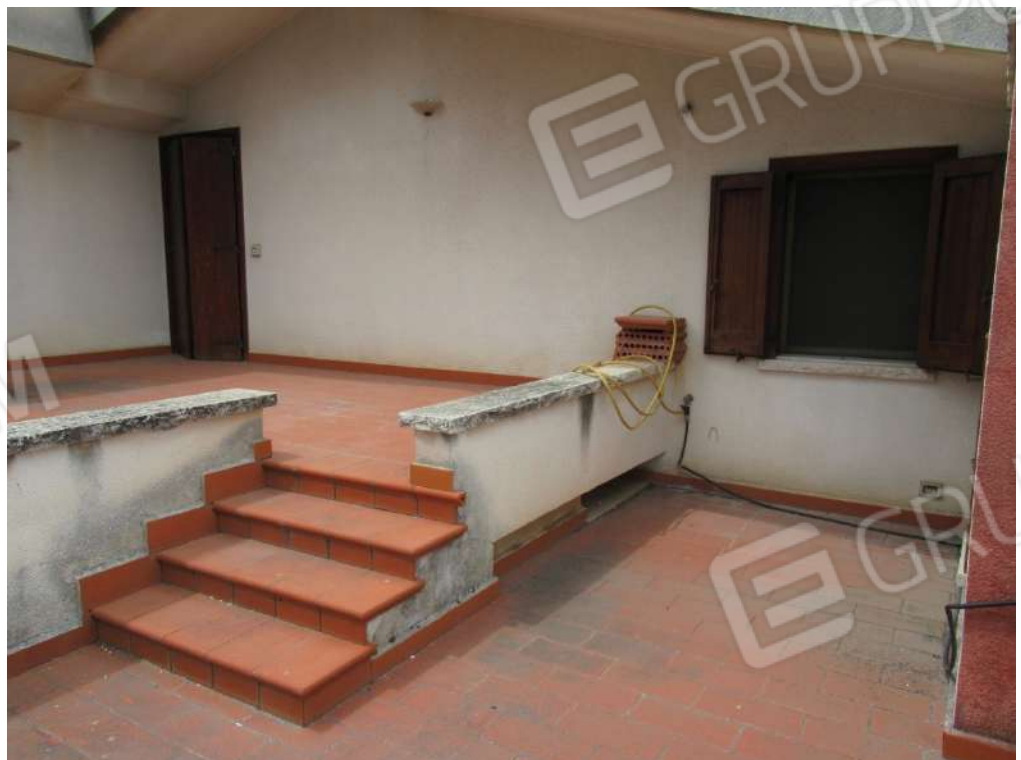
Foto 61_ Terrazzo