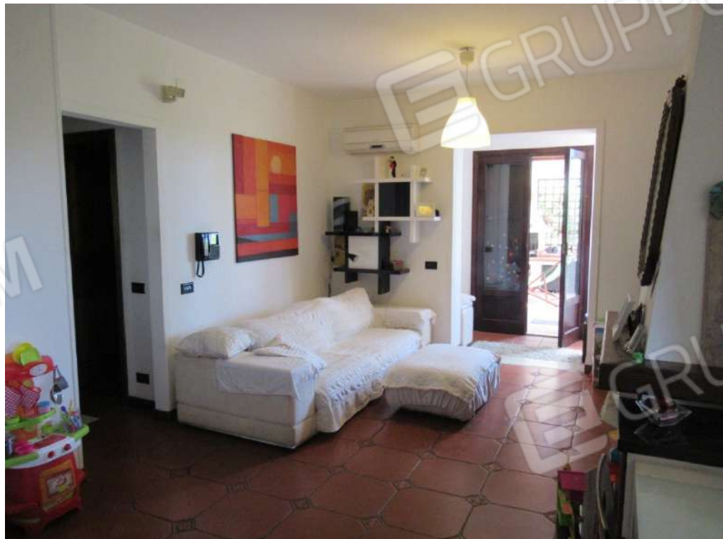
Foto 41_ Salone