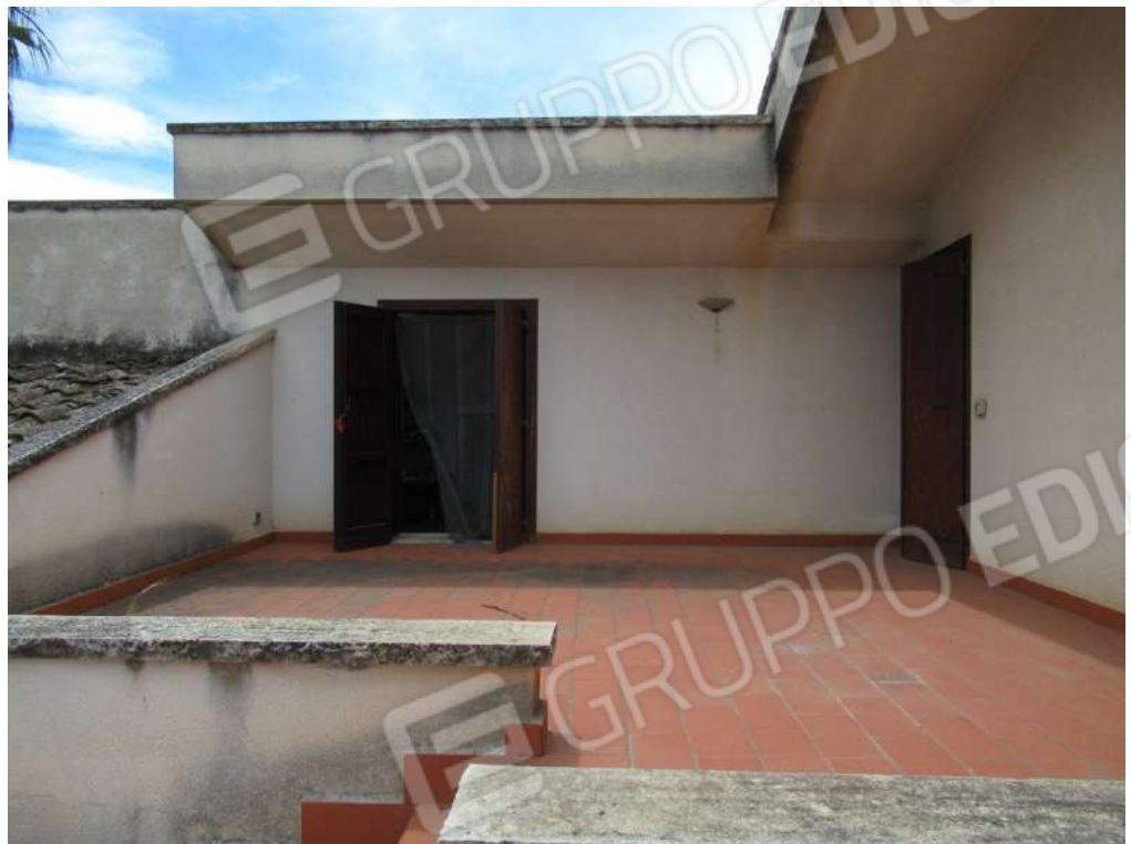
Foto 60_ Terrazzo