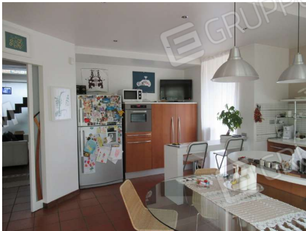
Foto 34_ Cucina/Pranzo