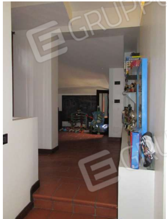
Foto 52_ Corridoio