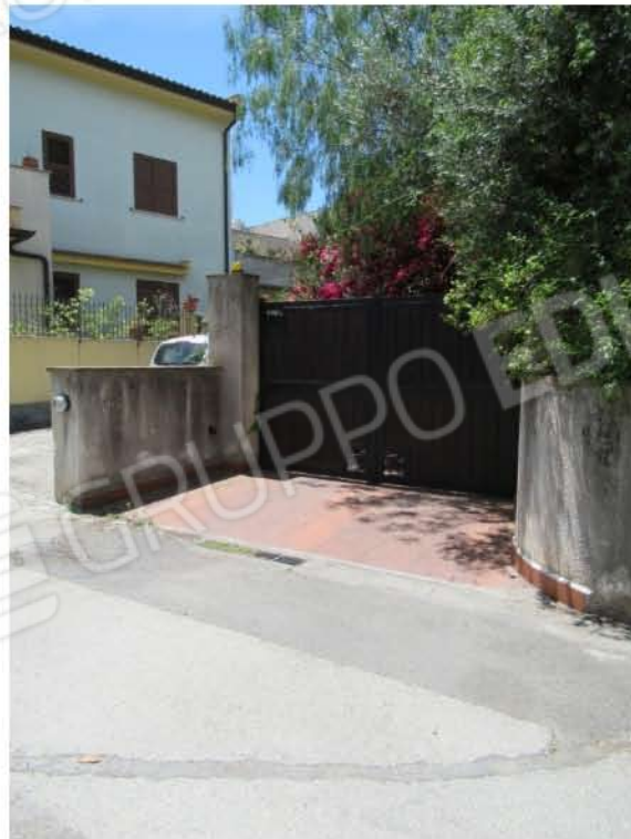
Foto 2_ Accesso carrabile