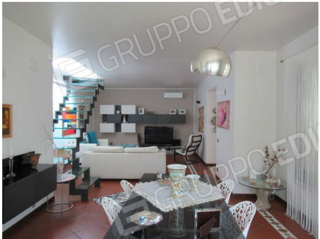
Foto 37_ Salone