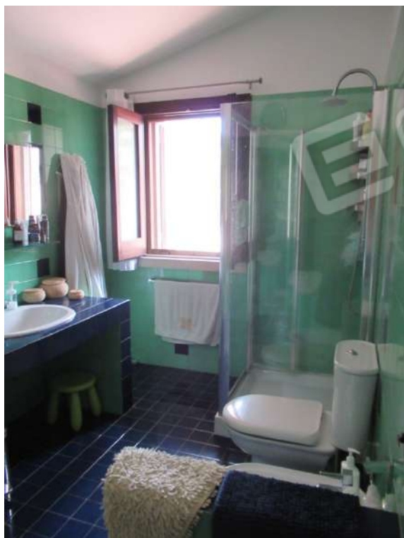
Foto 55_ Bagno