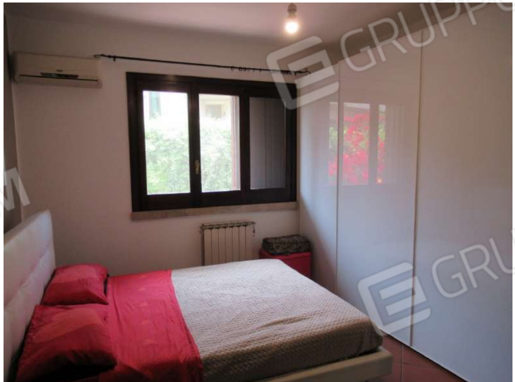
Foto 44_ Camera