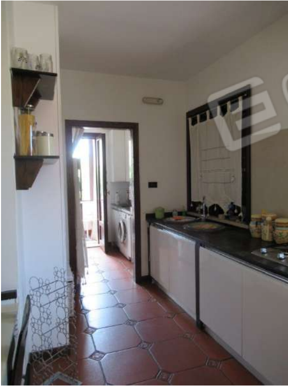
Foto 42_ Cucina