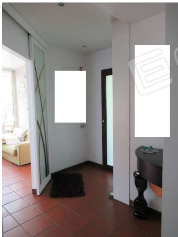
Foto 32_ Corridoio