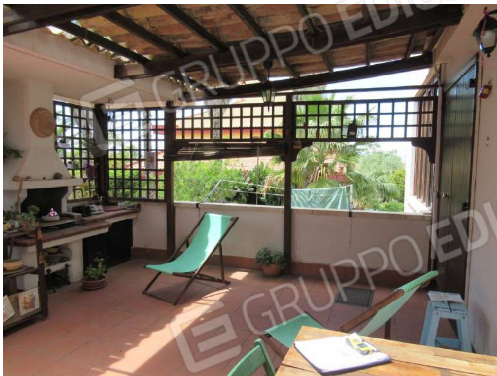
Foto 48_ Terrazza