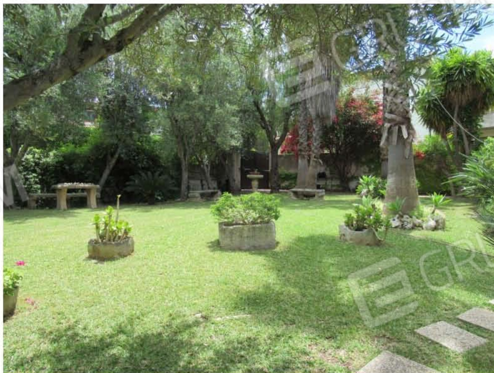
Foto 3_ Area trattata a verde