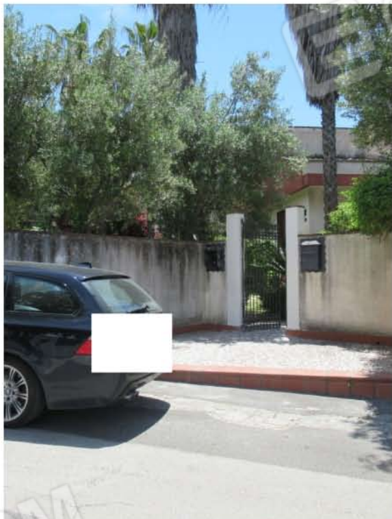
Foto 1_ Accesso pedonale