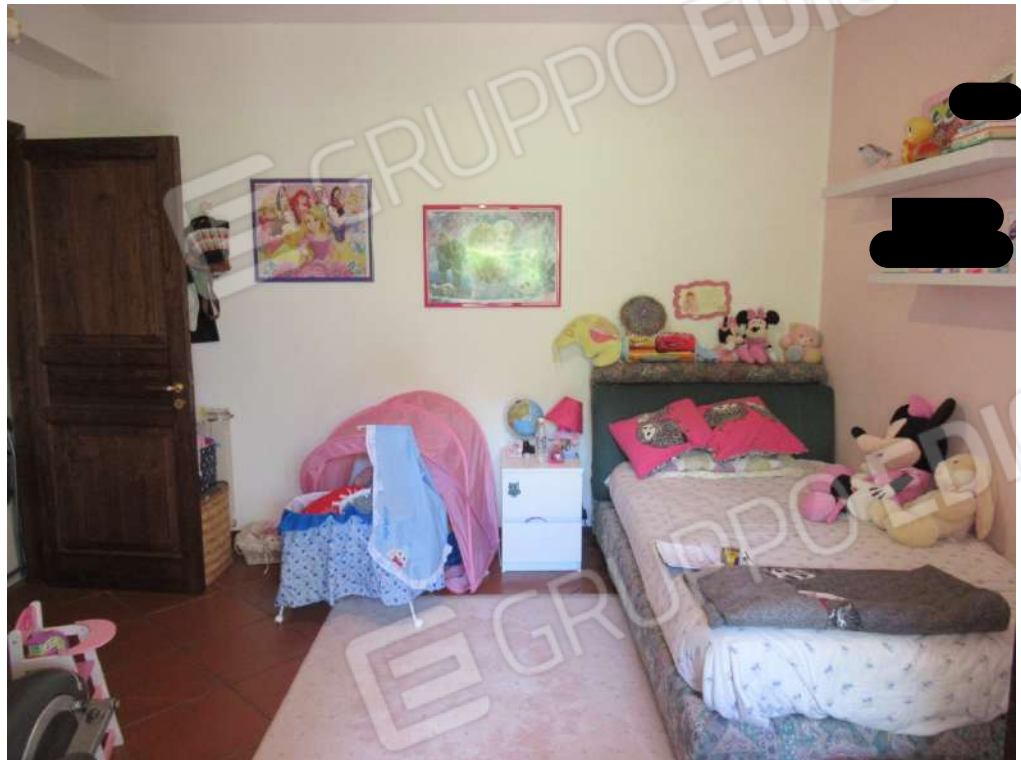
Foto 45_ Camera