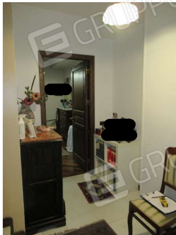
Foto 28_ Disimpegno