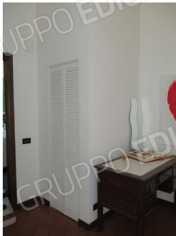
Foto 56_ Corridoio