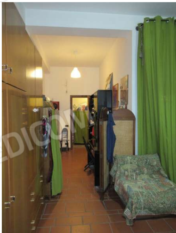
Foto 22_ Lavanderia