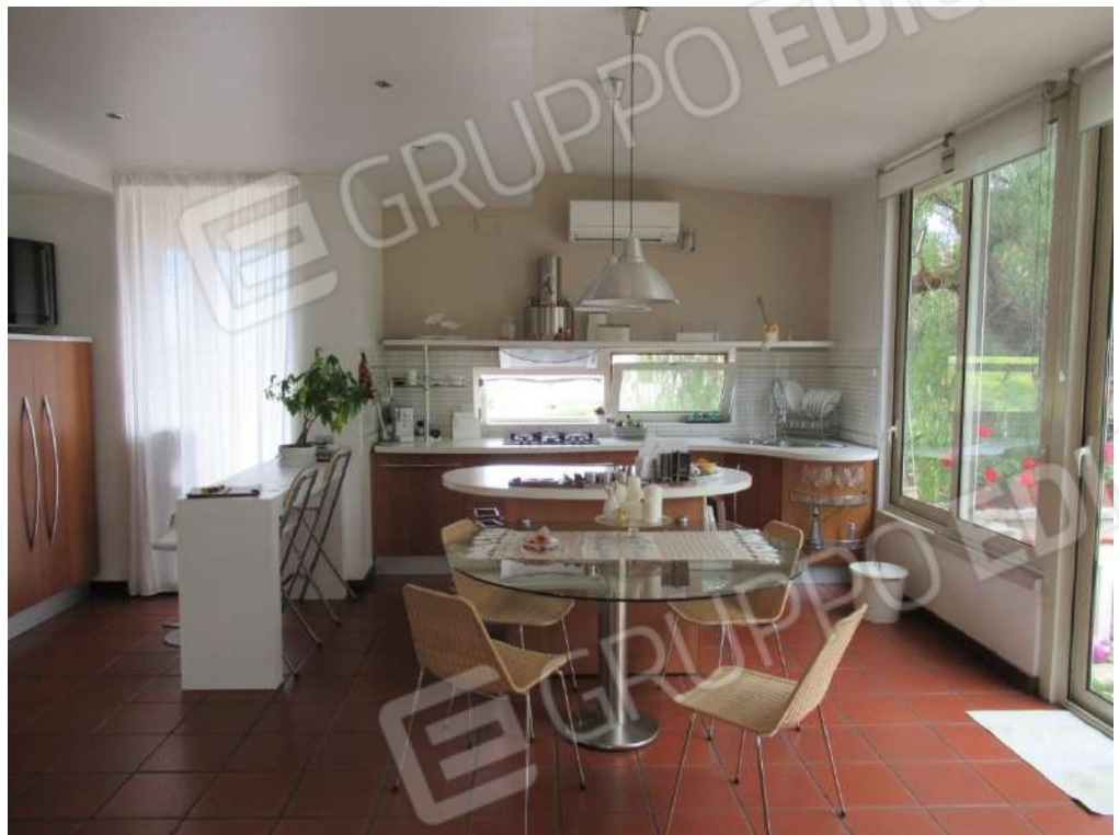
Foto 35_ Cucina/Pranzo