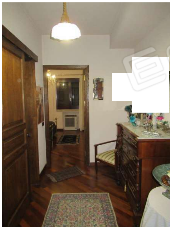
Foto 29_ Corridoio