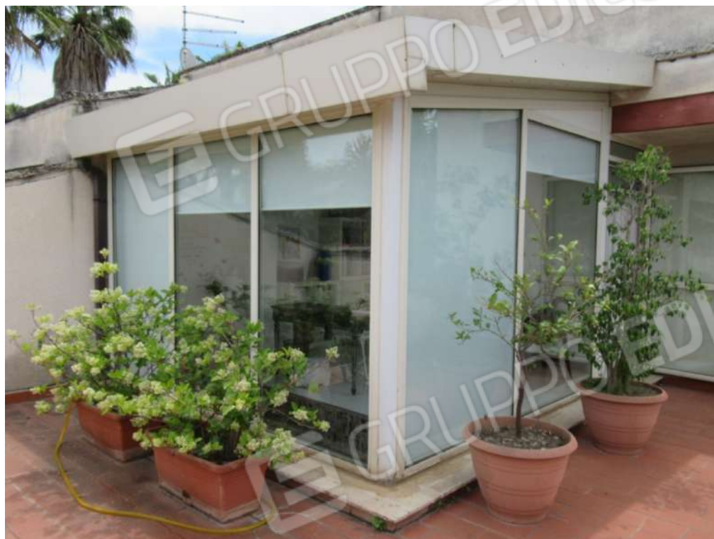
Foto 58_ Terrazzo