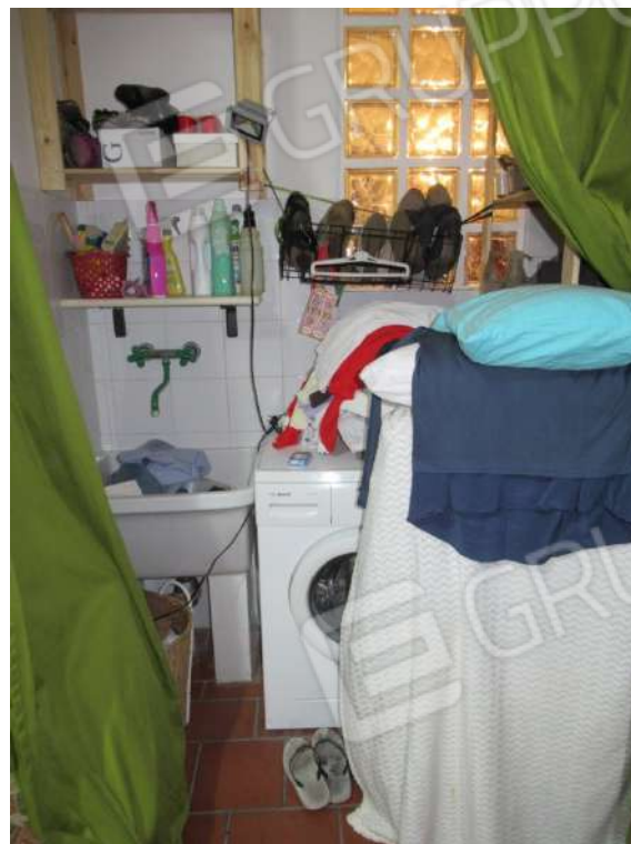
Foto 23_ Lavanderia