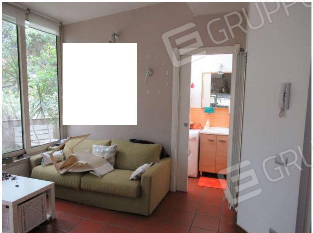
Foto 36_ Cucina/Pranzo