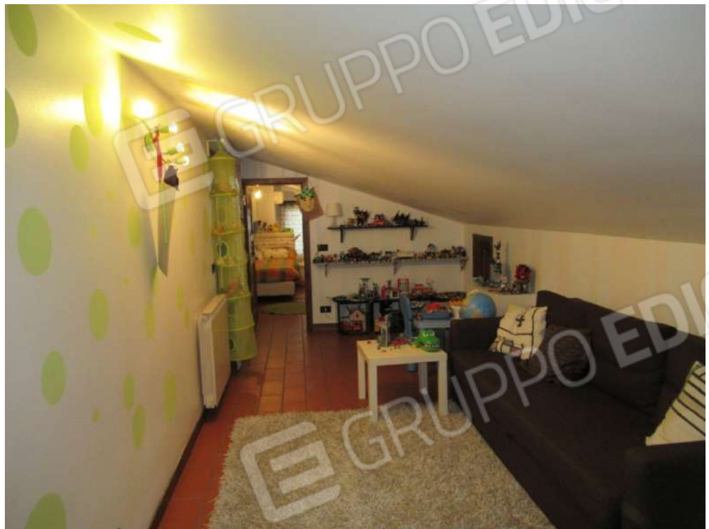
Foto 53_ Camera