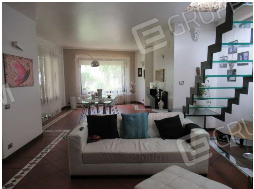
Foto 38_ Salone