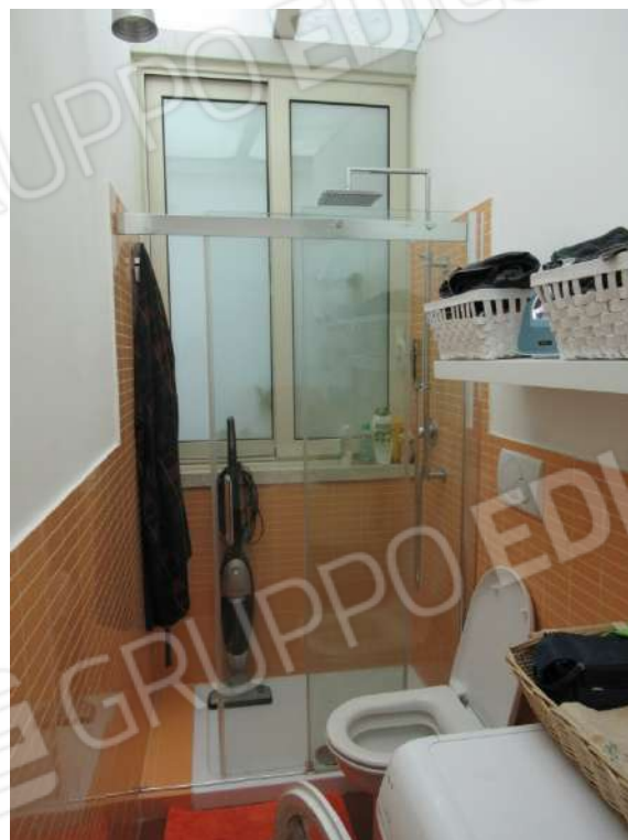
Foto 33_ Bagno