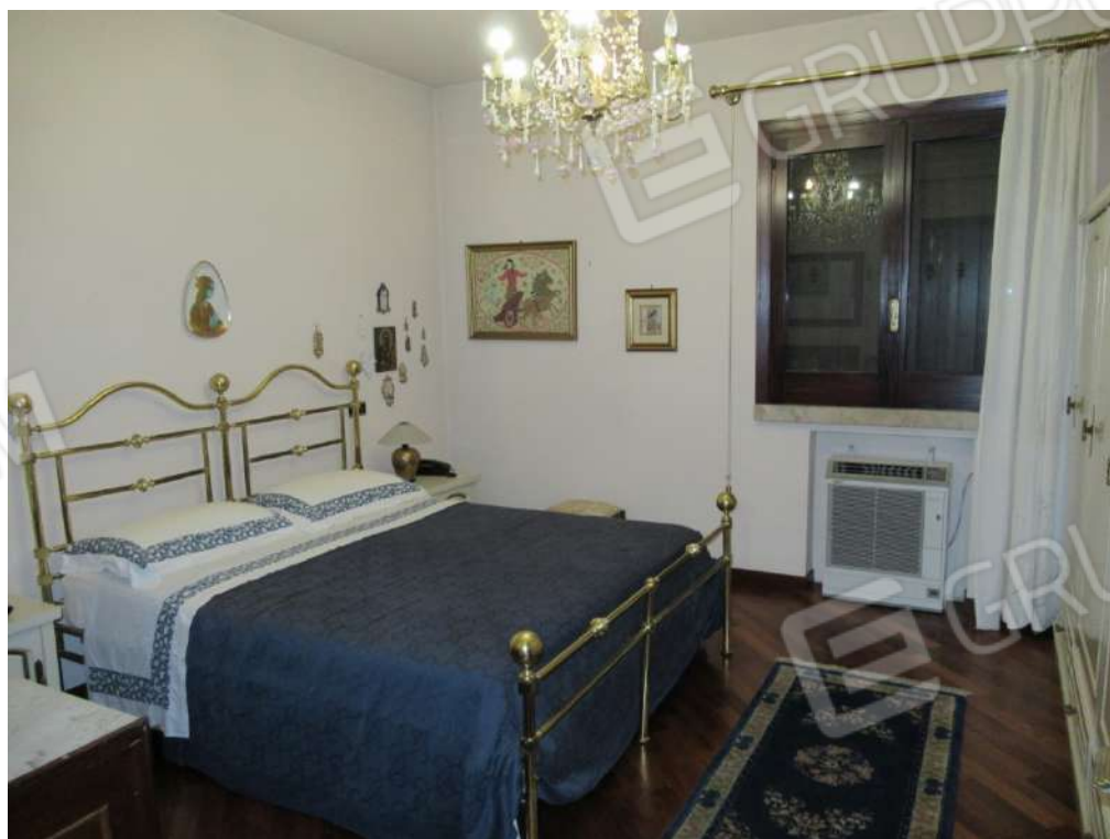
Foto 31_ Camera