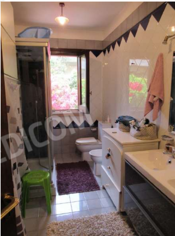
Foto 46_ Bagno