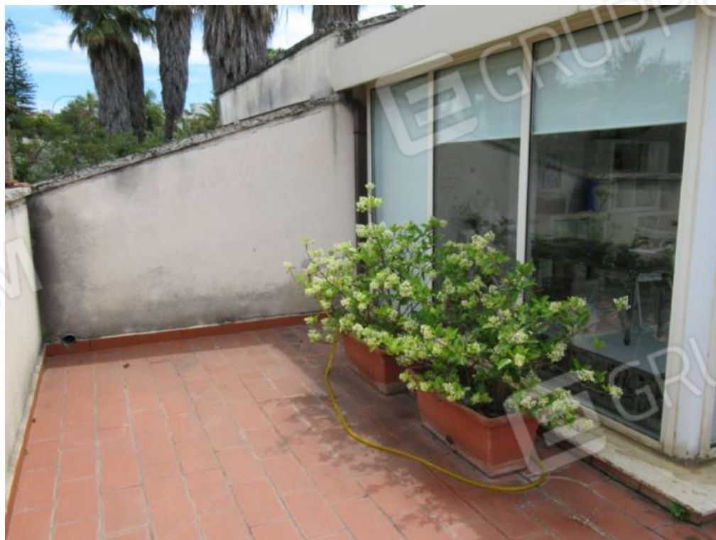
Foto 59_ Terrazzo