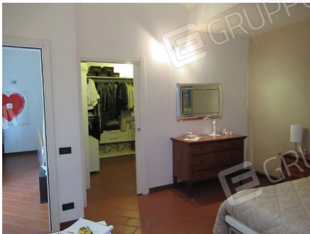
Foto 57_ Camera