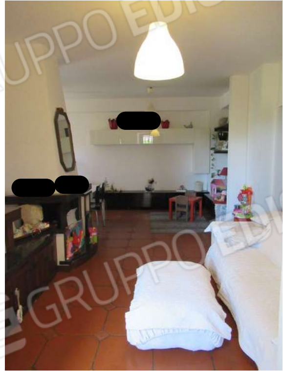
Foto 40_ Salone