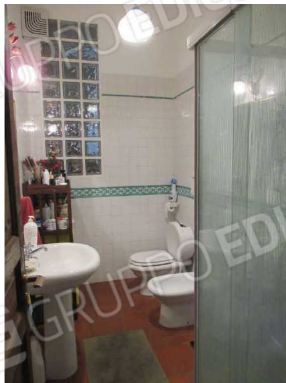
Foto 21_ Bagno