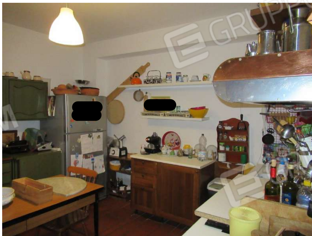
Foto 19_ Cucina-Dispensa