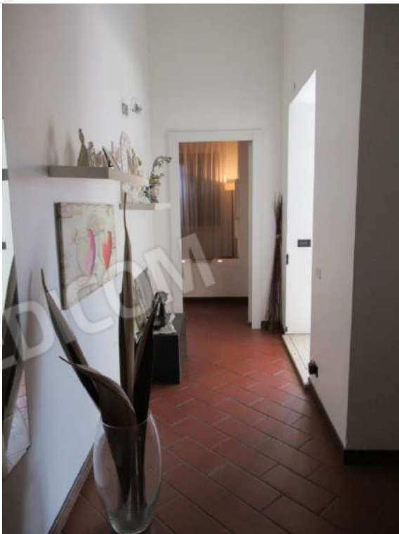
Foto 51_ Corridoio