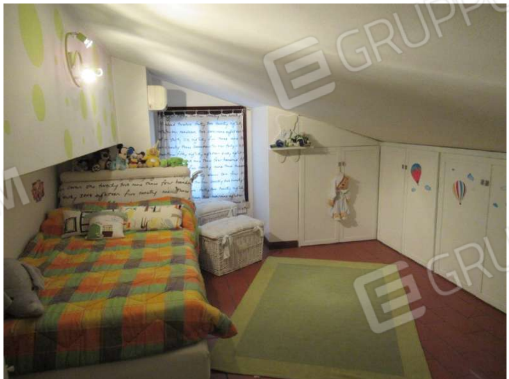
Foto 54_ Camera