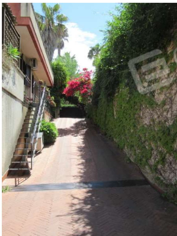
Foto 11_ Vista Sud - rampa carrabile