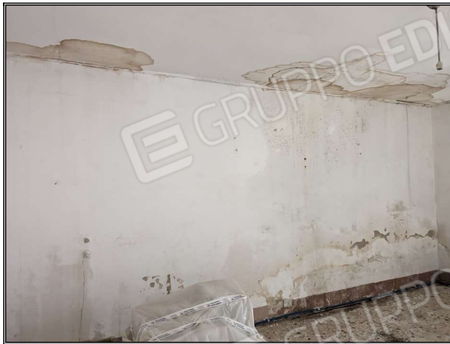
Foto n° 8 – Particolare infiltrazione d'acqua nel controsoffitto e umidità nella parete