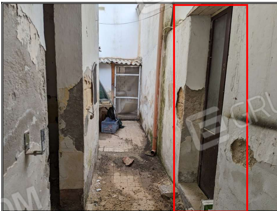
Foto n° 19 – Cortile interno con particolare porta comunicante con proprietà contermina