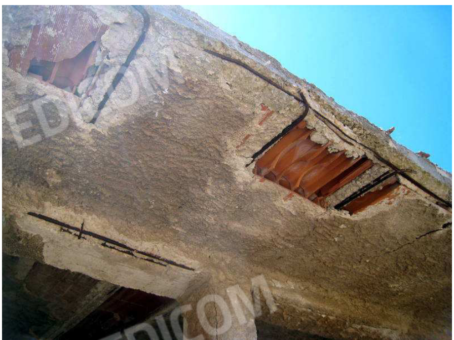
Foto n. 10. La struttura in c.a. è danneggiata in più punti, il calcestruzzo copri ferro è scalzato, le barre di armatura fortemente ossidate e con una significativa riduzione della sezione reagente.