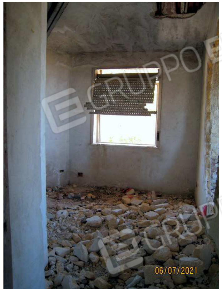
Foto n. 24. La camera da letto anch'essa con il divisore