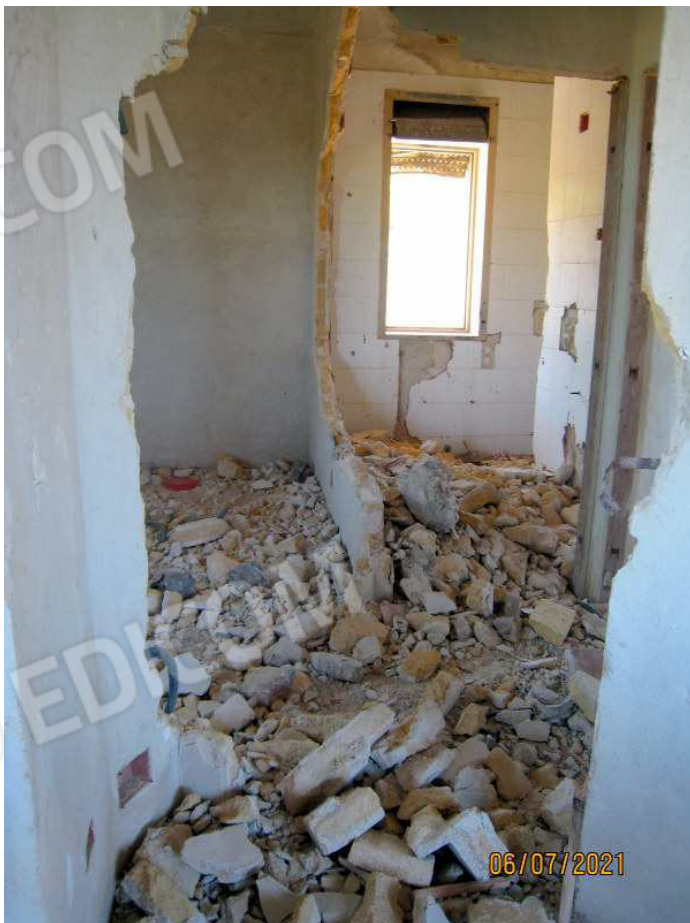
Foto n. 23. Sullo sfondo quello che rimane del bagno. abbattuto.