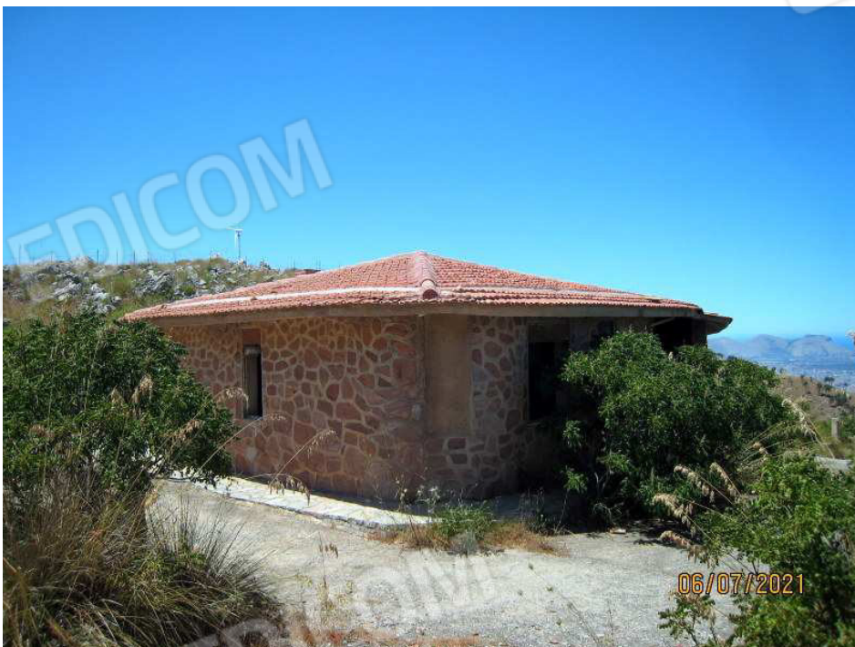
Foto n. 15. Prospetti Sud ed Est.