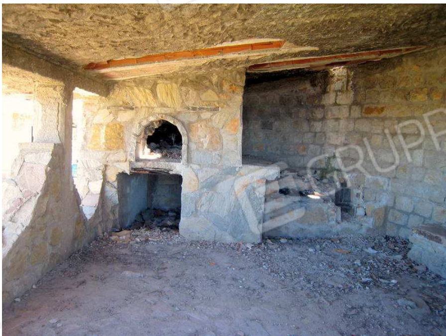
Foto n. 8. L'interno della tavernetta. Tutte le pareti sono rivestite in pietra di vario tipo. Porzione del solaio sopra la "bocca" del forno è "scoppiato".