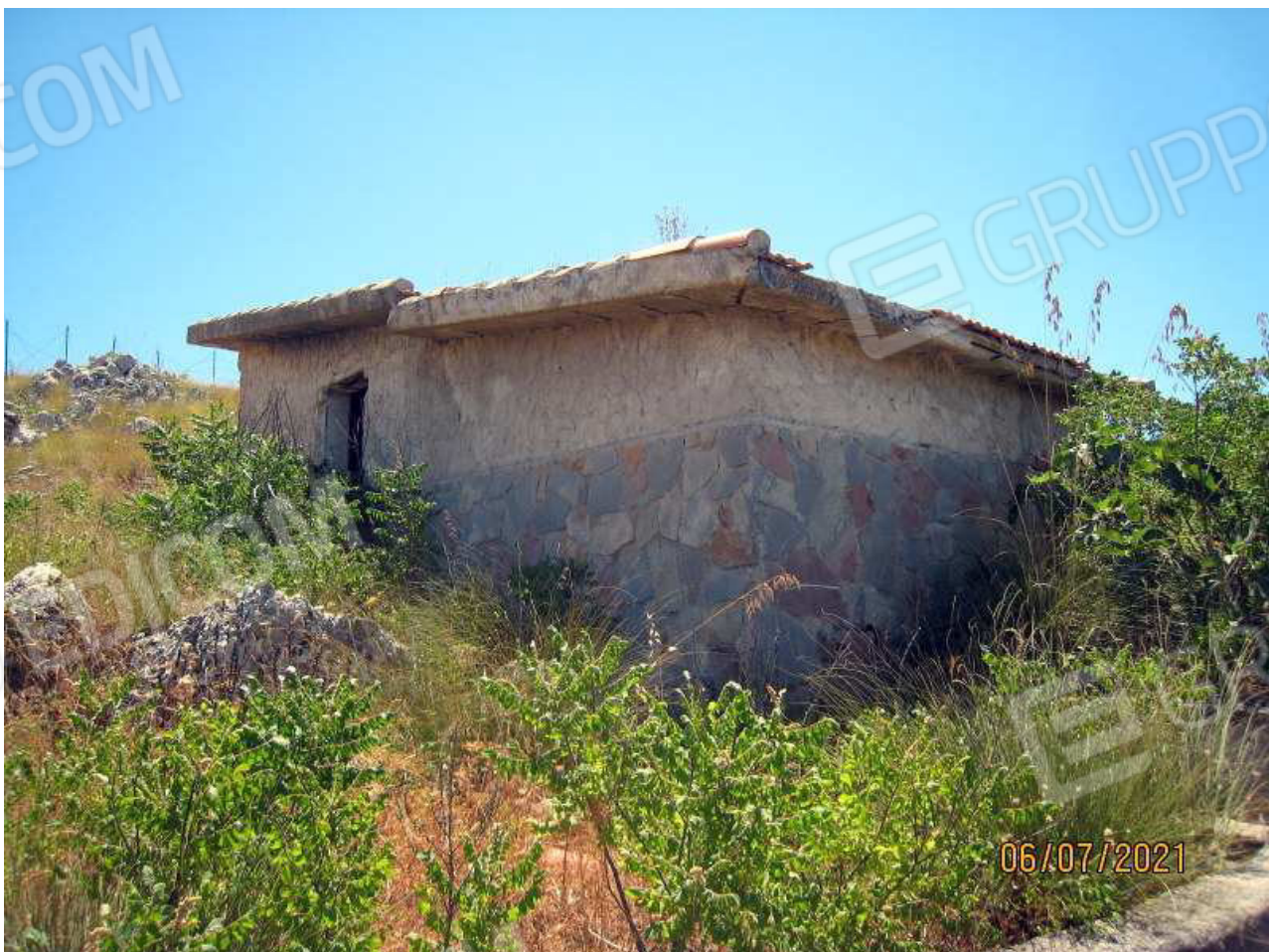
Foto n. 32. In primo piano la vasca di riserva idrica, a seguire il magazzino.