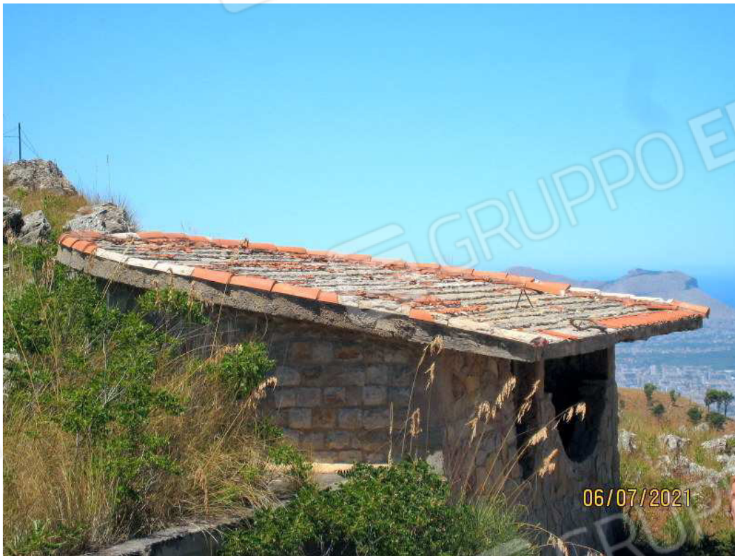
Foto n. 11. Sul tetto sono rimaste poche tegole e non vi è guaina di protezione contro le infiltrazioni.