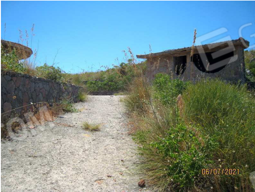
Foto n. 6. La tavernetta con il forno.