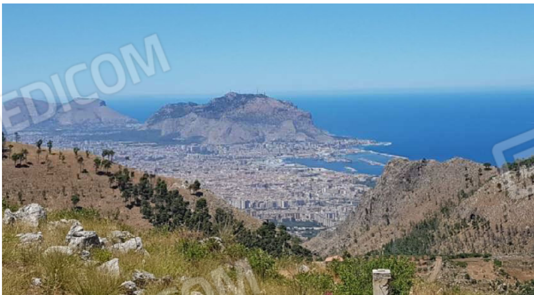
Foto n. 37. Panorama che si gode dal lotto di terreno: Palermo ed il suo porto con Monte Pellegrino.