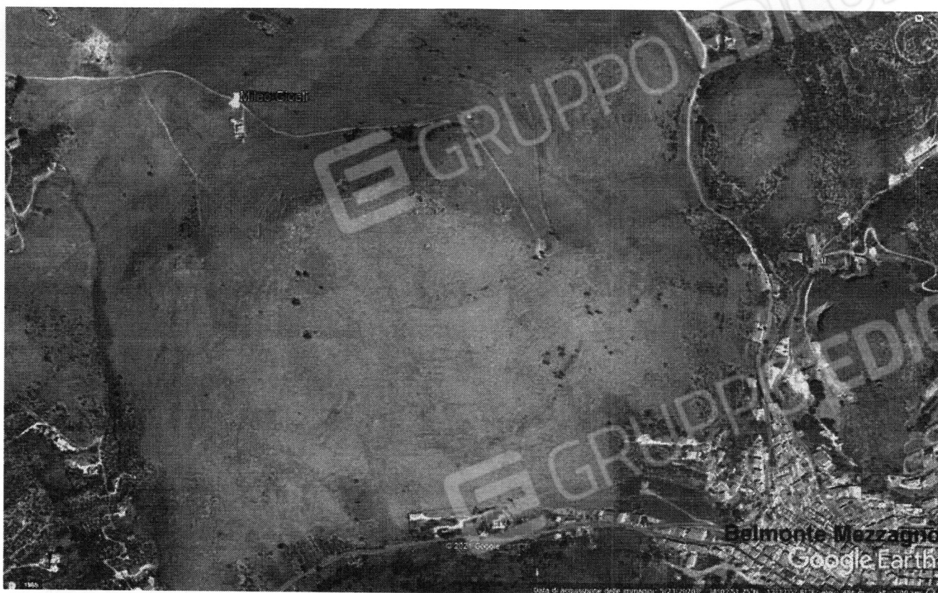
Foto n. 1. Immagine aerea che mostra l'abitato di Belmonte Mezzagno e la posizione dei beni che sono sopra un monte alto circa 760 sul livello del mare.