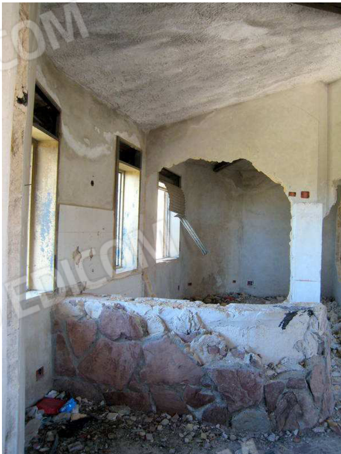
Foto n. 20. Gli interni. La zona cucinino è distrutta.