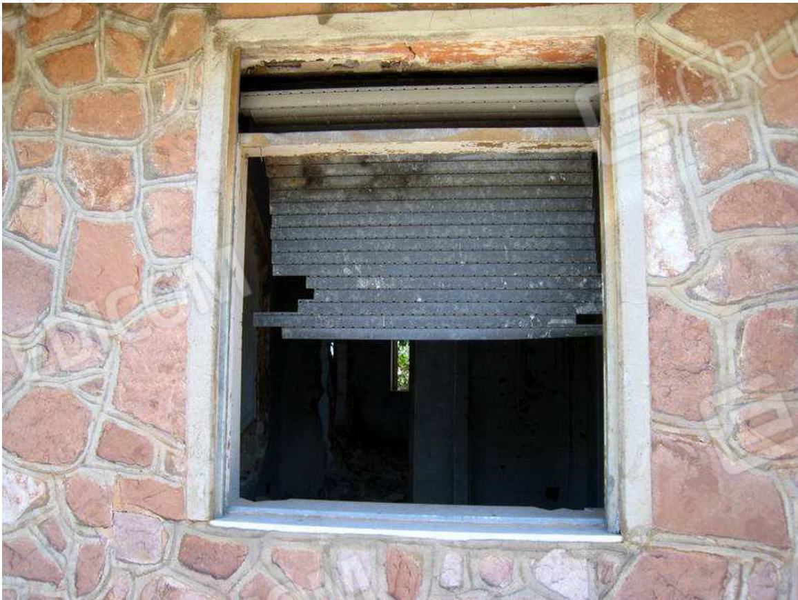
Foto n. 17. Dettaglio di una delle "finestre". Tutte le soglie in marmo sono sbrecciate e/o lesionate.