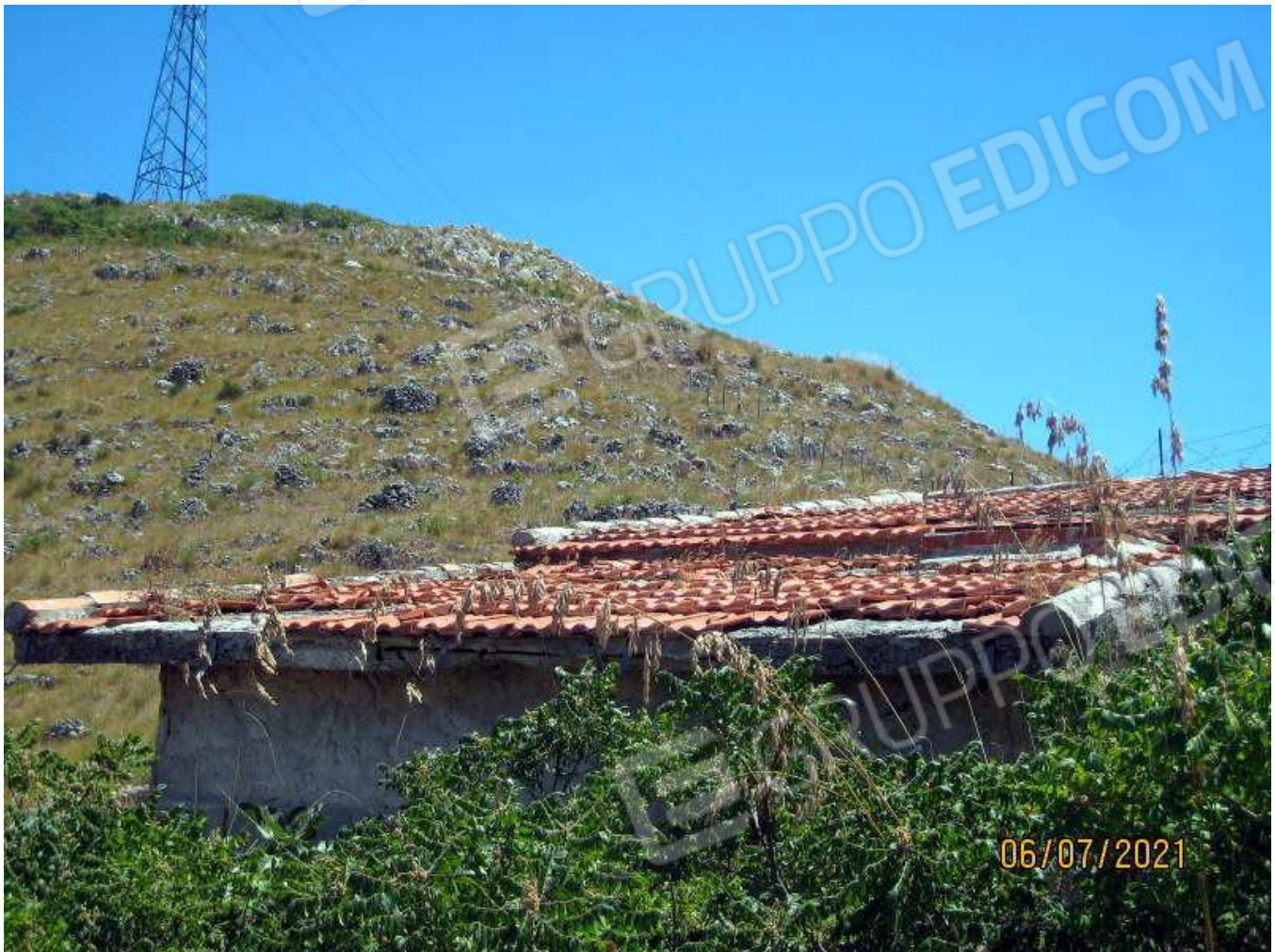
Foto n. 36. Il tetto della vasca idrica e del magazzino manca di molte tegole.