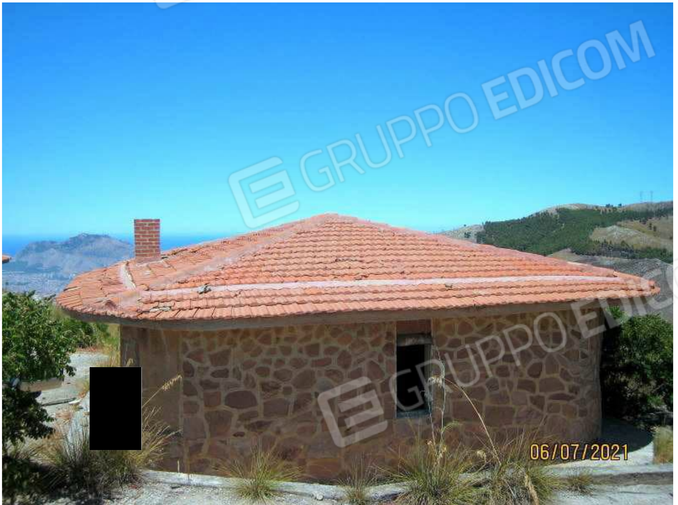
Foto n. 16. Sul tetto mancano parecchie tegole ed altre sono frantumate.