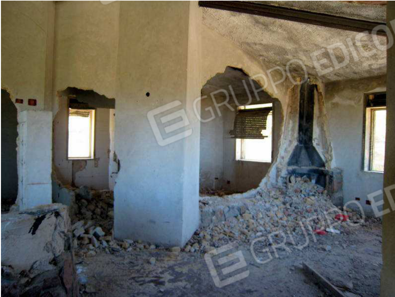
Foto n. 25. Il soggiorno è anch'esso distrutto.