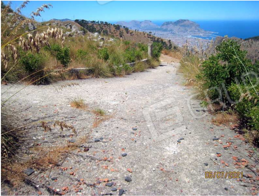
Foto n. 5. La rampa di servizio alla casa