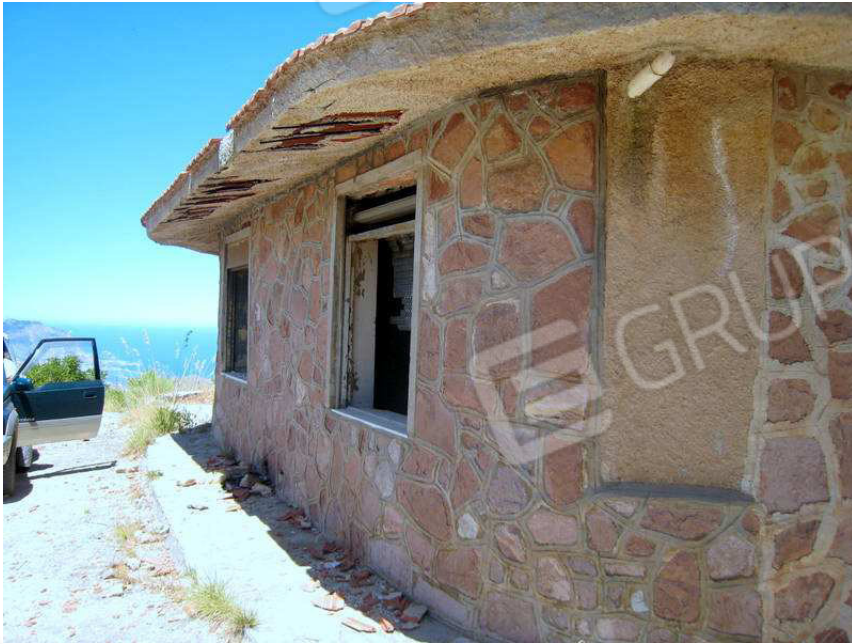
Foto n. 13. Dettaglio del prospetto Ovest.