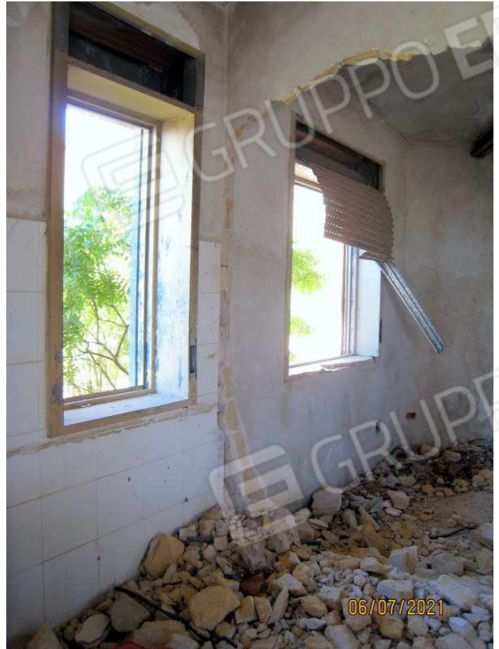
Foto n. 21. Dettaglio delle finestre e di un tramezzo abbattuto.