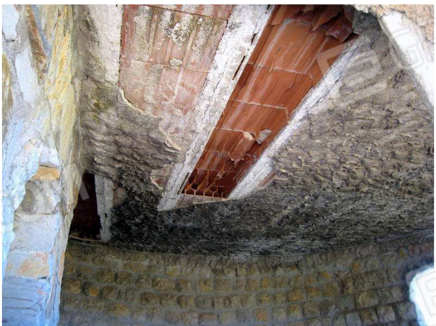
Foto n. 9. A motivo delle infiltrazioni d'acqua meteorica, facilitate dalla mancanza delle tegole sul tetto, il solaio è in cattive condizioni e "scoppiato" in più punti. Gli intonaci, inoltre, sono ammalorati.