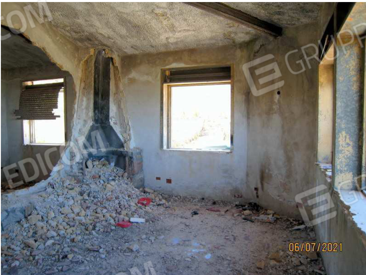
Foto n. 26. Il camino è stato "strappato" dal suo alloggiamento. Umidità e muffe diffuse sulle pareti.