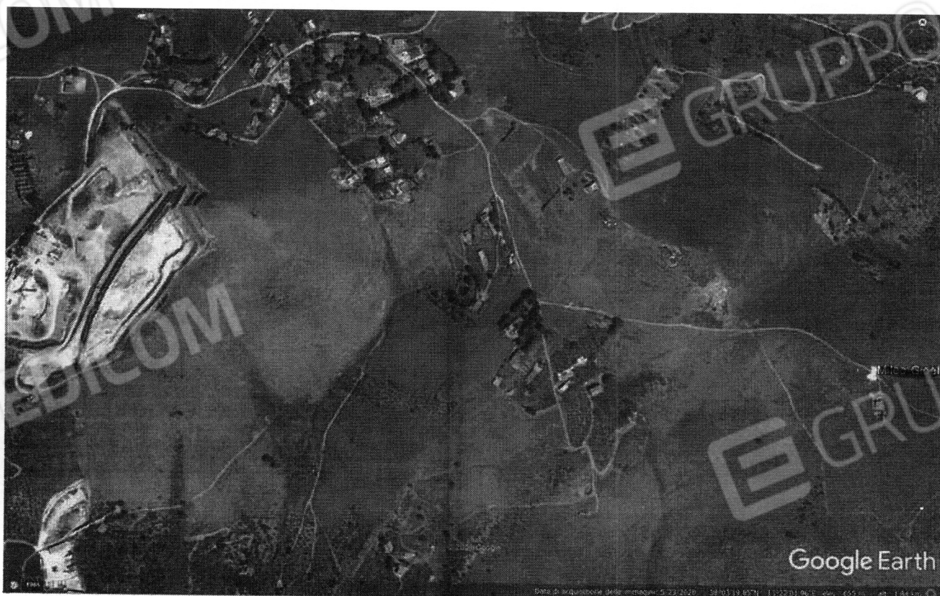
Foto n. 2. Si possono raggiungere percorrendo la strada che porta alla cava di inerti per poi continuare su stradelle sterrate e sconnesse. I beni pignorati sono in una zona brulla, sassosa, desertica, priva di arbusti ed alberi.