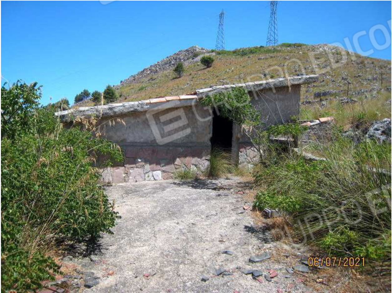
Foto n. 33. L'accesso al magazzino.