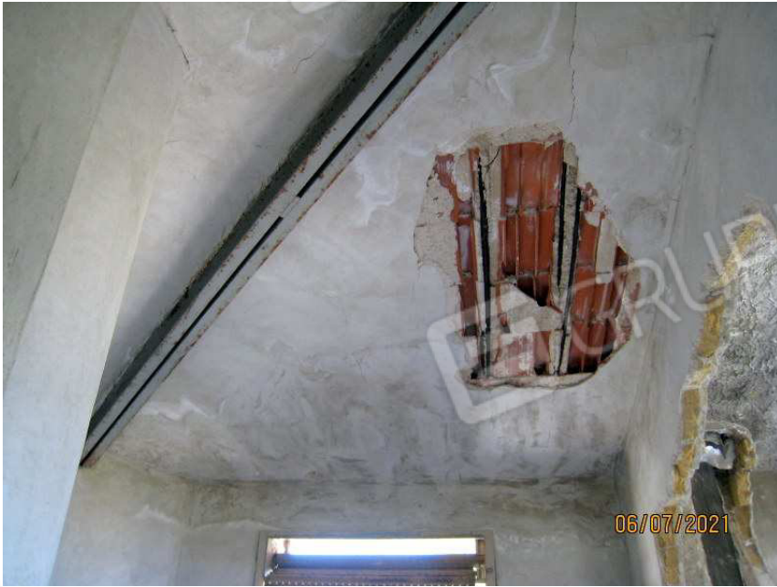
Foto n. 27-29. Tre porzioni del tetto.