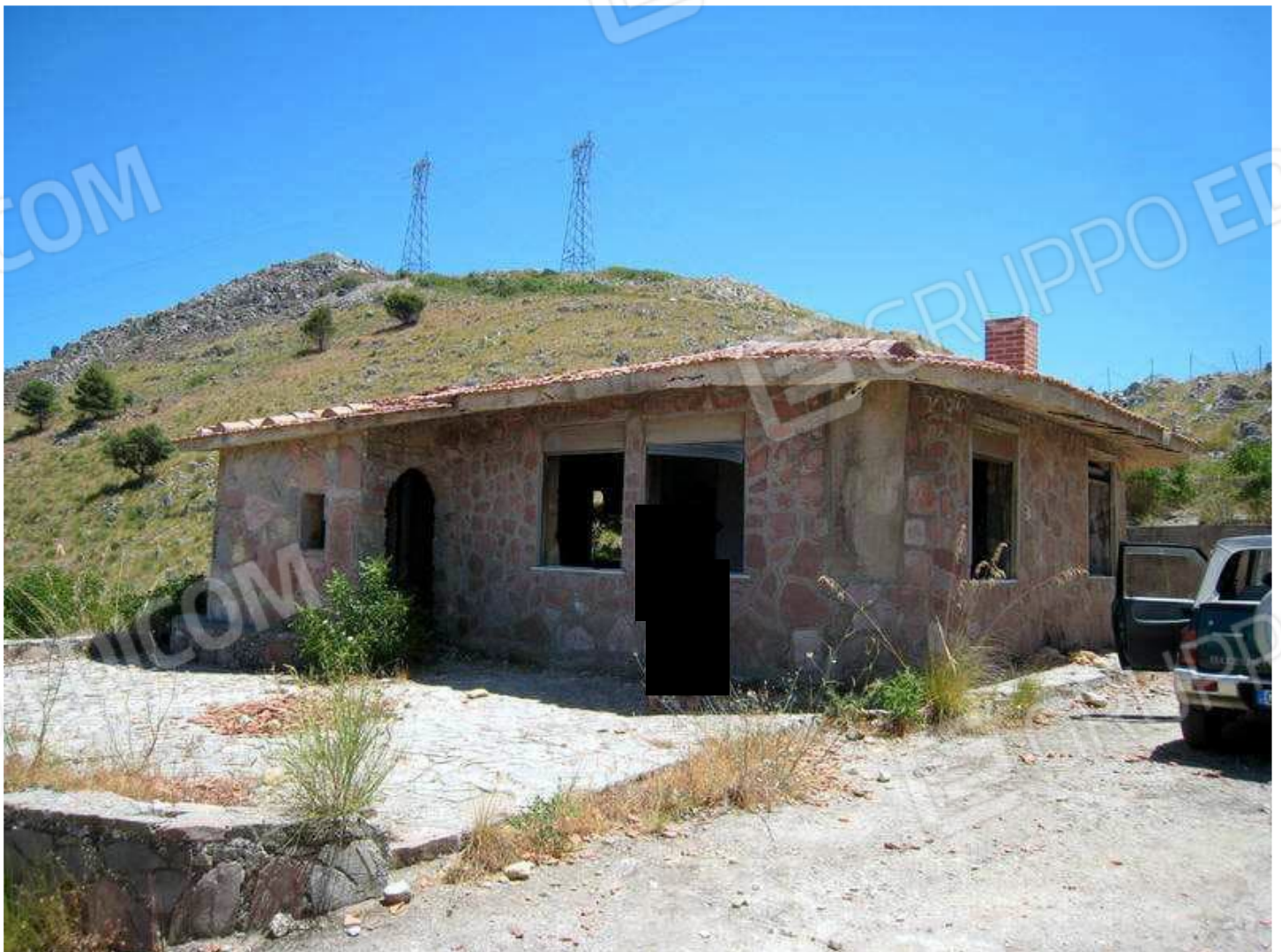
Foto n. 12. La villetta è priva di tutti i serramenti esterni perché sono stati rubati. La pensilina in copertura è ammalorata a causa della pioggia. La foto mostra il prospetto Nord (a Sx) e quello Ovest (a Dx).