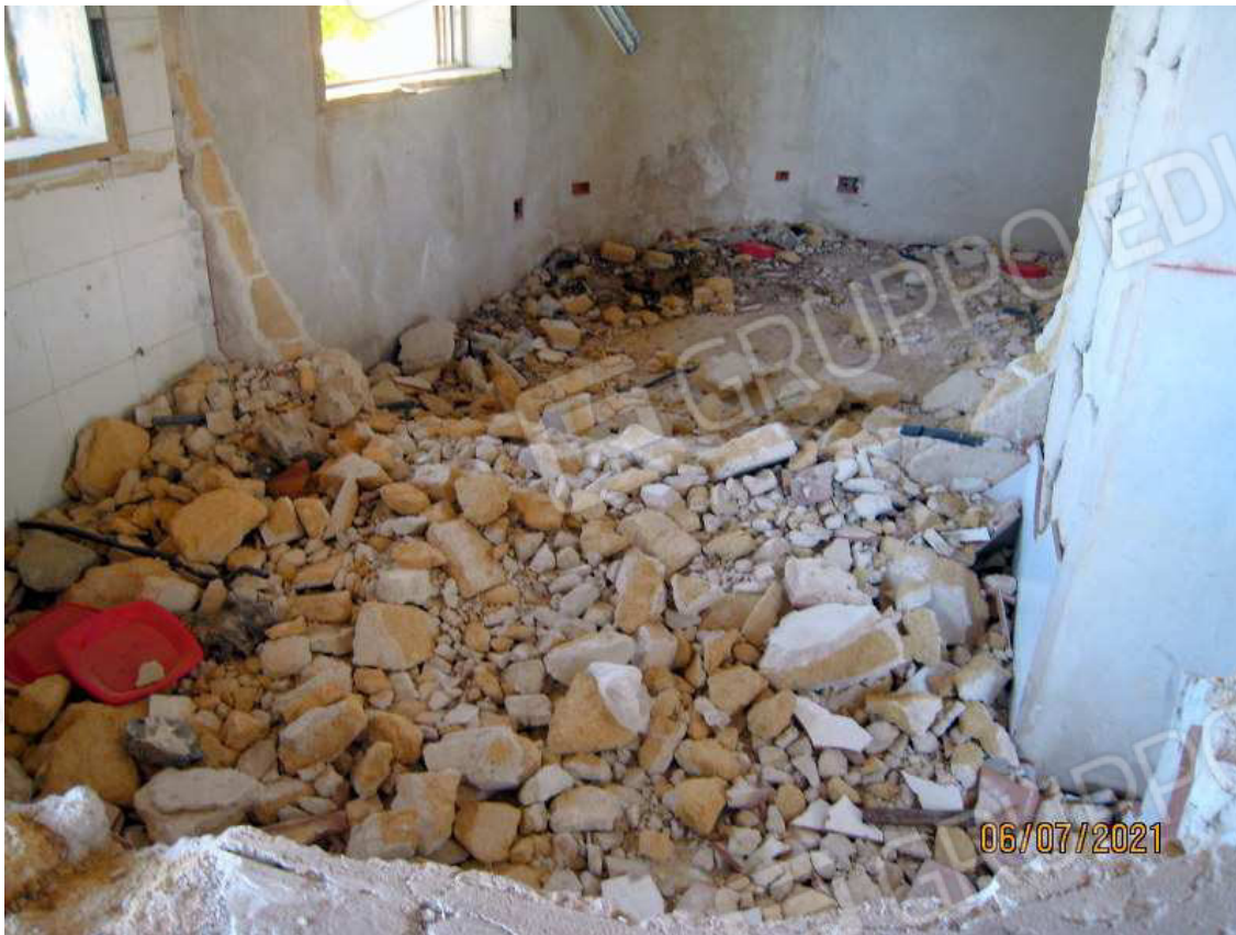
Foto n. 22. Gli sfabbricidi depositati sul pavimento. Dell'impianto elettrico non esiste più nulla.