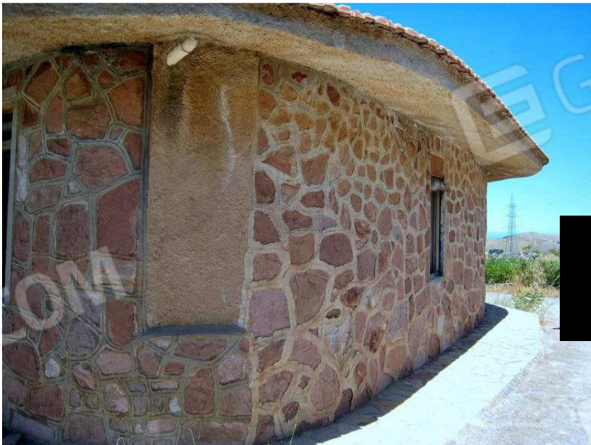
Foto n. 14. Dettaglio del prospetto Sud.