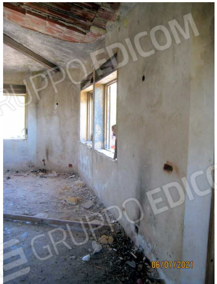
Foto n. 30-31. Ancora dettagli del tetto e delle travi in acciaio poste sui quattro spigoli a rinforzare la copertura.