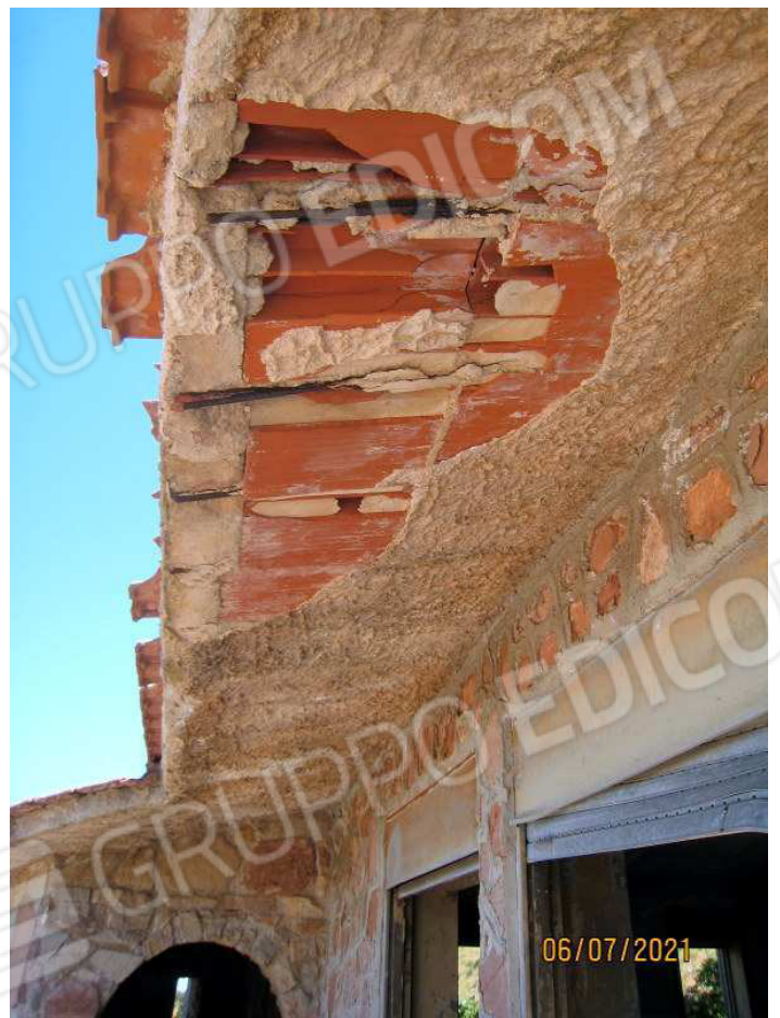
Foto n. 18 e 19. La pensilina , prolungamento della copertura, versa in queste condizioni.