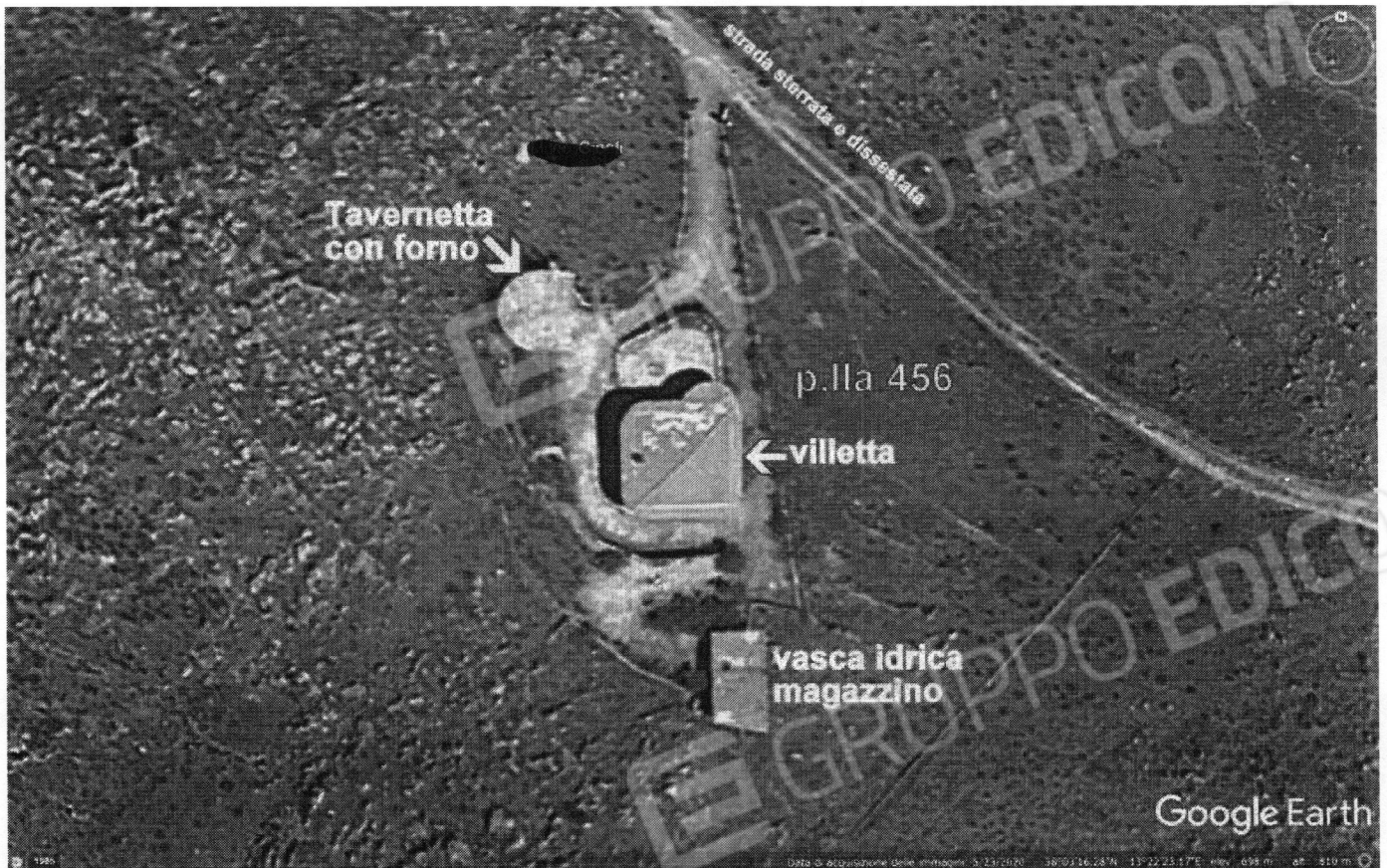
Foto n. 3. Dettaglio del lotto con indicata la stradella di accesso, la villetta ed i corpi accessori.