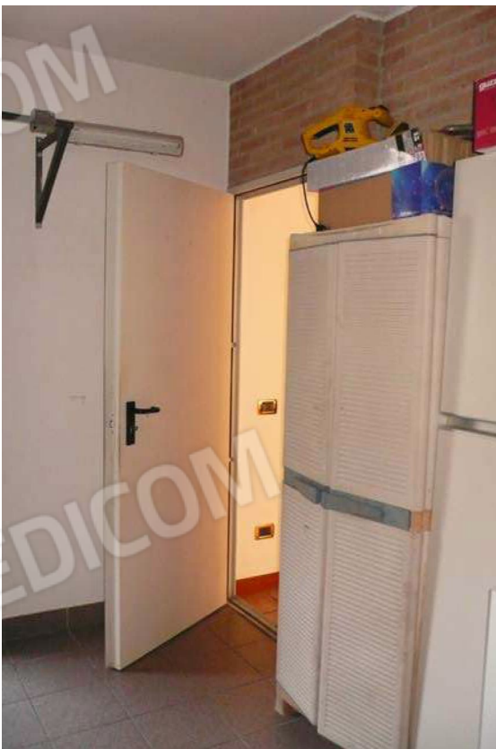
Foto n. 28 – porta di comunicazione tra autorimessa ed abitazione pignorata