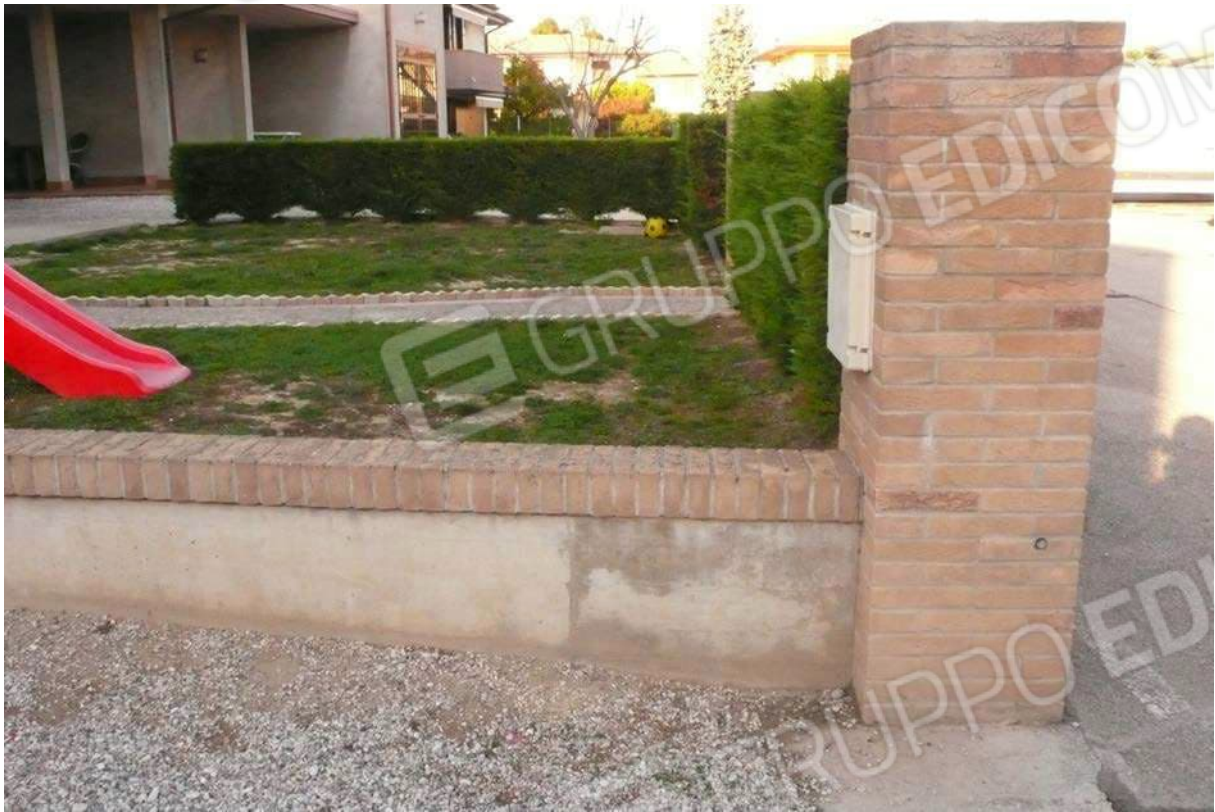
Foto n. 2 - (a dx dell'immagine recinzione priva di cancelli su vicolo Manfredini ad est)