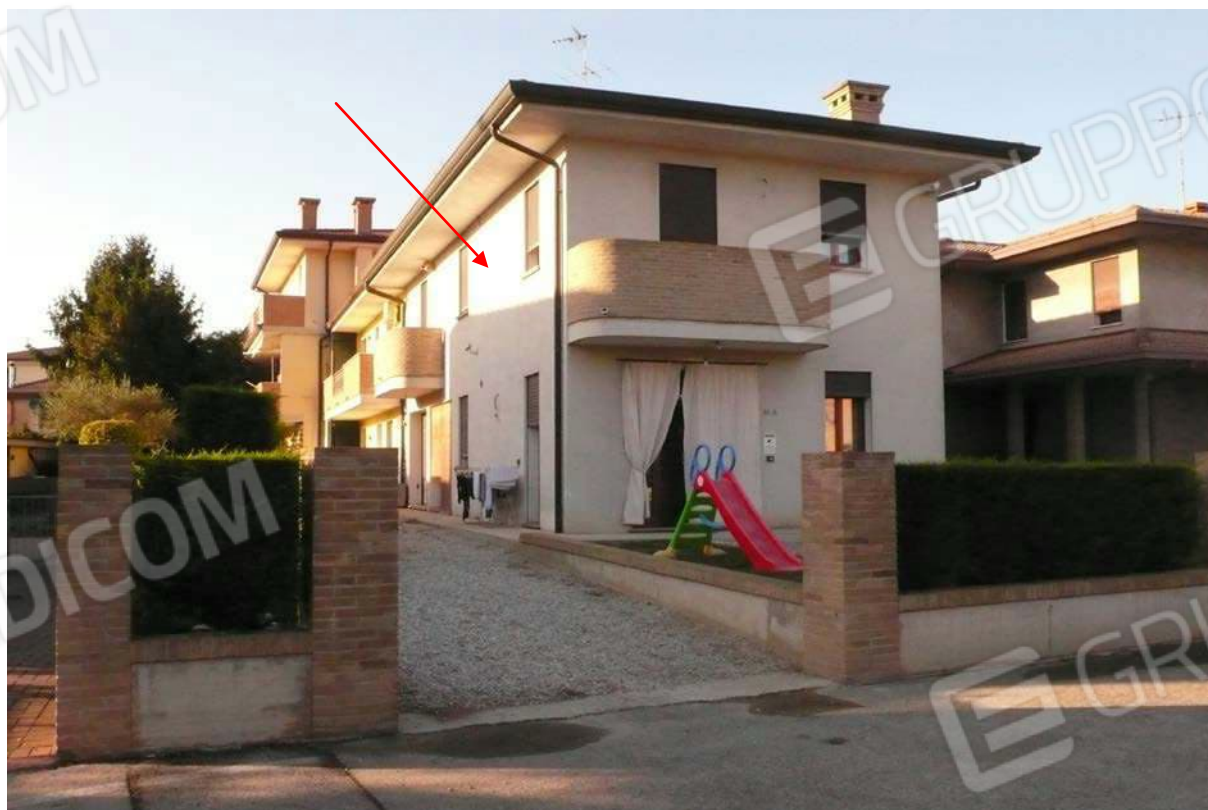
Foto n. 1 – il fabbricato bifamiliare in cui insistono gli immobili pignorati