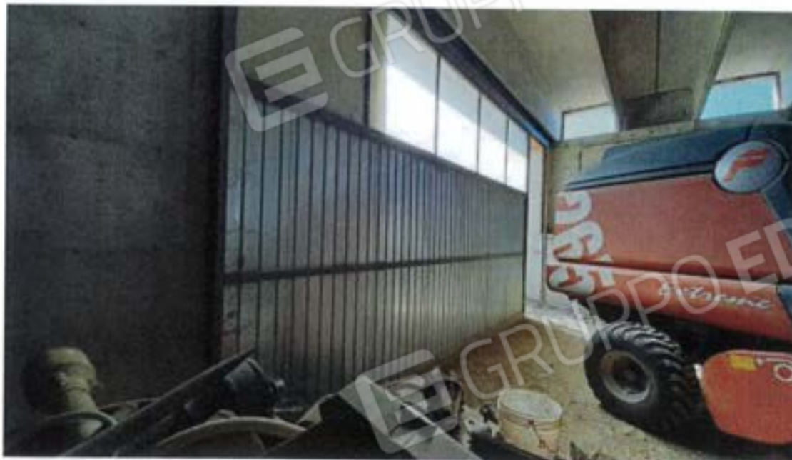
Stalla Bovini Fg 36, Part 539, Sub 2