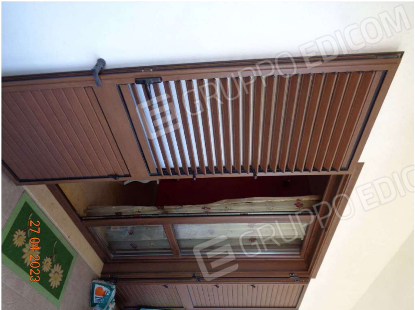
Piano Terra: Balcone di accesso al terrazzo