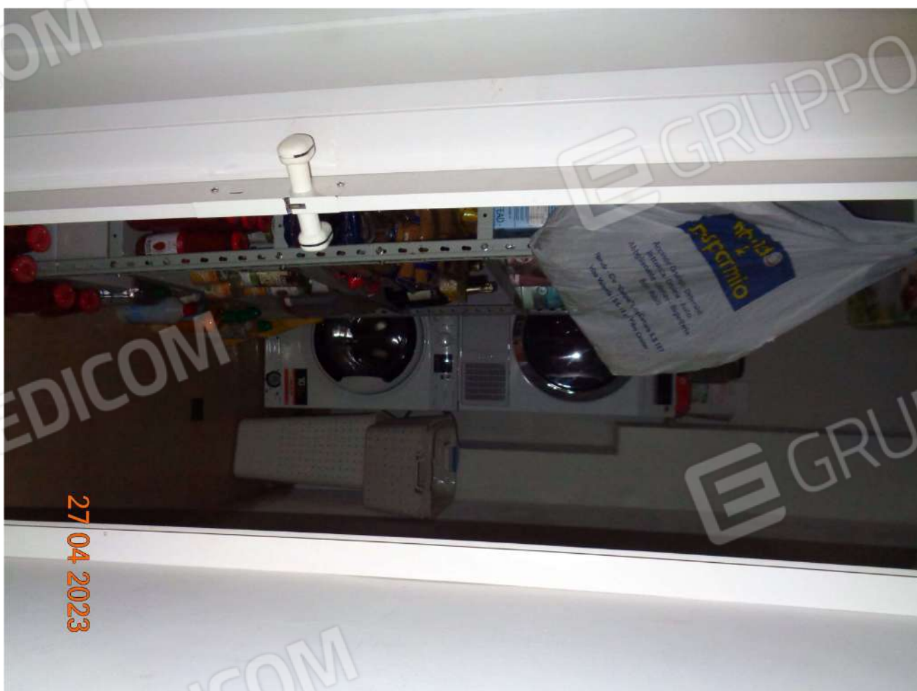
Piano Terra: Vano ripostiglio - lavanderia