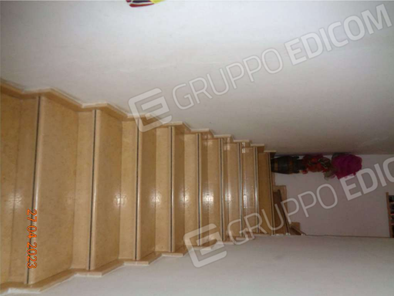
Piano Interrato: Scala accesso al Piano Terra