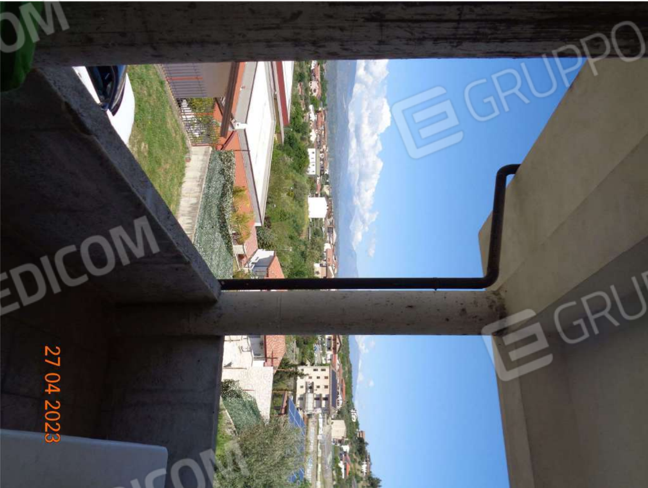
Piano Terra: Terrazzo