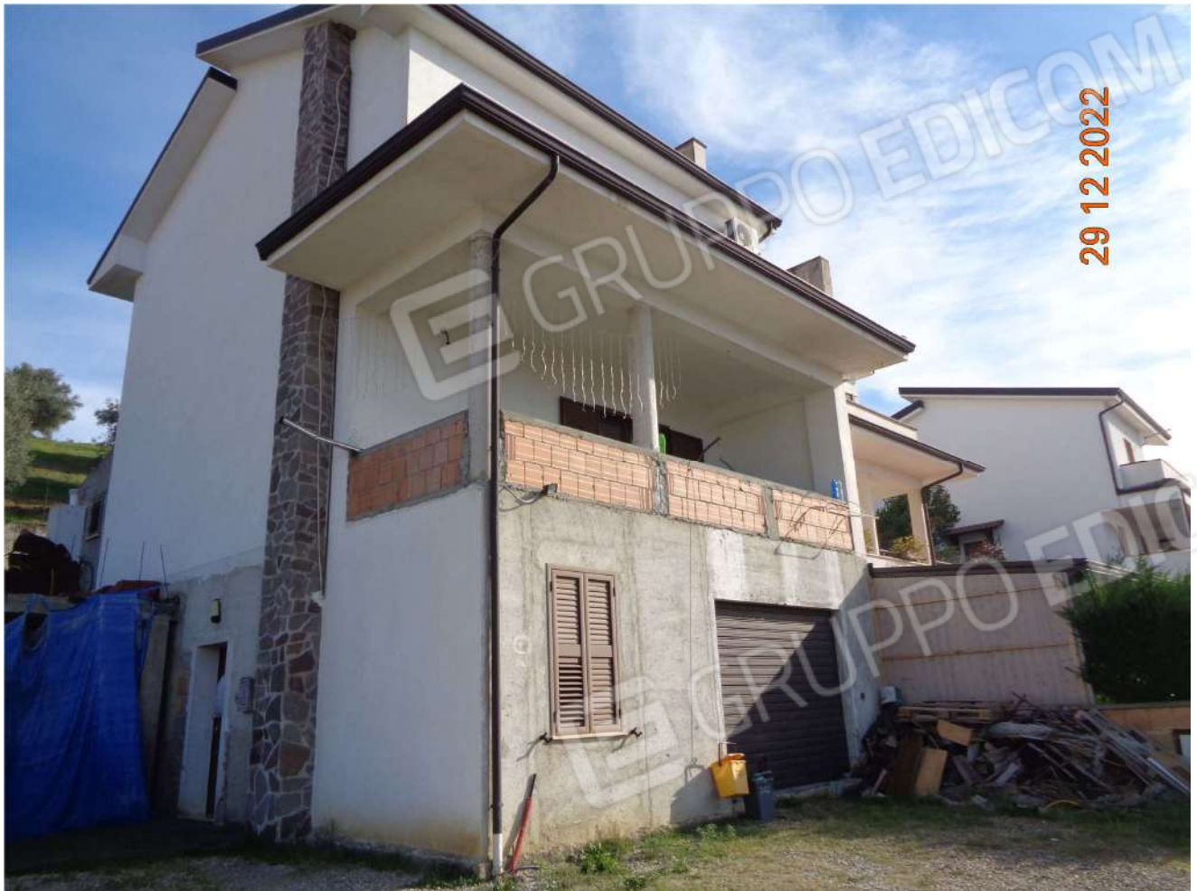
Vista esterna generale del fabbricato