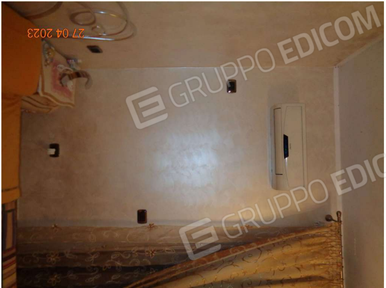
Piano Primo: Camera da letto