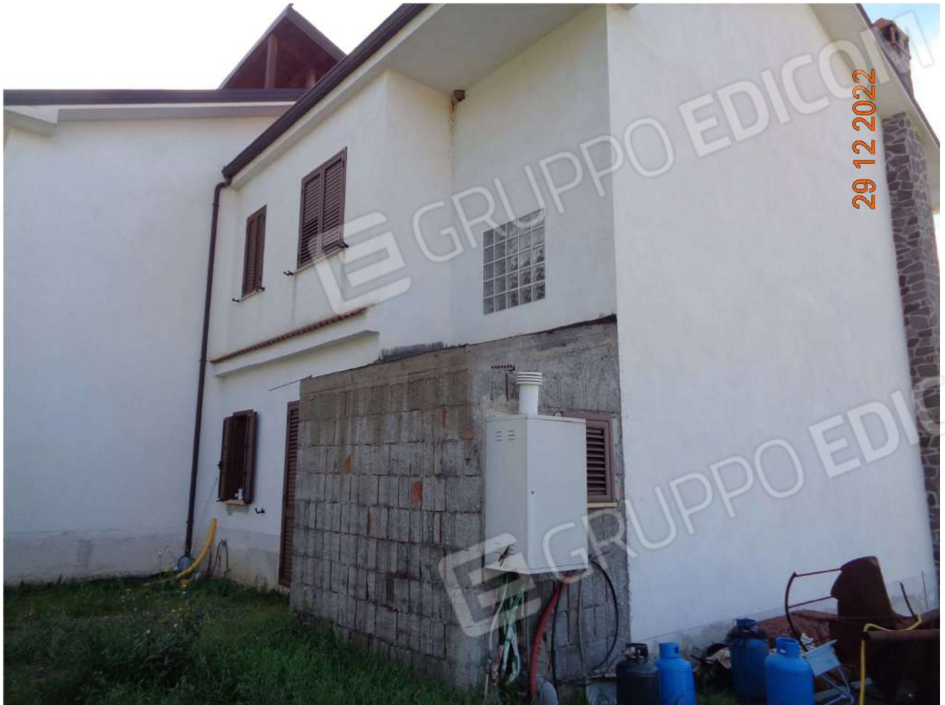
Prospetto Laterale Nord