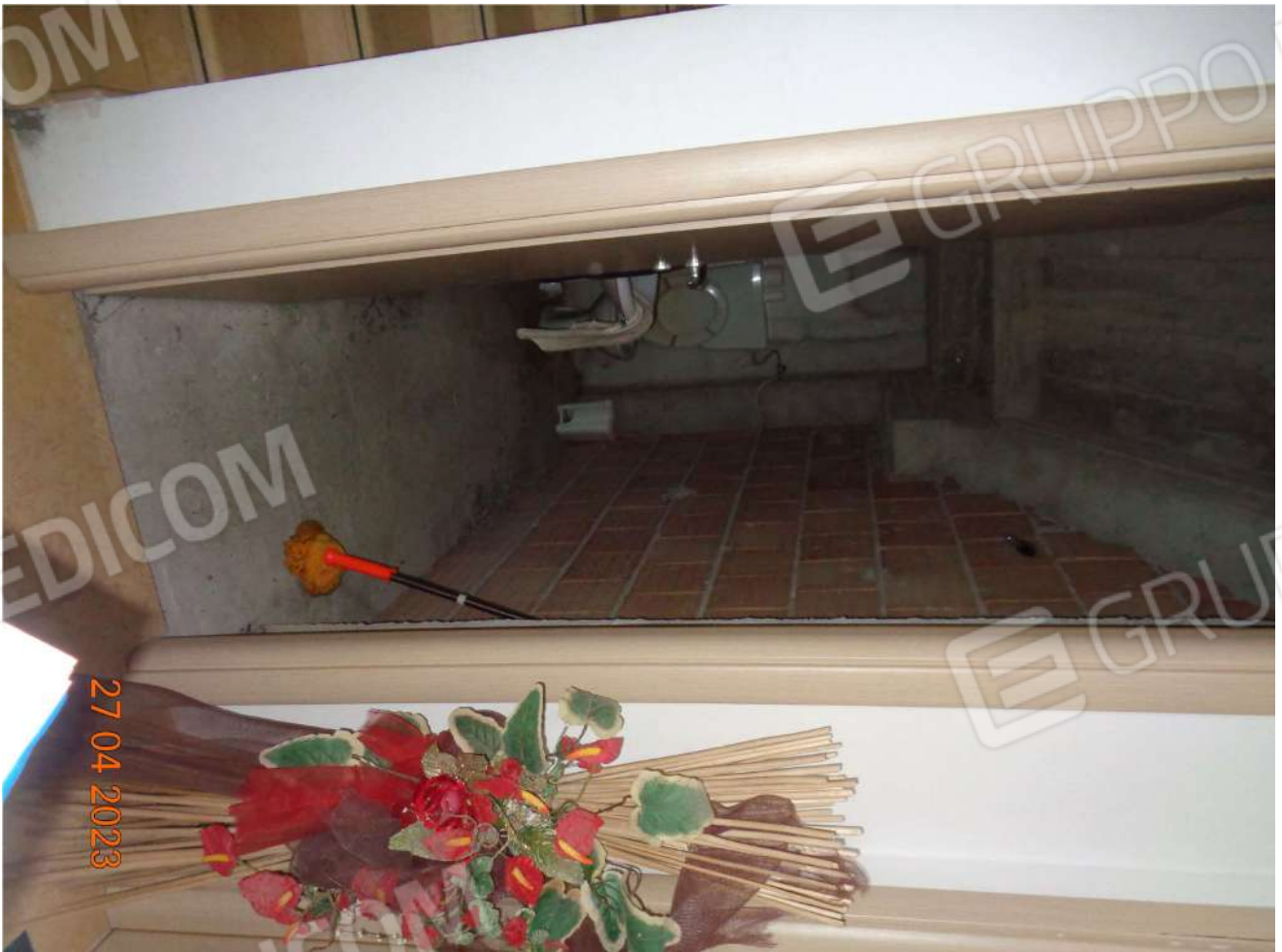
Piano Interrato: Servizio igienico sottoscala