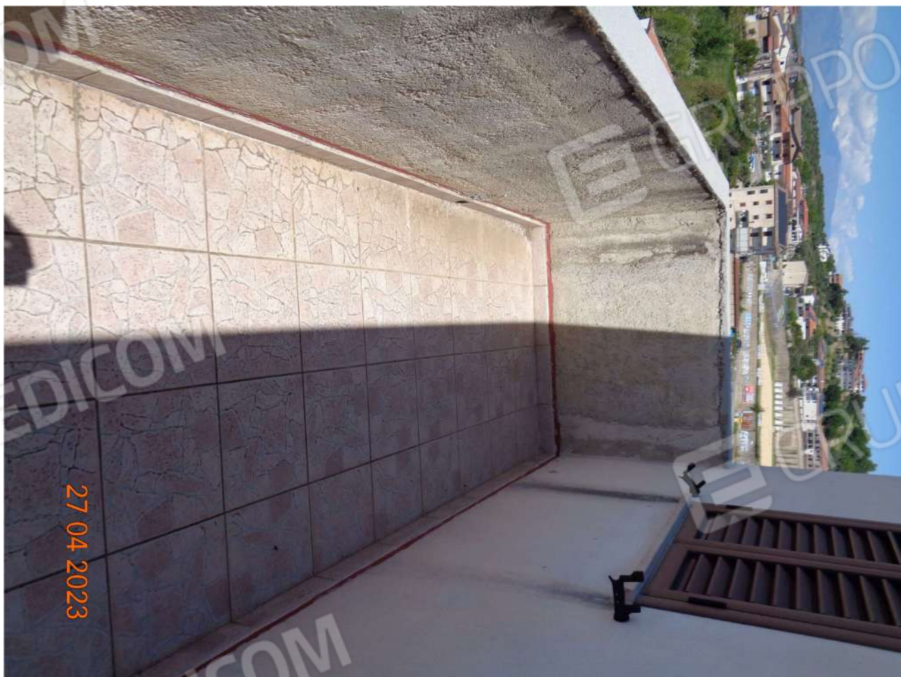
Piano Primo: Terrazzo