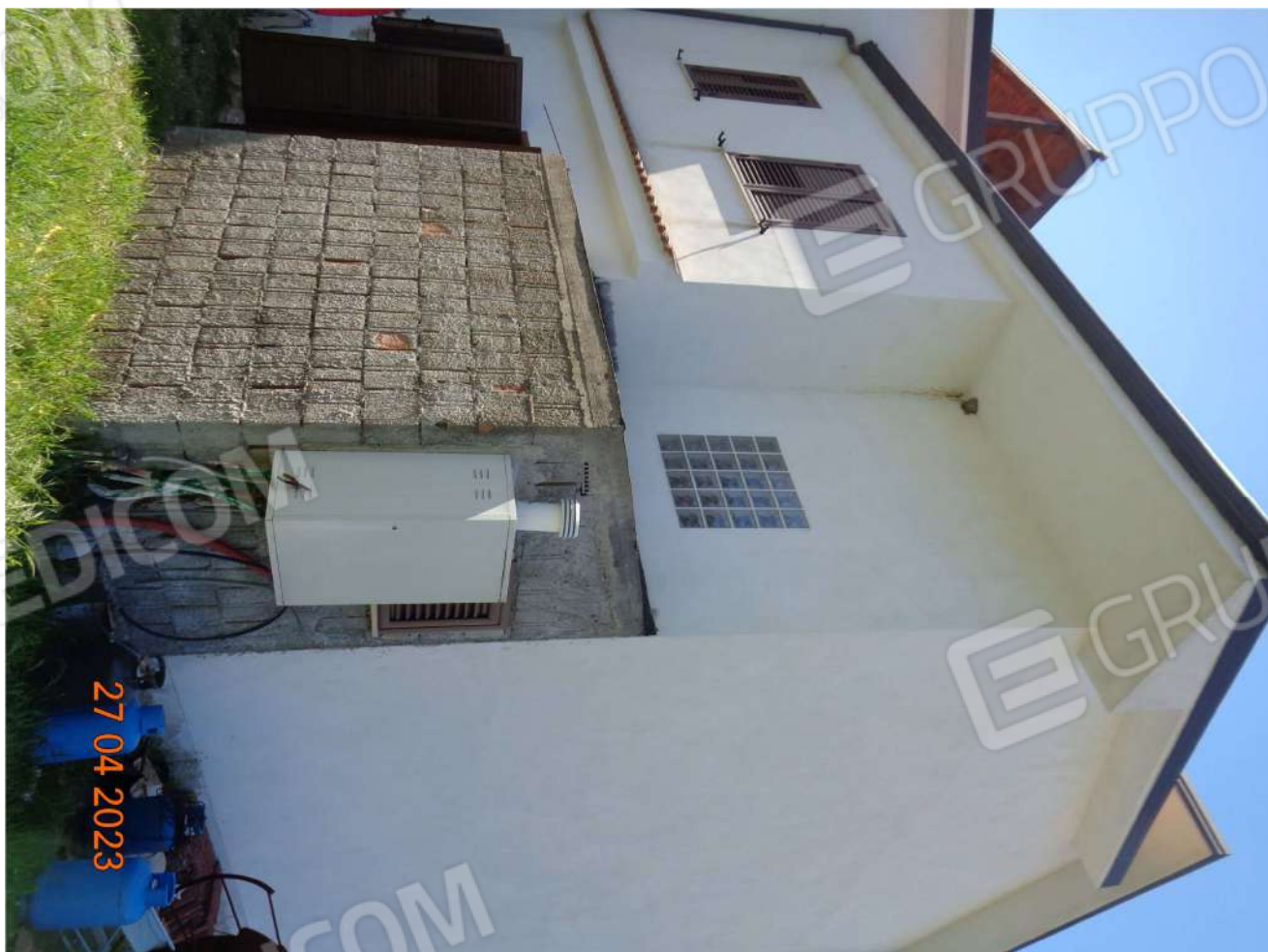
Piano Terra: Prospetto Nord - Servizio igienico abusivo