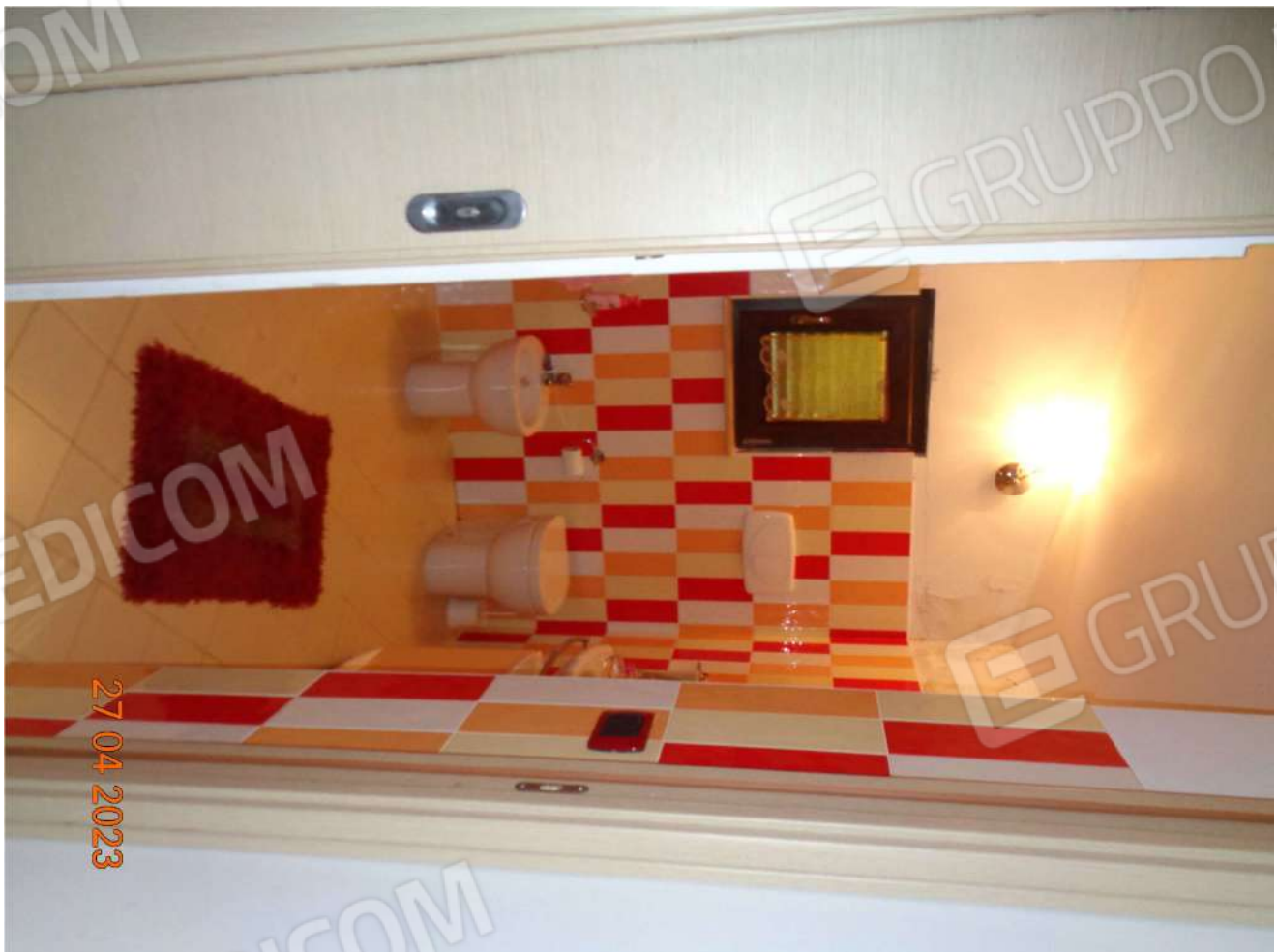
Piano Terra: Servizio igienico (abusivo)