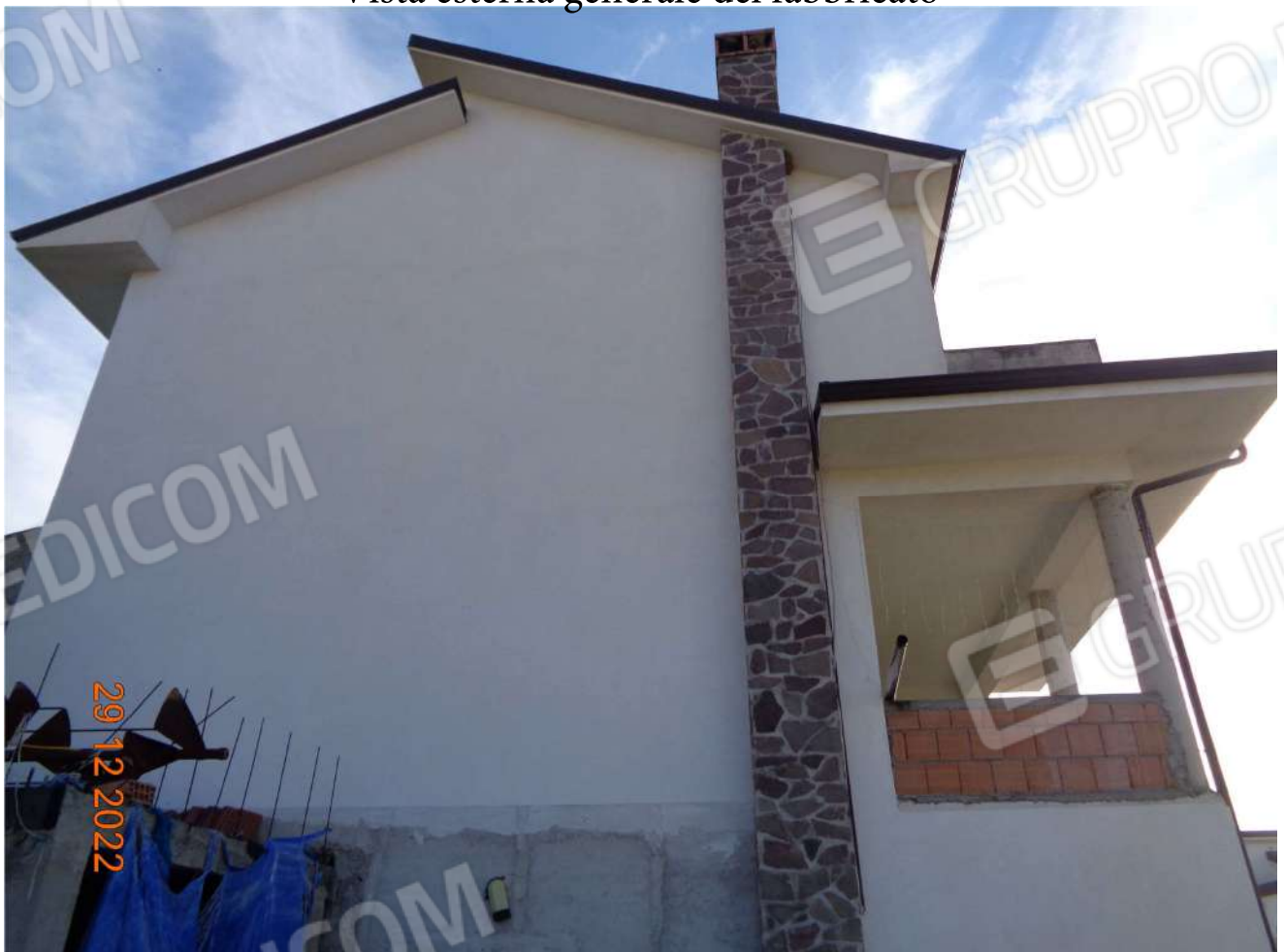
Prospetto laterale Ovest