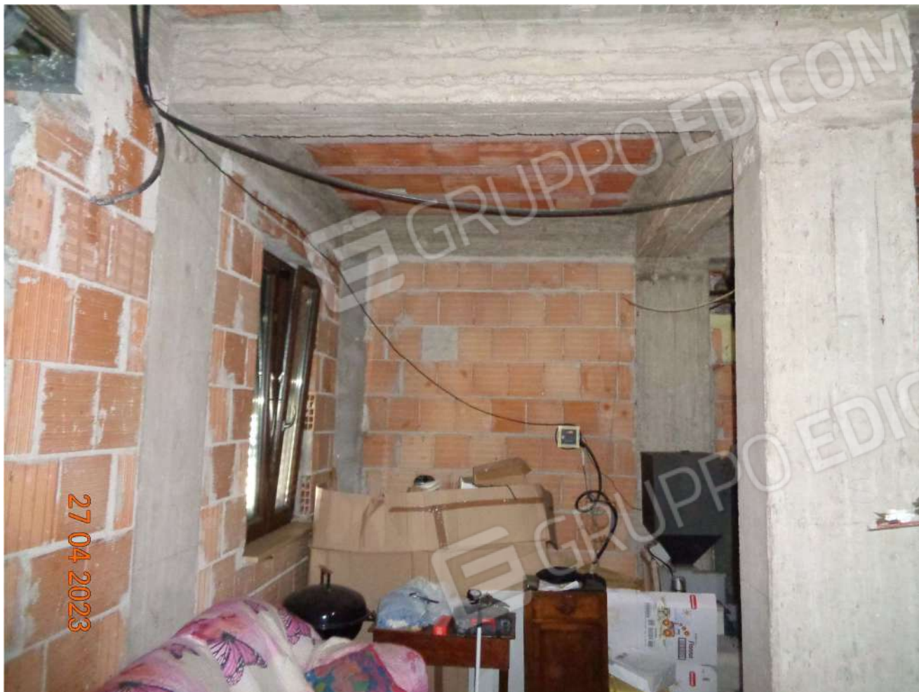
Piano Interrato: Locale Garage Stato Rustico