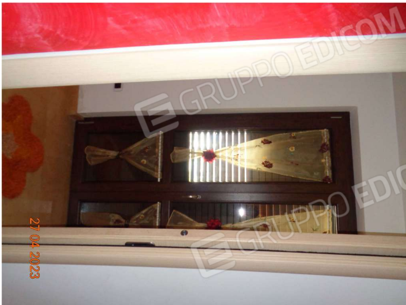
Piano Terra: Porta-finestra presente sul disimpegno di accesso corte esterna