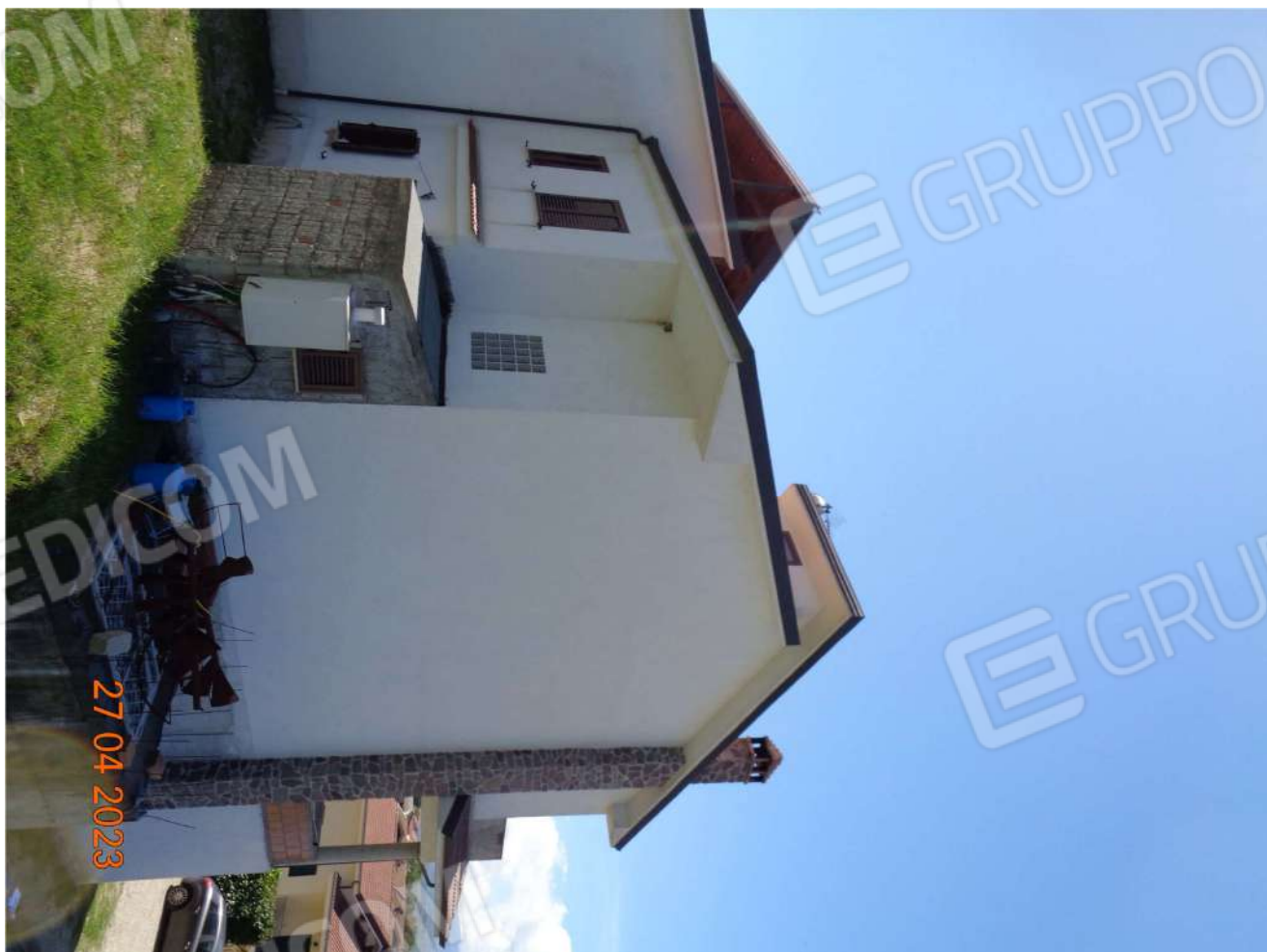
Prospetto Fabbricato Nord Ovest con servizio igienico abusivo