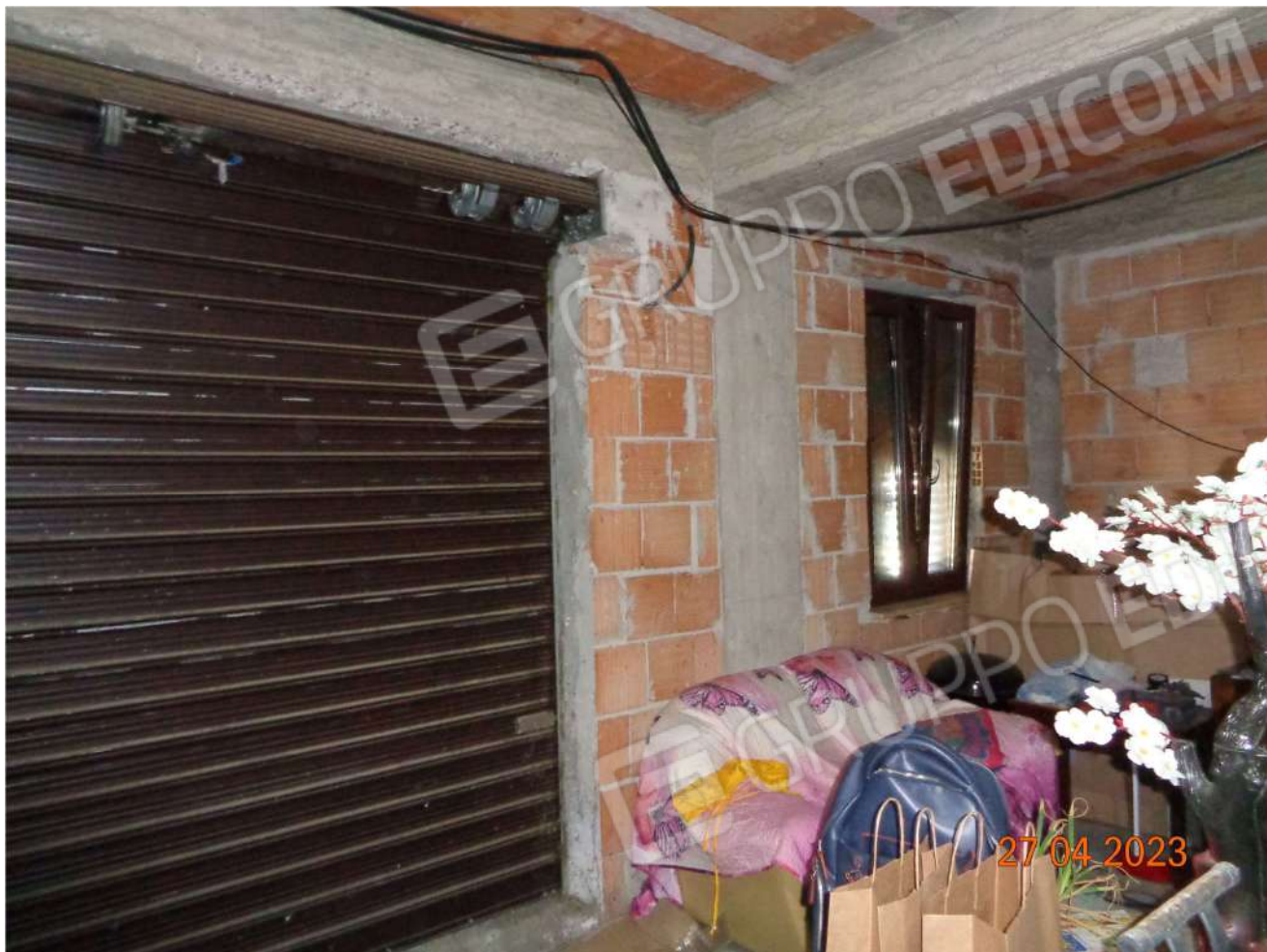
Piano Interrato: Locale Garage Ingresso Serranda