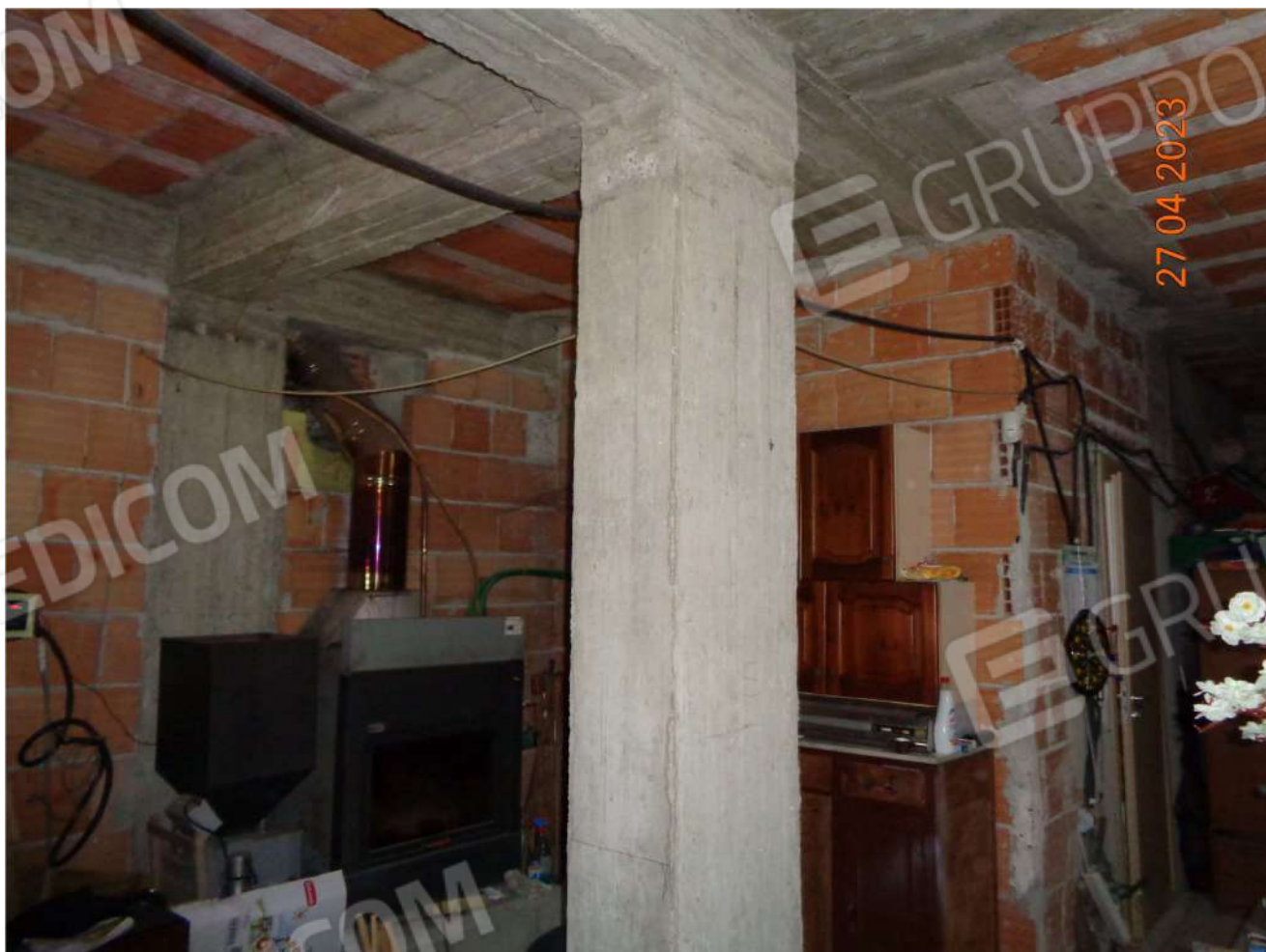
Piano Interrato: Locale Garage Termocamino