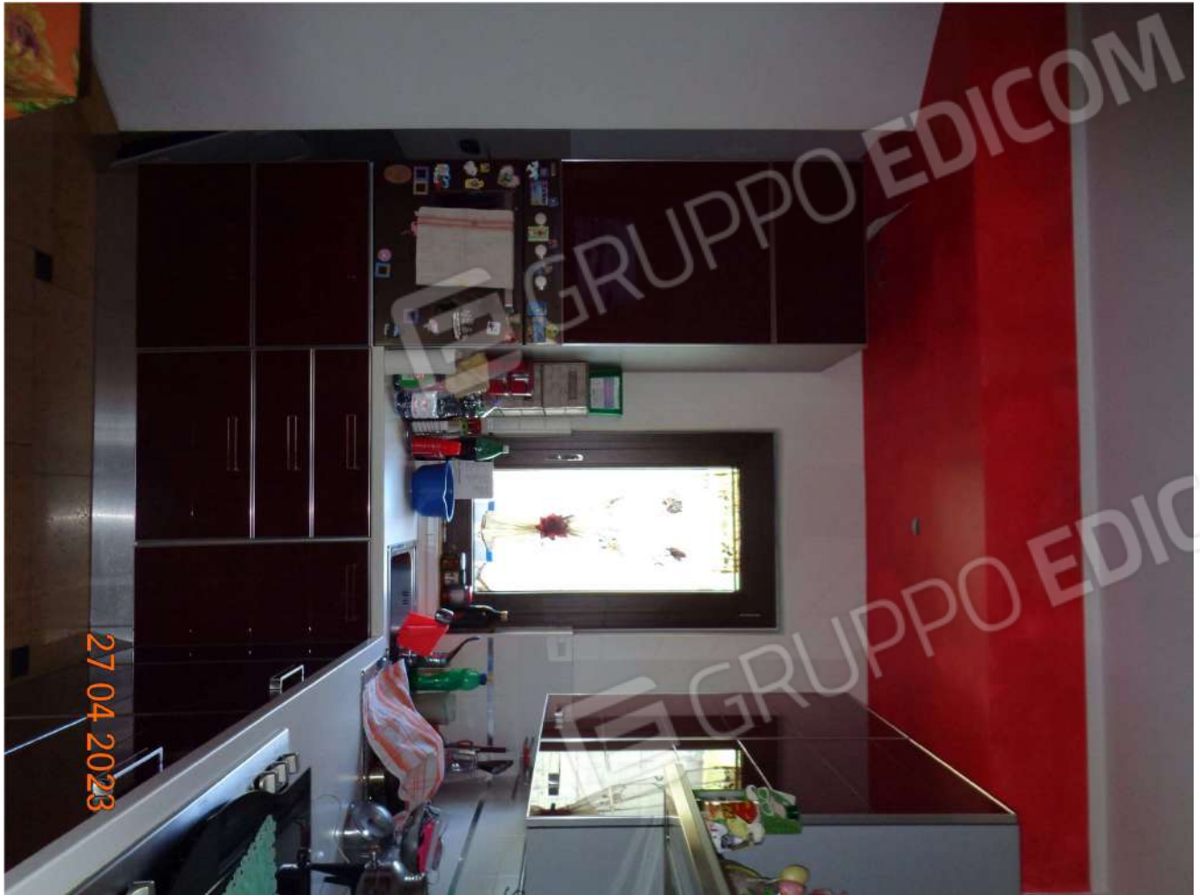
Piano Terra: Cucina