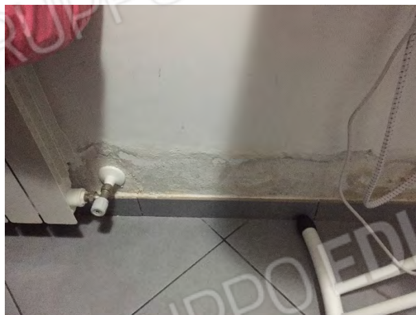
FENOMENI DI UMIDITA' DI RISALITA AL PIANO TERRA