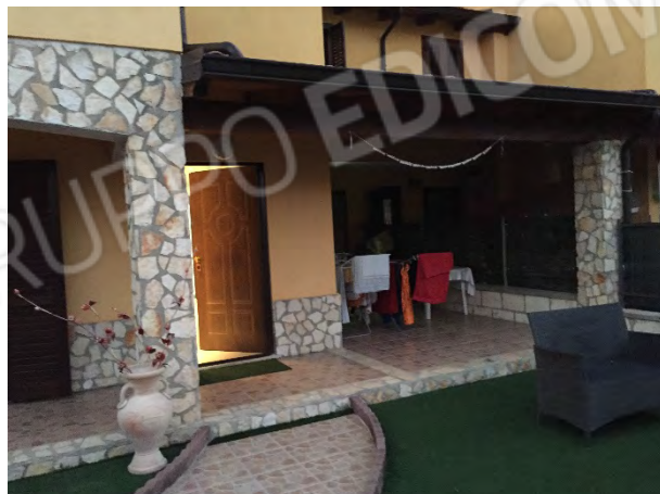
PORTICATO FRONTE EST