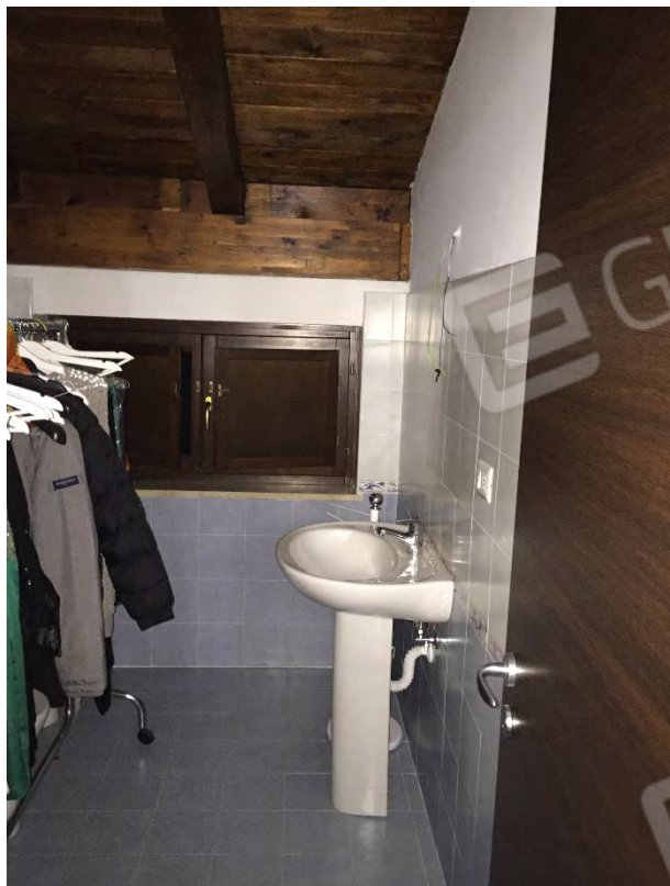
WC DEL SOTTOTETTO