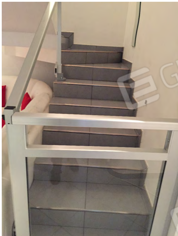
SCALA DI COLLEGAMENTO