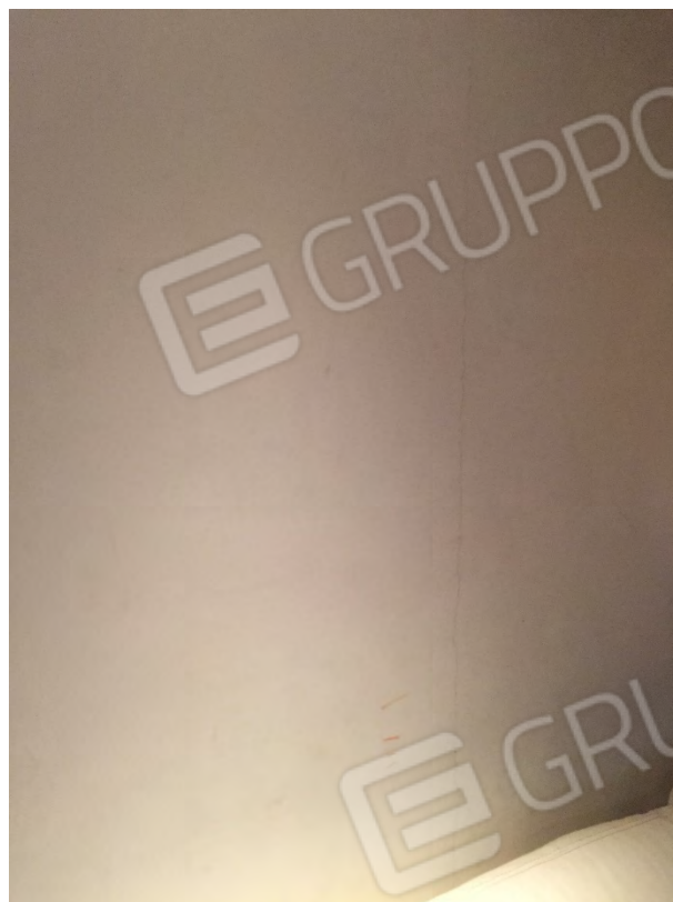
LESIONE SULLA PARETE DEL PIANO TERRA