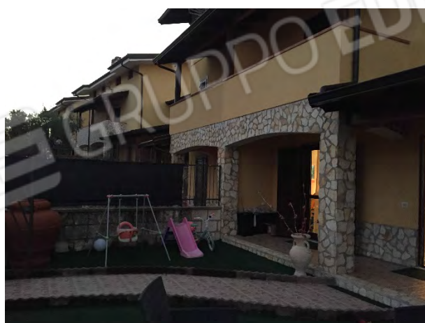
CORTE SUL LATO EST