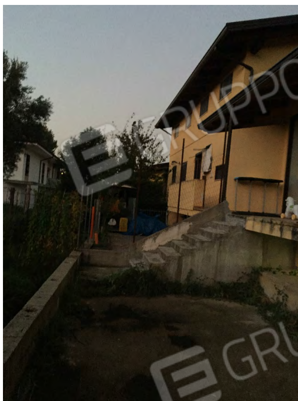
CORTE POSTERIORE – LATO OVEST