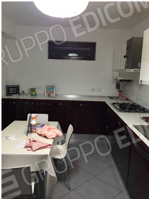
CUCINA AL PIANO TERRA