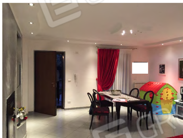
SOGGIORNO CON PORTONCINO INGRESSO