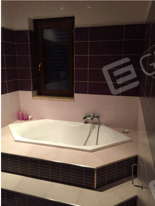
BAGNO AL PRIMO PIANO