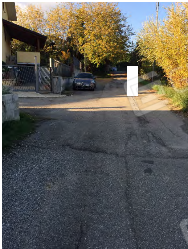
VISTA DI VIA DELL'ACQUA SULFUREA