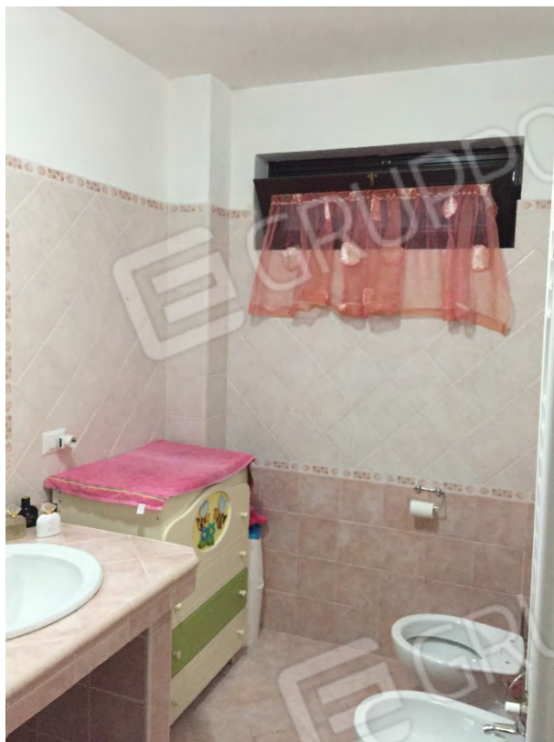
BAGNO AL PIANO TERRA