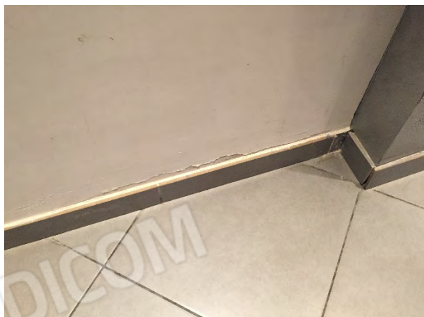
FENOMENI DI UMIDITA' DI RISALITA AL PIANO TERRA