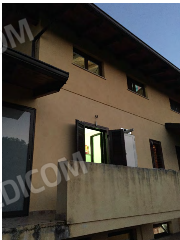
FRONTE POSTERIORE – LATO OVEST