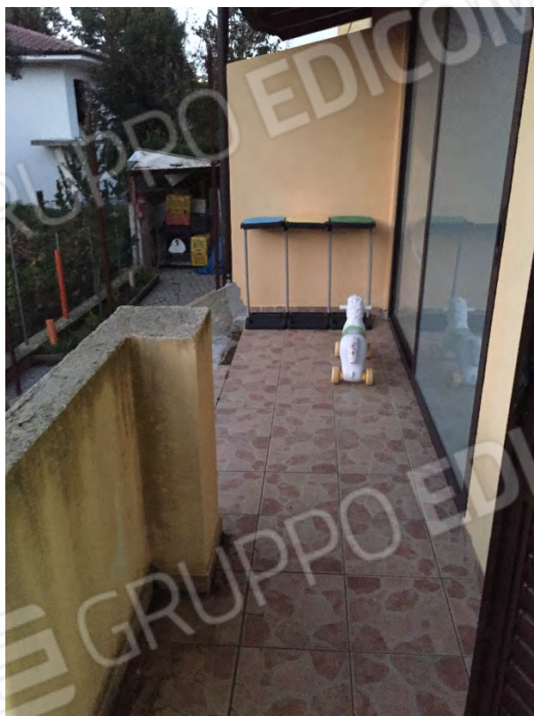
ACCESSO ALLA CORTE POSTERIORE