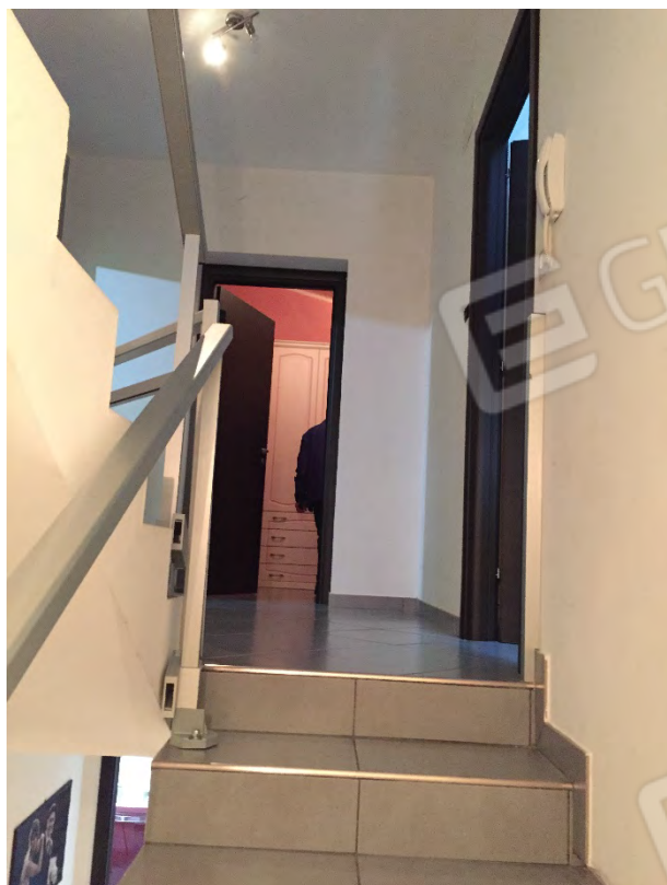
SCALA DI COLLEGAMENTO