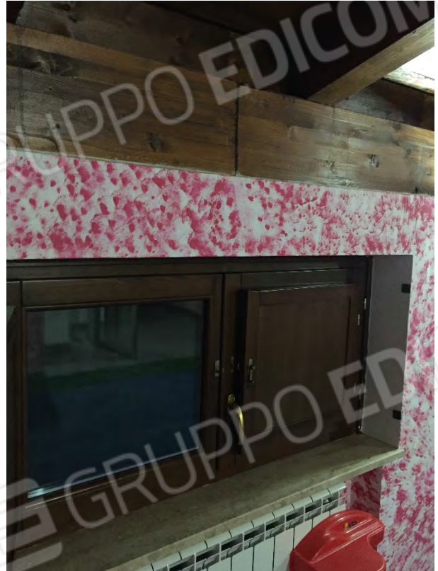
INFISSI IN LEGNO