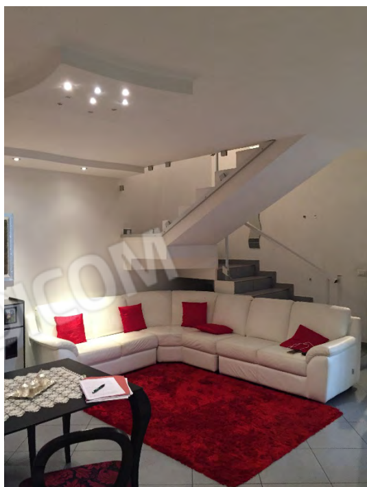
SOGGIORNO CON SCALA DI COLLEGAMENTO