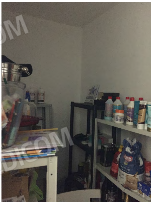
RIPOSTIGLIO COLLEGATO ALLA CUCINA