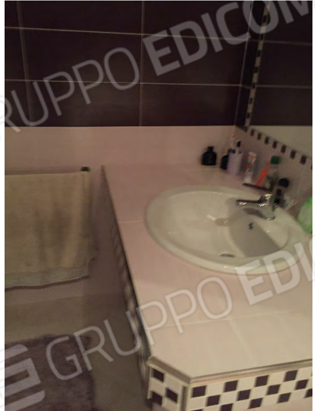
BAGNO AL PRIMO PIANO