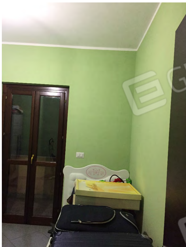
CAMERA AL PRIMO PIANO