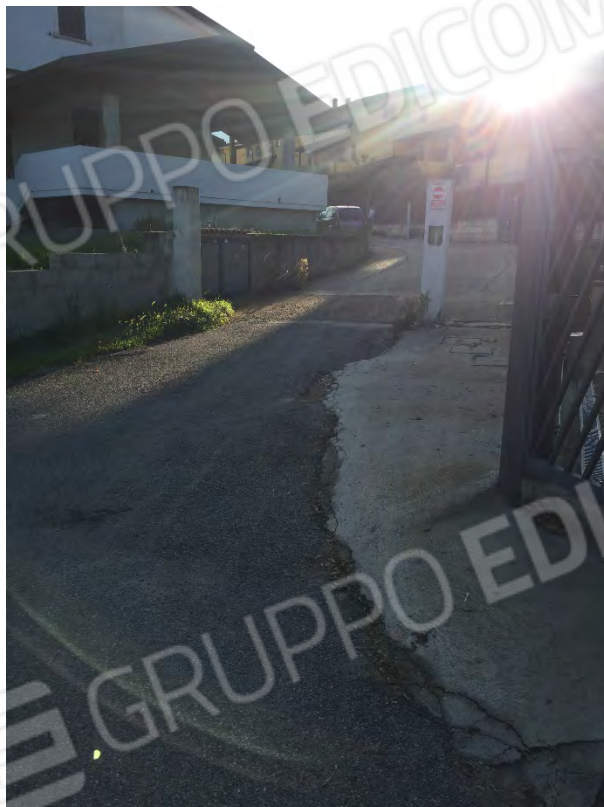
INGRESSO STRADA PRIVATA