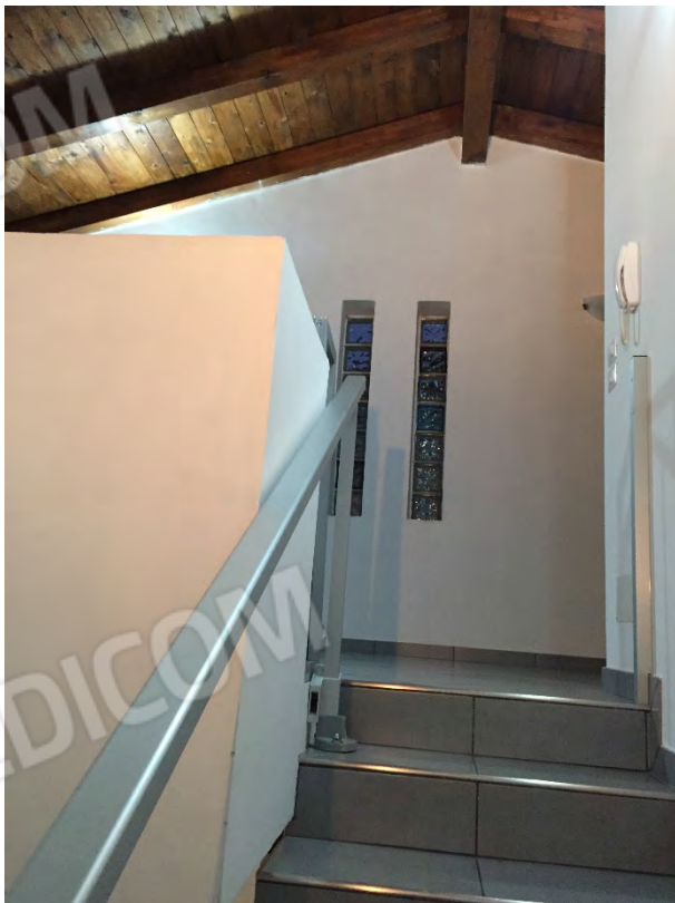
SCALA DI ACCESSO AL SOTTOTETTO