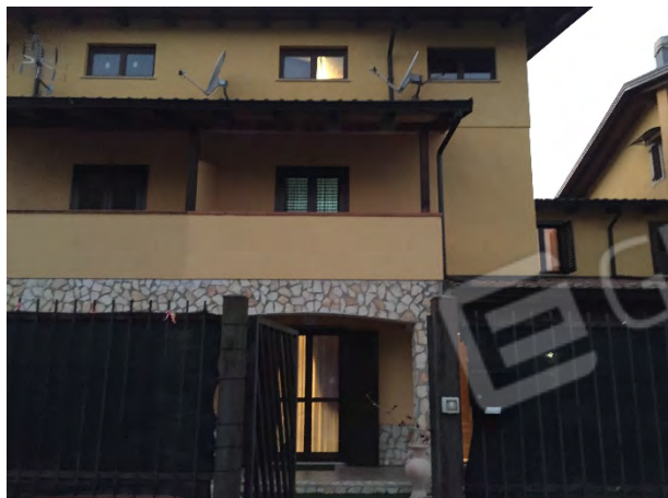
FRONTE EST DEL FABBRICATO