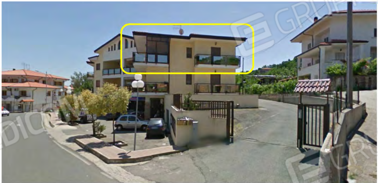
Immibile 1 – Comune di Marano Principato CS – Via Persanolento 40/B