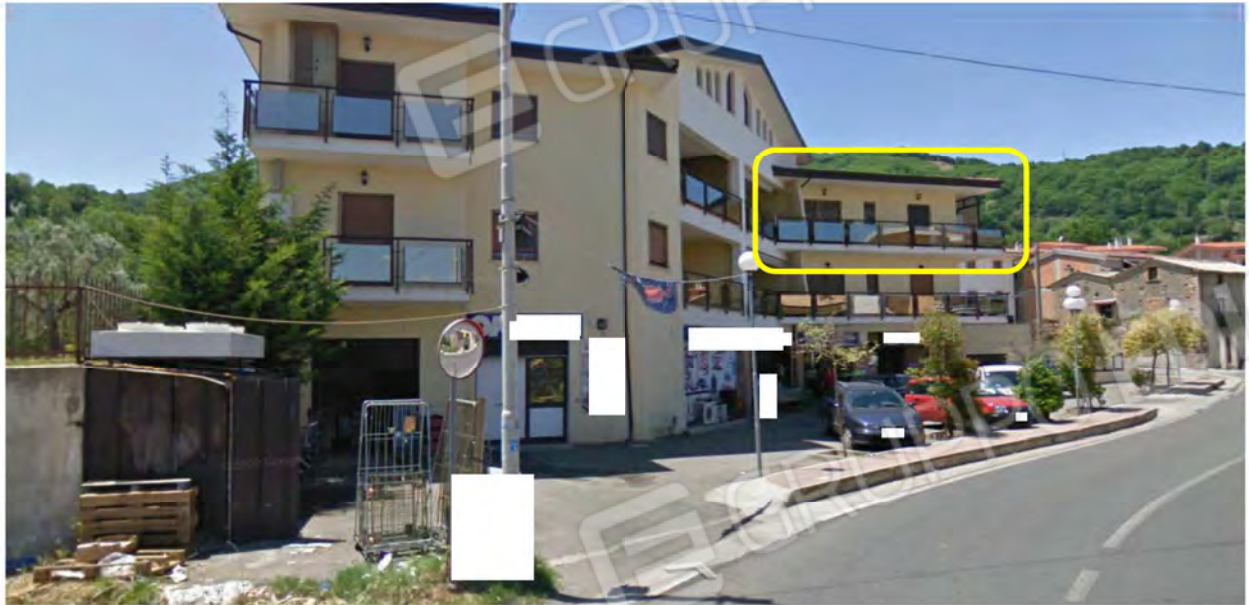
Immibile 1 – Comune di Marano Principato CS – Via Persanolento 40/B