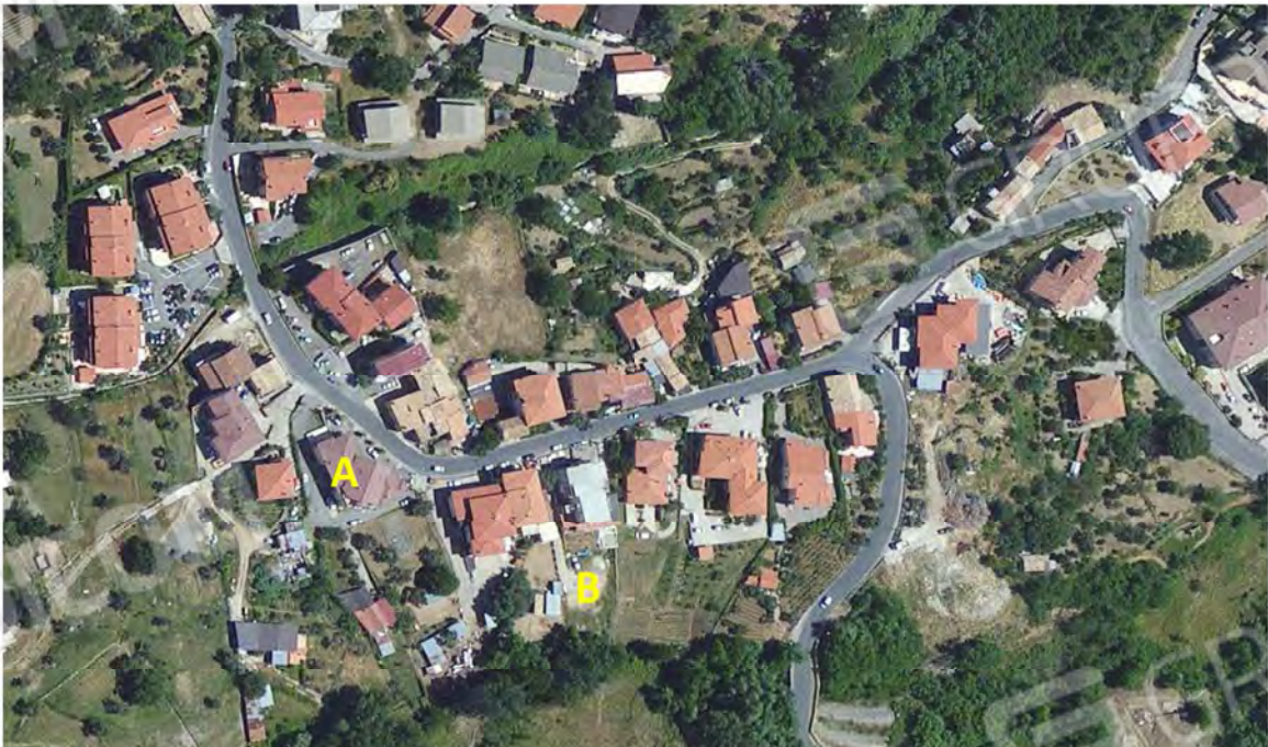
Comune di Marano Principato CS – Via Persanolento (A: p.lla 737 – B: p.lla 409)