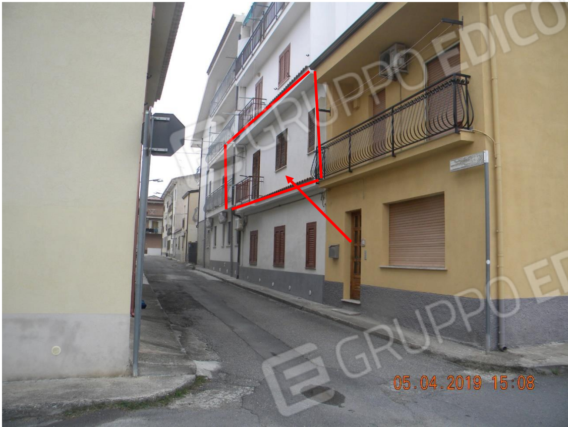
Foto n.1: vista facciata ovest con indicazione appartamento al 1° piano oggetto di esecuzione (via Sardegna)