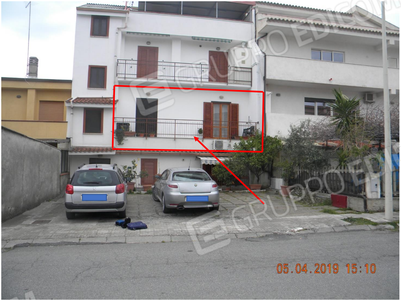
Foto n.3: vista facciata est con indicazione appartamento al 1° piano oggetto di esecuzione (via Capri)