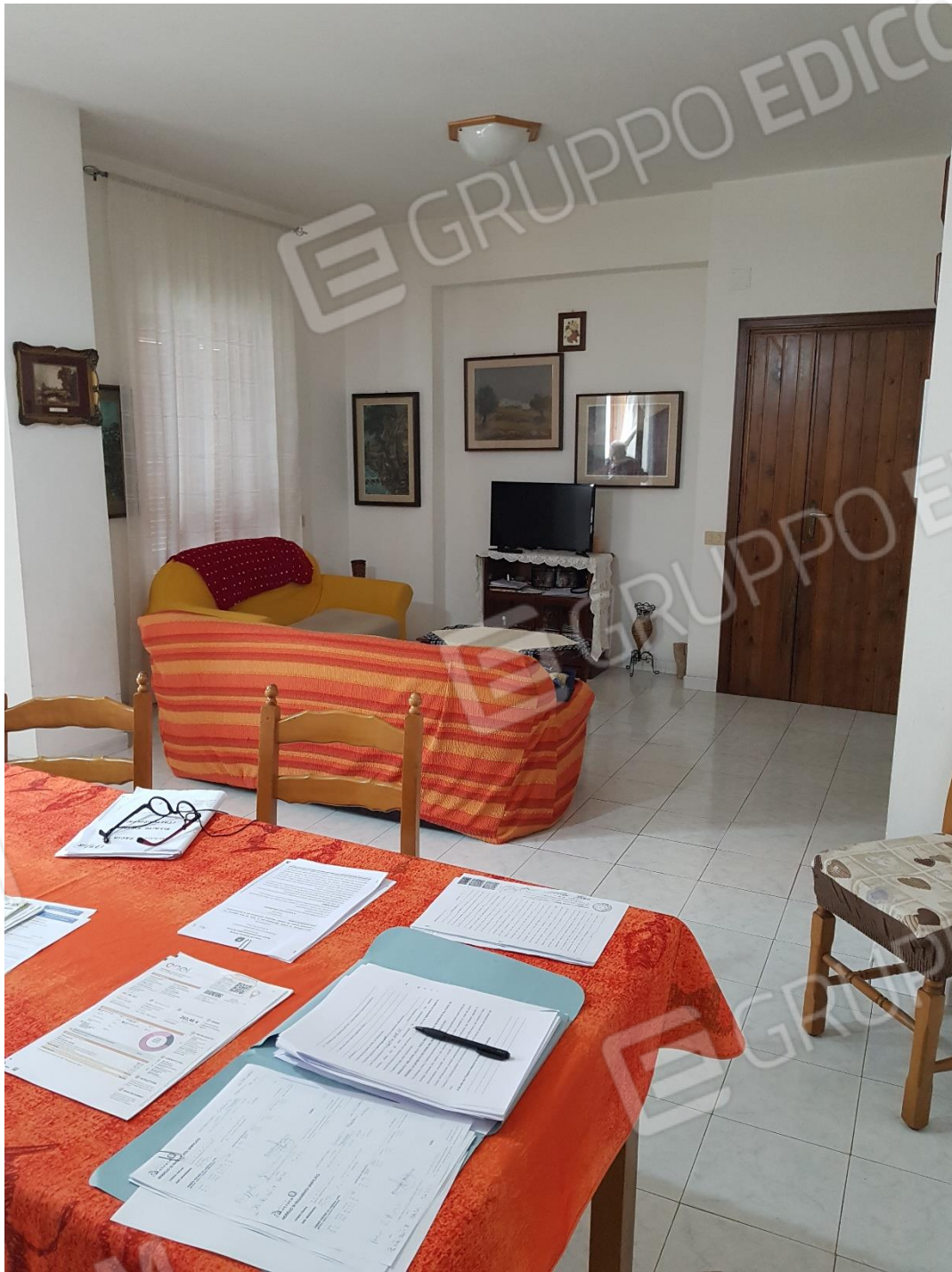
Foto n.7a: soggiorno-cucina con balcone esposto ad est (inquadramento ingresso-soggiorno)