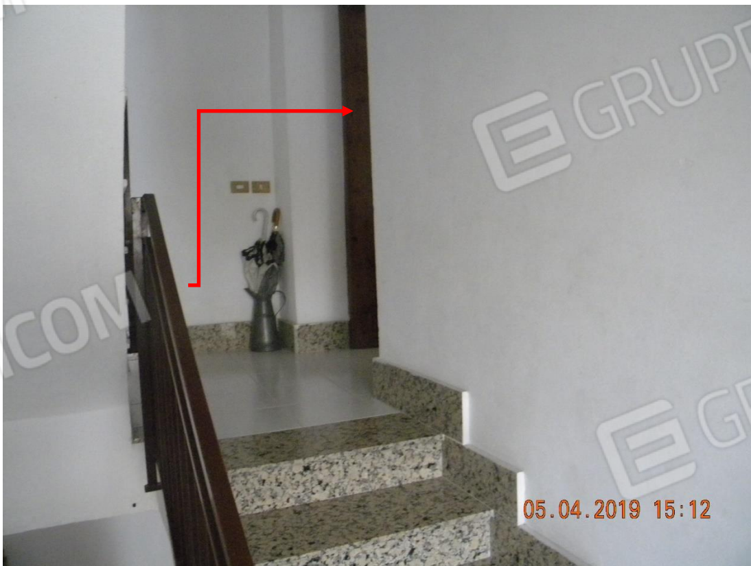
Foto n.5: particolare ingresso immobile pignorato sub 2 (vano scala)