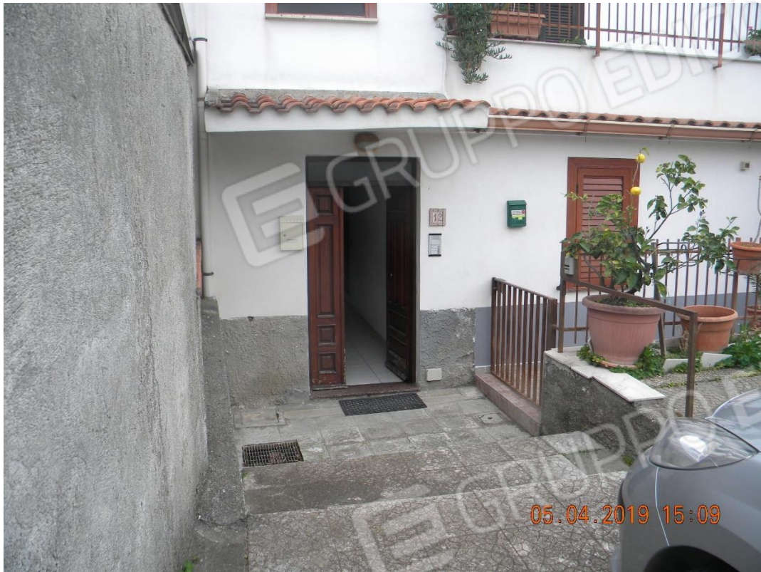
Foto n.4: particolare ingresso immobile al piano terra (Via Capri n.12)