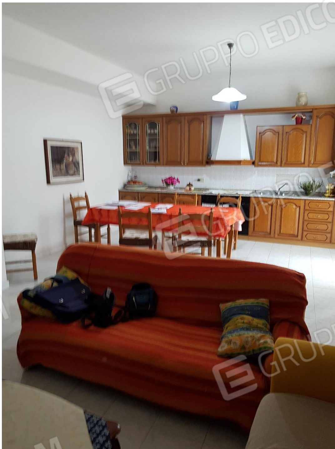
Foto n.6b: soggiorno-cucina con balcone esposto ad est (inquadramento soggiorno-cucina)