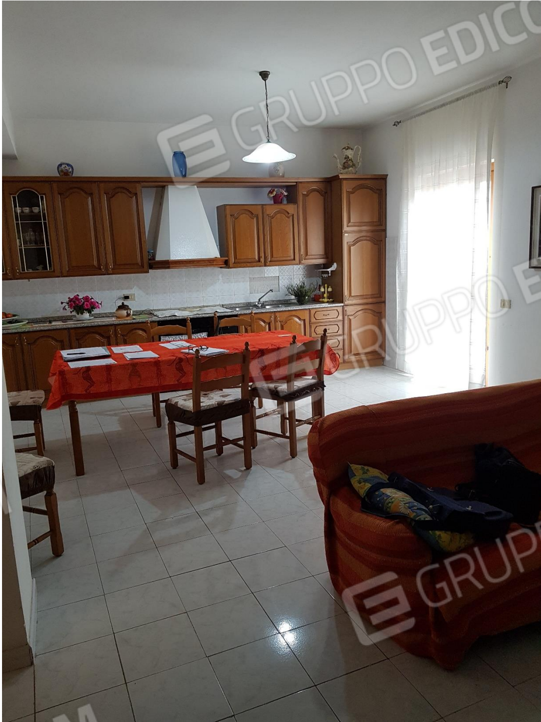
Foto n.6a: soggiorno-cucina con balcone esposto ad est (inquadramento soggiorno-cucina)