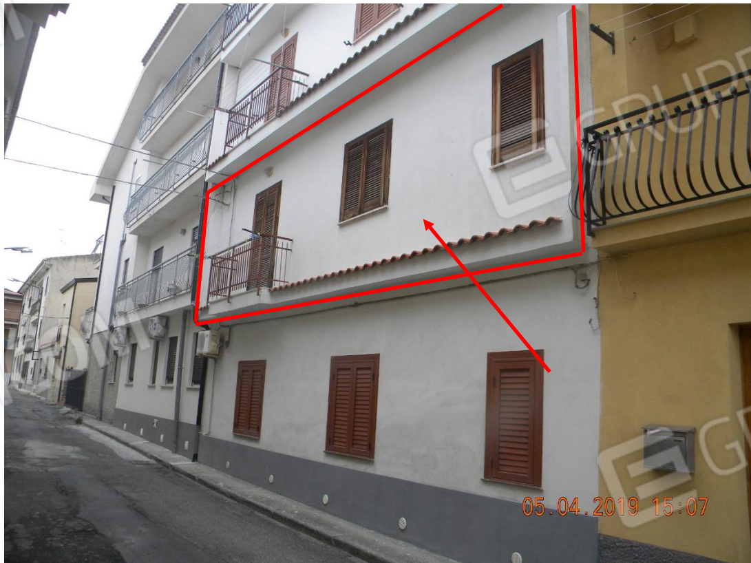
Foto n.2: vista ravvicinata facciata ovest con indicazione appartamento al 1° piano oggetto di esecuzione (via Sardegna)