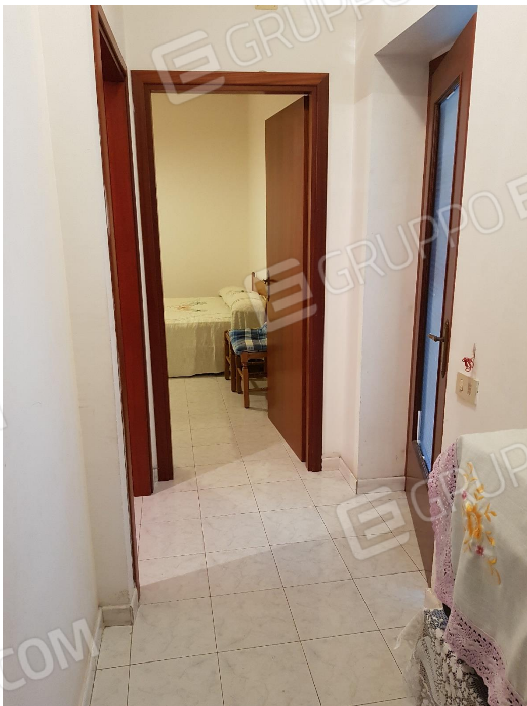
Foto n.9: corridoio con vista verso camere da letto e ingresso al soggiorno