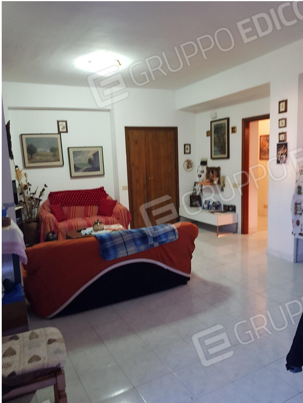
Foto n.7b: soggiorno-cucina con balcone esposto ad est (inquadramento ingresso-soggiorno ed accesso alla zona notte)