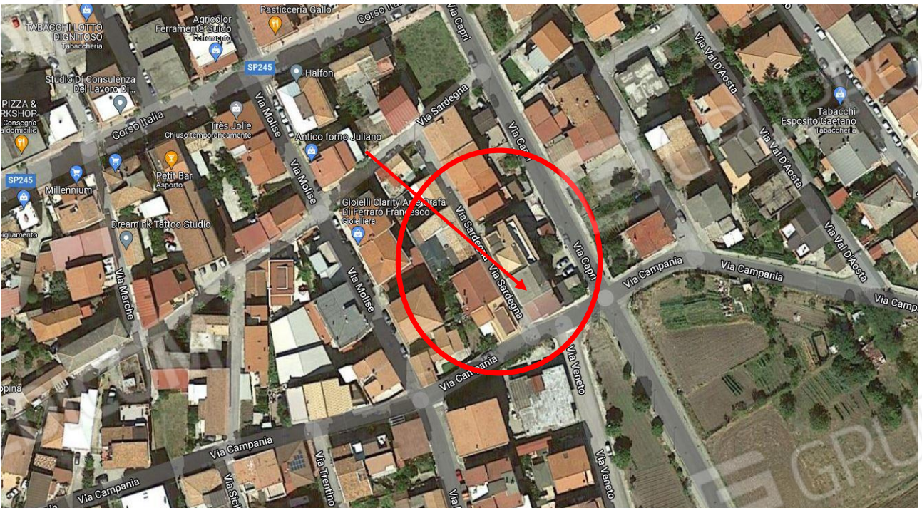
Immagine n.2: foto aerea con vista ravvicinata dell'immobile di interesse (fonte google maps)