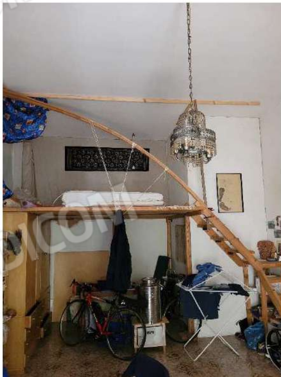
Camera da letto 1