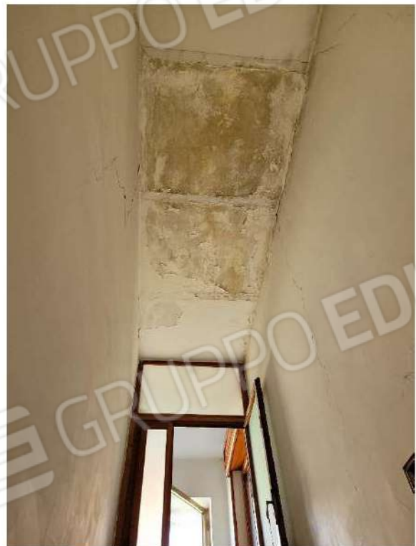
Particolare copertura vano scala