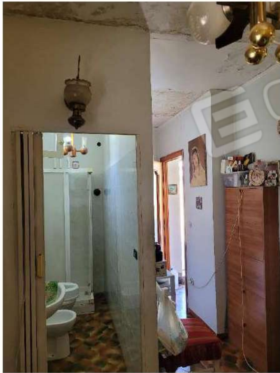
Ingresso al WC