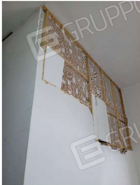
Particolare camera da letto 2