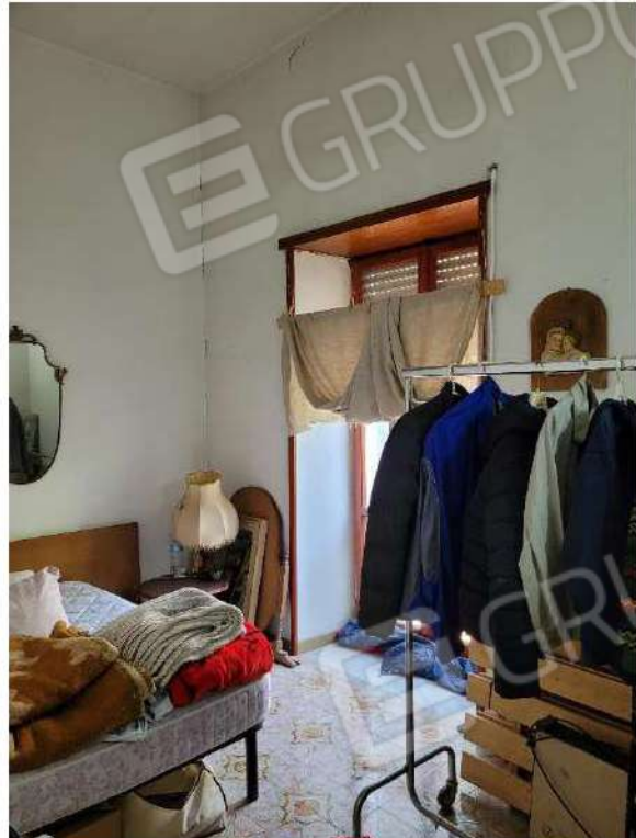
Camera da letto 2