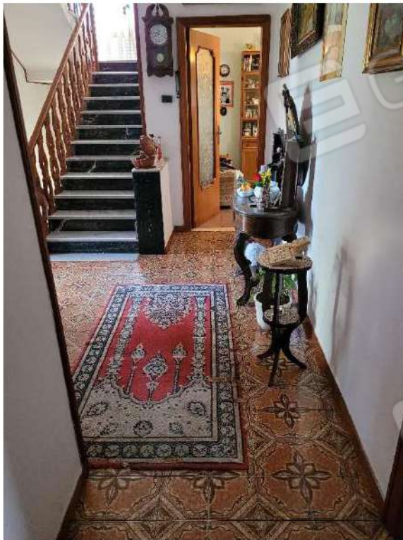
Scala e disimpegno