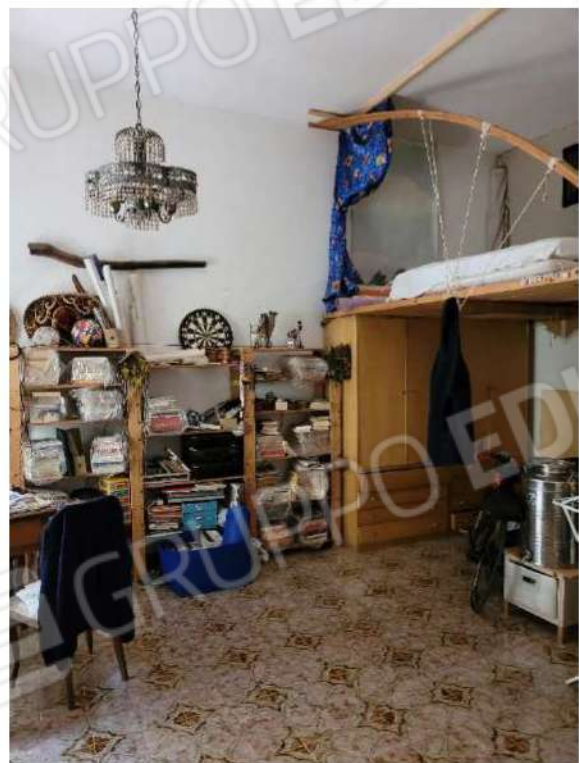
Camera da letto 1