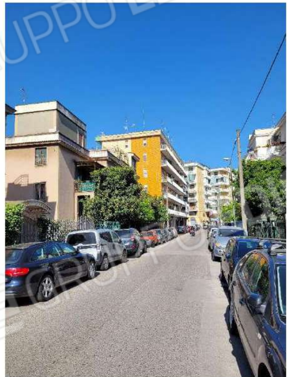
Vista Carlo de Marco