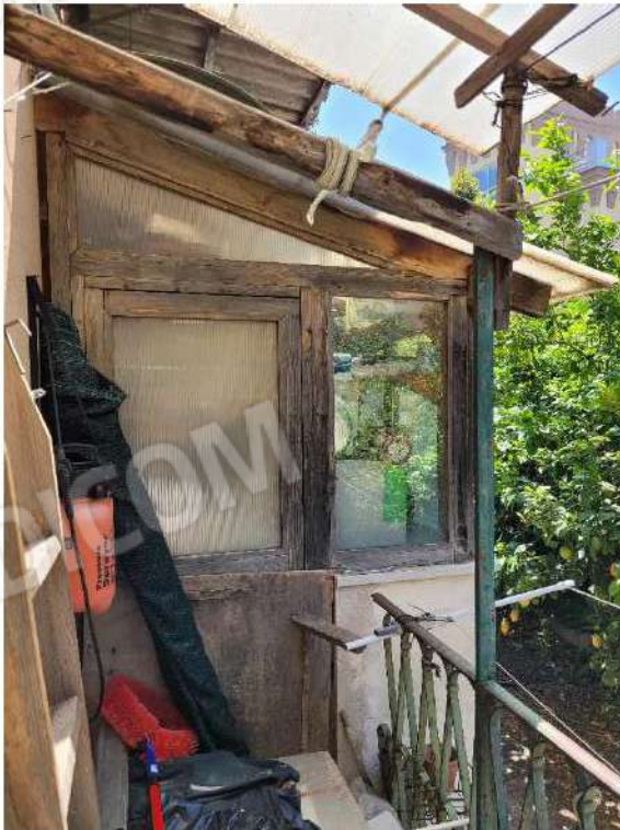
Vano verandato - cucina