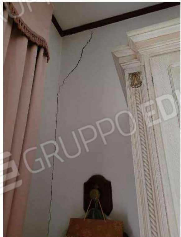
Particolare camera da letto