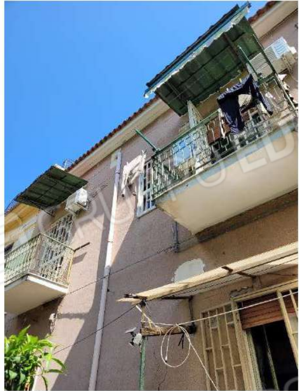
Facciata sul retro