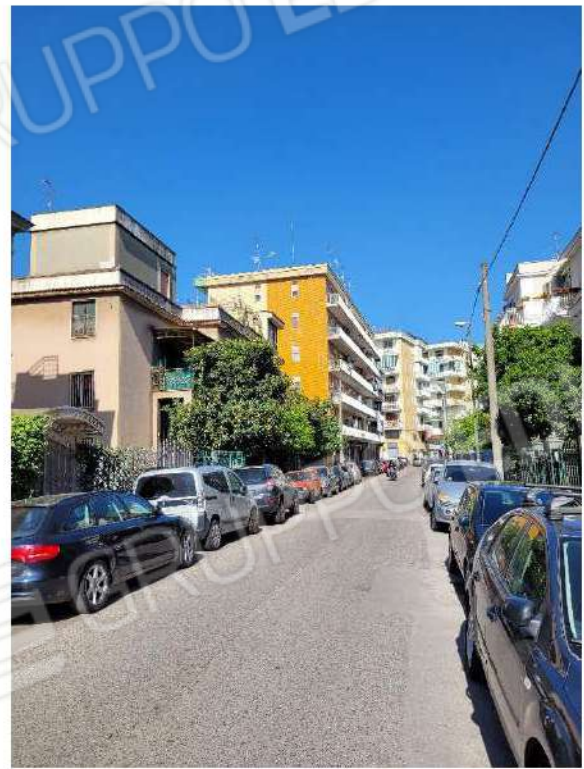
Vista Carlo de Marco