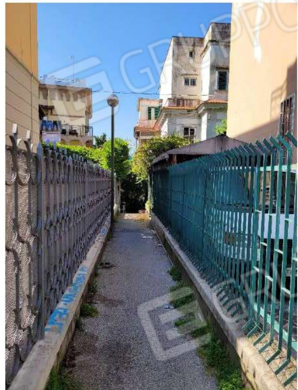
Strada pedonale che costeggia la costruzione pignorata