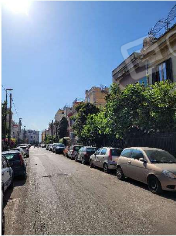
Vista Carlo de Marco