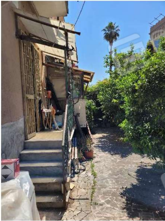
Ingresso dal retro