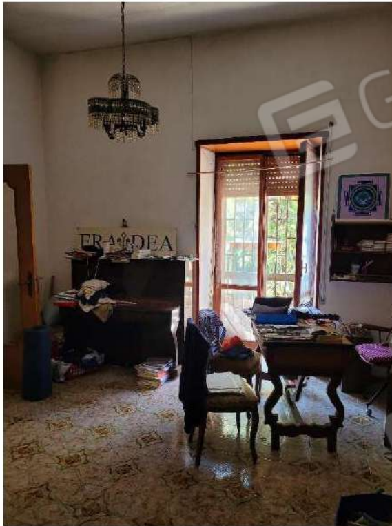
Camera da letto 1