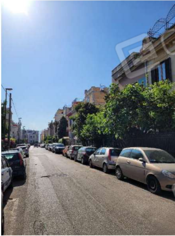
Vista Carlo de Marco