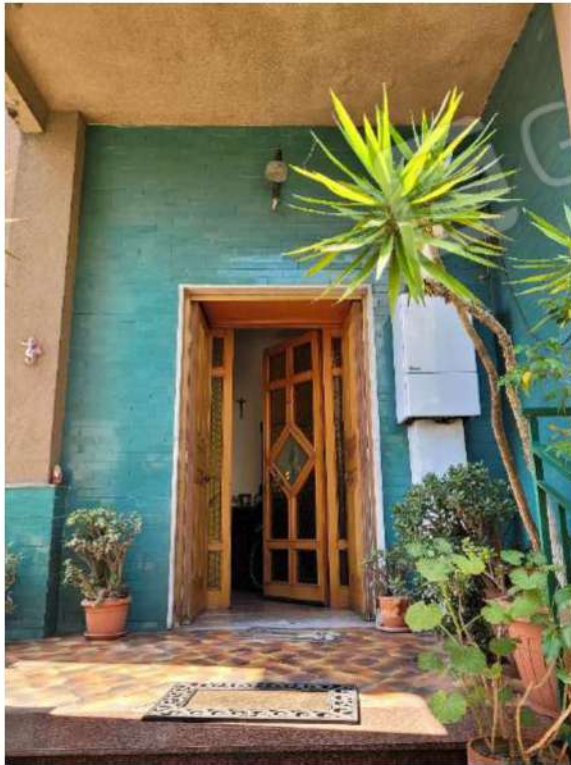
Terrazzo di ingresso sul fronte principale