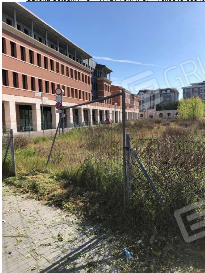
Foto 7- confine lato ovest

Galleria Cotoigni n° 3 – 47121 Forlì (FC) – Tel.0543-033402 fax 0543-031250 Mail: stpadovano@libero.it