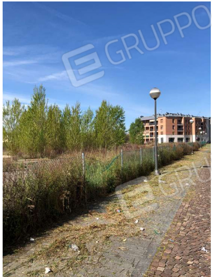
Foto 6- confine lato nord