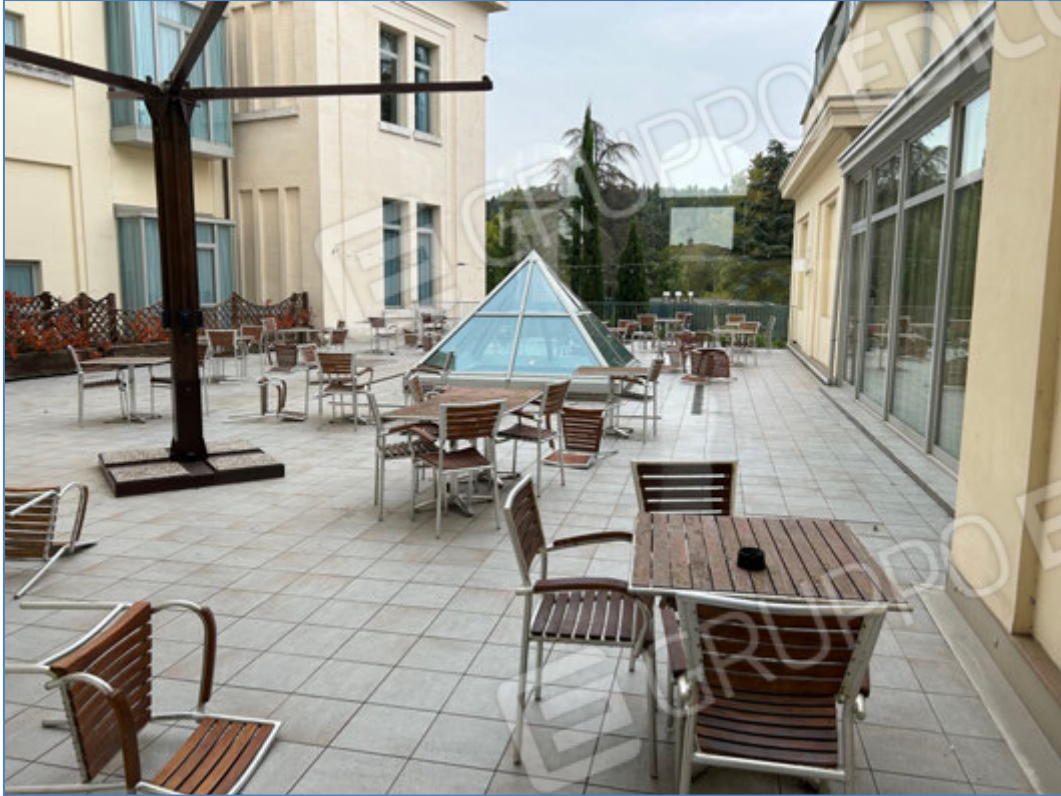
Hotel - Terrazzo