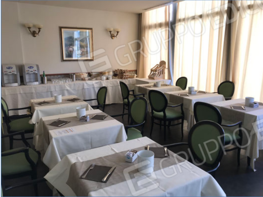
Interni dell'hotel - Seconda sala da pranzo