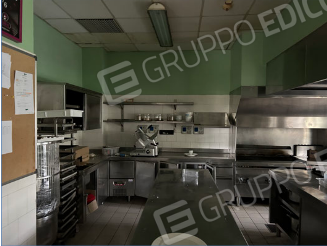
Interni dell'hotel - Cucina