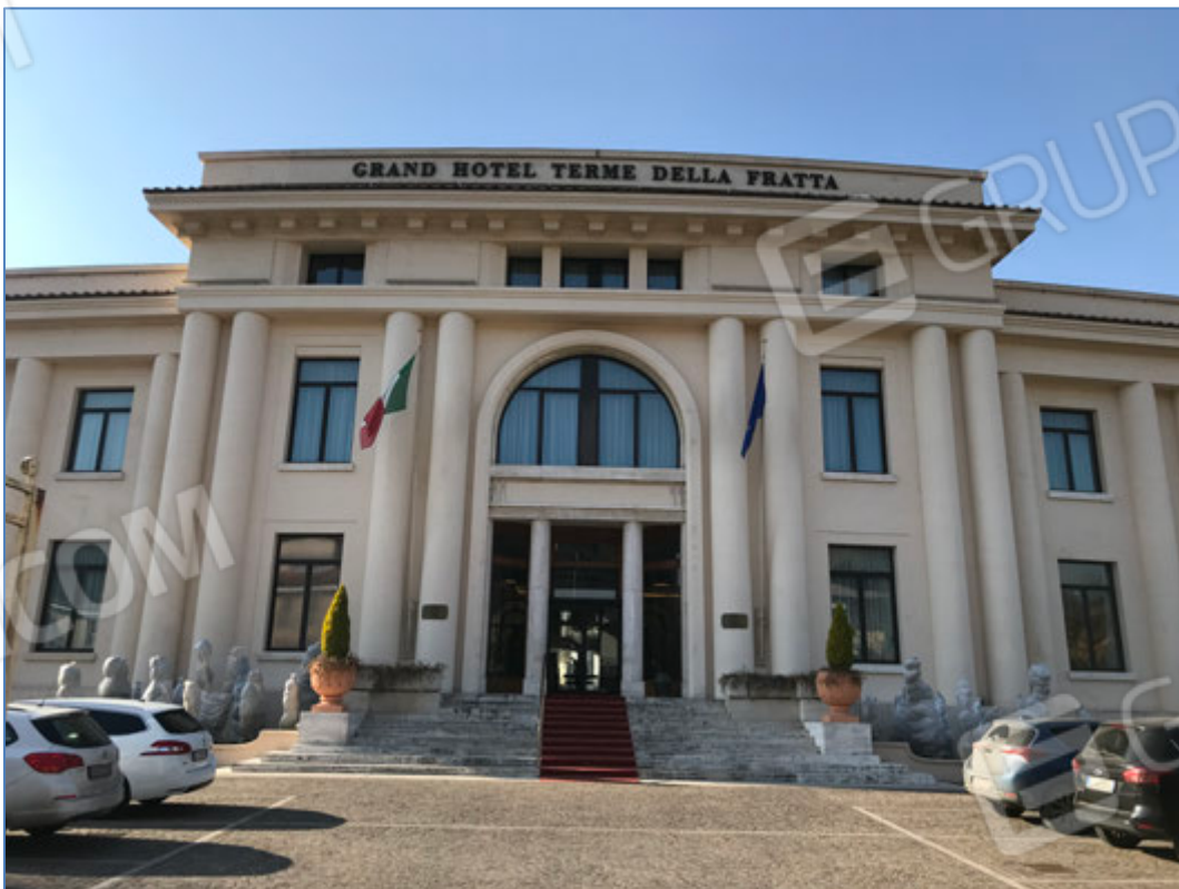
Fronte principale dell'hotel