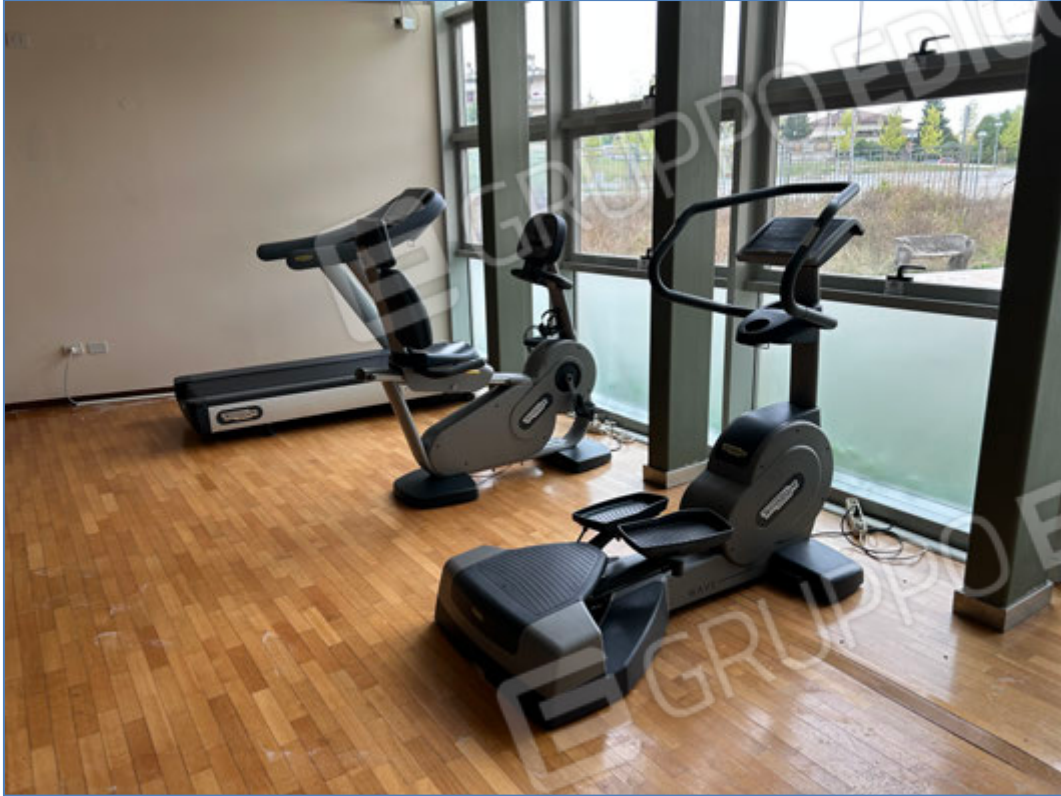
Interni dell'hotel - Palestra