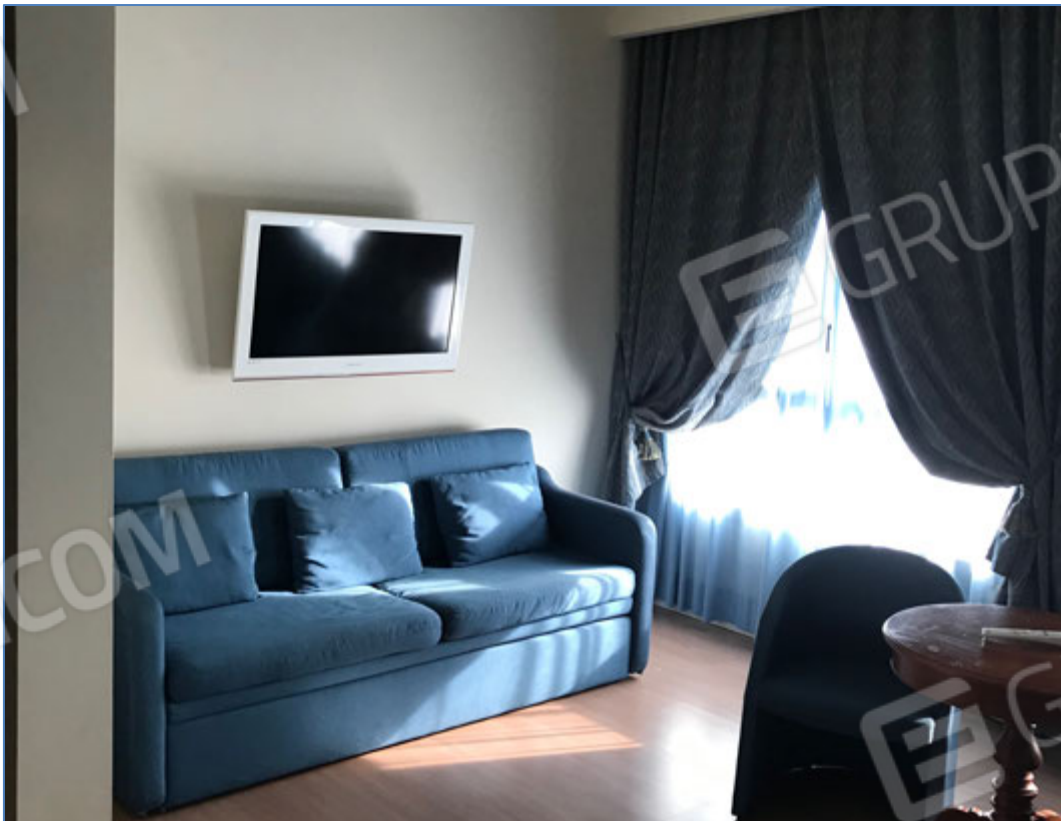
Interni dell'hotel - Camera tipo