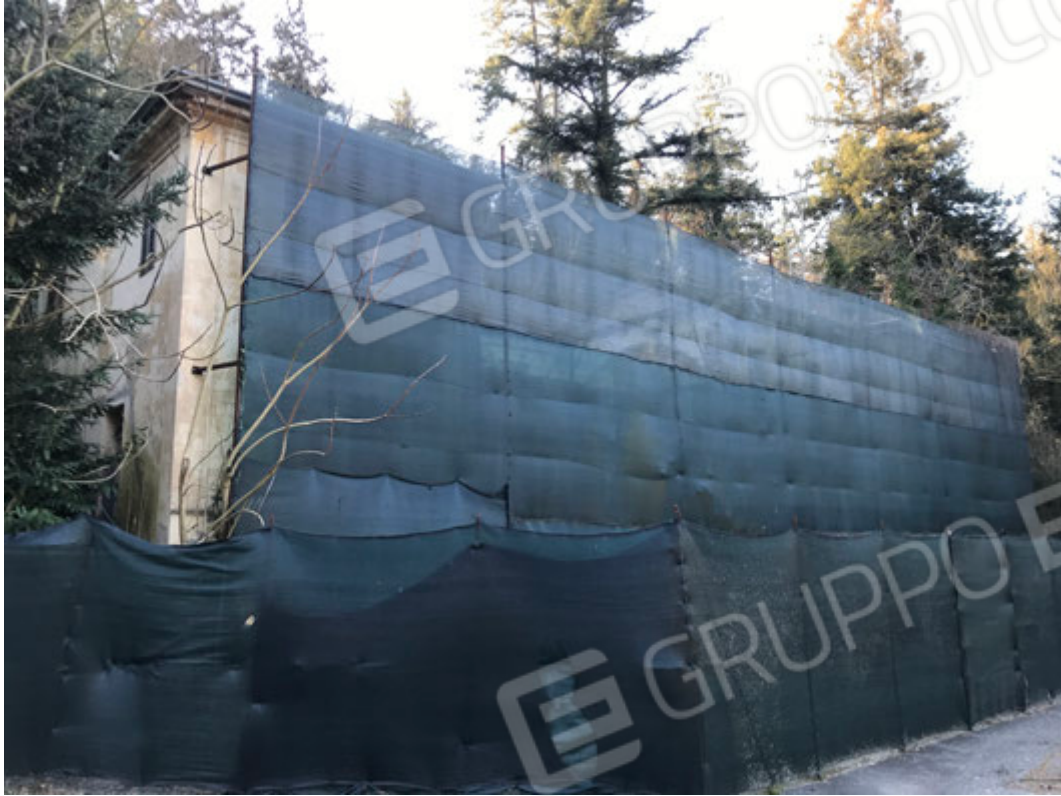
Parco - Ex Palazzina Ufficiali