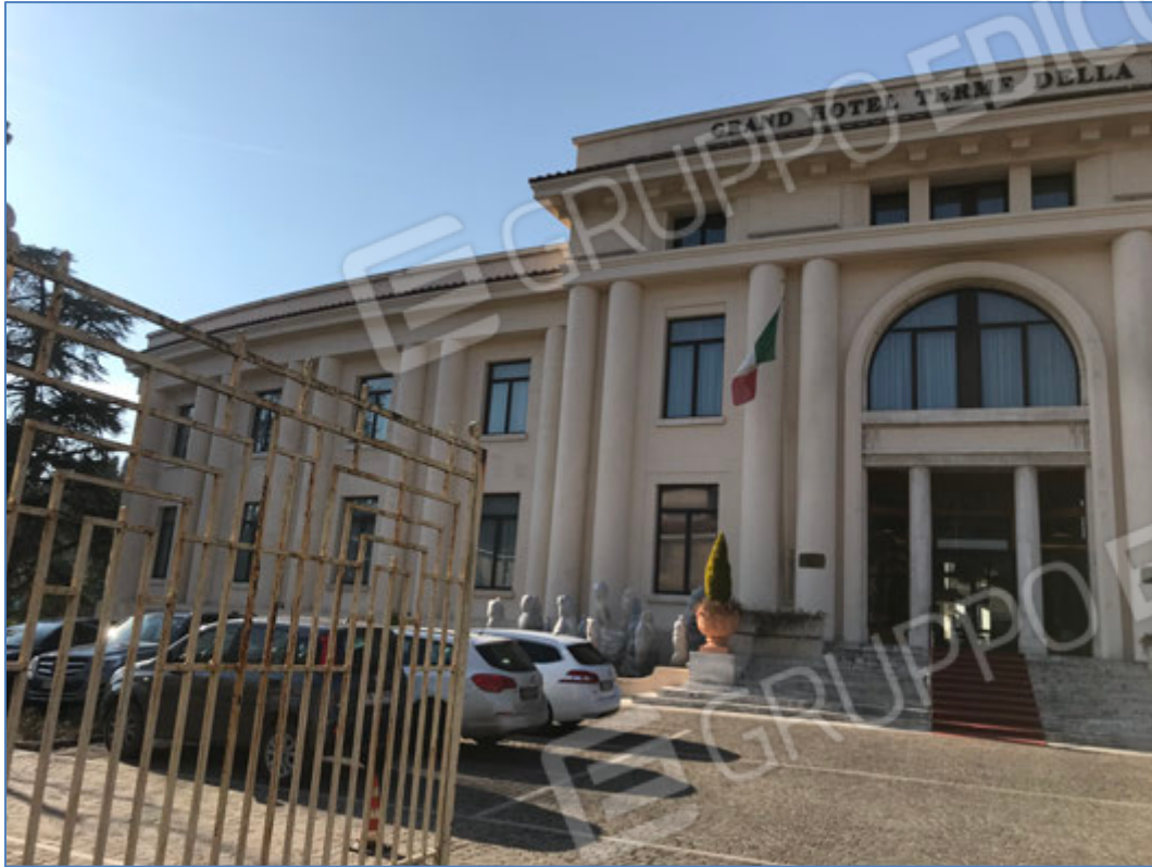
Fronte principale dell'hotel