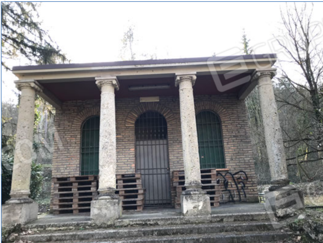
Parco - Ex bar