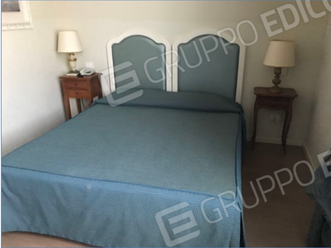
Interni dell'hotel - Camera tipo