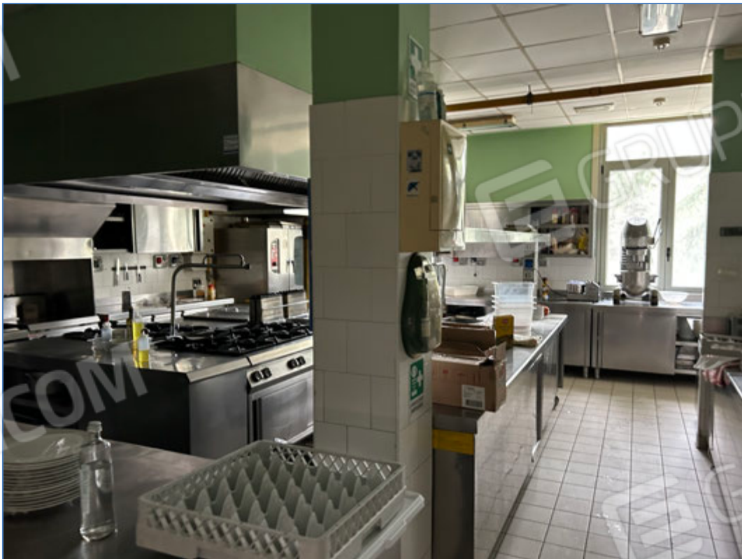
Interni dell'hotel - Cucina