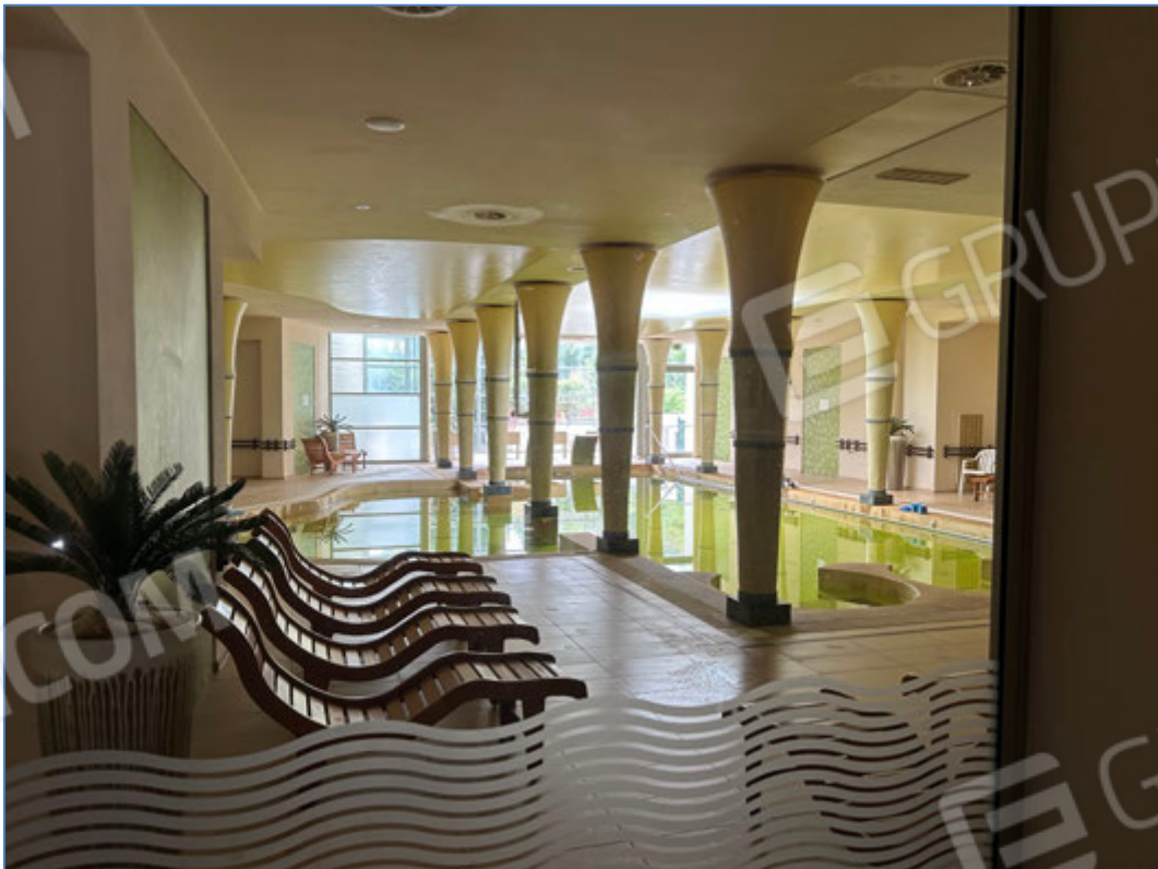
Interni dell'hotel - Centro benessere