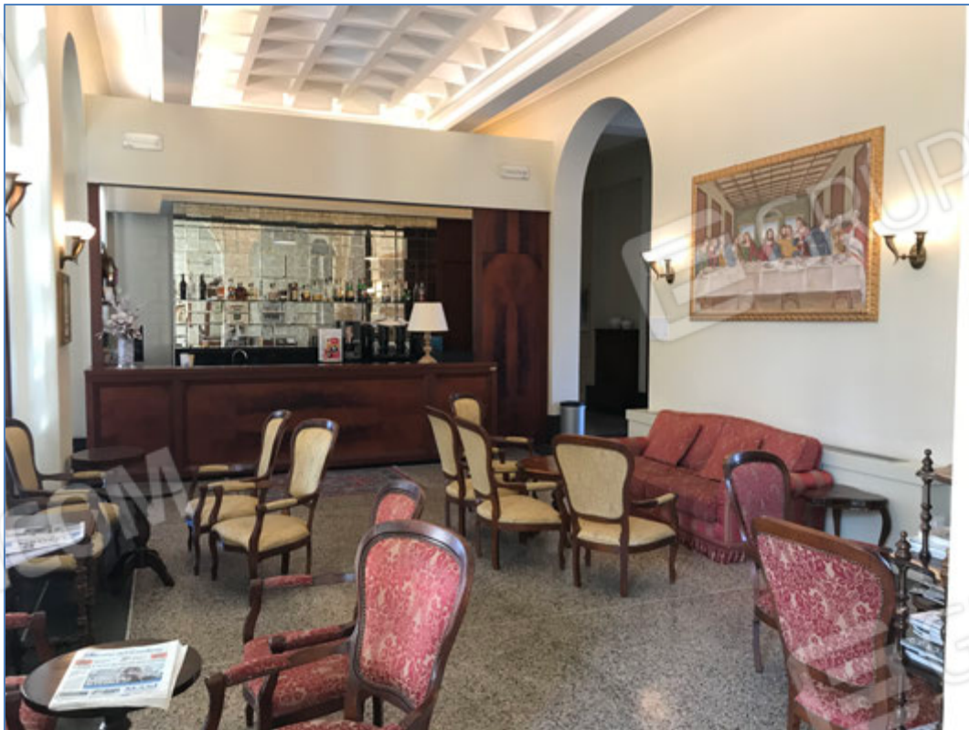
Interni dell'hotel - Zona bar