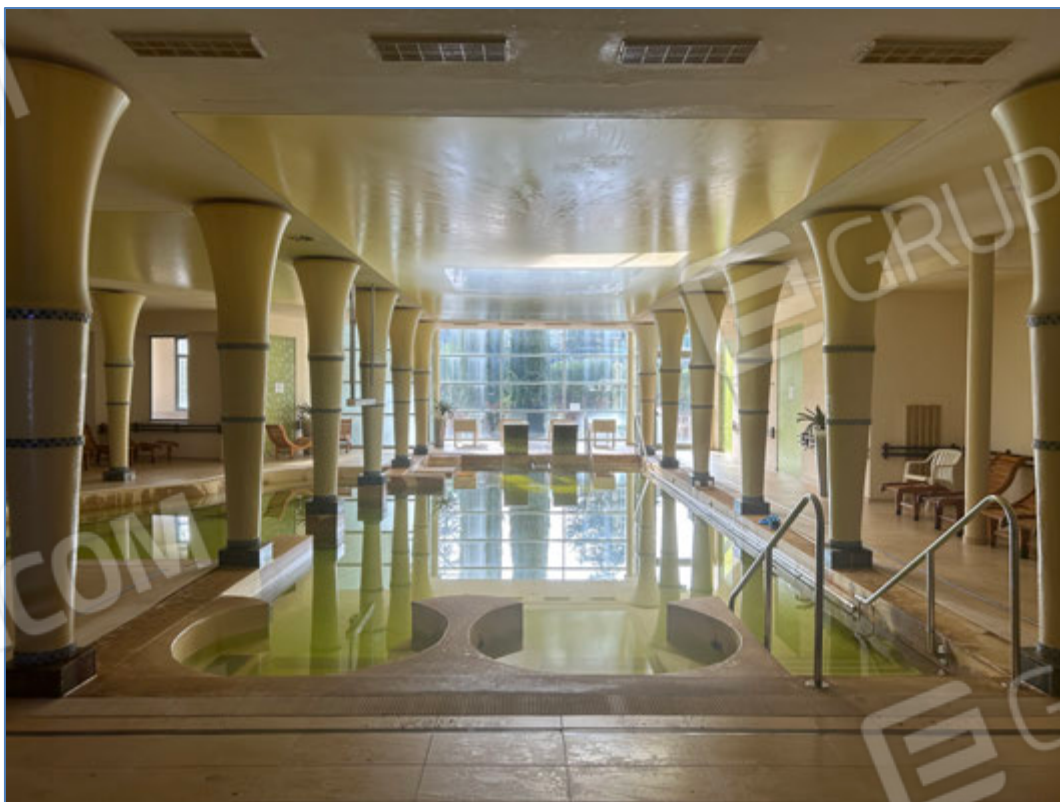
Interni dell'hotel - Centro benessere