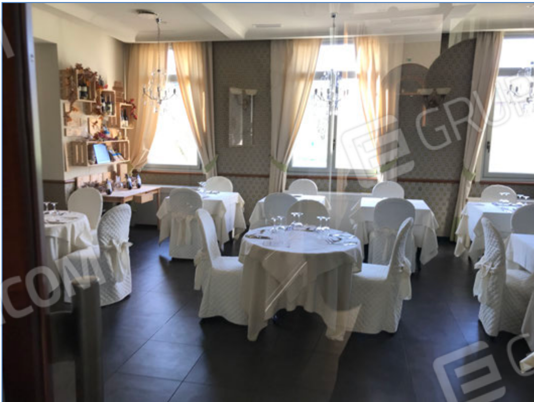
Interni dell'hotel - Sala da pranzo