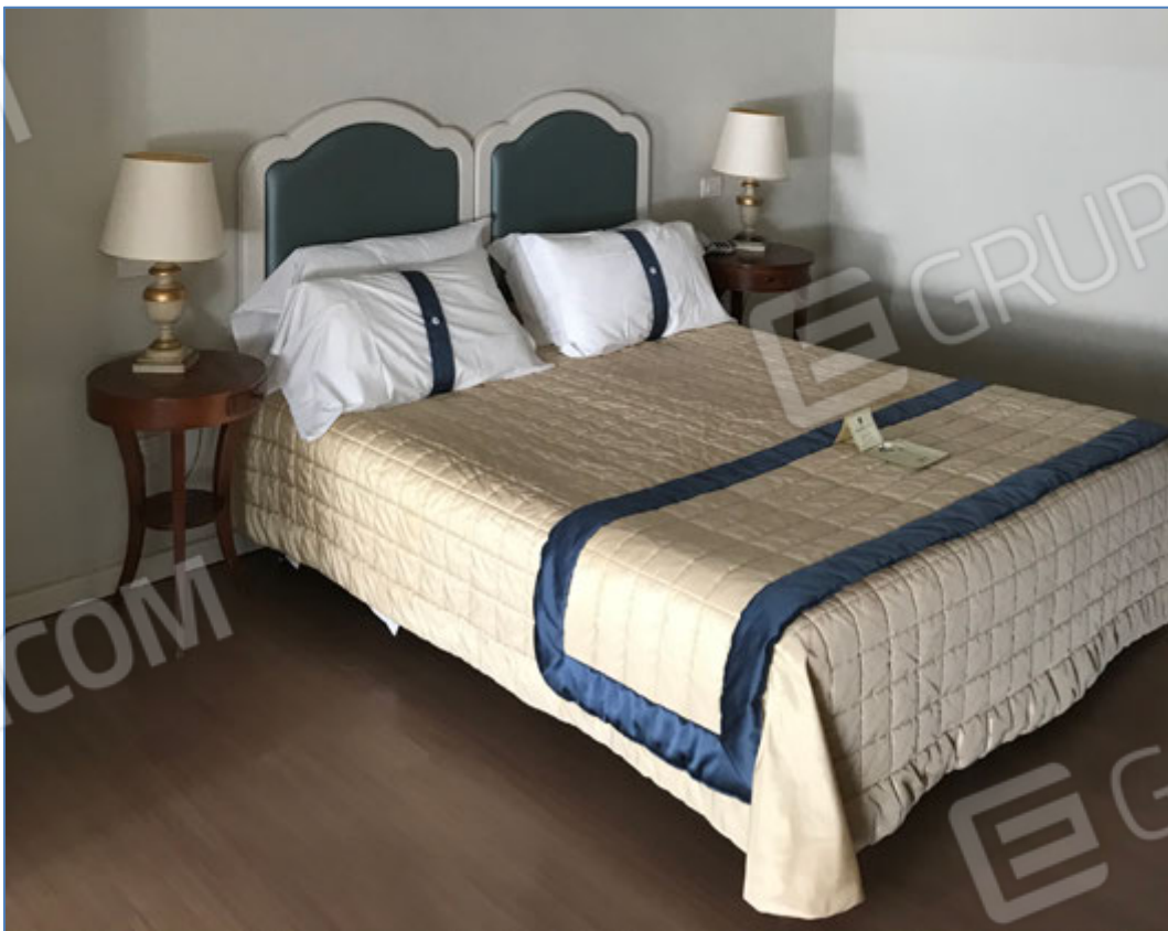
Interni dell'hotel - Camera tipo