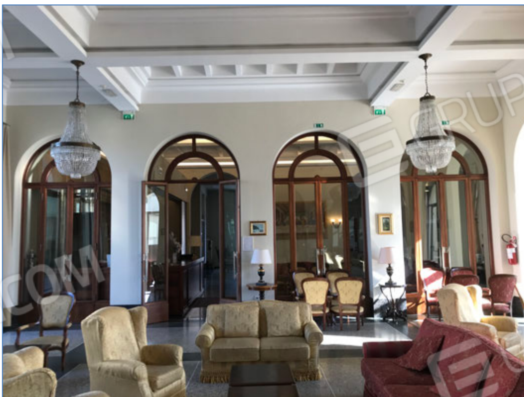
Interni dell'hotel - Salotto