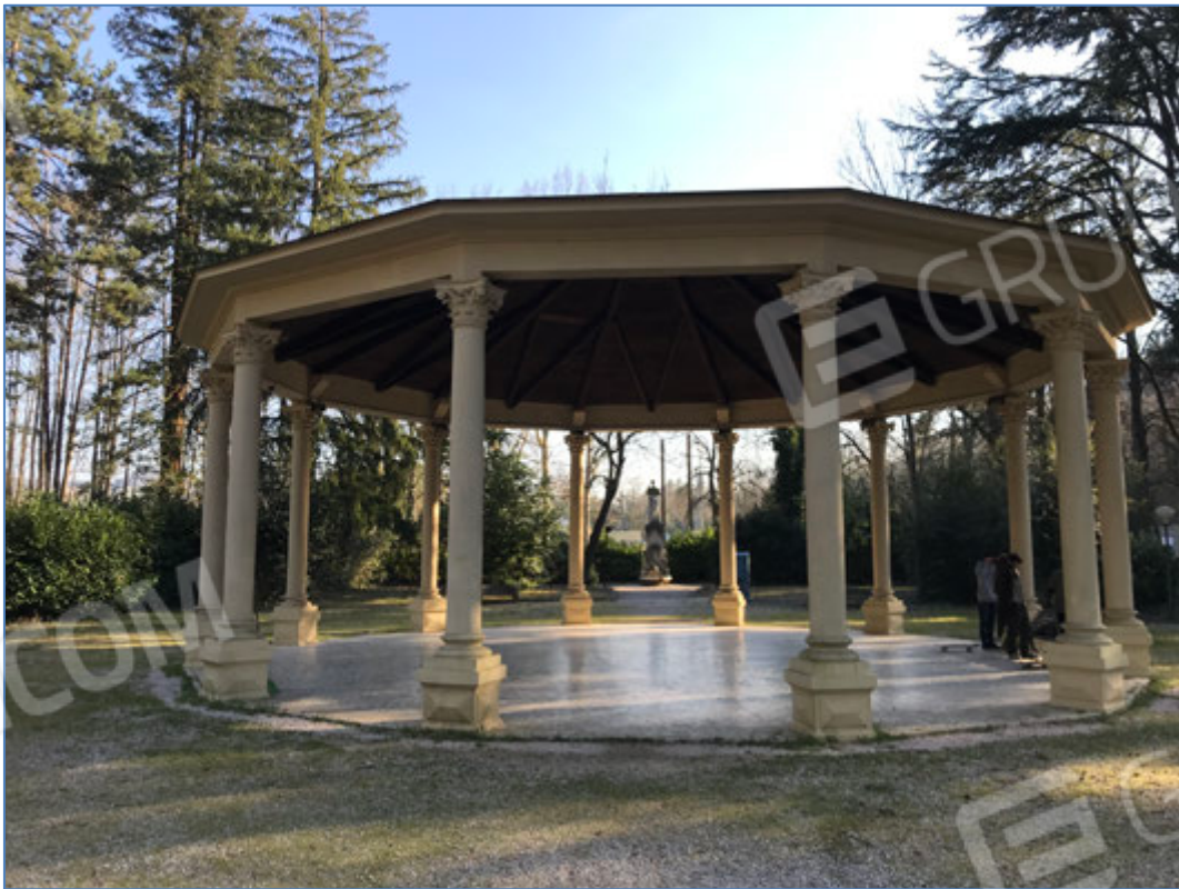
Parco - Pista da ballo