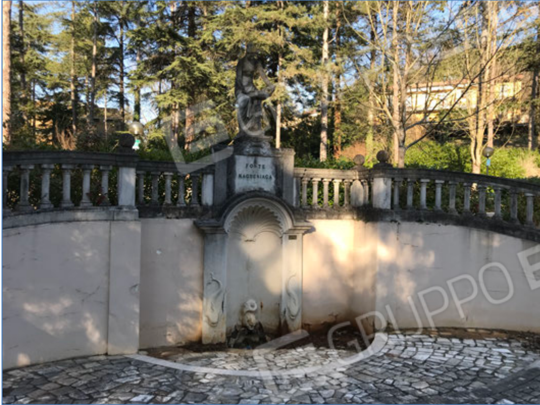
Parco - Una delle fonti