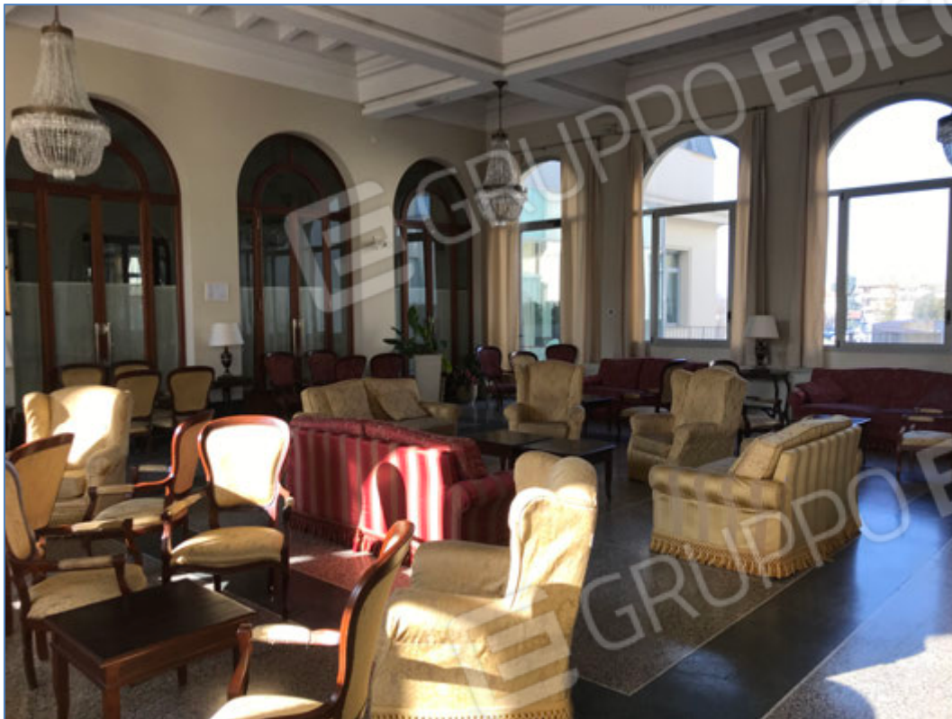
Interni dell'hotel - Salotto