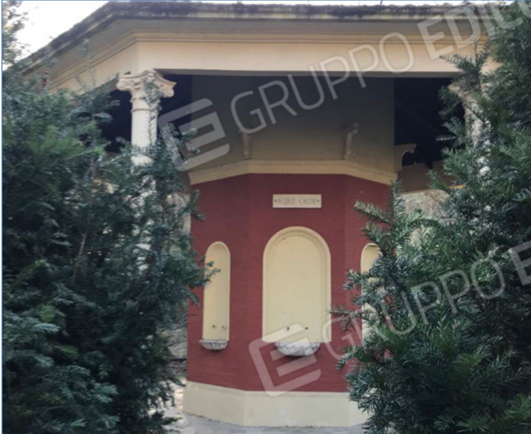
Parco - Ex chiosco dell'acqua calda