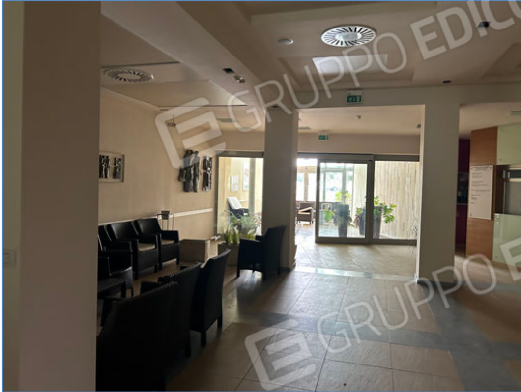
Interni dell'hotel - Centro benessere