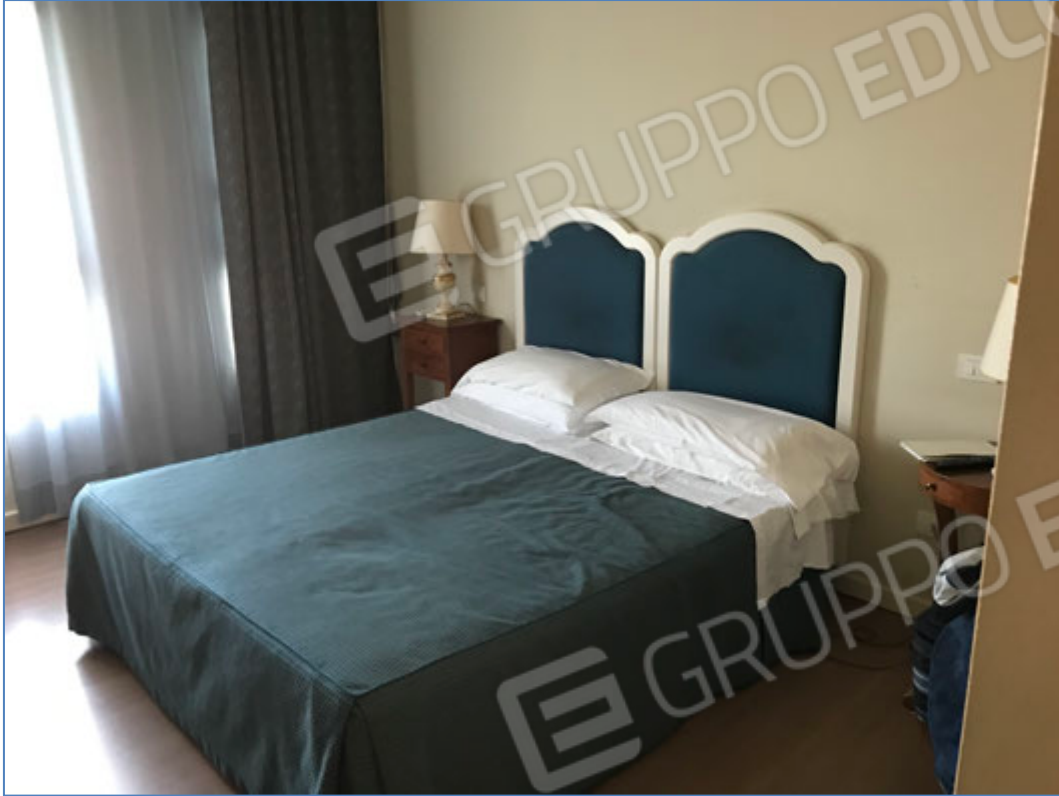
Interni dell'hotel - Camera tipo