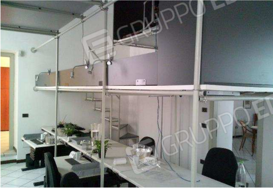
VISTA ABITAZIONE SUB. 36