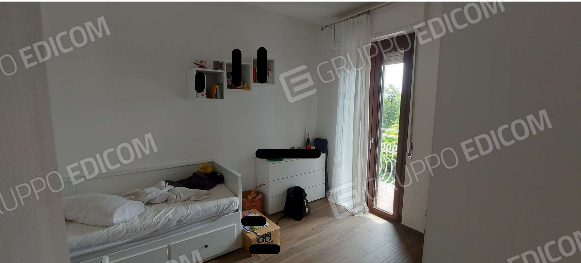
CAMERA LETTO "f"