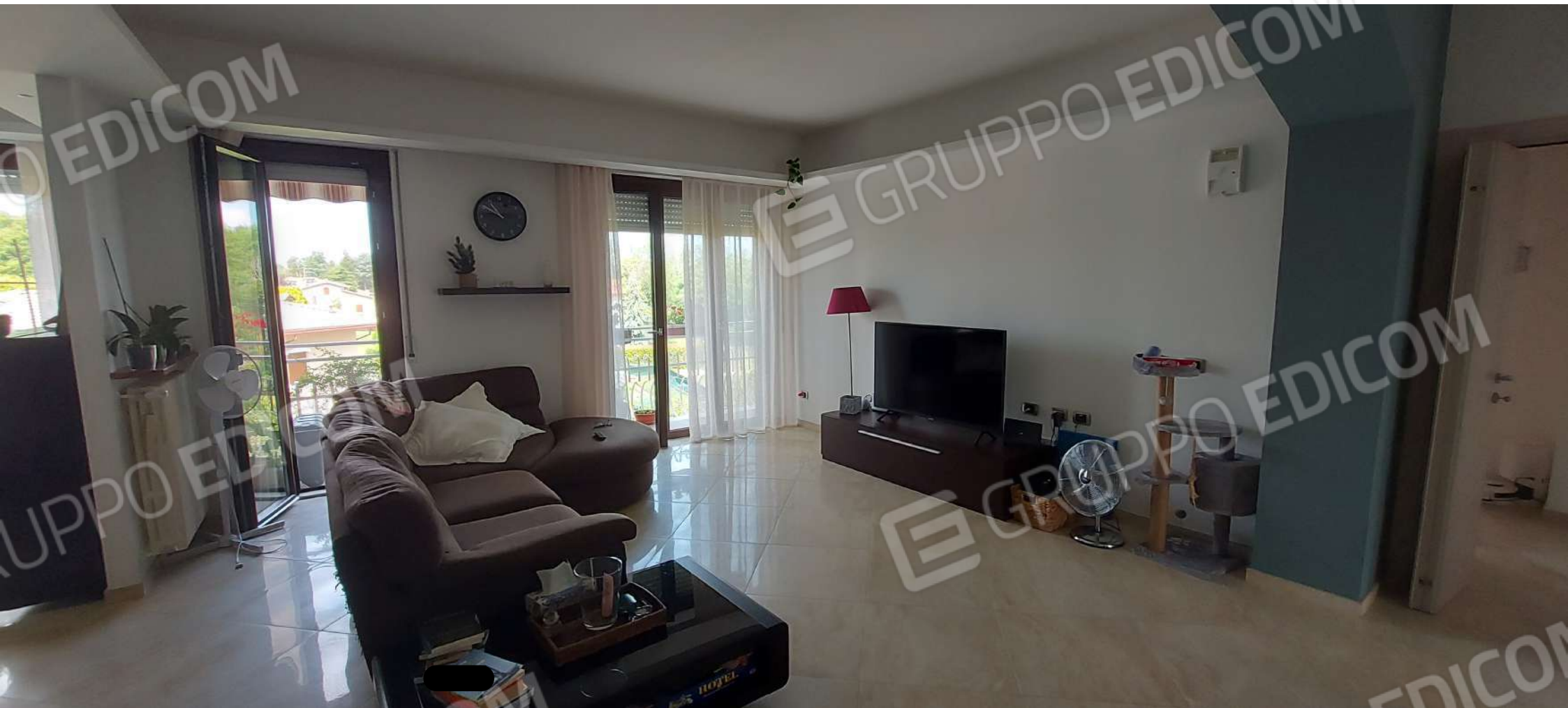
SOGIORNO PRANZO "a"