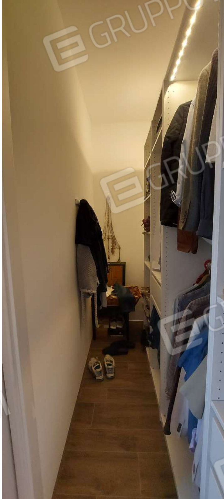
CABNA ARMADIO "d"