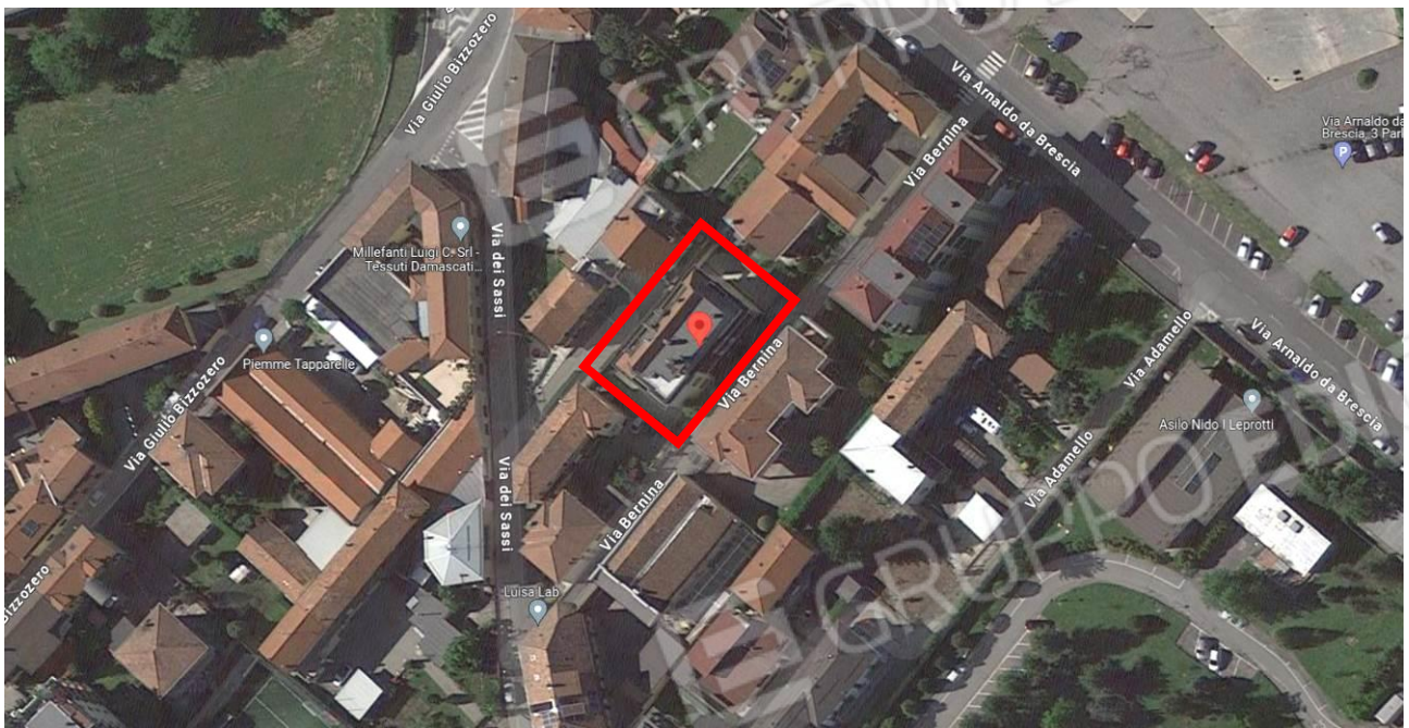
Viste aeree con localizzazione / identificazione della palazzina cui appartiene la u.i. oggetto di procedura / stima