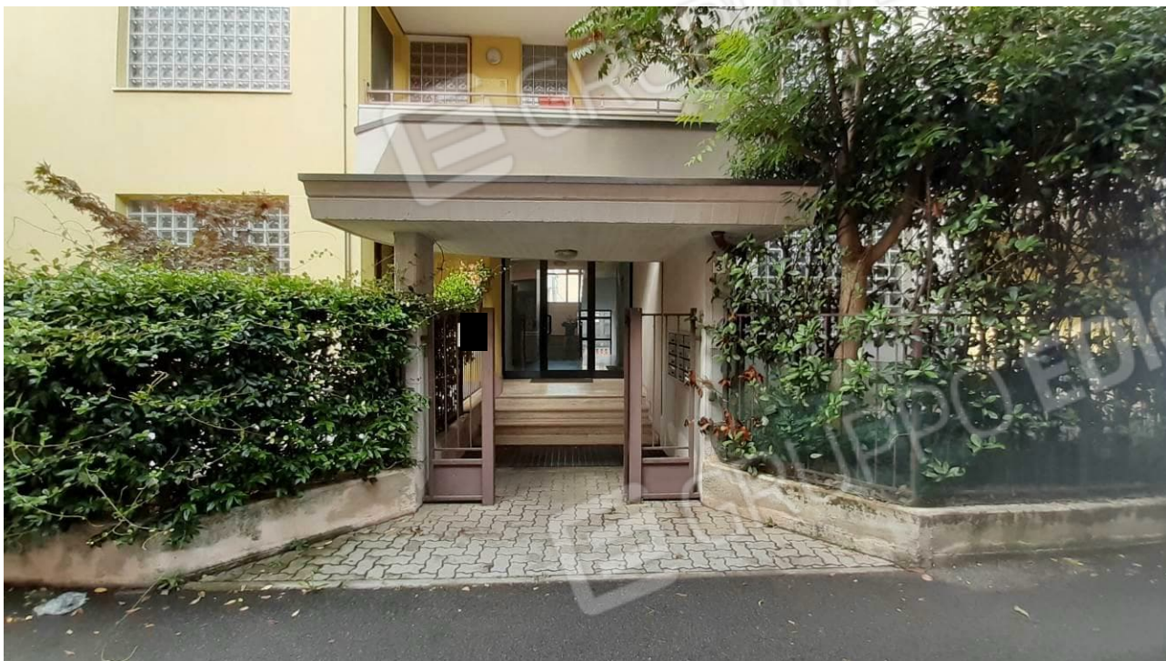
Vista dell'accesso pedonale, su via Bernina, della palazzina cui appartiene la u.i. oggetto di procedura / stima