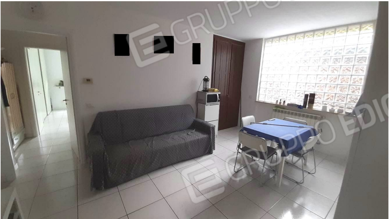
Viste interne della u.i. oggetto di stima: soggiorno / pranzo con angolo cottura