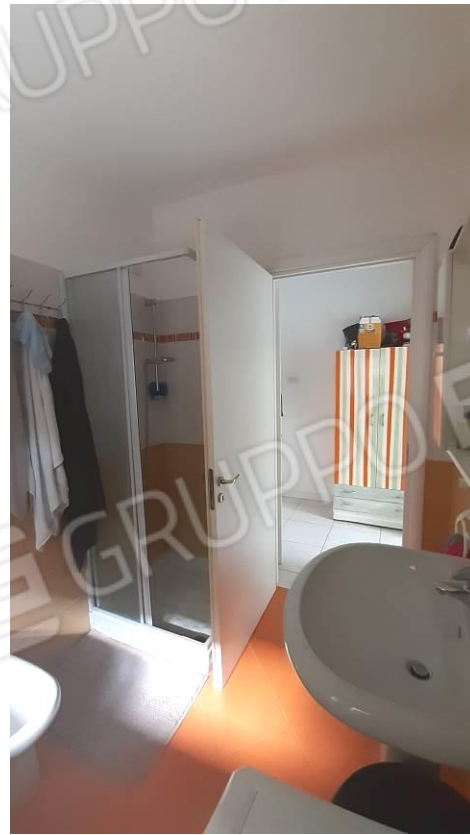
Viste interne della u.i oggetto di stima: bagno completo e camera da letto