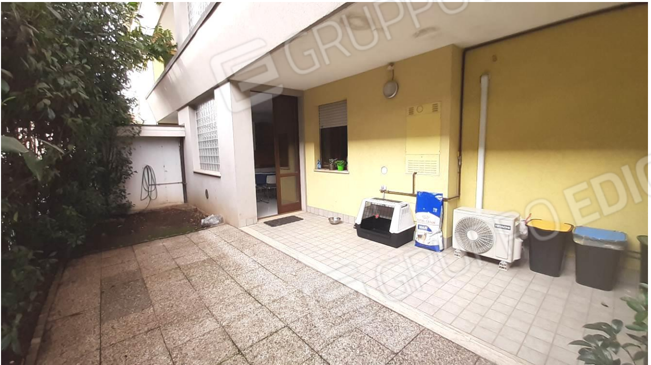
Viste esterne della u.i oggetto di stima: loggiato ed area esclusiva