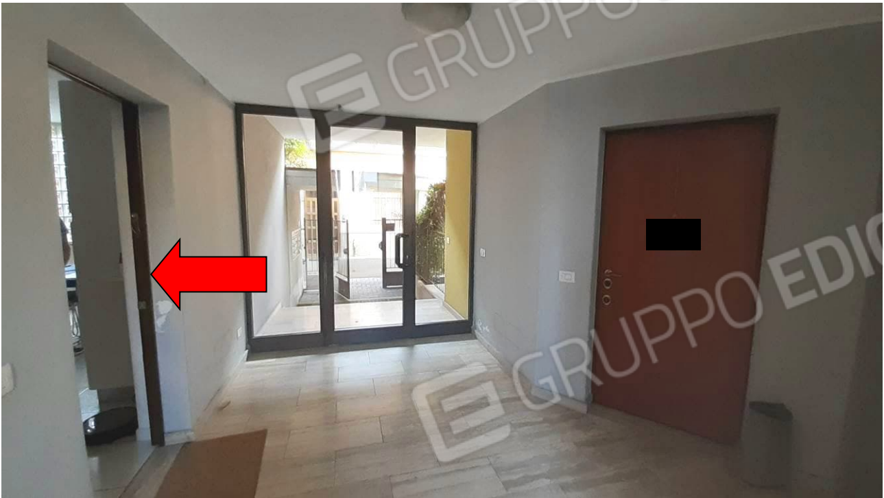
Viste atrio comune del vano scala, piano rialzato, con identificazione dell'ingresso alla u.i. oggetto di stima