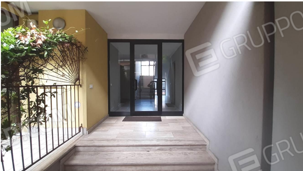
Vista dell'accesso al corpo scala della palazzina cui appartiene la u.i. oggetto di procedura / stima