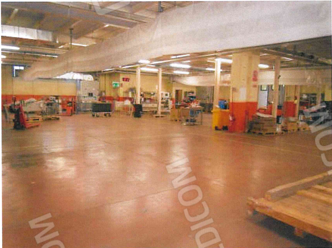
Foto 10 - Reparto packacing