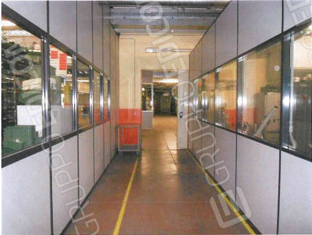
Foto 03 - Corridoi di distribuzione