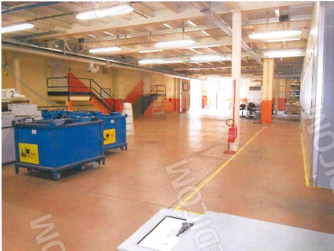
Foto 04 – Reparto trancia (da catasto) con vista sulle scale verso gli uffici