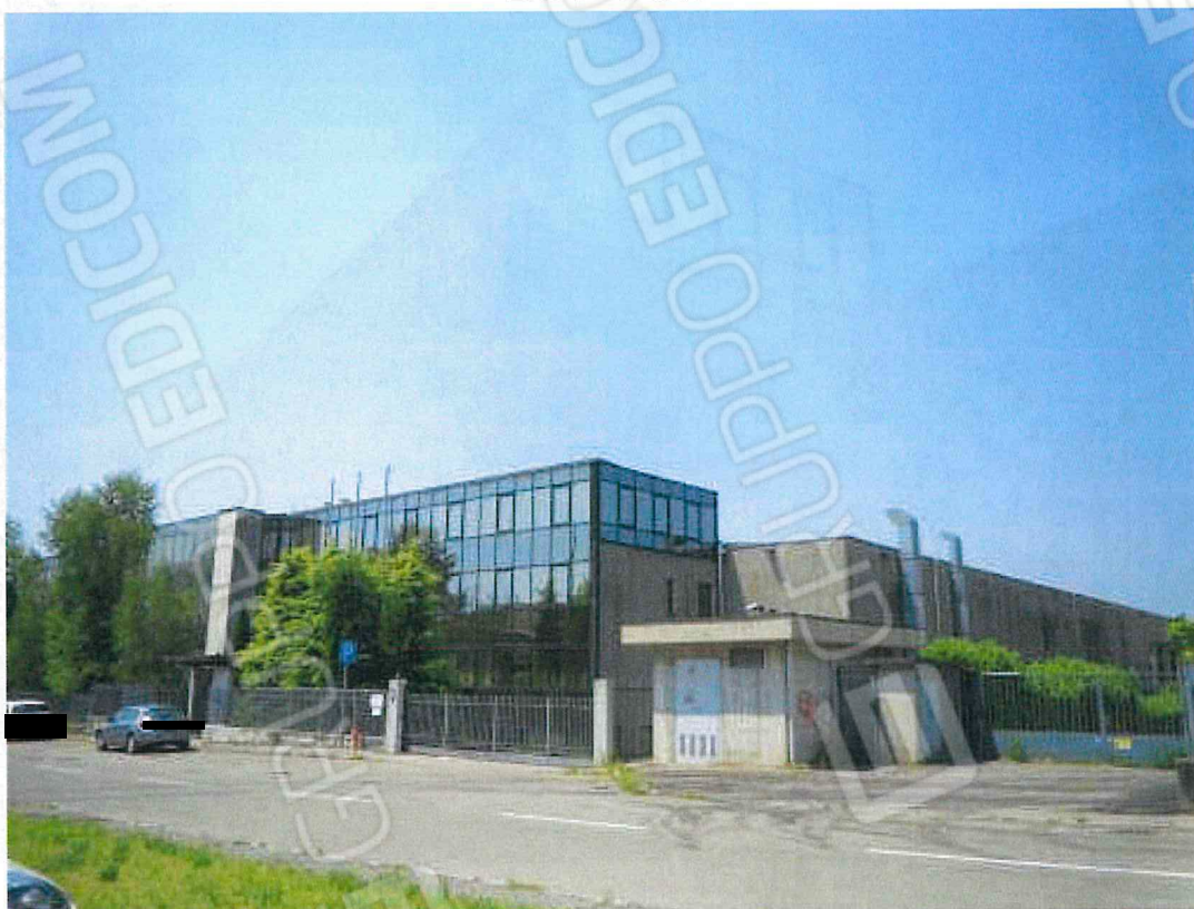
Foto 01 – L'angolo Est con il corpo uffici vetrato e la produzione