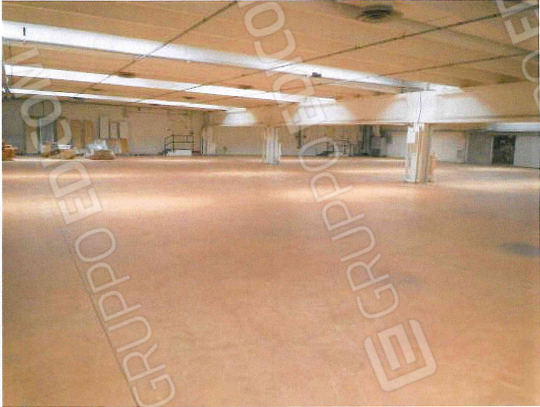
Foto 03 - Lo spazio al piano primo verso le scale di accesso agli uffici piano primo