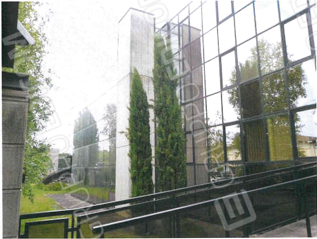
Foto 11 - Il prospetto uffici di Sud-Est verso via Olona