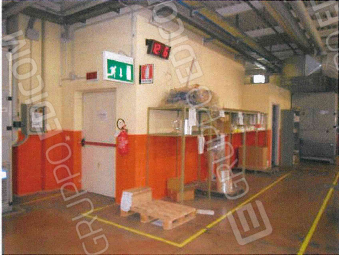
Foto 11 - Reparto packacing il corpo scala e wc