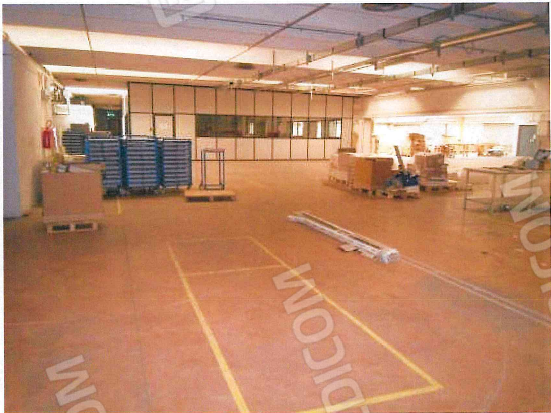
Foto 10 - I reparti ala Sud-Ovest varie viste