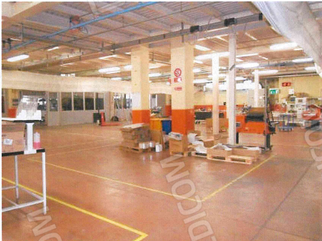
Foto 12 - Reparto packacing