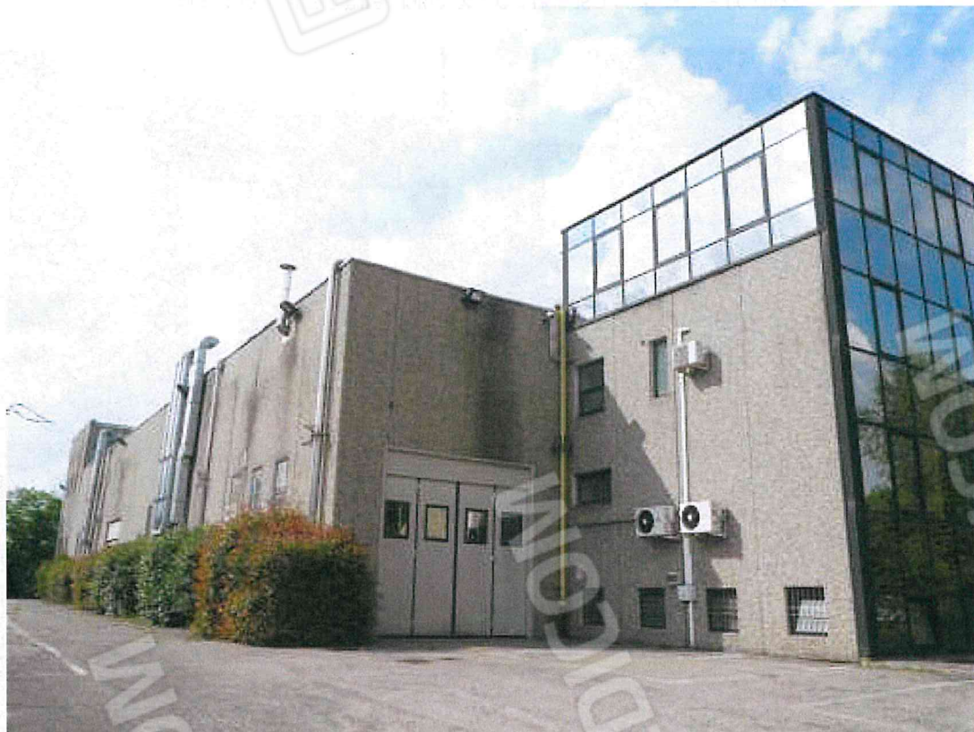
Foto 04 - L'angolo Sud verso il corpo produzione