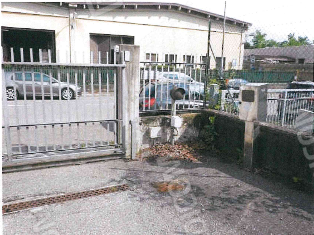
Foto 12 - Alcuni impianti agli ingressi su strada