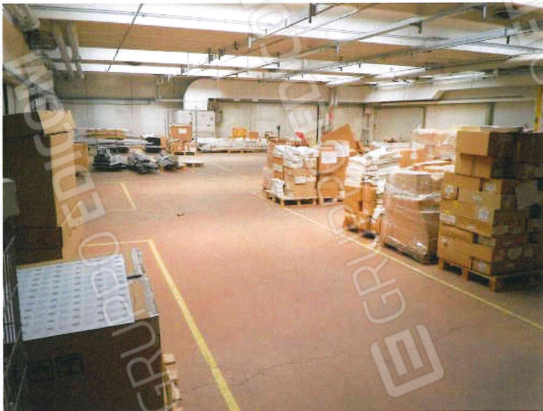
Foto 11 - I reparti ala Sud-Ovest varie viste