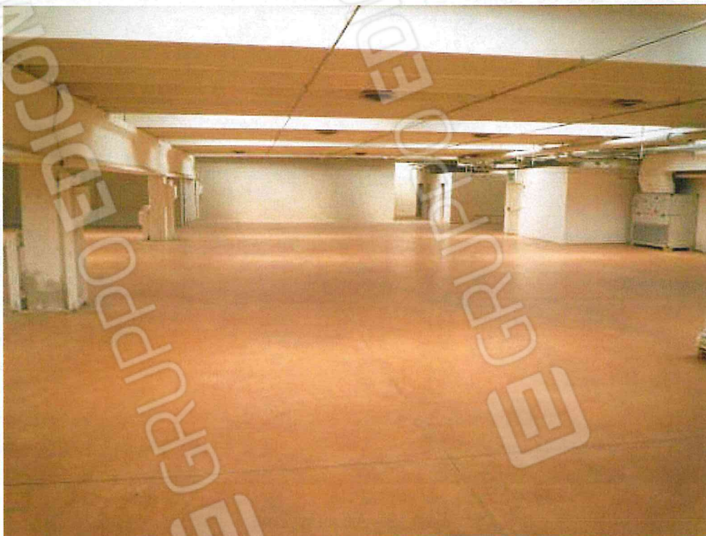
Foto 01 – Lo spazio al piano primo, sul fondo il muro confinante con lo spazio a tutta altezza