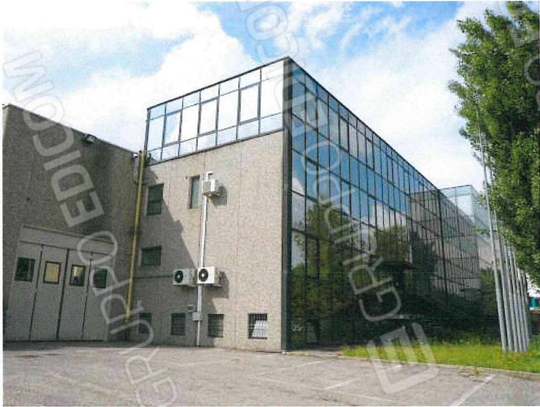
Foto 03 - L'angolo Sud verso il corpo uffici