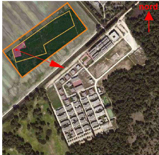
Fig.1 Aerofotogrammetico della lottizzazione con particolare della zona edificata

Il Comune di Castellana Grotte è dotato di un programma di fabbricazione e regolamento edilizio approvati con Decreto del Presidente della Giunta Regionale n° 1087 del 22 giugno 1973. La programmazione urbanistica della fascia costiera ionica del detto territorio comunale era tuttavia subordinata a successivi studi di approfondimento con varianti al p. d. f. e/o lottizzazioni convenzionate che avrebbero dovuto tener conto, dei suggerimenti e delle indicazioni contenute nei pareri della Soprintendenza ai Monumenti dello IASM e dell' Ispettorato Regionale del Corpo Forestale dello Stato, allo scopo di evitare l'alterazione di quelle aree di notevole interesse paesistico ed ecologico riscontrabili, fin da quel momento, lungo il litorale Ionico.