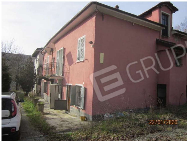
Viste da Nord-Est

Immobile al Foglio 2 p. 462 sub 1 cat A/4 classe 3 vani 10,5