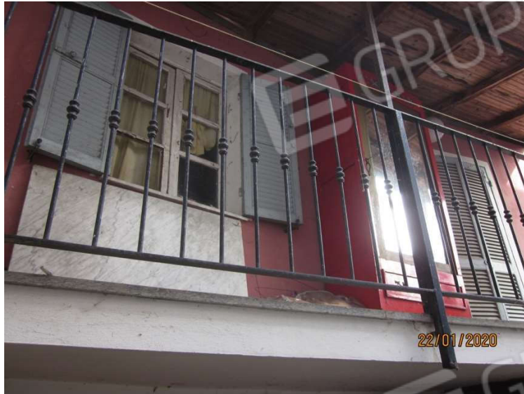
Altro ingresso al primo piano Sotto particolari della facciata Nord