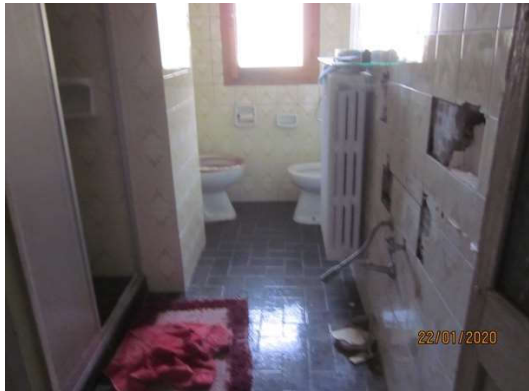
Bagni : solo al piano primo