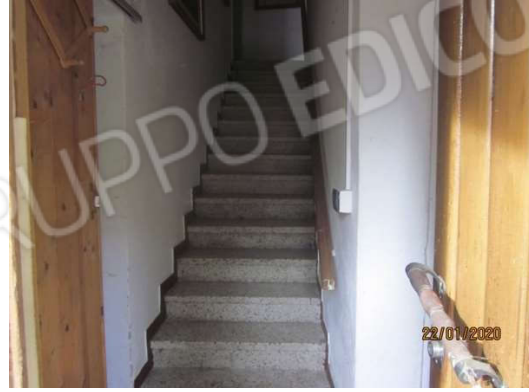
Ingresso e scala interna