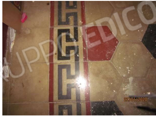
pavimenti al piano primo