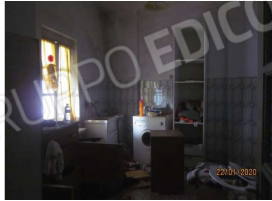
camere 4 e 5