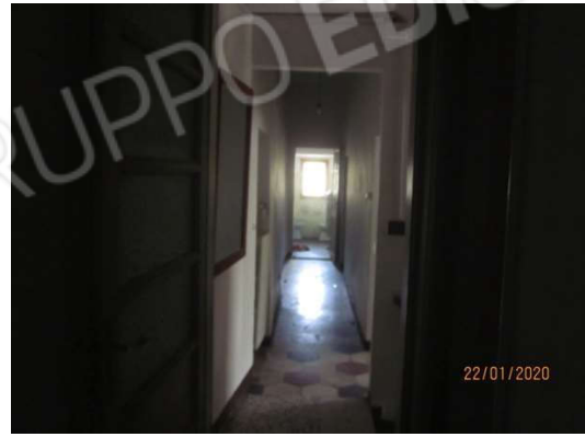
i due corridoi al piano primo