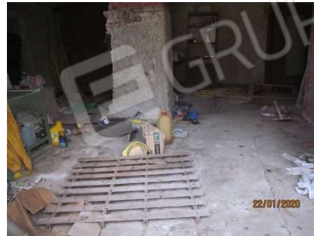
viste del grande sgombero con accesso da lato ovest vano al momento non collegato con l'abitazione