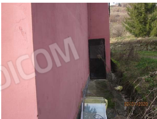
ingresso latrina e a destra finestra e ingresso cantina