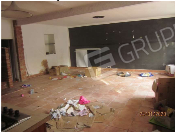
grande vano cucina-soggiorno con viste degli accessi alle cantine e al sottoscala