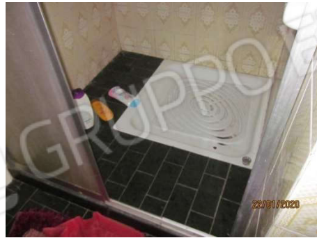
Bagno a Nord