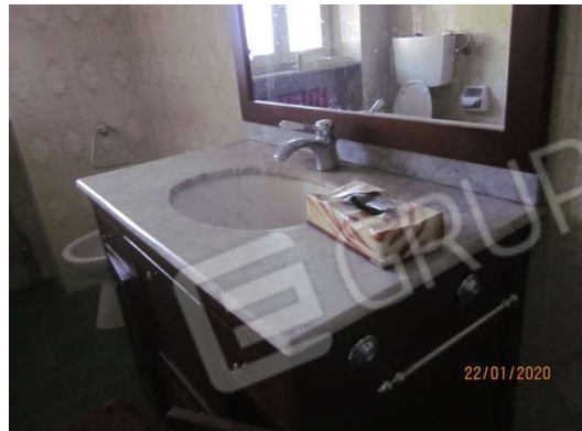
Bagno a Ovest