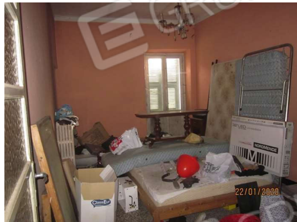
camere 2 e 3