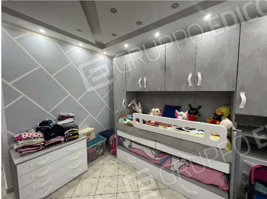
Figura 17 abitazione P1 nm. 946 camera