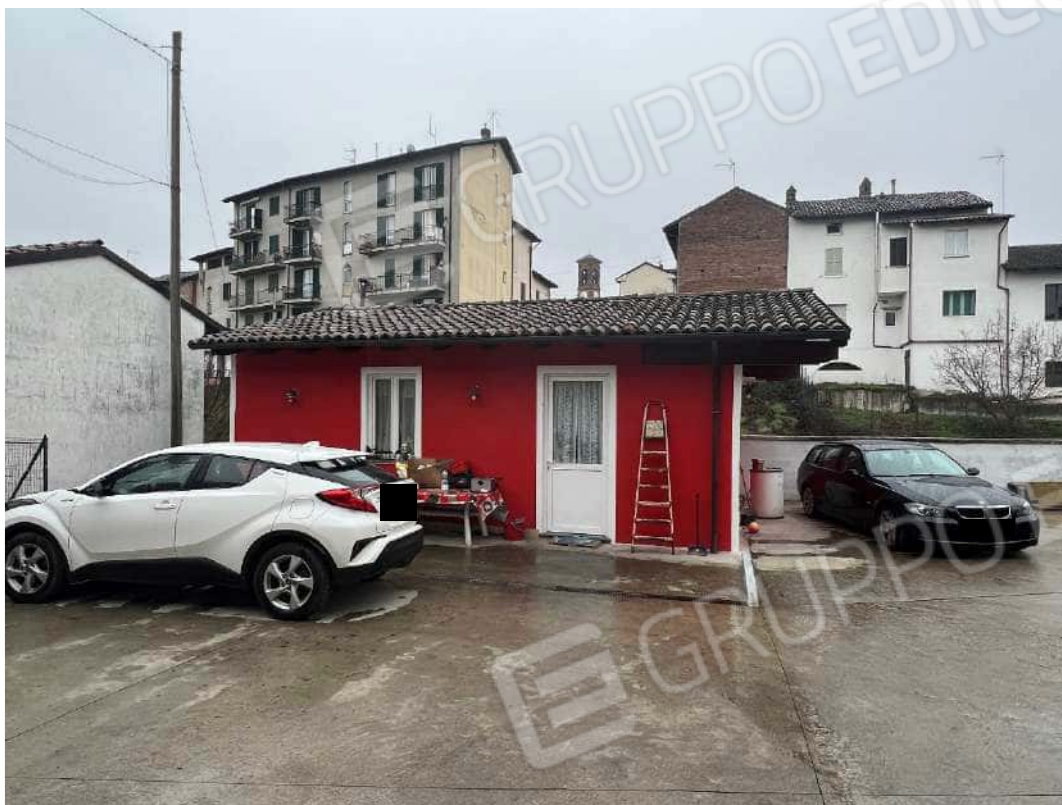
Figura 21 locale accessorio nm. 153