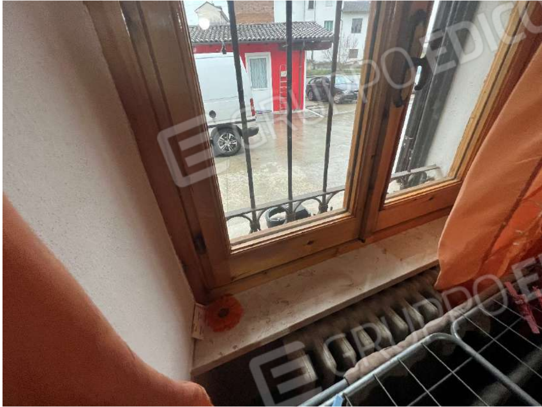
Figura 27 abitazione nm. 153 particolare infissi esterni