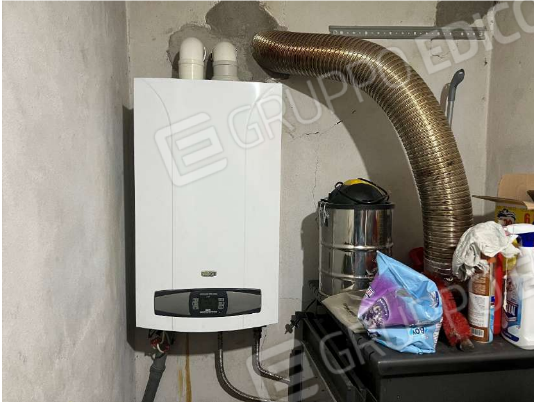
Figura 30 abitazione nm. 153 caldaia