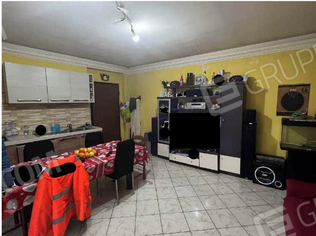
Figura 10 abitazione P1 nm. 946