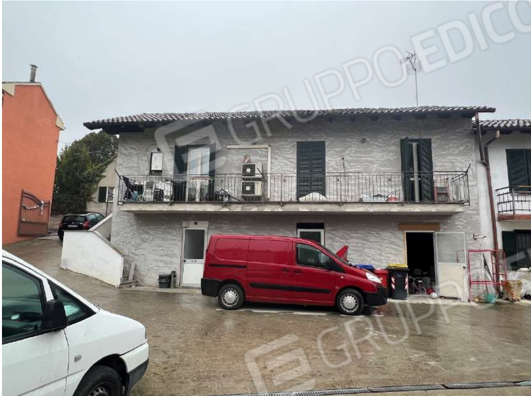
Figura 3 Abitazione nm 946 prospetto sud