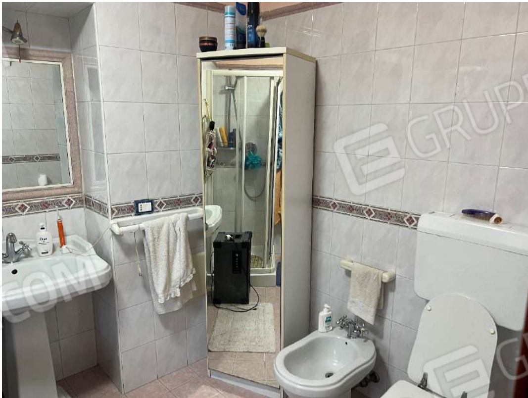
Figura 31 abitazione nm. 153 bagno P1