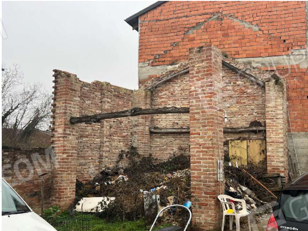
Figura 20 unità collabente posta sul sedime del nm. 946