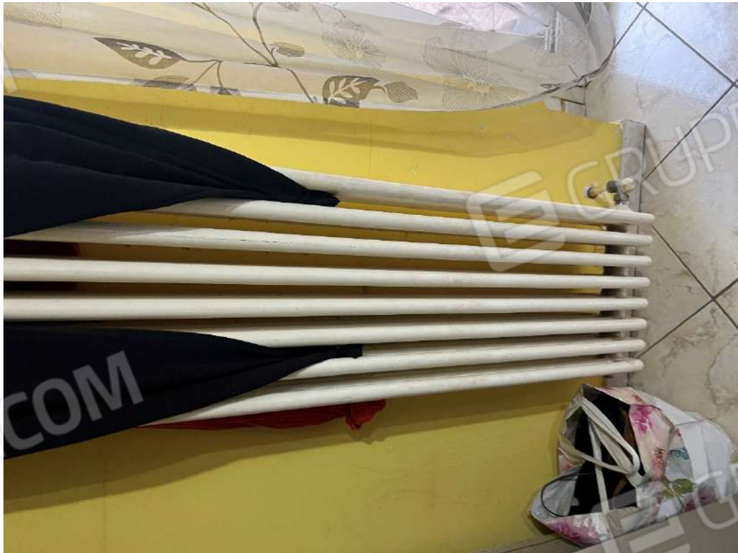
Figura 14 abitazione P1 nm. 946 dettaglio elementi radianti