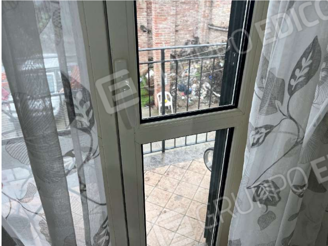
Figura 13 abitazione P1 nm. 946 dettaglio infissi esterni