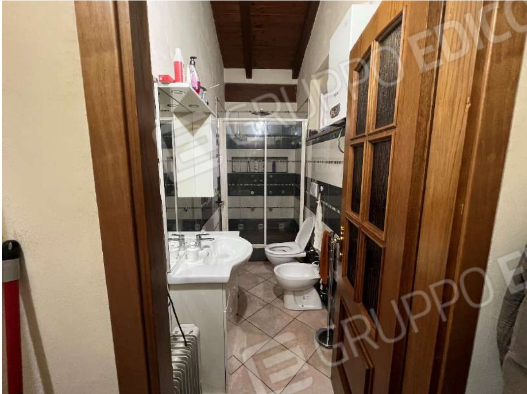
Figura 25 interno locale accessorio n. 153 - bagno