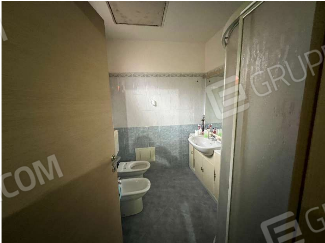
Figura 16 abitazione P1 nm. 946 bagno