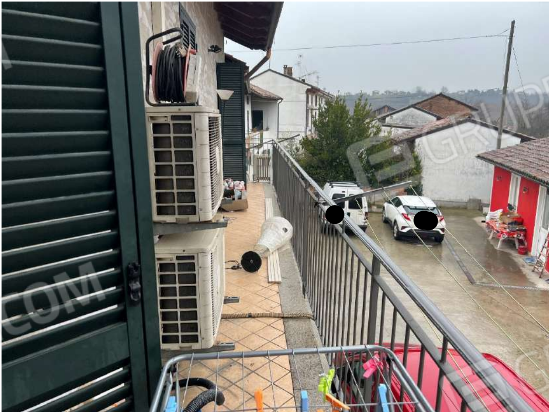
Figura 12 abitazione P1 nm. 946 CONDIZIONATORI