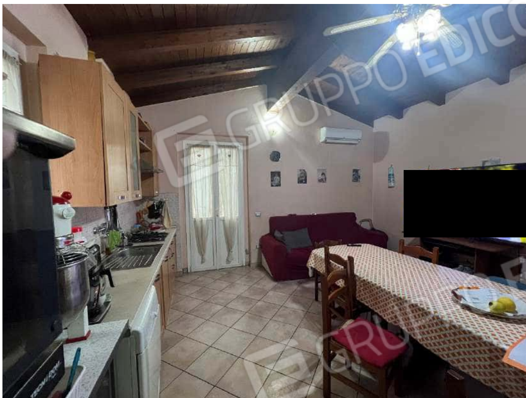
Figura 23 interno locale accessorio n., 153