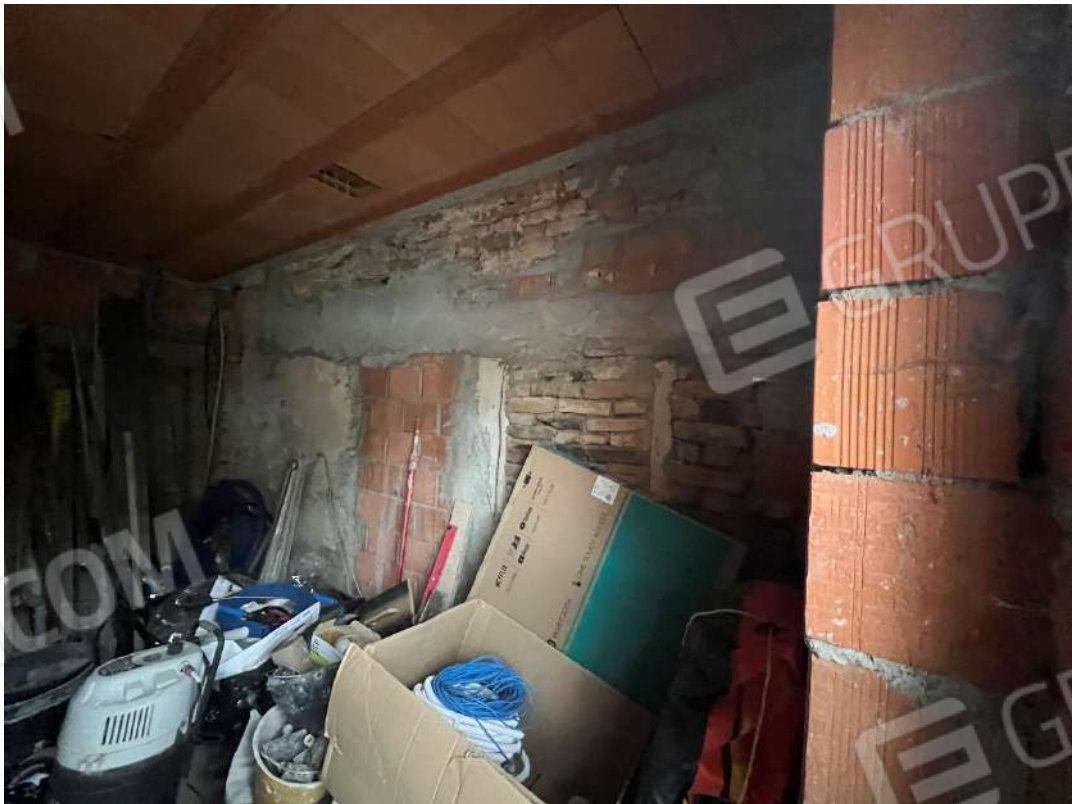
Figura 8 vano al grezzo PT nm. 946