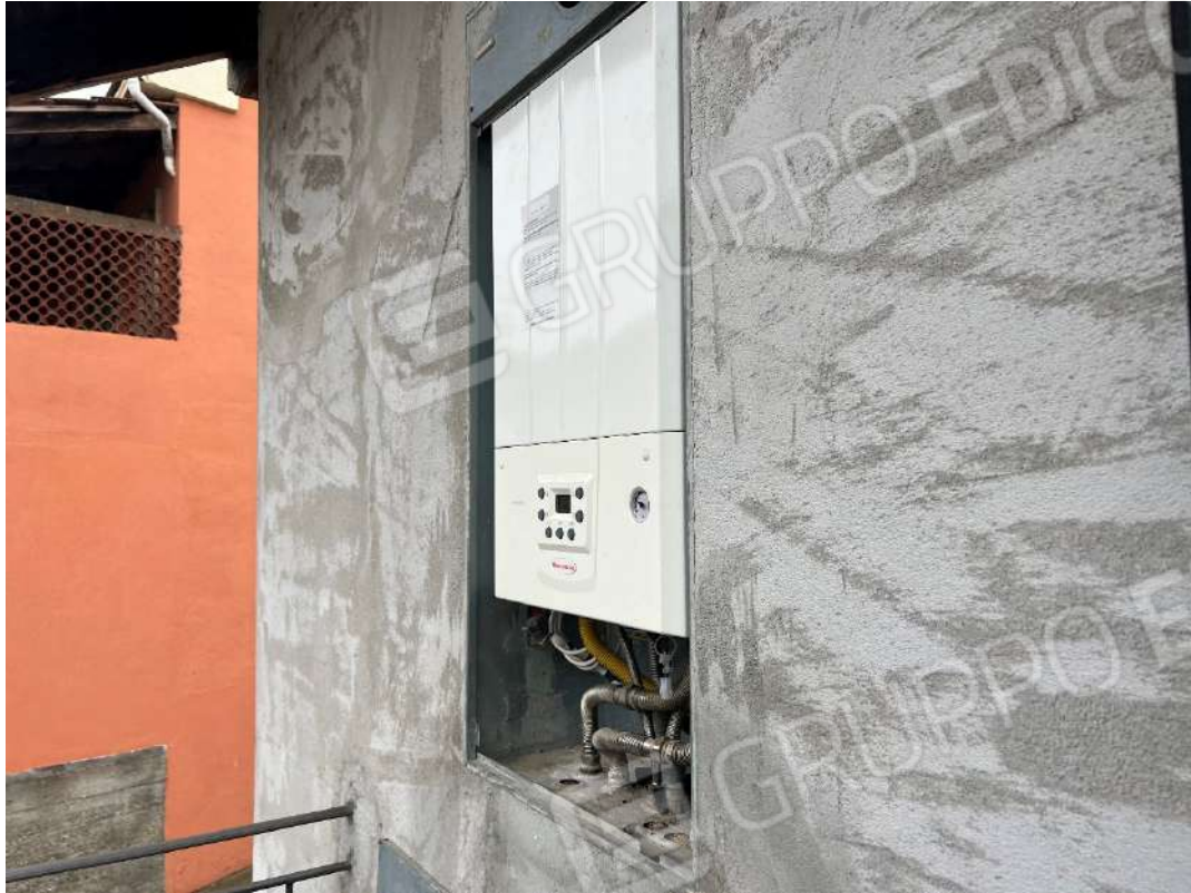
Figura 19 abitazione P1 nm. 946 caldaia