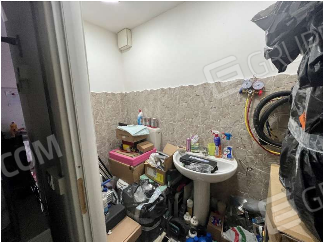
Figura 6 Bagno Ufficio PT nm. 946