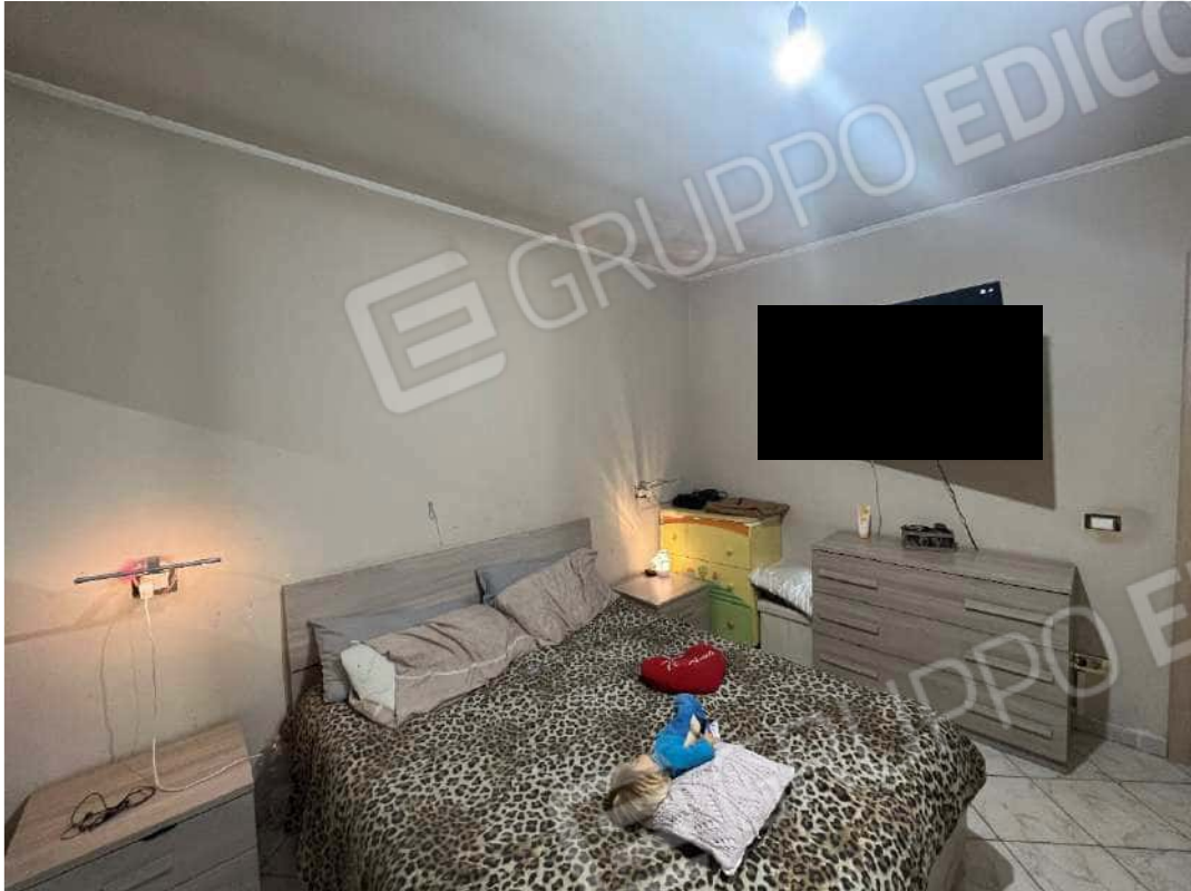
Figura 11 abitazione P1 nm. 946