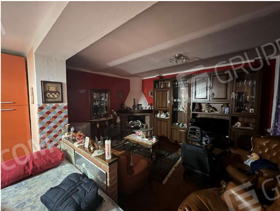
Figura 26 abitazione nm. 153 PT