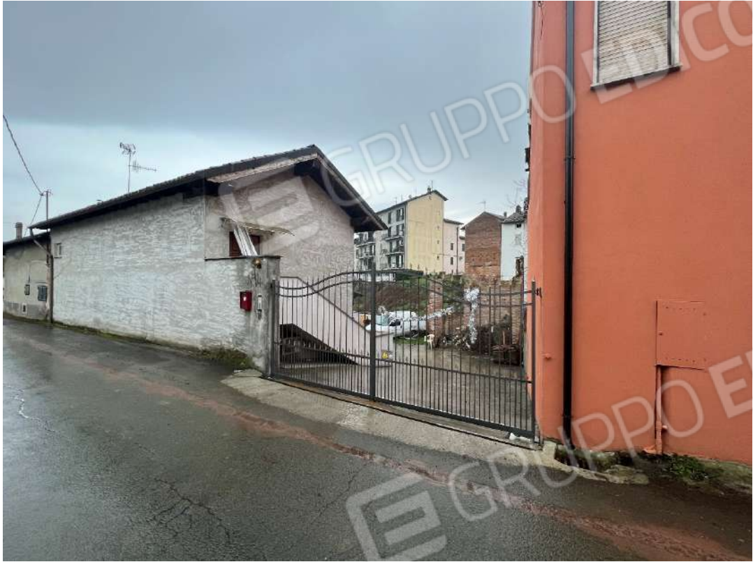
Figura 1 ingresso proprietà da Via Carducci