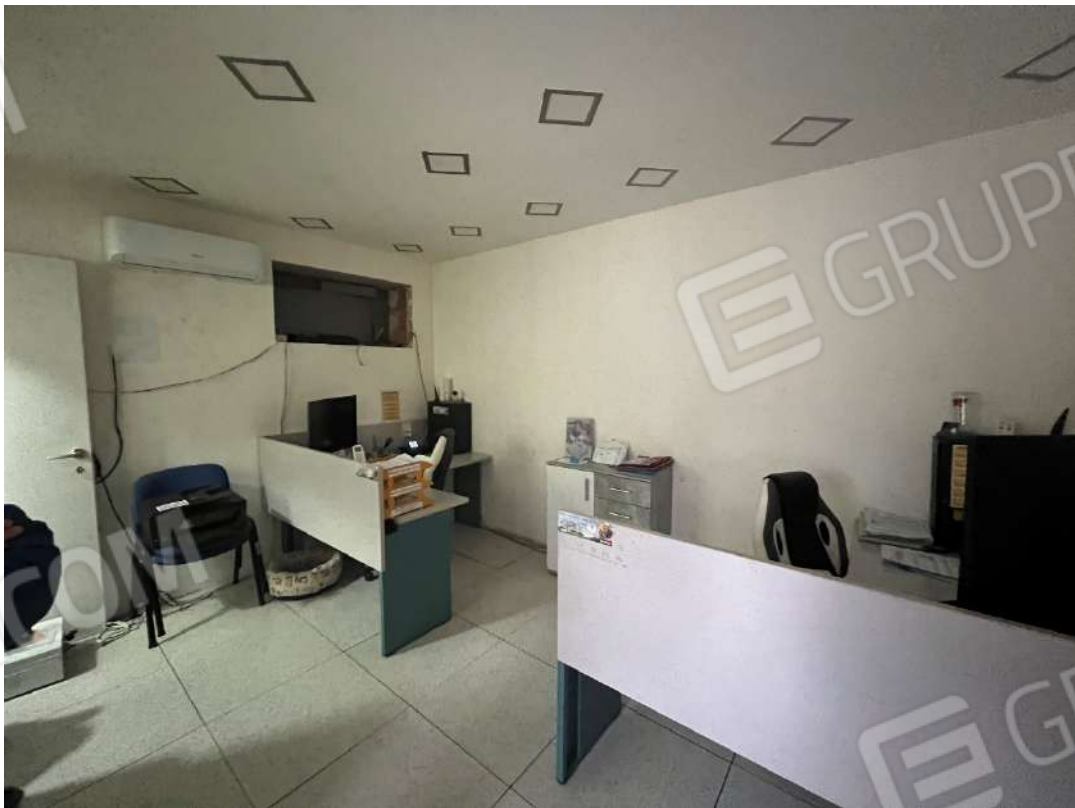
Figura 4 Ufficio PT nm. 946