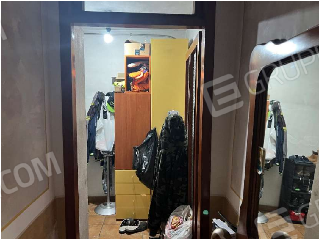
Figura 29 abitazione nm. 153 P1