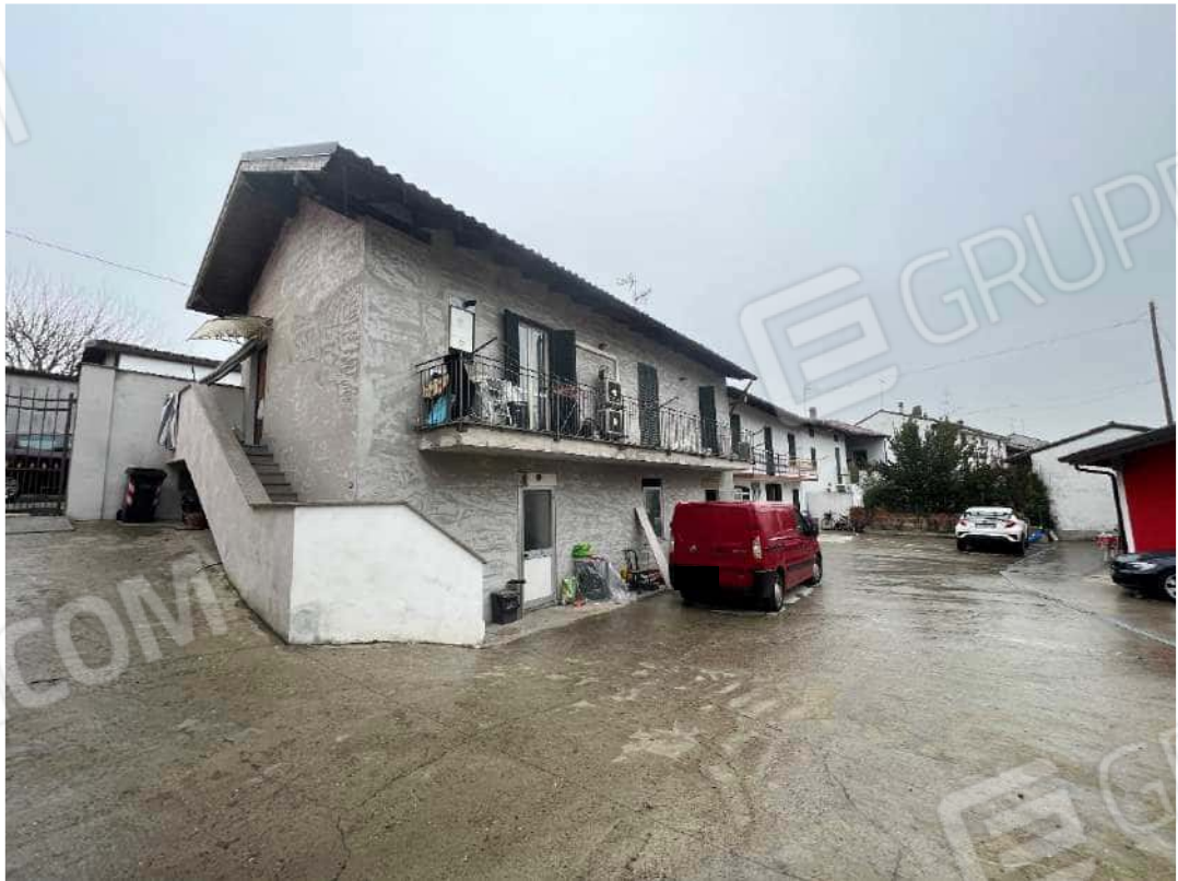
Figura 2 Abitazione nm 946 prospetto sud