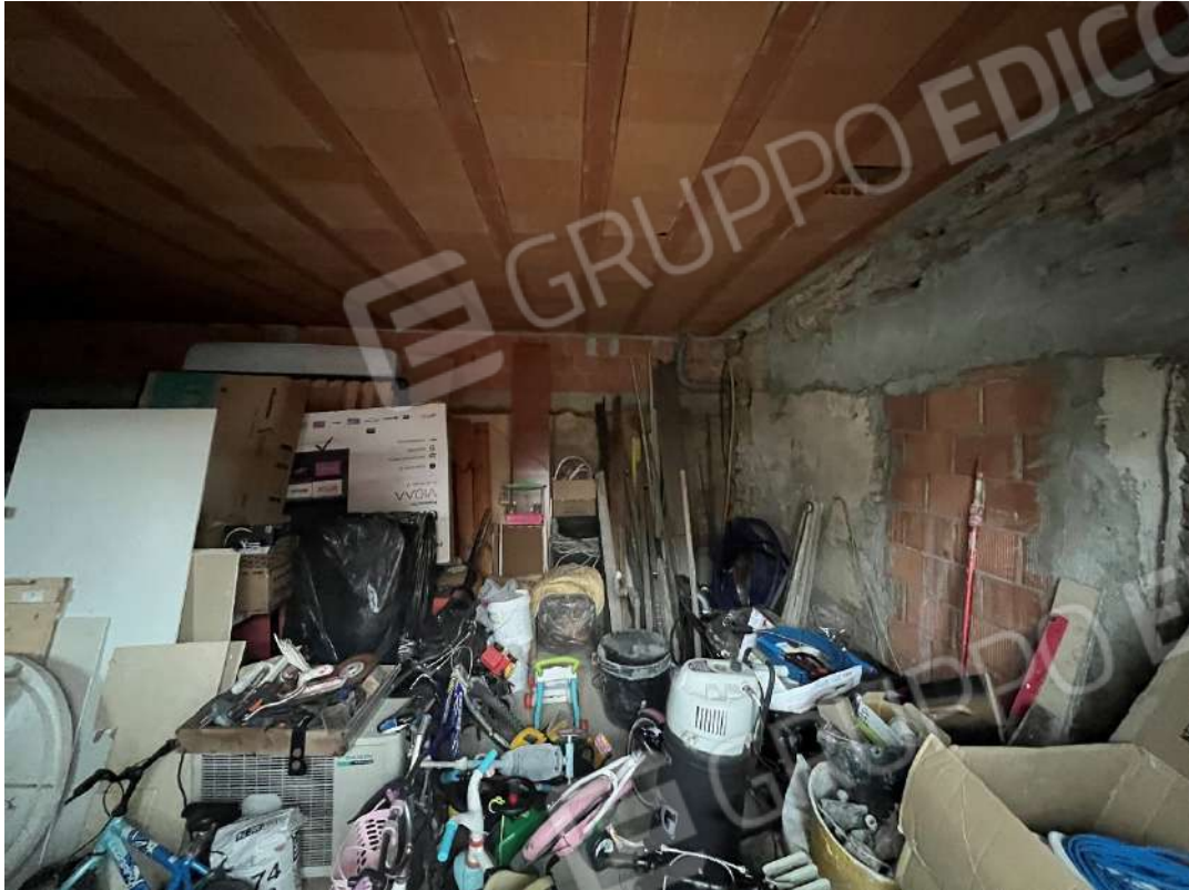
Figura 7 vano al grezzo PT nm. 946