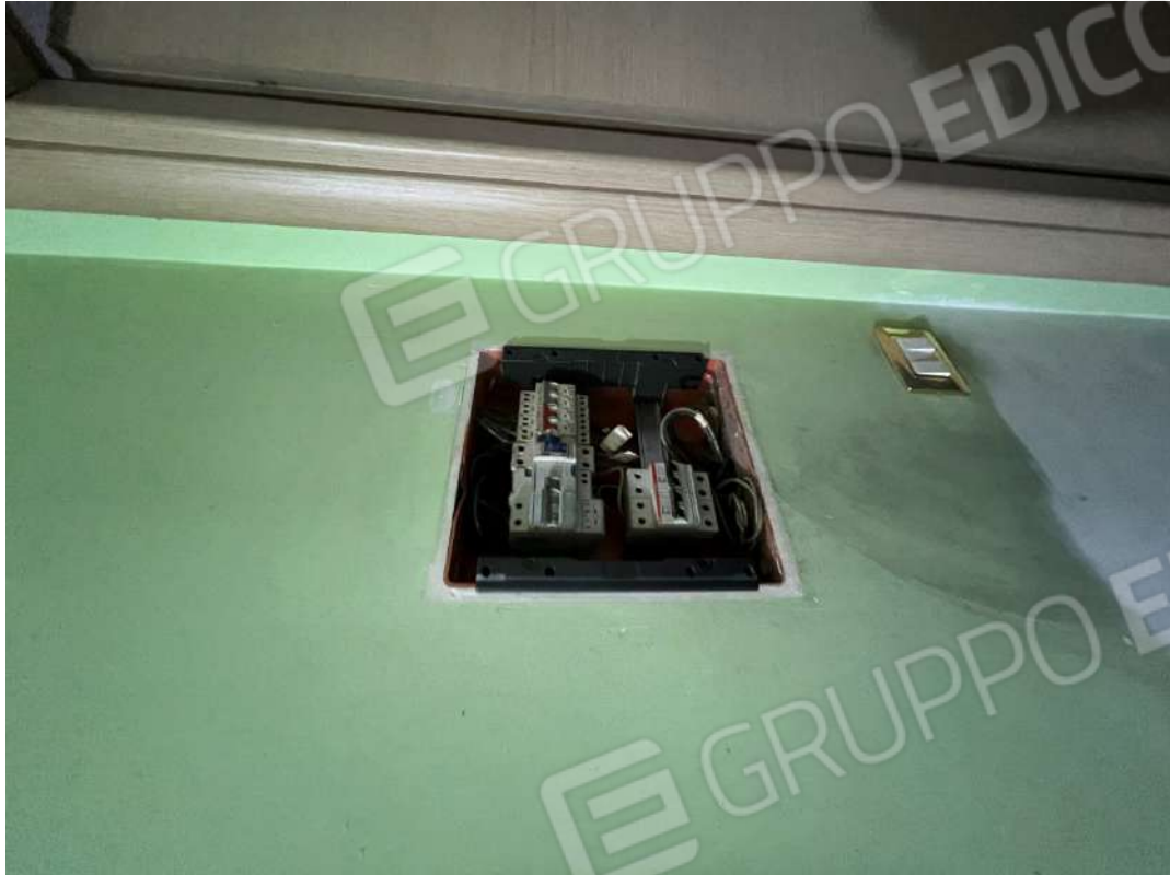
Figura 15 abitazione P1 nm. 946 particolare impianto elettrico