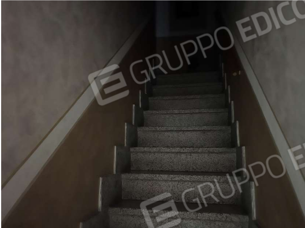
Figura 28 abitazione nm. 153 scala di accesso al P1