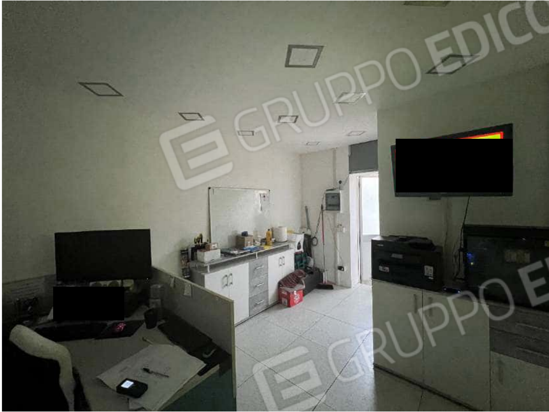
Figura 5 Ufficio PT nm. 946