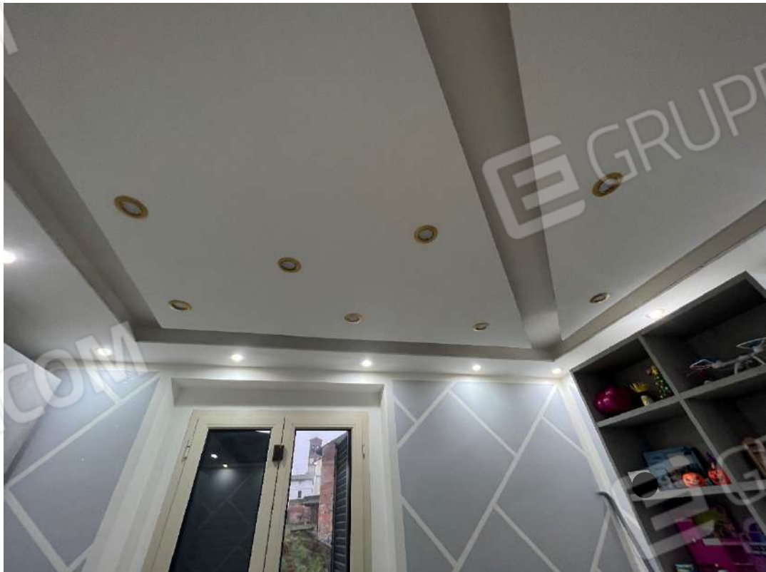
Figura 18 abitazione P1 nm. 946 camera