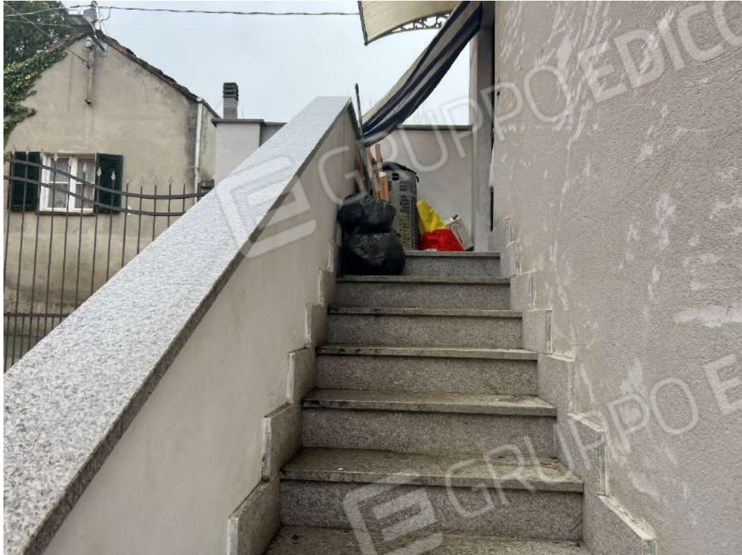
Figura 9 scala accesso abitazione P1 nm. 946