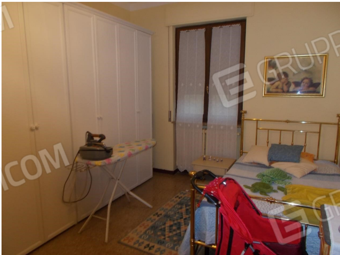
9. Particolare interno piano primo - Camera