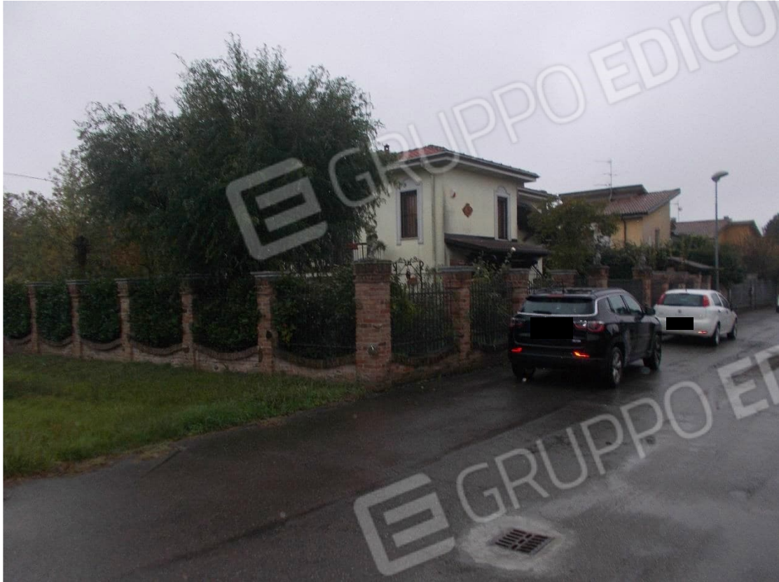
Foto 1. Fabbricato ad uso civile abitazione con sedime di pertinenza – Strada Cerca nr. 9 – Frazione Torre Garofoli – TORTONA (AL)