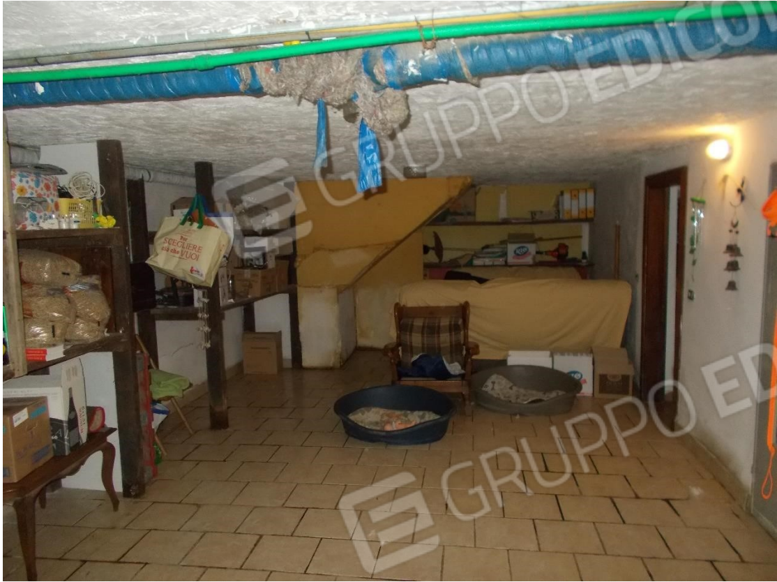
Foto 16. Particolare Garage al piano Terra