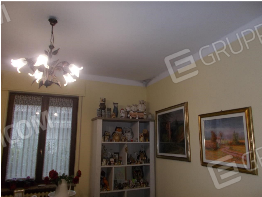
7. Particolare macchie nel soffitto - Sala