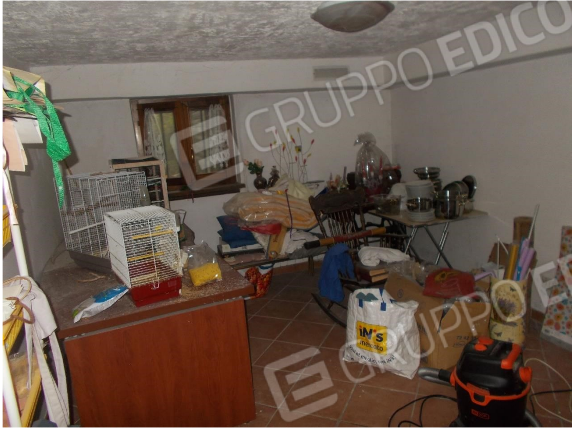
18. Particolare locale di pertinenza al piano Terra (non utilizzabile ai fini abitativi)