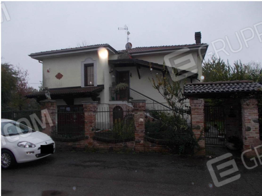
2. Particolare accesso alla proprietà