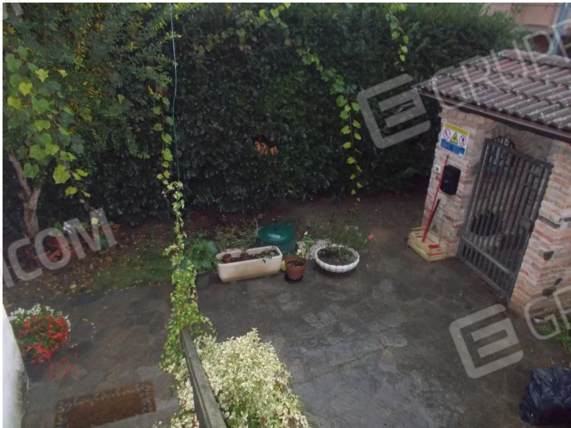
19. Particolare serbatoio interrato Gas . posto nel sedime di pertinenza