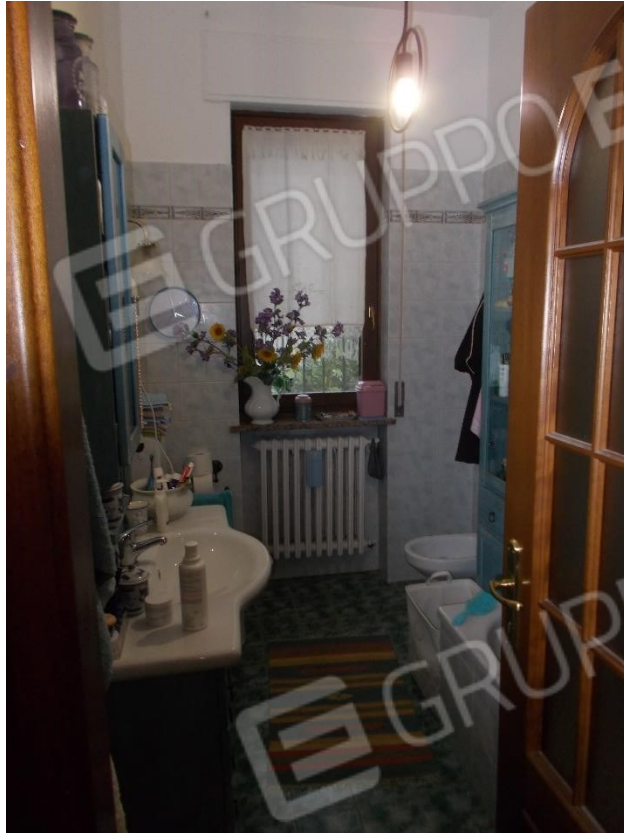
Foto 10. Particolare interno piano primo - Bagno