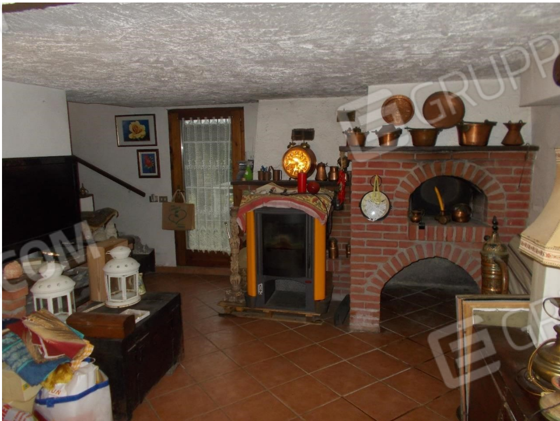
Foto 13. Particolare locale di pertinenza al piano Terra (non utilizzabile ai fini abitativi)