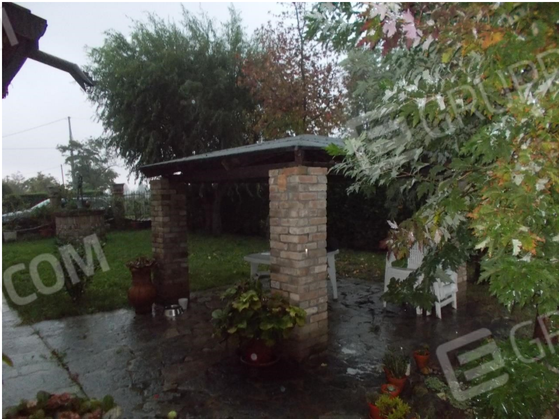
Foto 21. Gazebo in muratura – posto nel sedime cortilizio – Lato Est