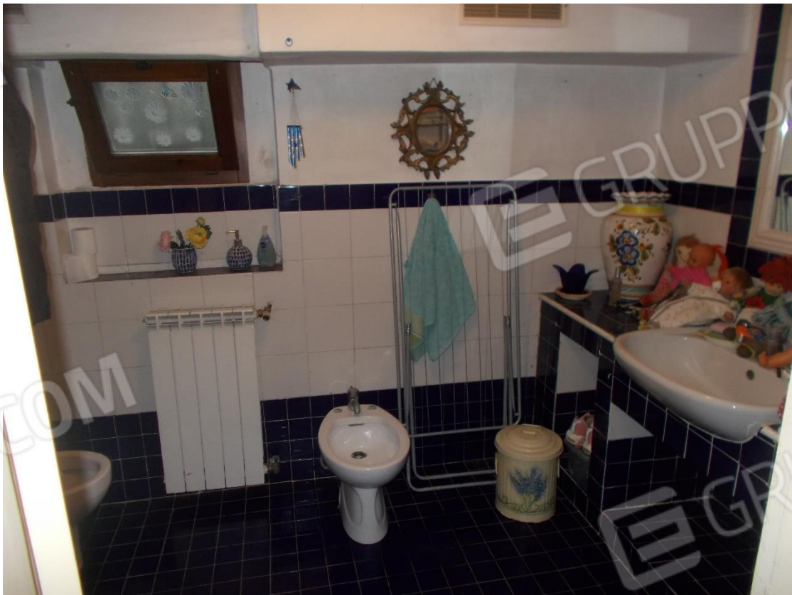
Foto 17. Particolare servizio igienico al piano Terra (non utilizzabile ai fini abitativi)