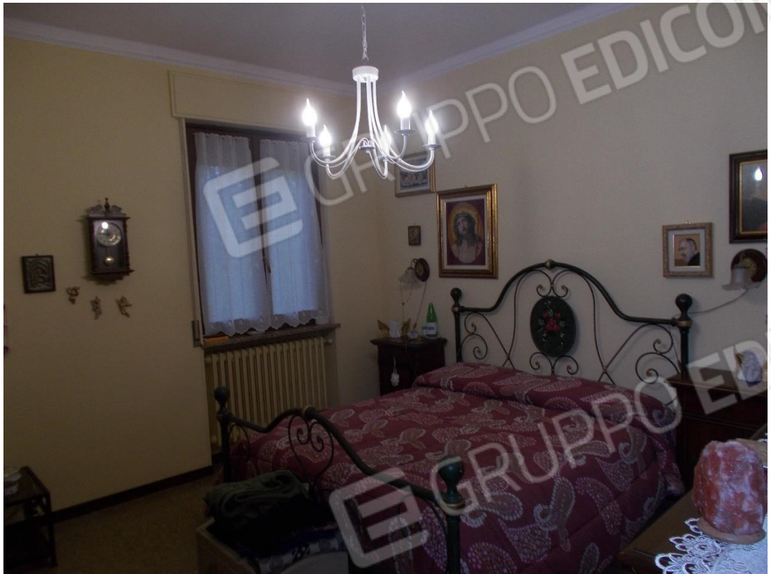
Foto 8. Particolare interno piano primo - Camera