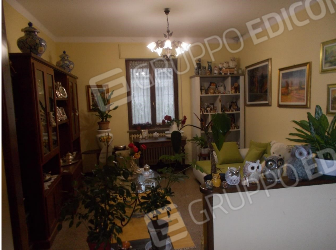
Foto 6. Particolare interno piano primo - Sala