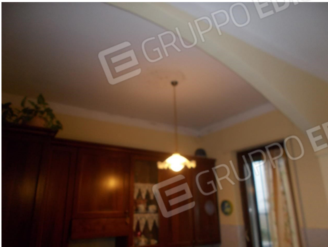
5. Particolare segni infiltrazioni - soffitto locale cucina