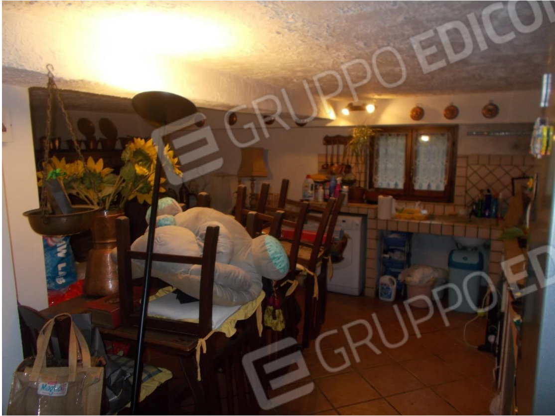
Foto 14. Particolare locale di pertinenza al piano Terra (non utilizzabile ai fini abitativi)