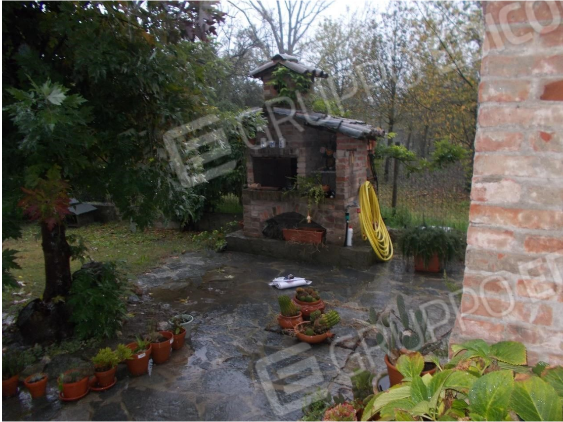
Foto 20. Forno in muratura posto nel sedime cortilizio – lato Sud