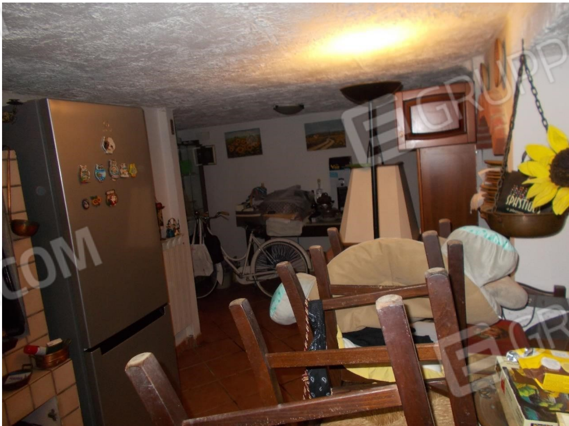
Foto 15. Particolare locale di pertinenza al piano Terra (non utilizzabile ai fini abitativi)