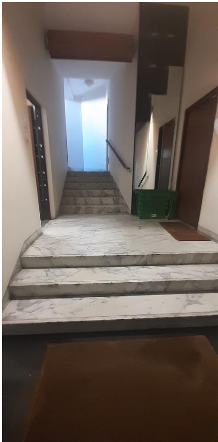
Androne ingresso PT