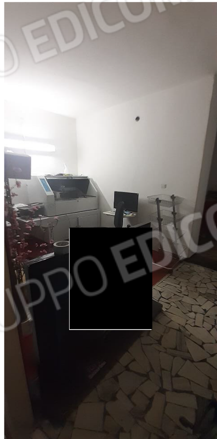
Ingresso Sub. 136