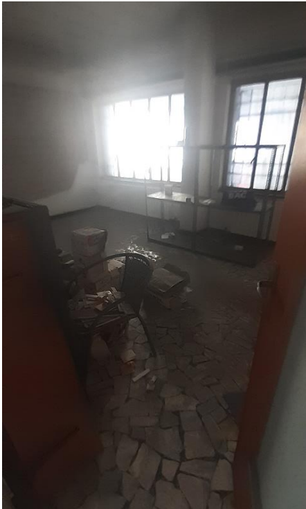
Spazi di servizio