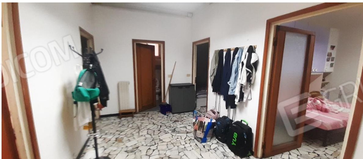
Spazio di distribuzione centrale