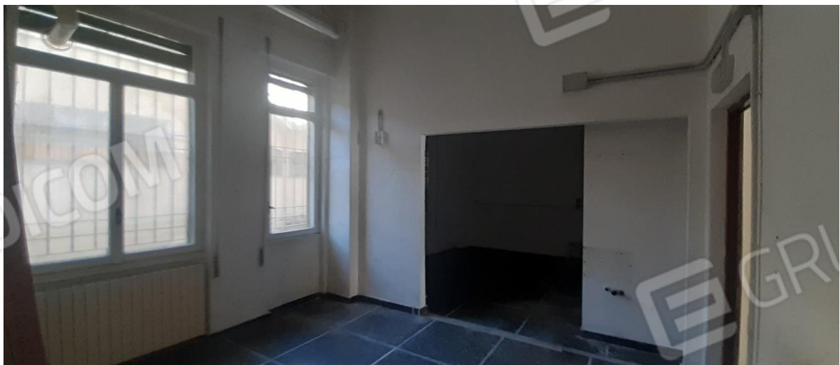
Spazi di servizio - affacci sul retro