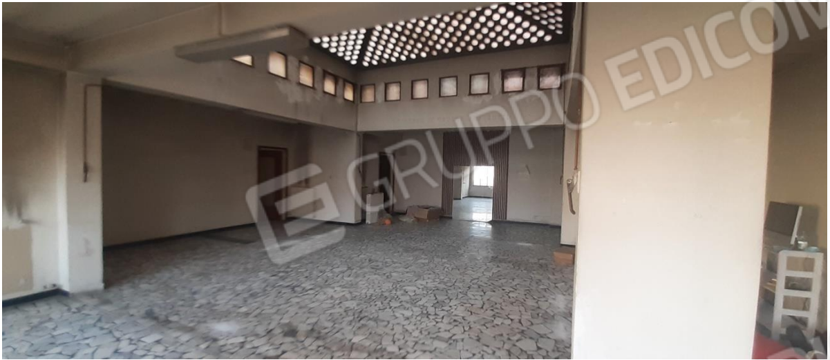
Ex aula giudiziaria