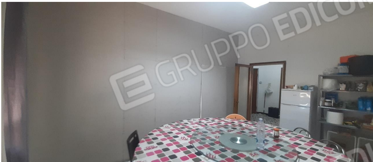
Sala Pranzo - visibile la parete in cartongesso non ultimata che separa dal Sub. 113