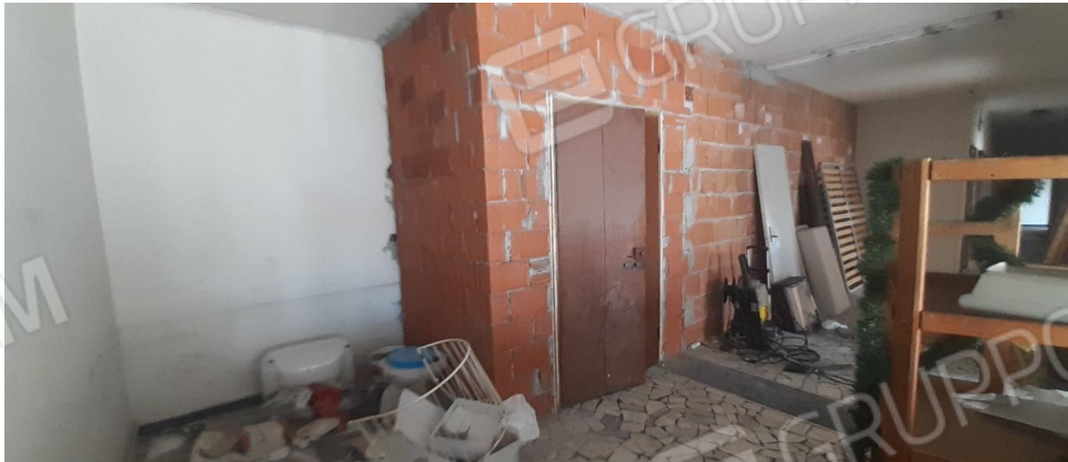
Modifiche derivanti dalla divisione dei locali - ingresso