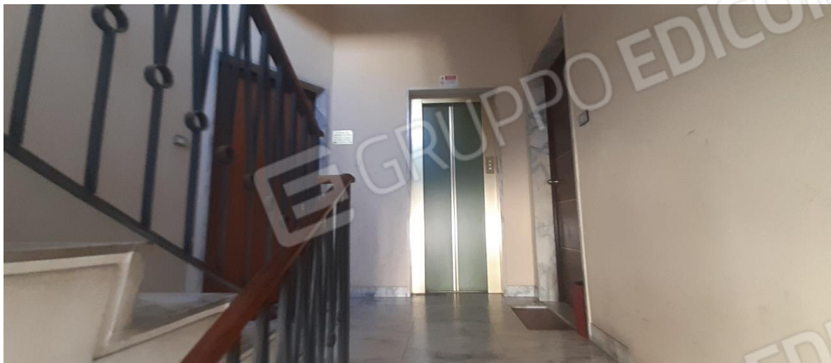
Pianerottolo di sbarco - a destra l'ingresso del Sub. 113 ed a sinistra dal Sub. 156