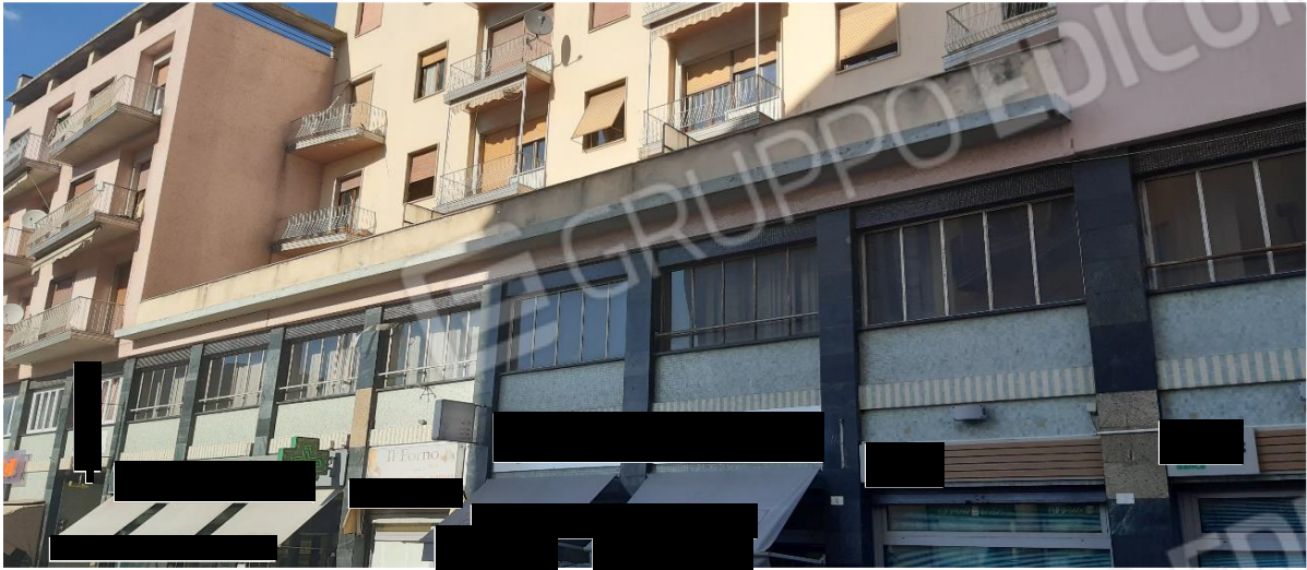
Vista delle finestrone del piano ammezzato sulla via pubblica