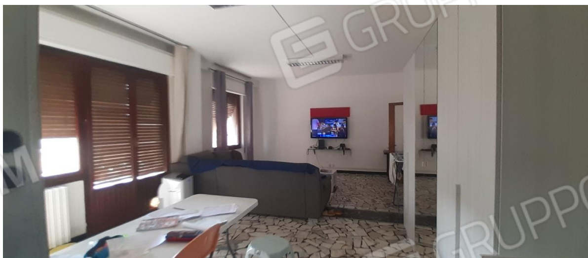
Soggiorno (divisorio mancante)