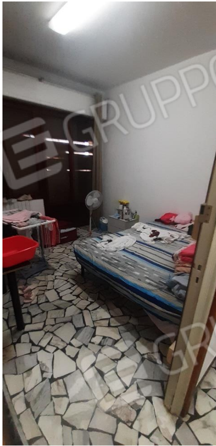
Camere da letto