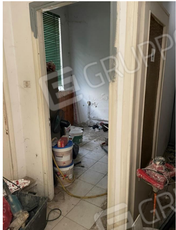
VISTE INTERNO MAGAZZINO PIANO SEMINTERRATO