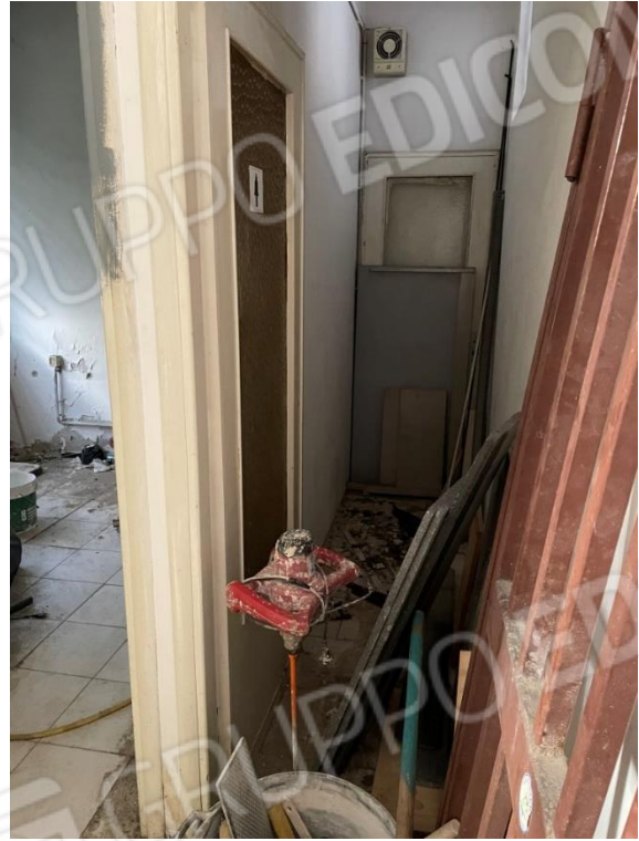
VISTE INTERNO MAGAZZINO PIANO SEMINTERRATO