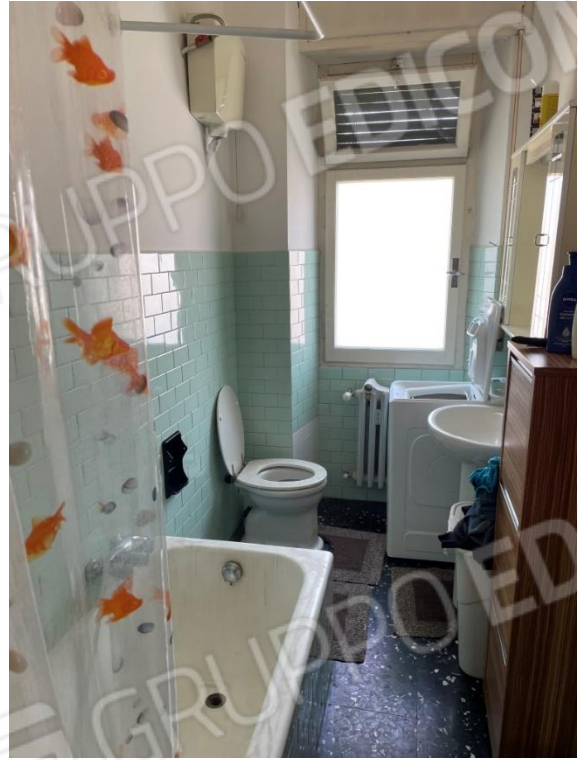
VISTA SU CAMERA E BAGNO