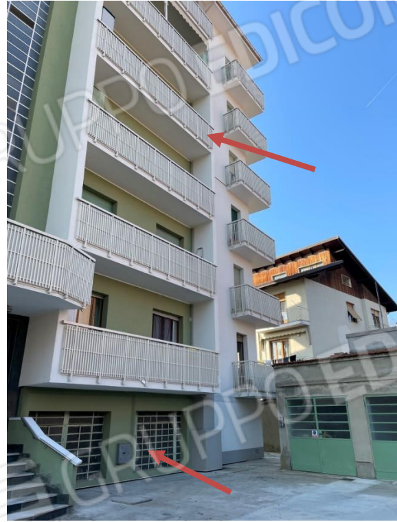
VISTA SU BALCONE ALLOGGIO E FINESTRE DEPOSTO