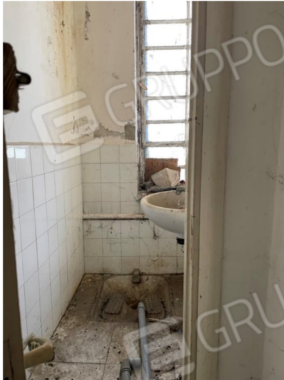
VISTE INTERNO MAGAZZINO PIANO SEMINTERRATO