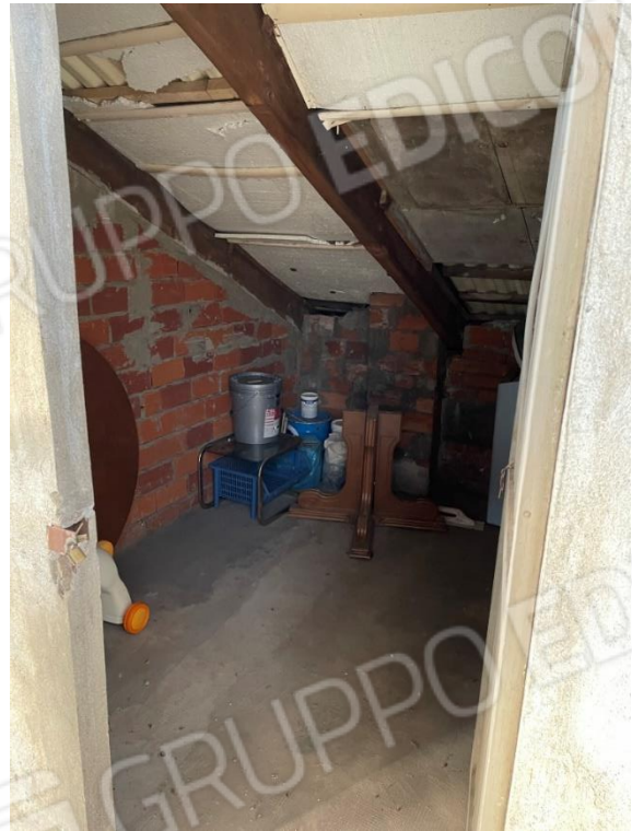
VISTA SU DEPOSITO SOTTOTETTO