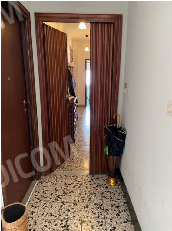
VISTA INGRESSO ALLOGGIO