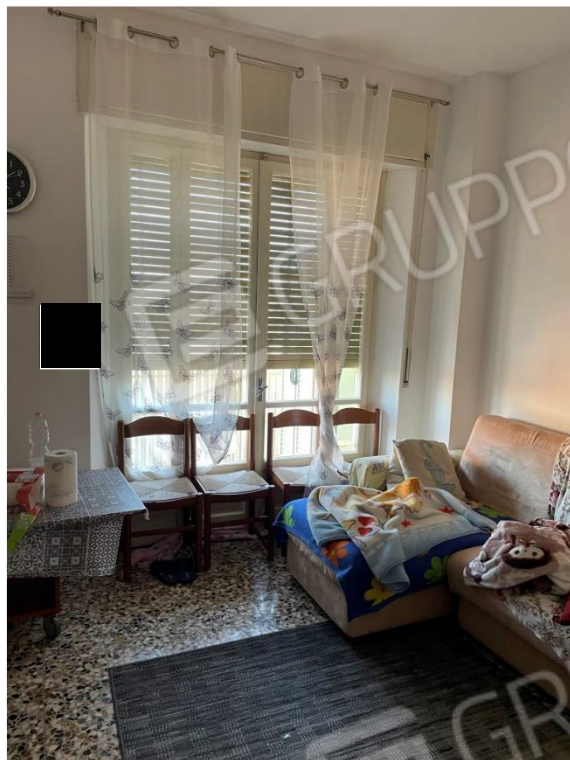
VISTA SU SOGGIORNO