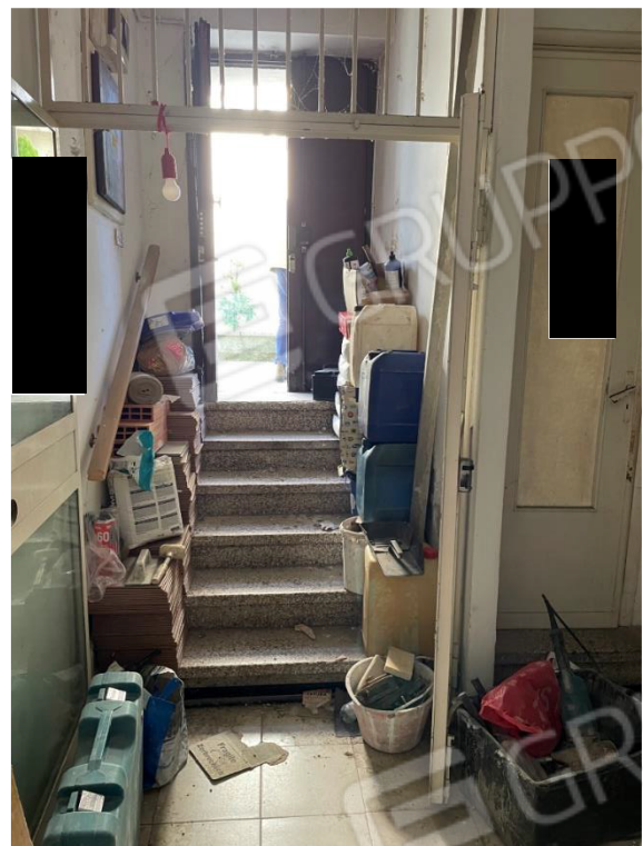
VISTA INGRESSO MAGAZZINO PIANO SEMINTERRATO