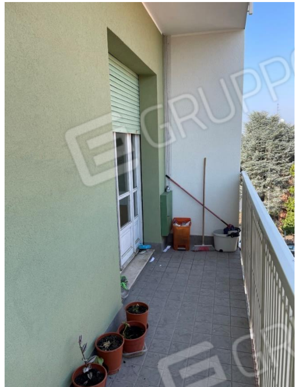
VISTA SU BALCONI