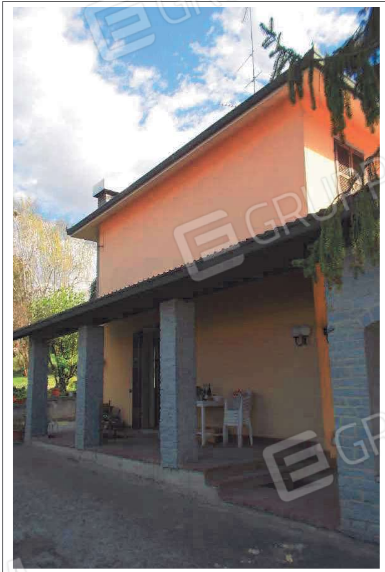
Fotografia n. 16 = LOTTO 2 Vista del prospetto NORD