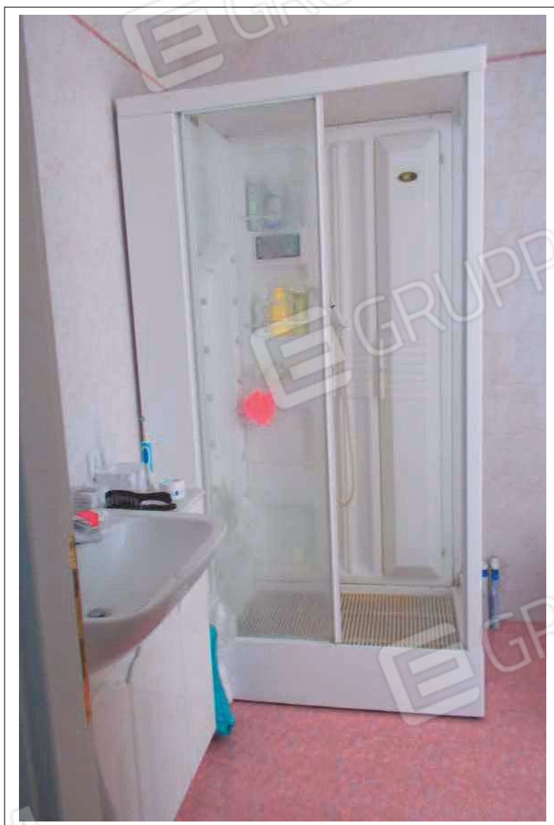
Fotografia n. 23 = LOTTO 2 Vista interna di un bagno al piano primo