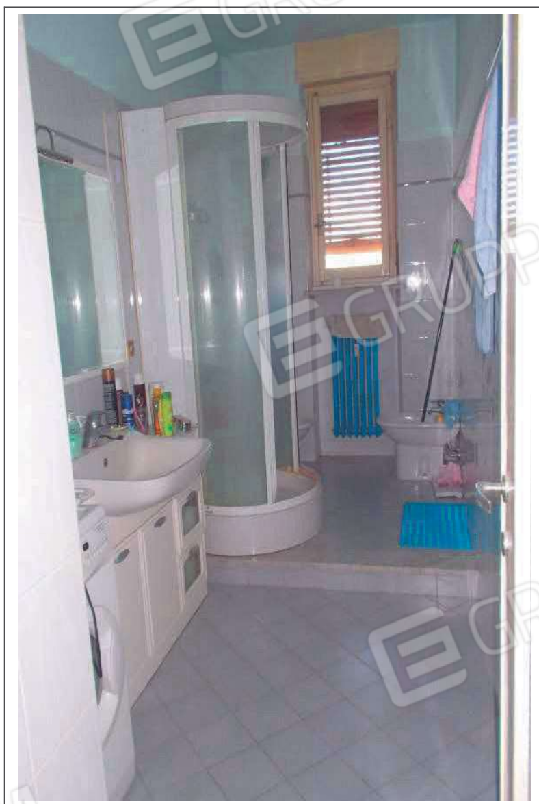
Fotografia n. 8 = LOTTO 1 CORPO A Vista interna del bagno