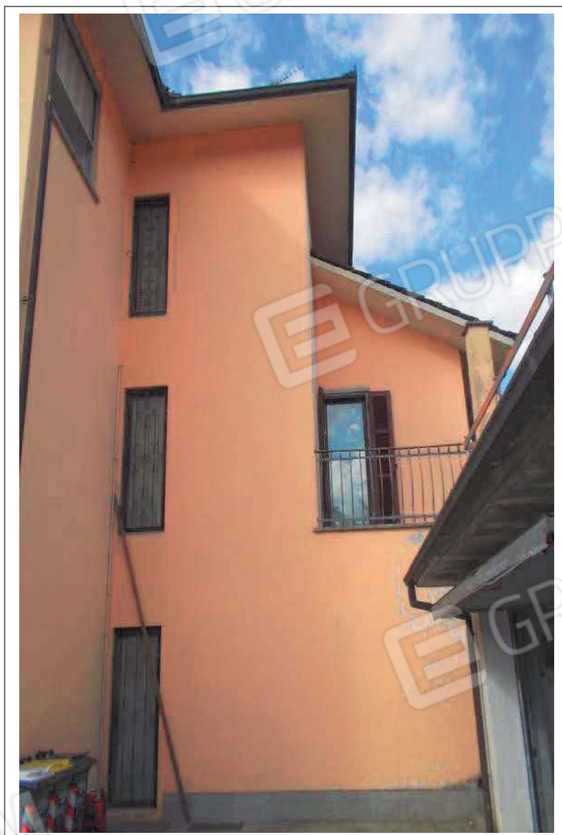
Fotografia n. 18 = LOTTO 2 Vista di parte del del prospetto SUD