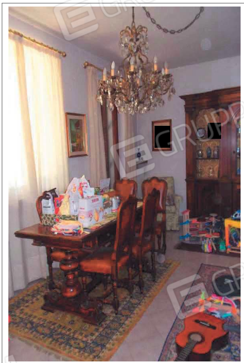
Fotografia n. 20 = LOTTO 2 Vista interna del soggiorno al piano terra