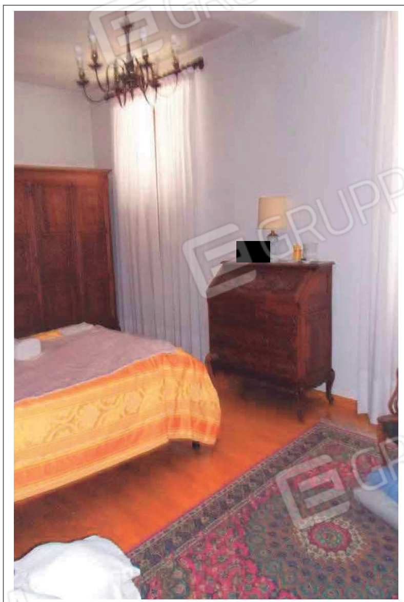
Fotografia n. 24 = LOTTO 2 Vista interna di una camera al piano primo