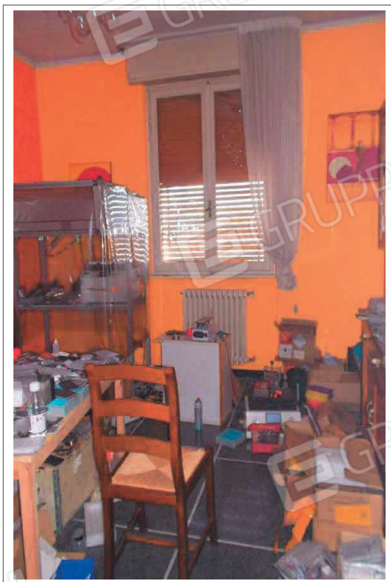
Fotografia n. 5 = LOTTO 1 CORPO A Vista interna di una camera