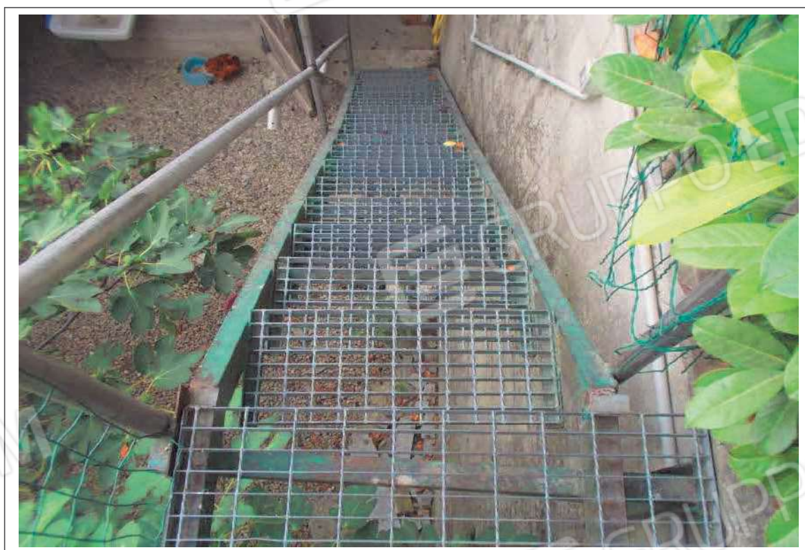
Fotografia n. 15 = LOTTO 2 Vista particolare della scala metallica dalla quale si accede al terreno, non pignorato, situato ad OVEST dell'immobile