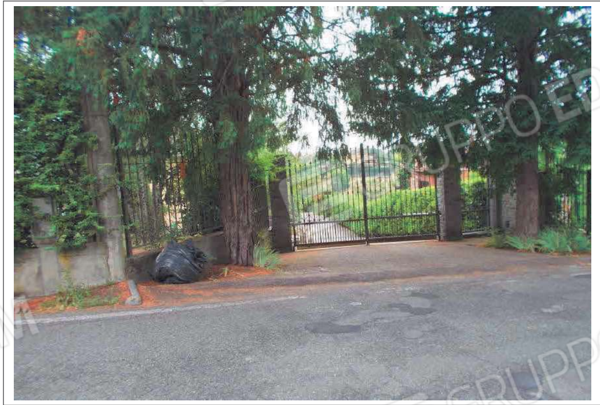
Fotografia n. 12 = LOTTO 2 Vista dell'ingresso all'immobile dalla Strada Comunale Virgo Potens