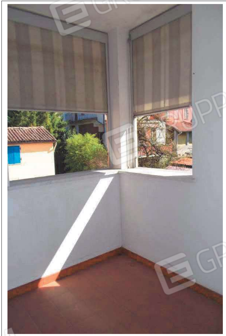
Fotografia n. 27 = LOTTO 2 Vista del terrazzo al piano secondo