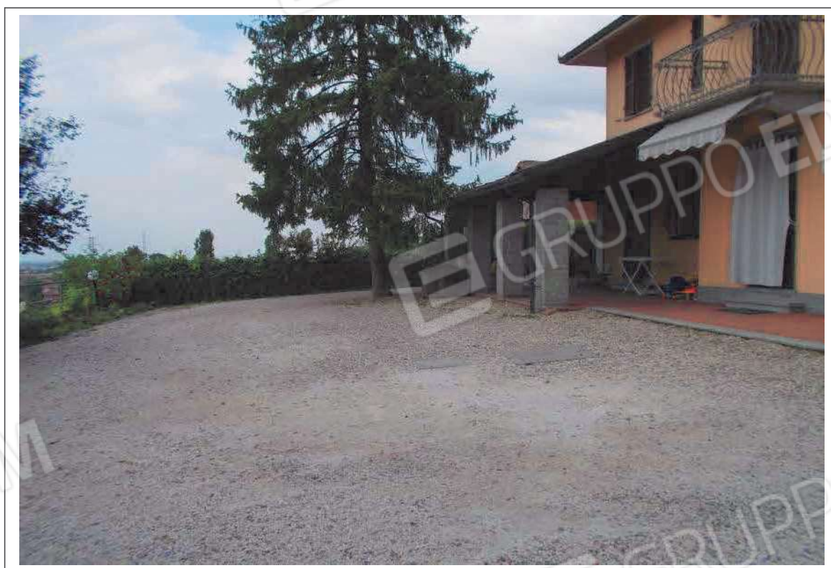
Fotografia n. 14 = LOTTO 2 Vista del cortile pertinenziale all'immobile posto ad OVEST