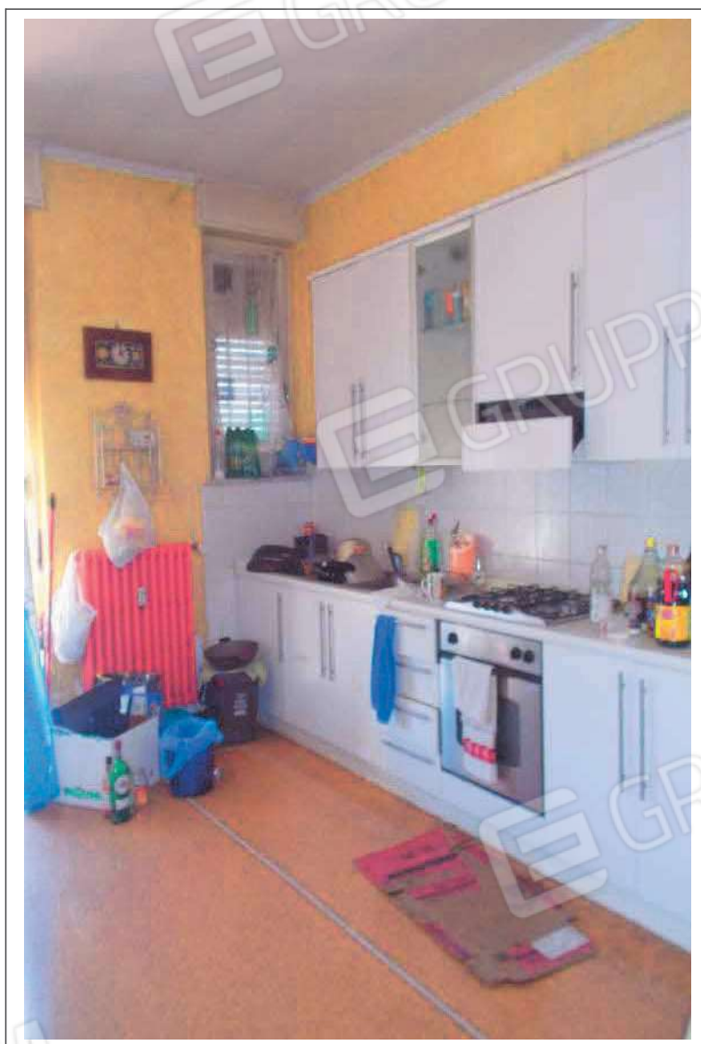
Fotografia n. 7 = LOTTO 1 CORPO A Vista interna della cucina