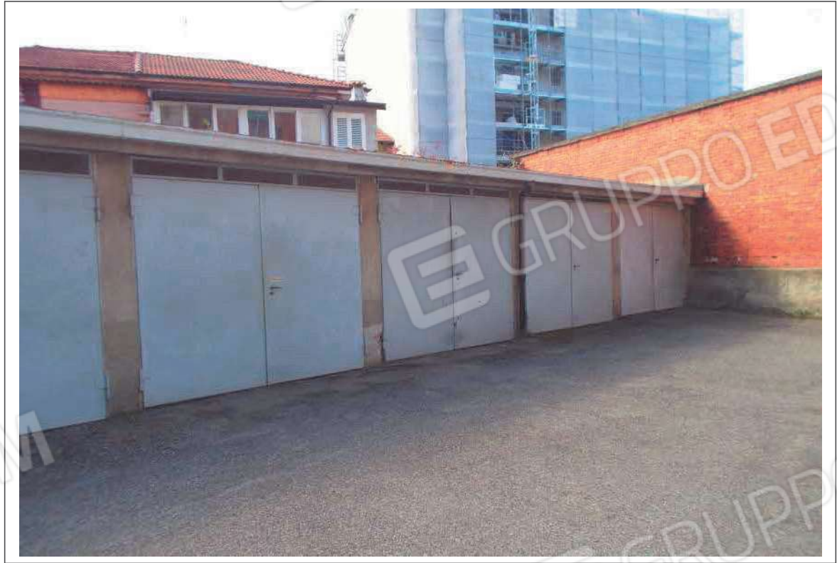
Fotografia n. 11 = LOTTO 1 CORPO B Vista del box dal cortile del Condominio LEM