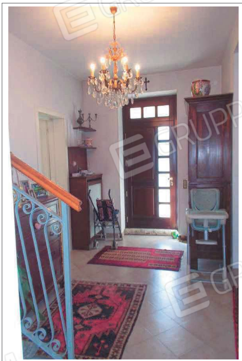
Fotografia n. 19 = LOTTO 2 Vista interna dell'ingresso al piano terra