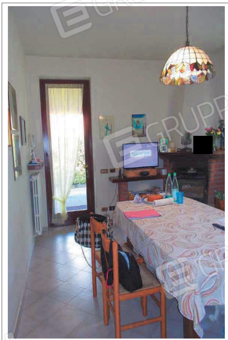
Fotografia n. 21 = LOTTO 2 Vista interna della cucina al piano terra