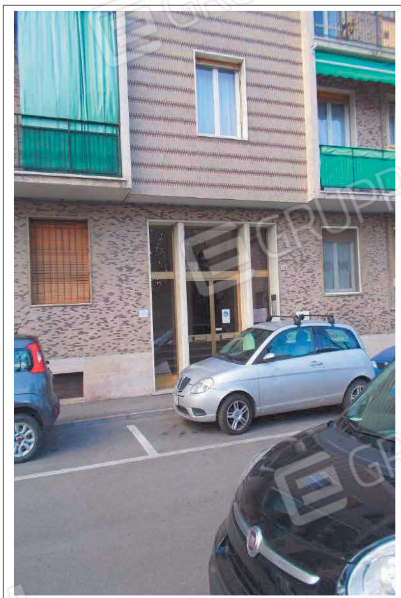
Fotografia n. 2 = LOTTO 1 CORPO A Vista dell'ingresso del Condominio del Sole