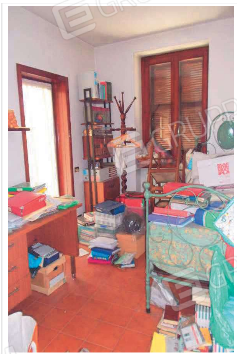
Fotografia n. 26 = LOTTO 2 Vista interna della camera al piano secondo