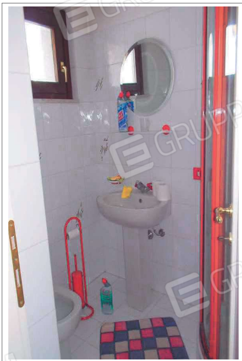
Fotografia n. 28 = LOTTO 2 Vista interna del w.c. al piano secondo