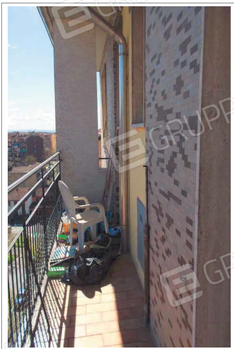
Fotografia n. 10 = LOTTO 1 CORPO A Vista del balcone