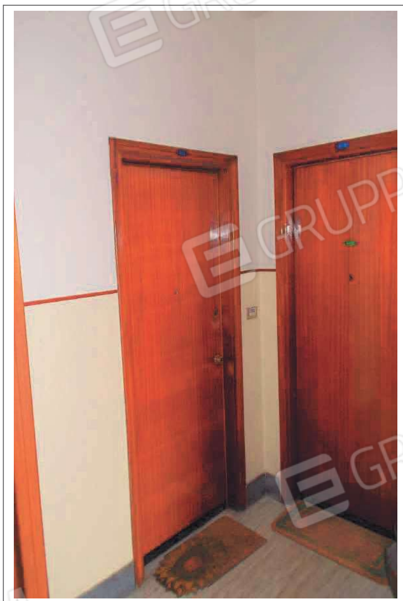
Fotografia n. 3 = LOTTO 1 CORPO A Vista della porta d'ingresso dell'appartamento