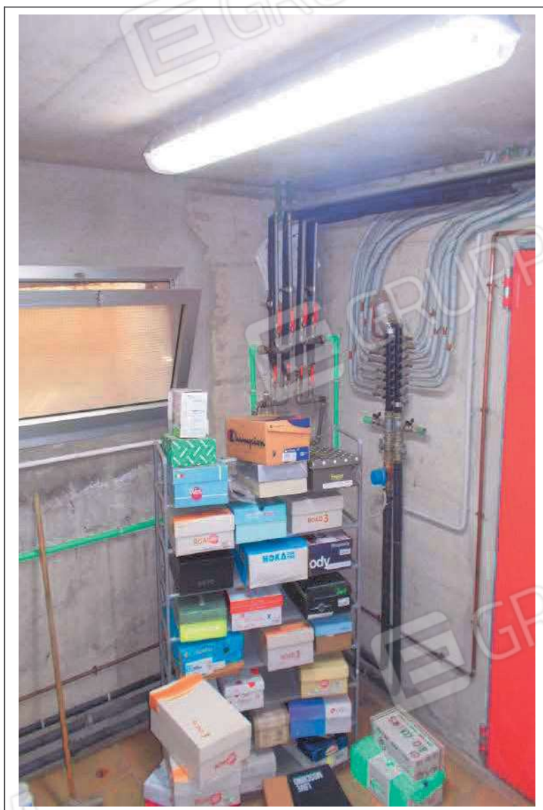
Fotografia n. 29 = LOTTO 2 Vista interna del locale caldaia al piano interrato