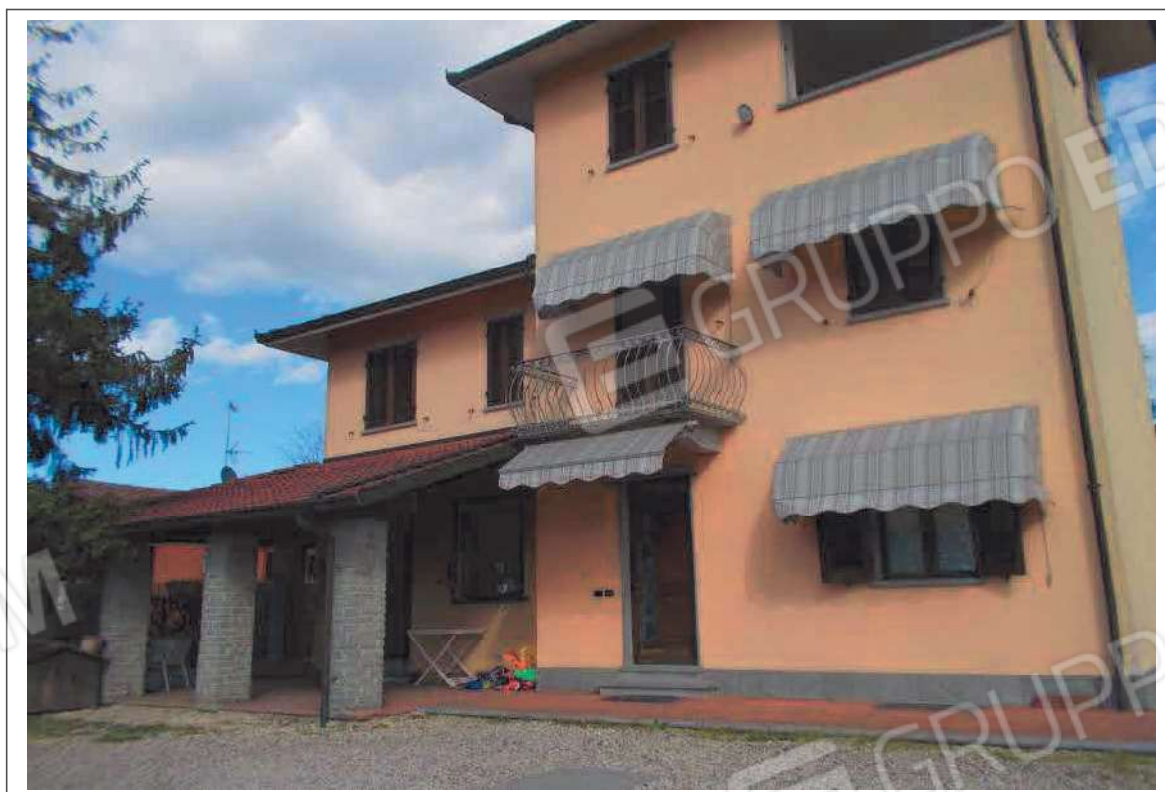
Fotografia n. 17 = LOTTO 2 Vista del prospetto OVEST