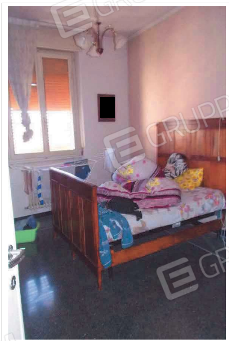
Fotografia n. 9 = LOTTO 1 CORPO A Vista interna di una camera