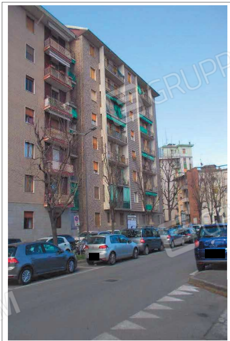
Fotografia n. 1 = LOTTO 1 CORPO A Vista del Condominio del Sole da Via San Giovanni Bosco