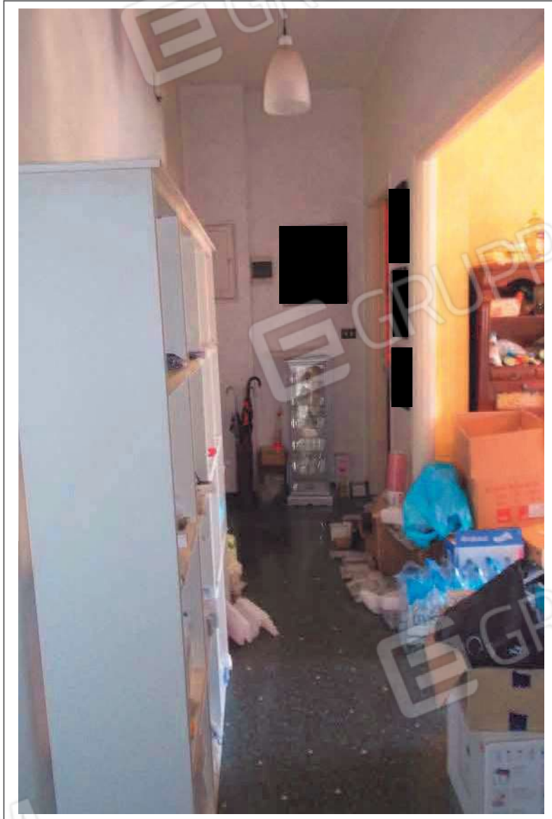
Fotografia n. 4 = LOTTO 1 CORPO A Vista interna dell'ingresso