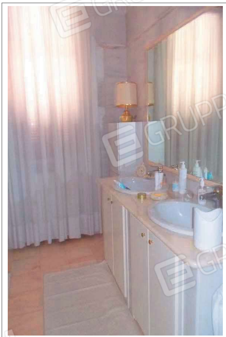
Fotografia n. 25 = LOTTO 2 Vista interna di un bagno al piano primo