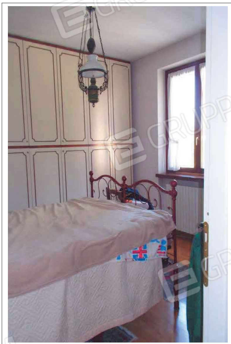
Fotografia n. 22 = LOTTO 2 Vista interna di una camera al piano primo