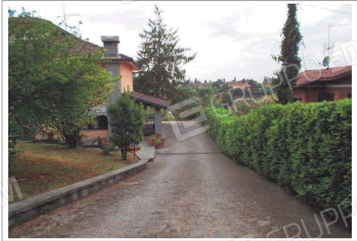
Fotografia n. 13 = LOTTO 2 Vista della rampa interna di accesso all'immobile