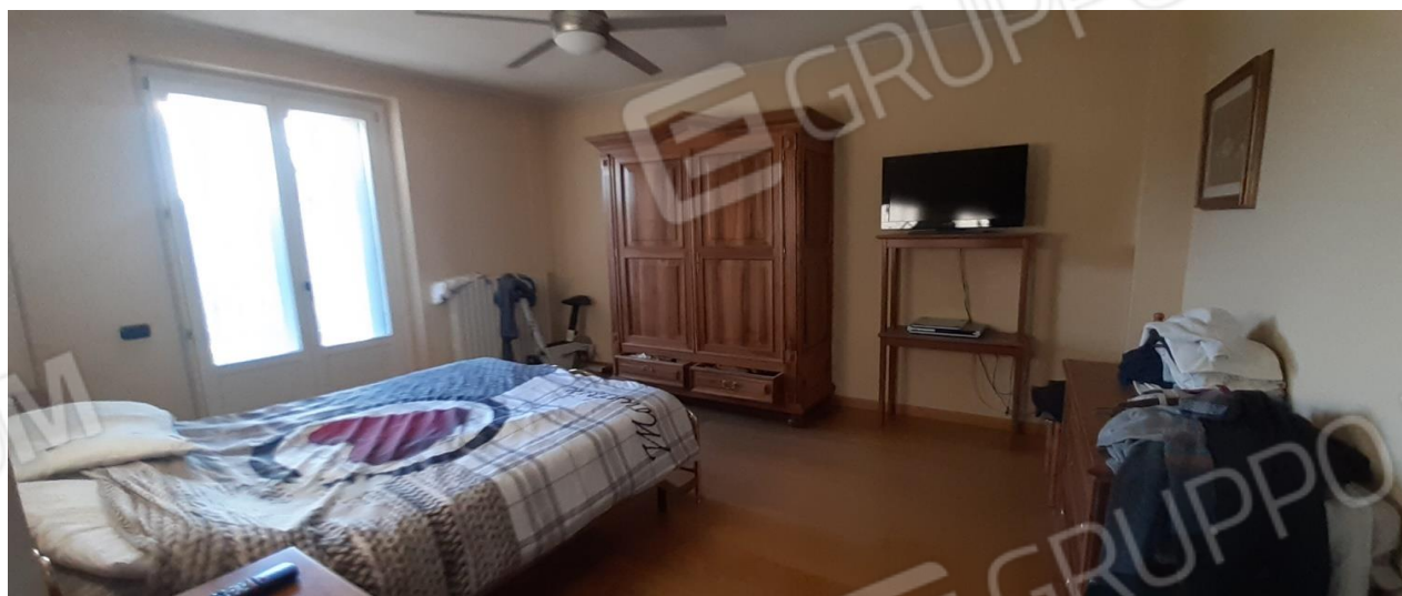
Camera da letto - P1 regolarmente accatastata