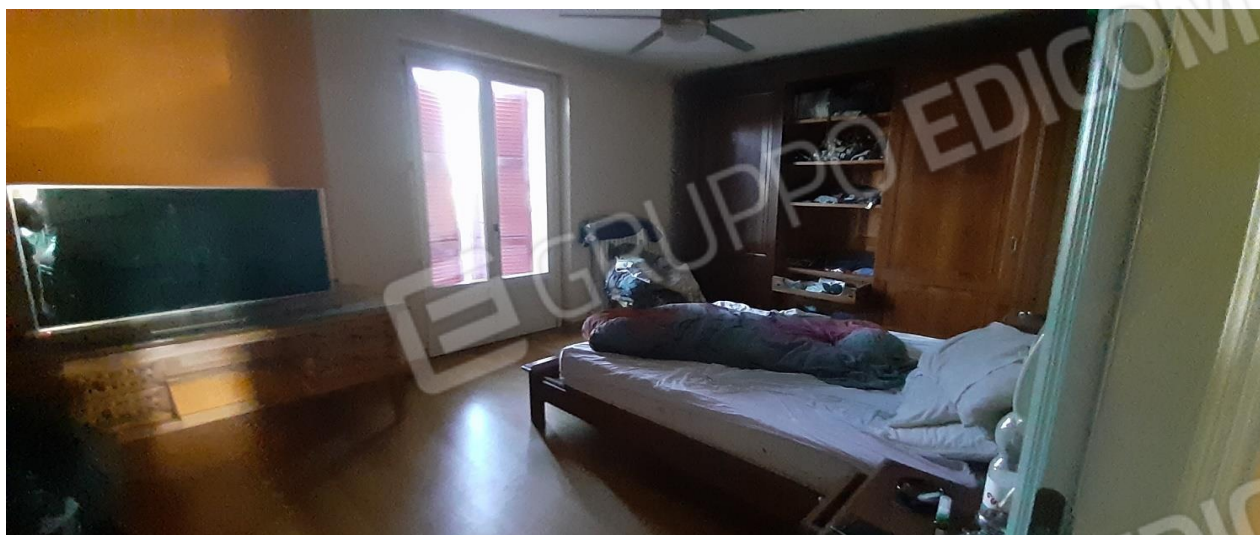
Camera da letto - P1 regolarmente accatastata