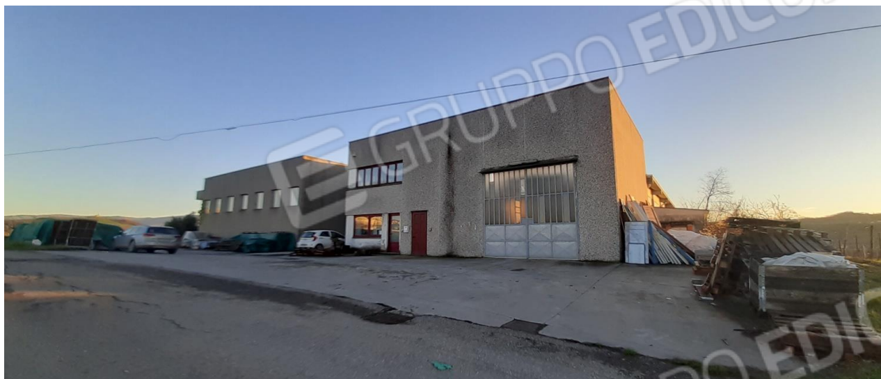
Vista generale dell'abitazione dal fronte strada