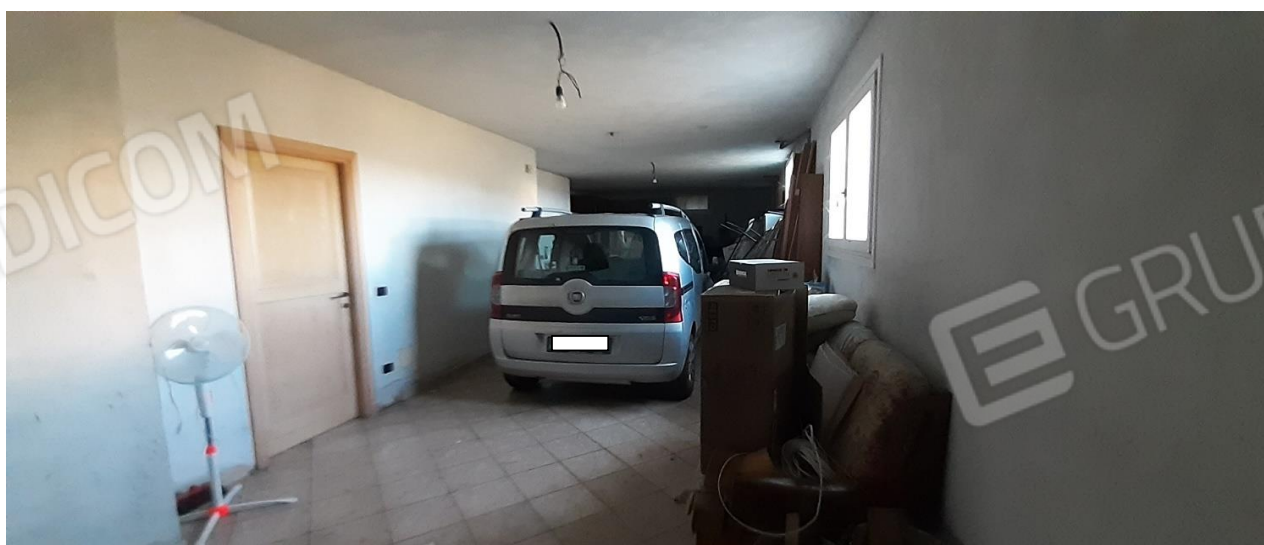
Vista interna del box - Piano Seminterrato