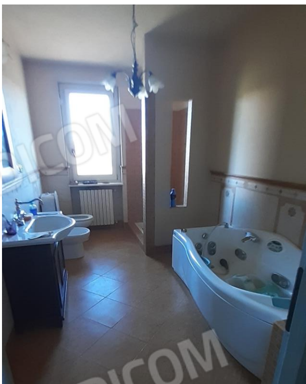
Servizio igienico del P1 Buone finiture utilizzate