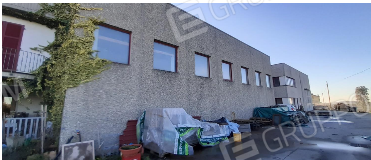
Vista fonte Opificio