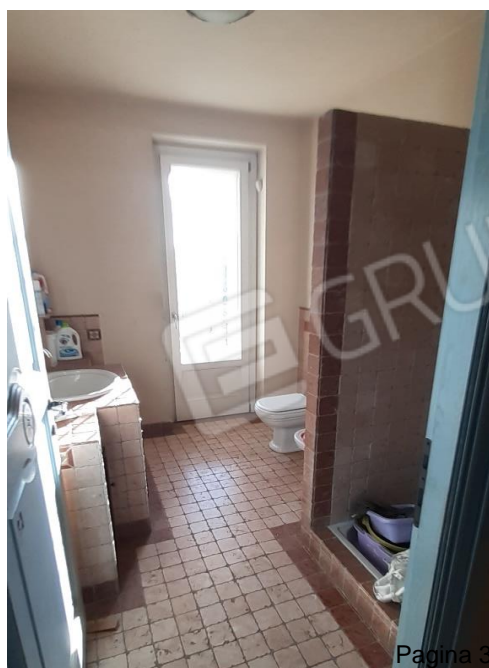
Servizio igienico PT