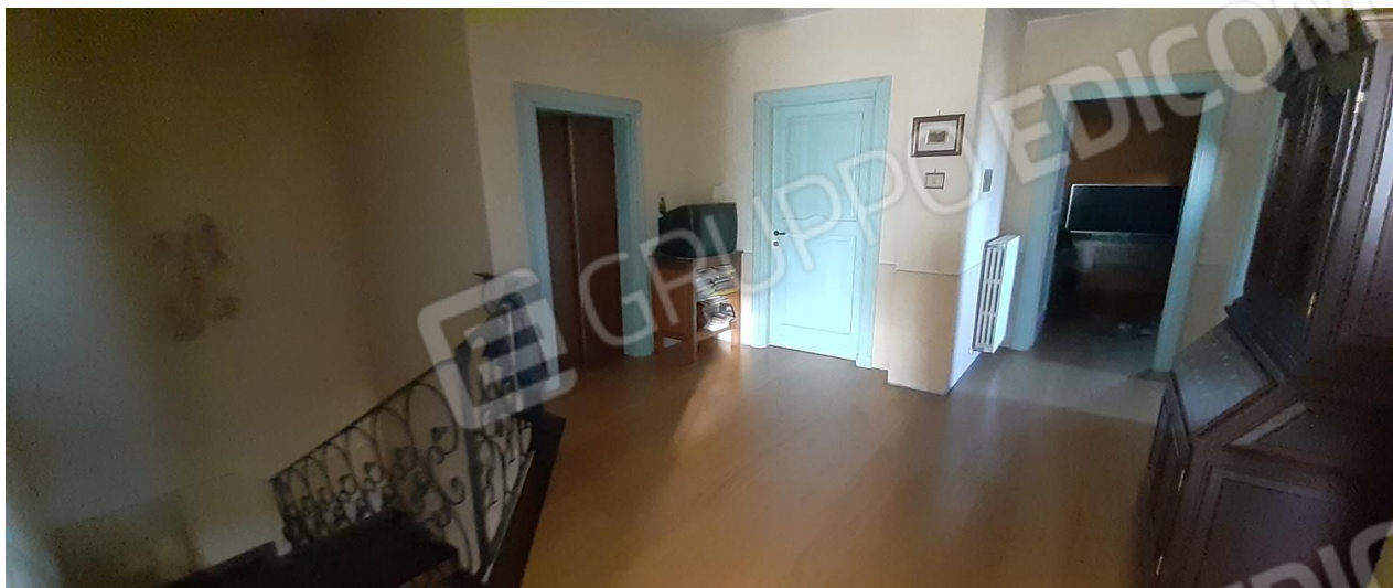
Zona disimpegno al P1 - è possibile notare anche lo sbarco dell'ascensore