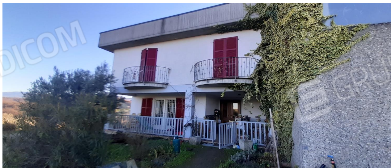
Vista fonte abitazione