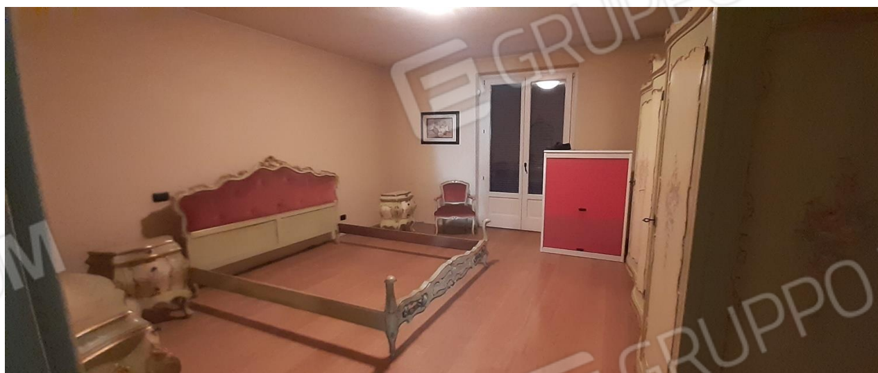
Vano evidentemente con destinazione a camera da letto P1 - difformità alla destinazione d'uso in quanto accatastata come cucina così come come il vano a fianco che risulta accatastato come soggiorno ed utilizzato come camera da letto