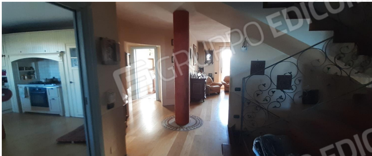
Ingresso del fabbricato residenziale PT adibito ad abitazione in difformità alla destinazione d'uso