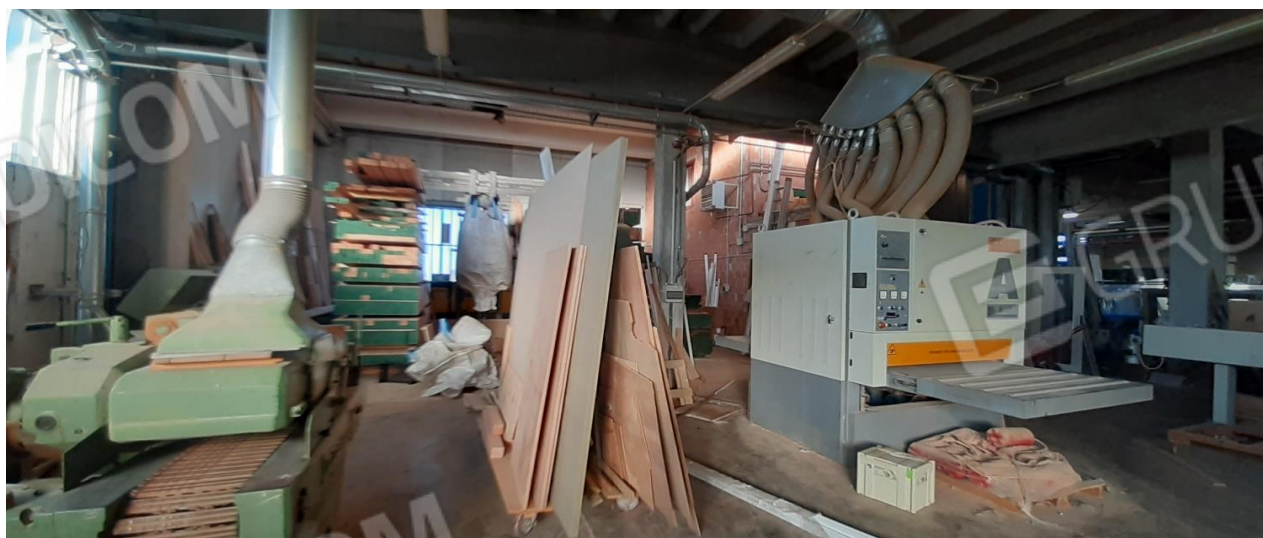
Primo spazio dell'area produttiva in prossimità della strada e della zona uffici