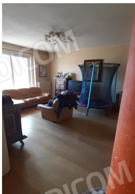
Vano adibito a soggiorno PT