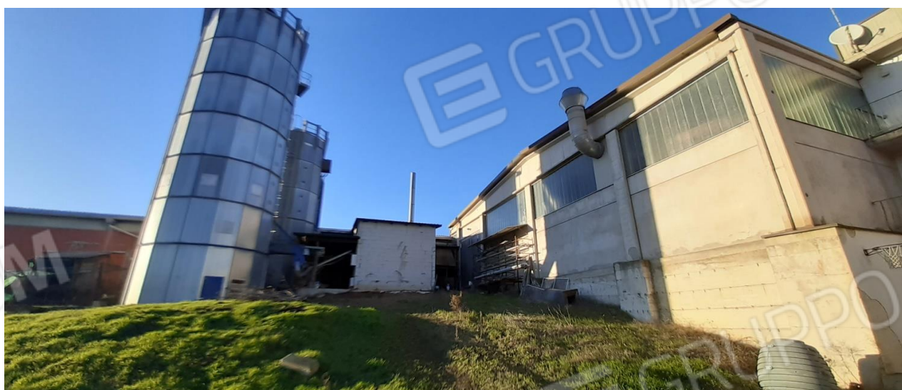
Vista retro opificio con silos e CT