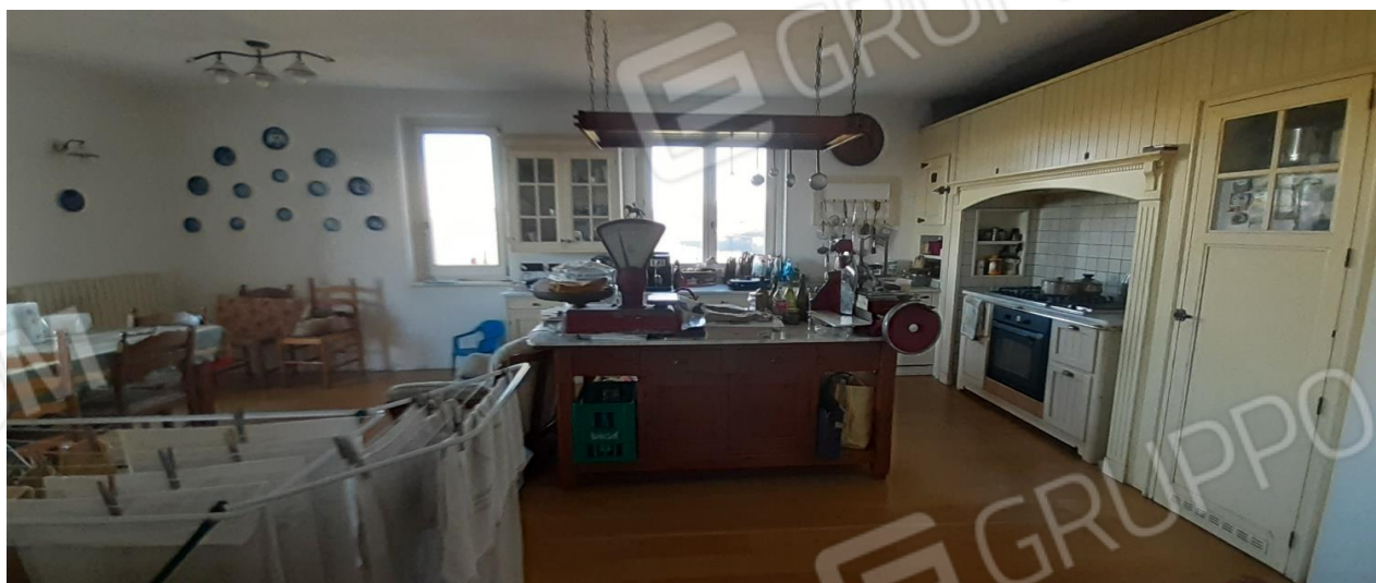
Vano evidentemente con destinazione cucina PT - difformità alla destinazione d'uso in quanto accatastata come ufficio