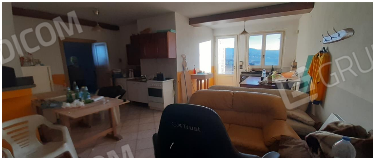
Vano accessorio al piano seminterrato utilizzato come taverna Pagina 5