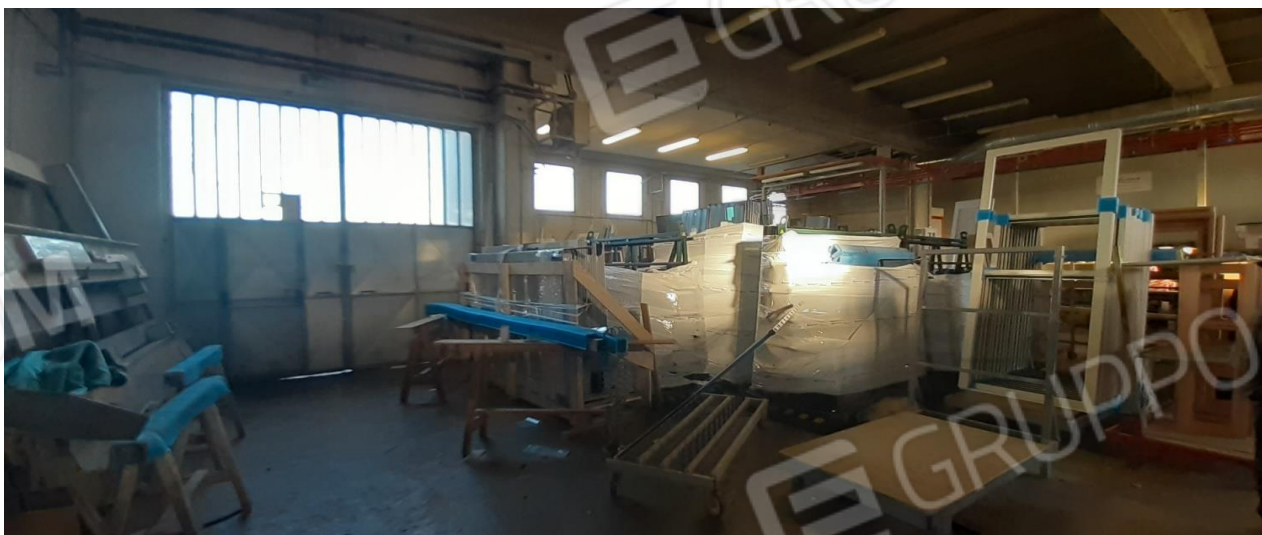
Zone di lavorazione nel capannone posto tra l'abitazione ed il primo costruito