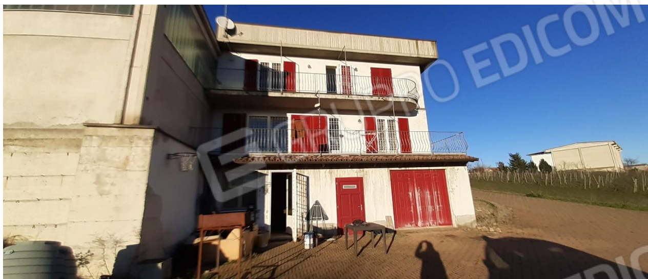
Vista retro abitazione ed area di pertinenza