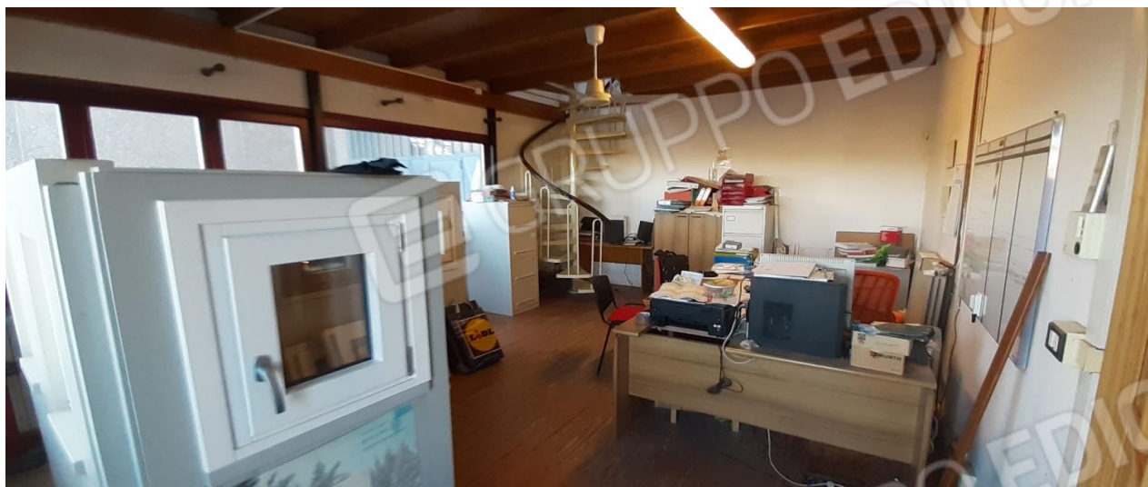
Zona uffici posta sul fronte strada