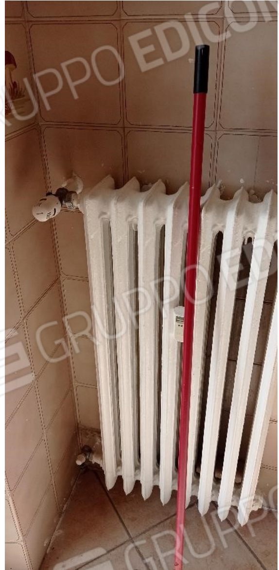
17. Dettaglio radiatore