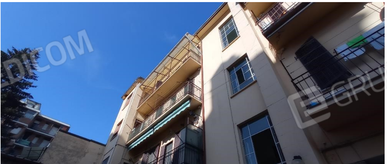
4. Prospetto interno cortile