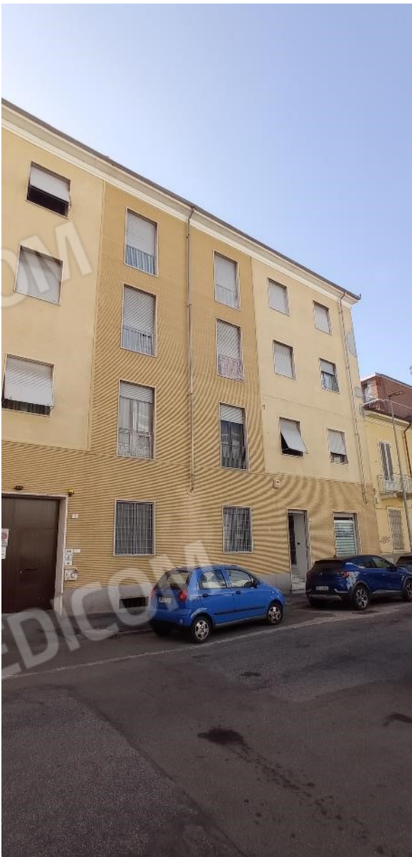
2. Prospetto su Via Manzoni