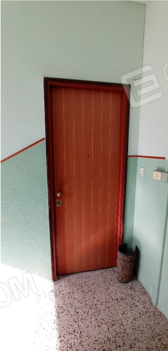
9. Ingresso abitazione