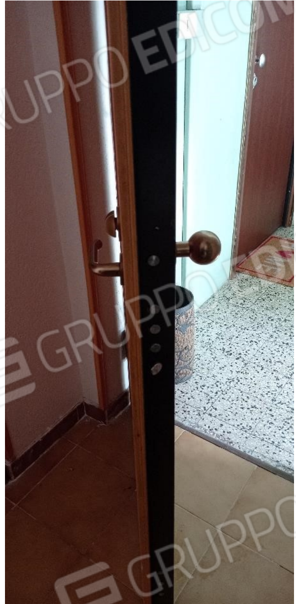
10. Dettaglio portoncino di ingresso