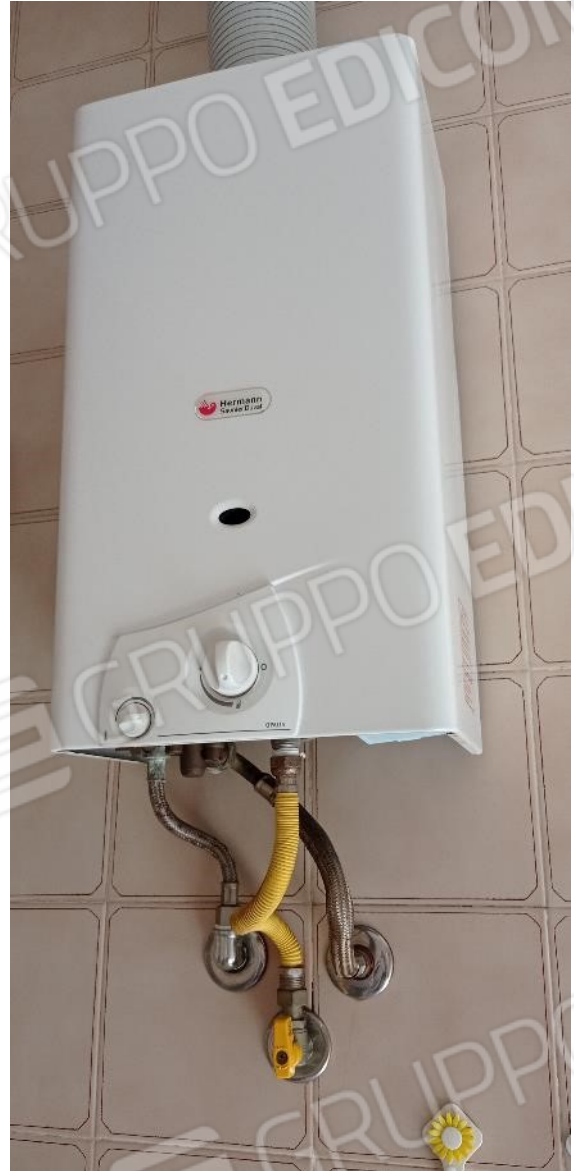
14. Scalda acqua