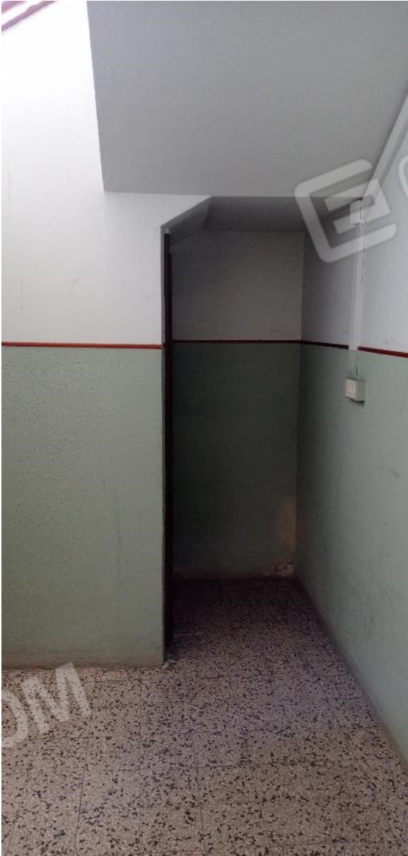
7. Accesso al piano cantine