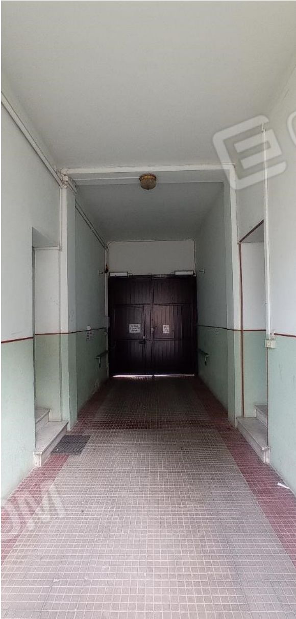
5. Androne accesso principale al fabbricato