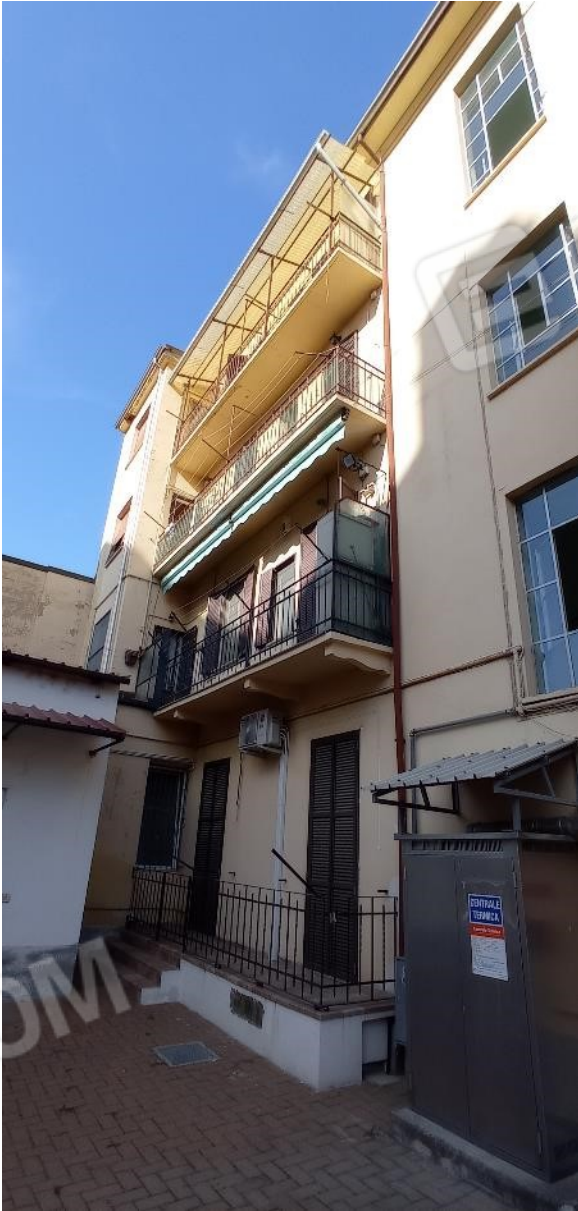
3. Prospetto interno cortile