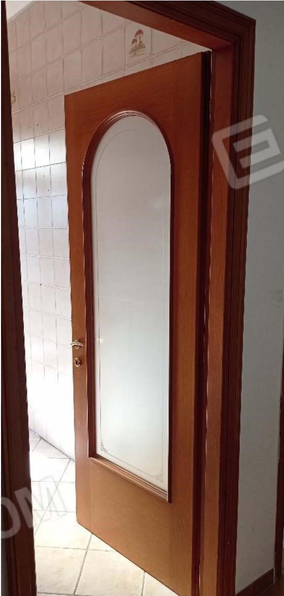
13. Porte interne