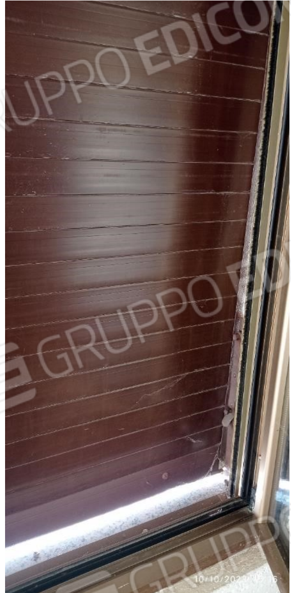
25. Dettaglio tapparelle