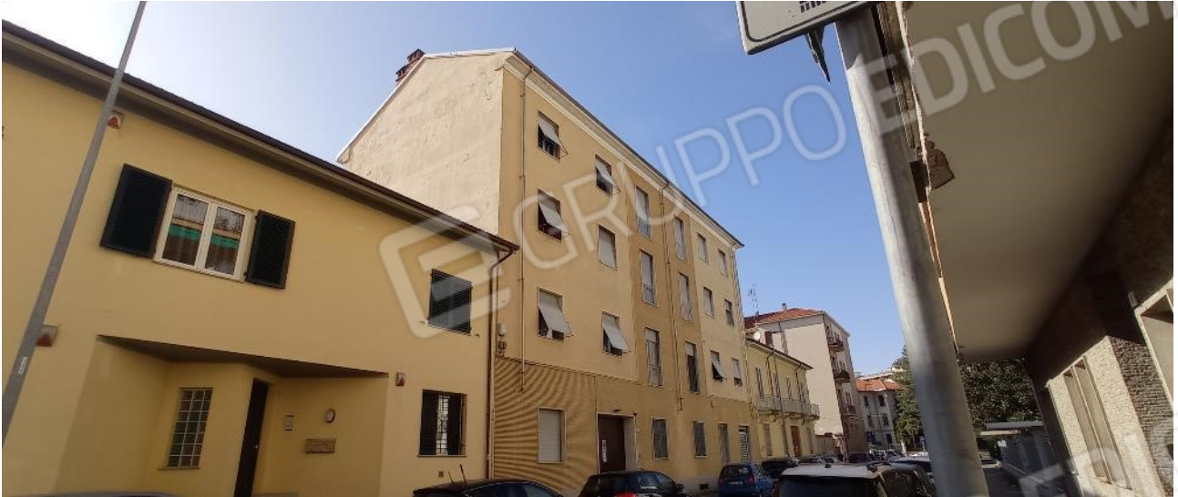
1. Prospetto su Via Manzoni