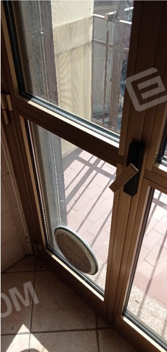
16. Dettaglio serramento cucina