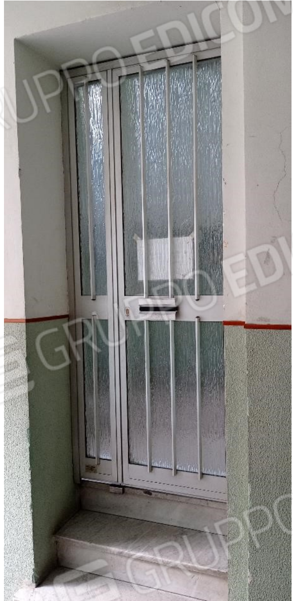
6. Portoncino di ingresso al vano scala