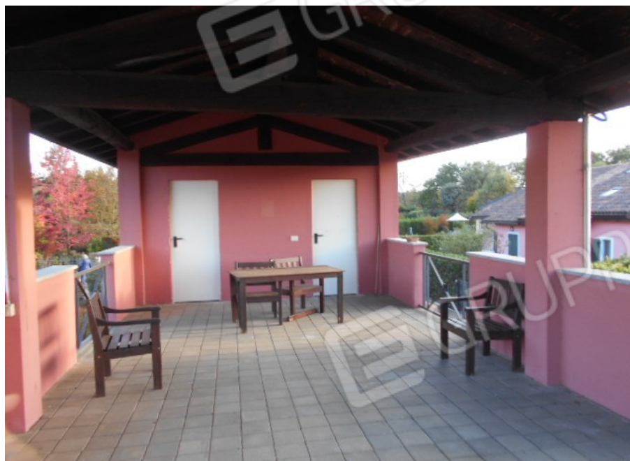
il porticato e le porte di servizi e spogliatoi