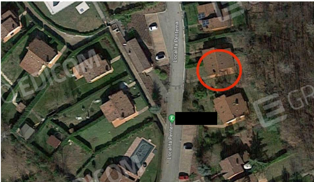
la posizione dell'abitazione in procedura