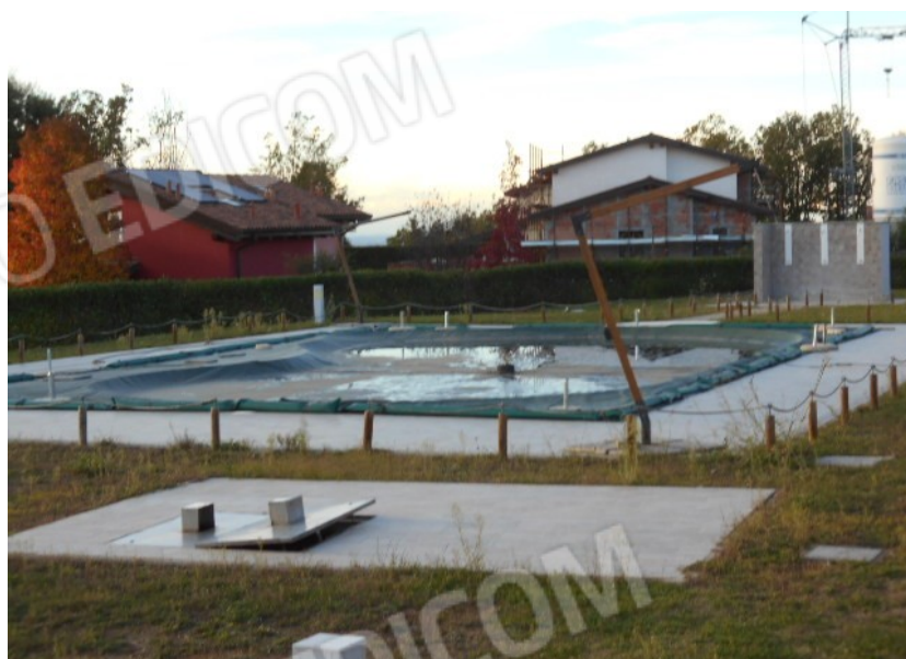
l'area della piscina nella stagione invernale