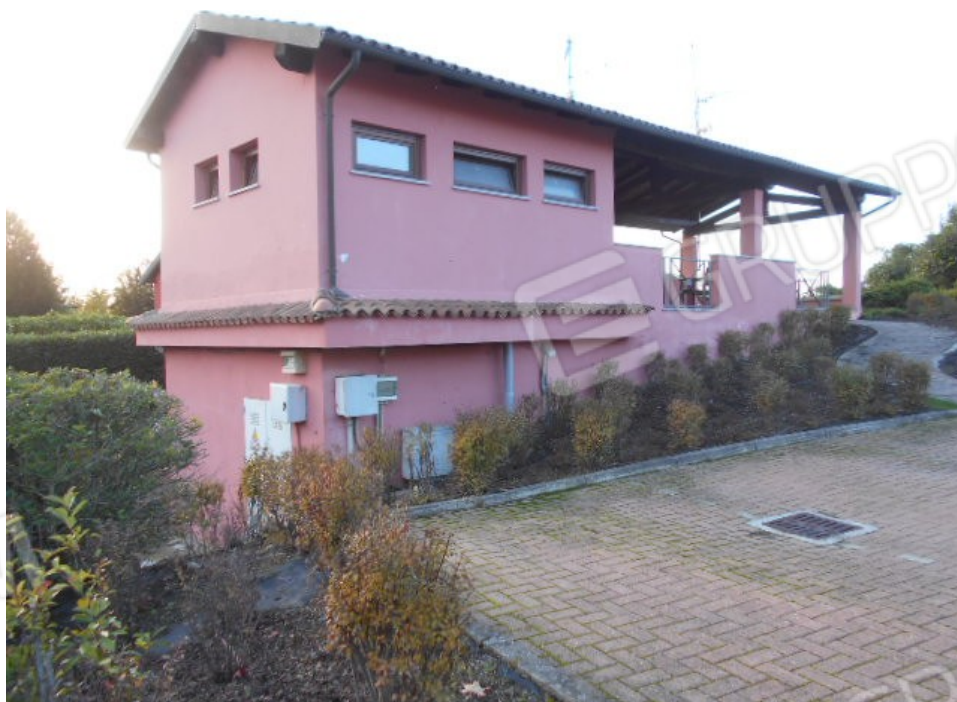
gli immobili condominiali