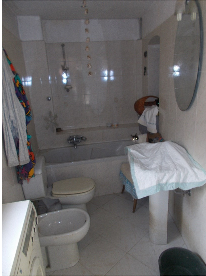
5. Particolare interno - bagno