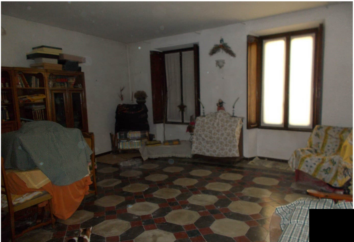
4. Particolare interno - sala