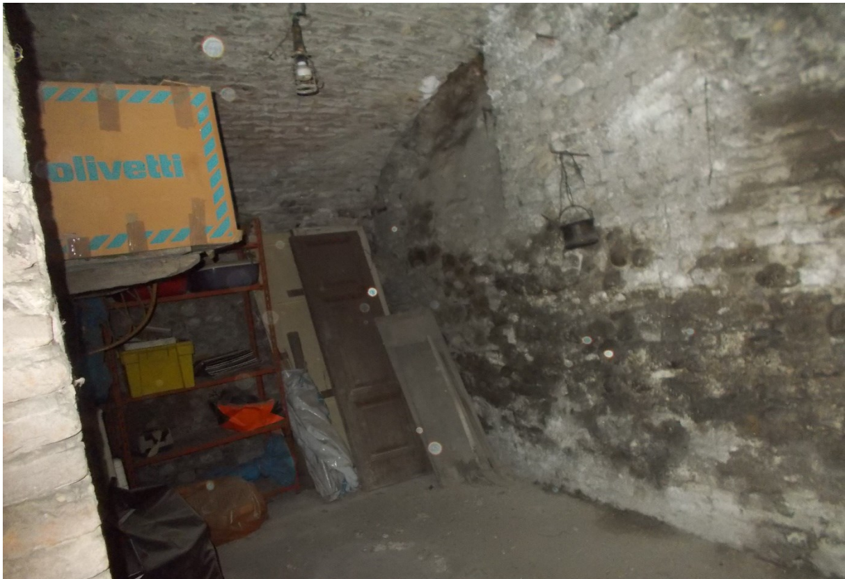
6. Particolare interno - cantina