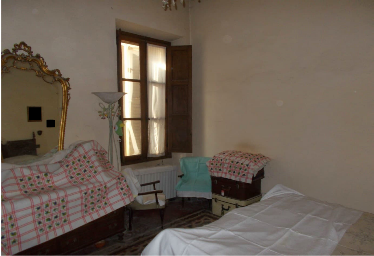
3. Particolare interno - camera