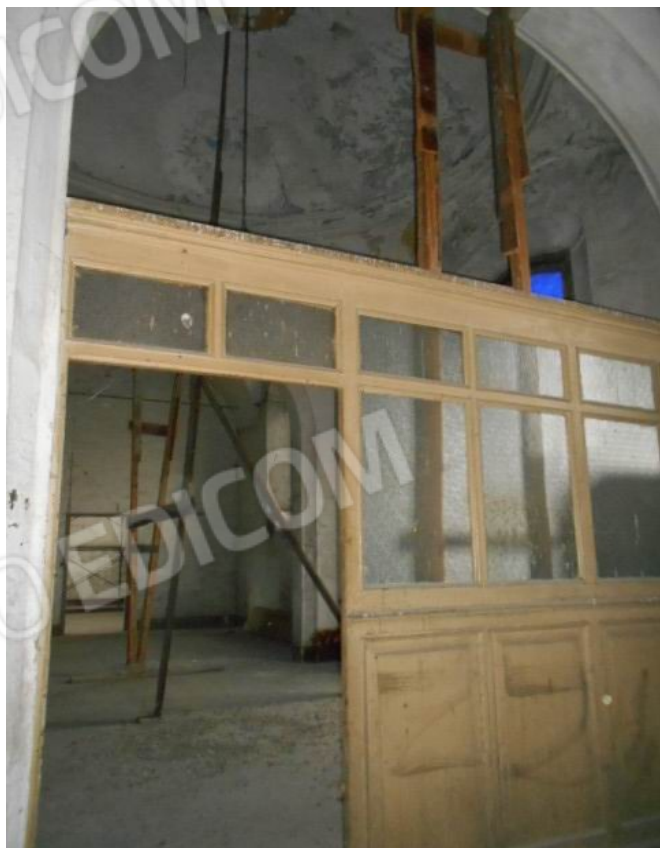
e gli ambienti al piano nobile (fg.32 n.1024 sub.21)