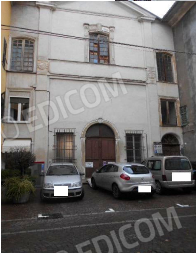
la testata sud e l'ingresso su via Cavour