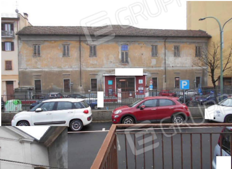
il fronte nord su c.so Marengo