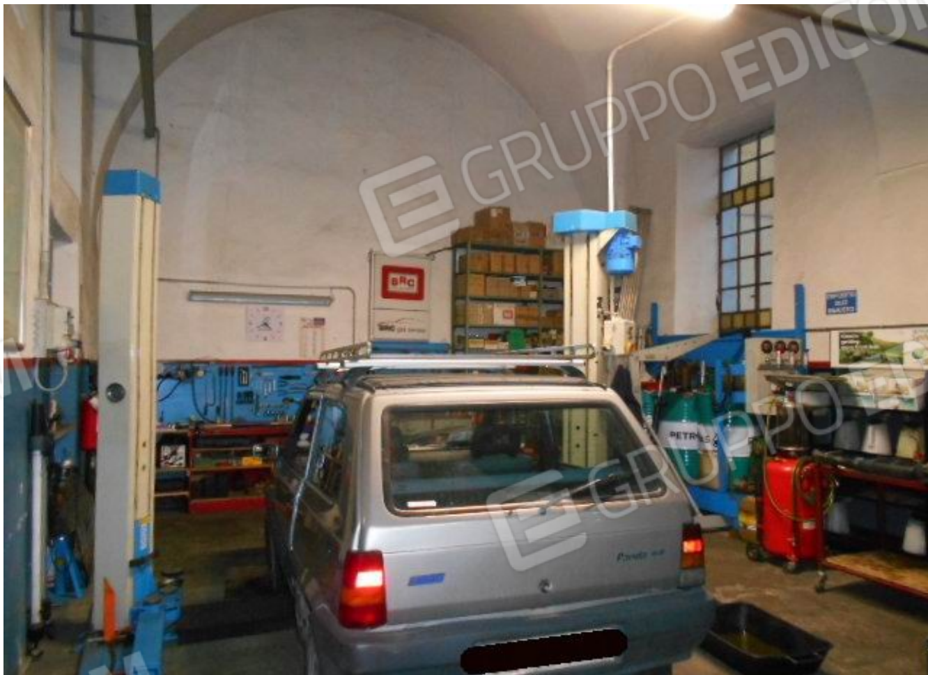
la campata terminale lato ovest che costituisce il fg.32 n.1024 sub.33 e il corrispondente spazio esterno graffato fg.32 n.147 sub.4