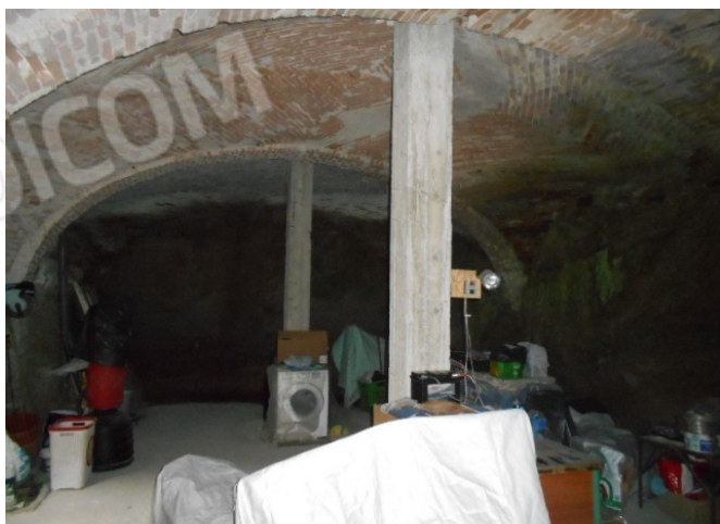
il piano terreno