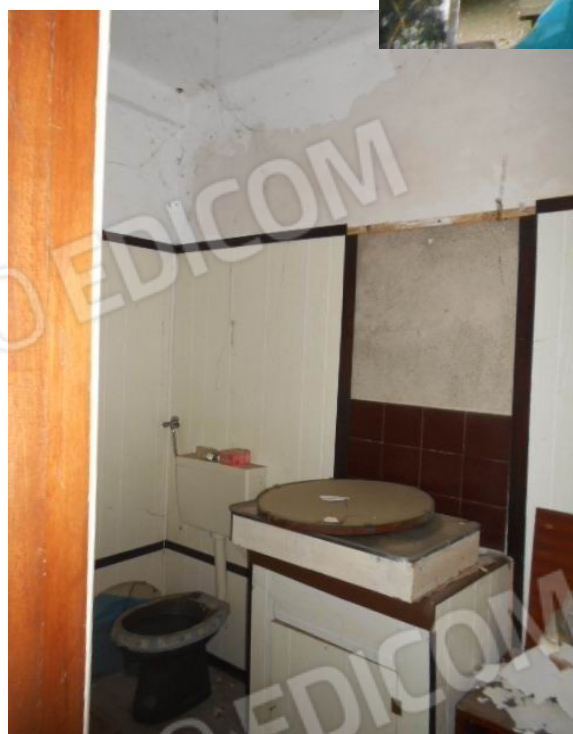
con servizio igienico