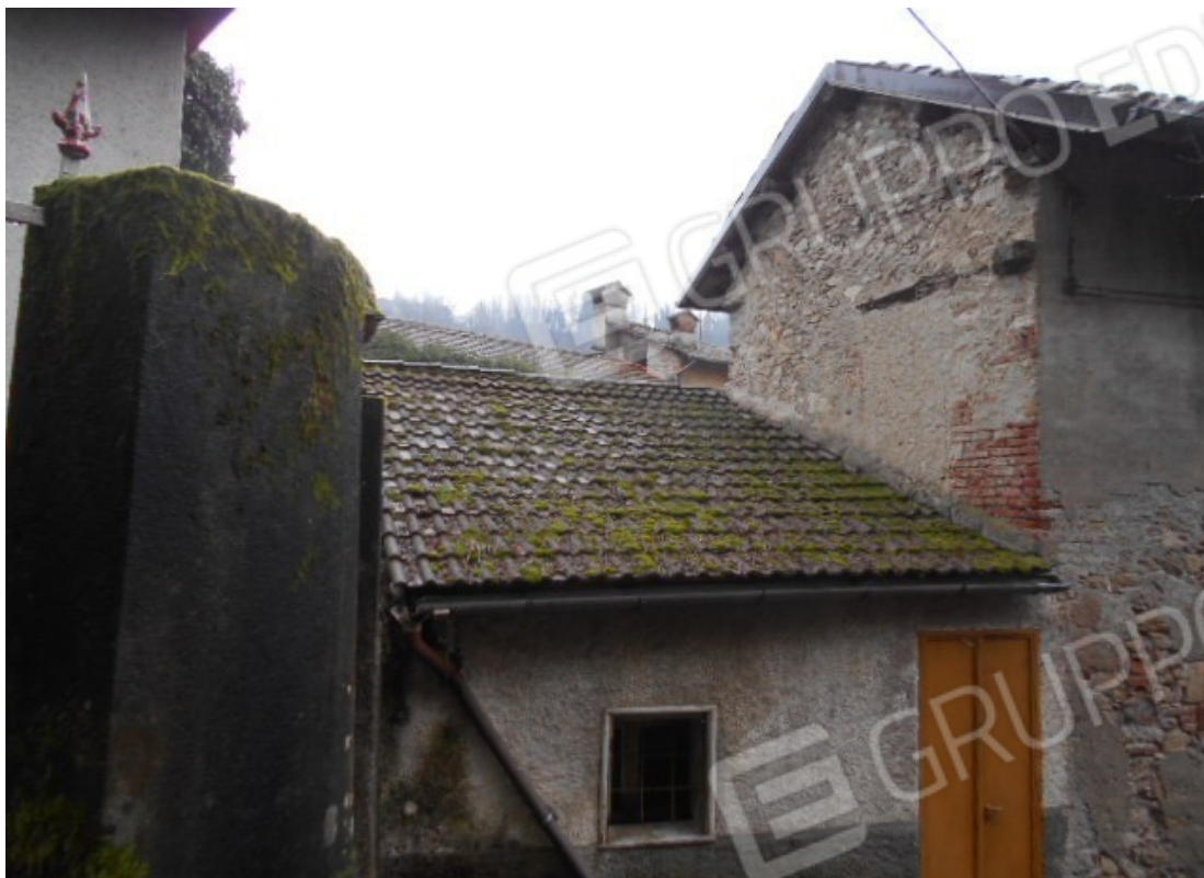
la testata nord con l'accesso da via del Forno direttamente al primo piano