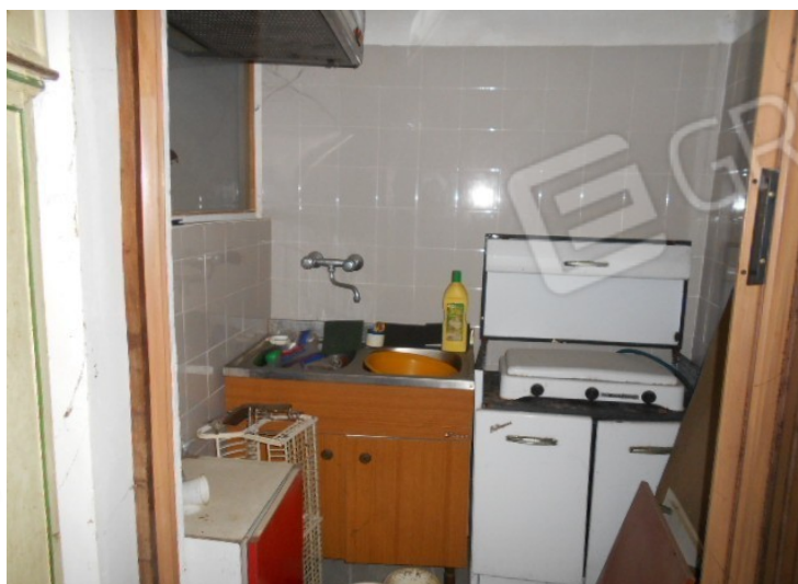
e angolo cottura