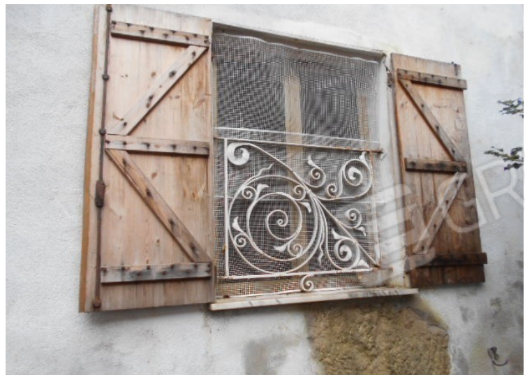
serramenti in alluminio (a filo pavimento a 1P) protezione e scuri esterni