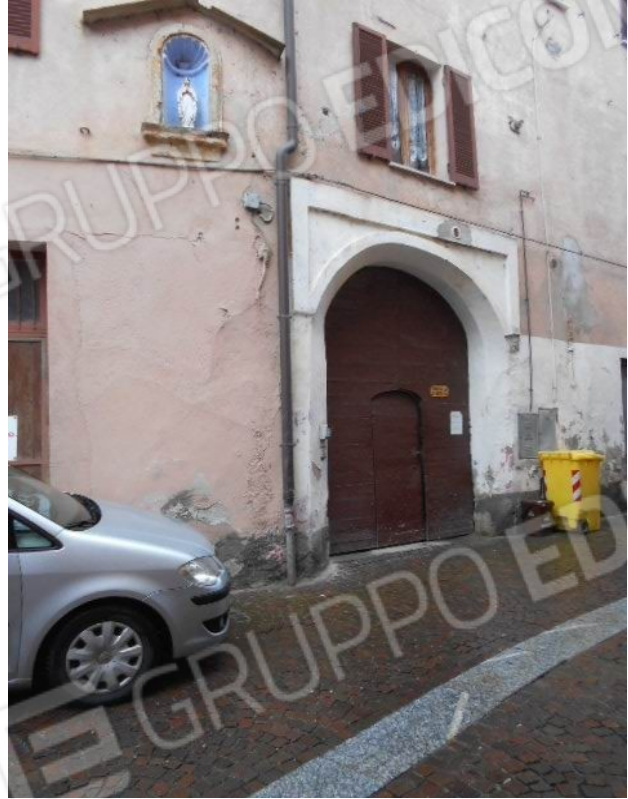
i fabbricati principali della corte sull'angolo via Visconti / via del Forno e il portone di ingresso al civico 5