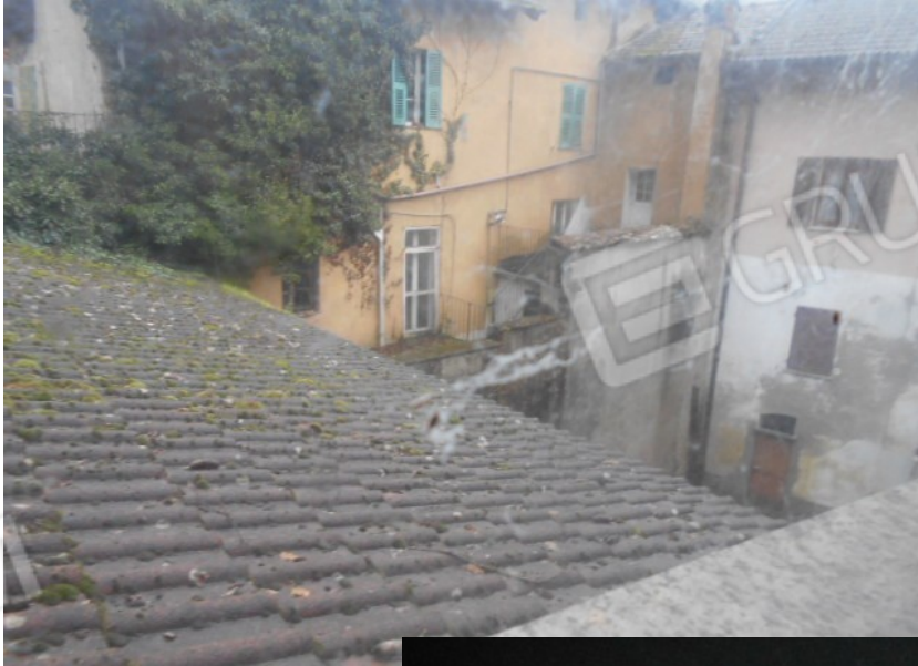
manto e coibentazione della copertura