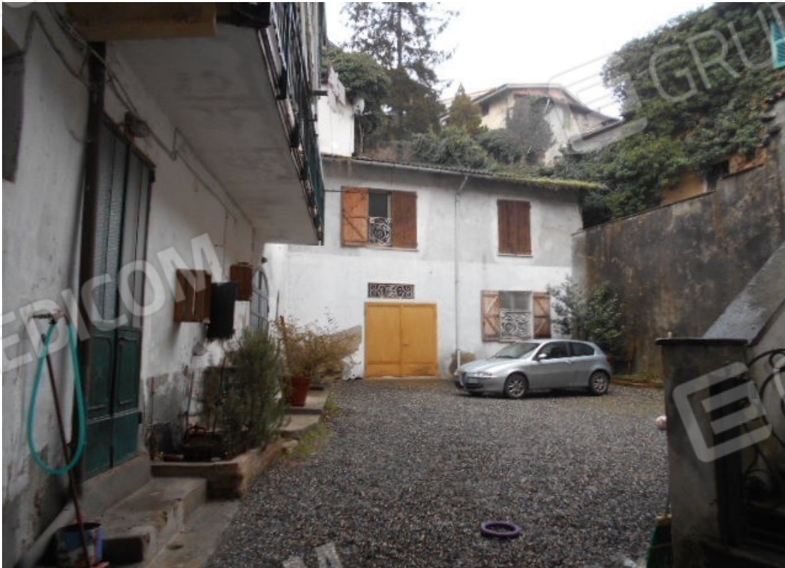
il fabbricato in procedura sul fondo della corte