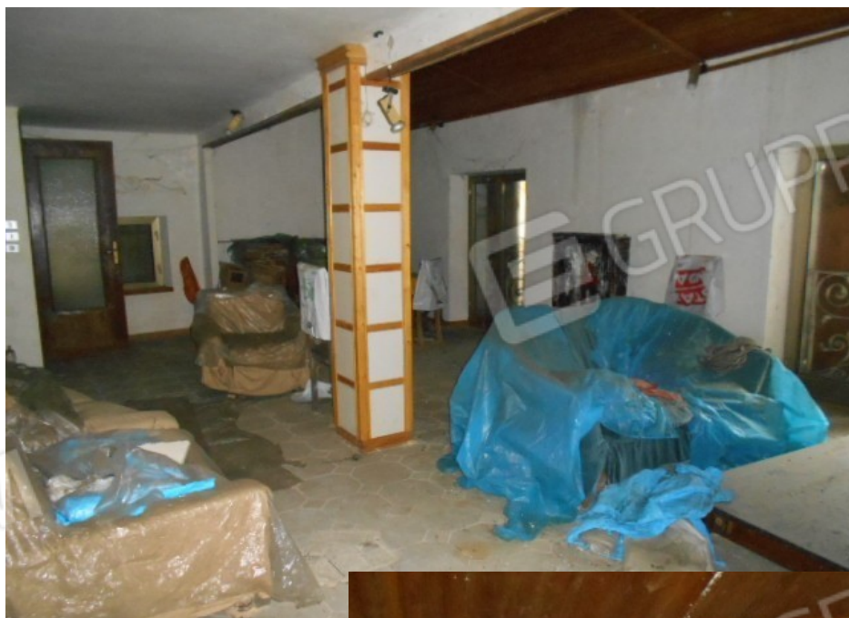
il primo piano