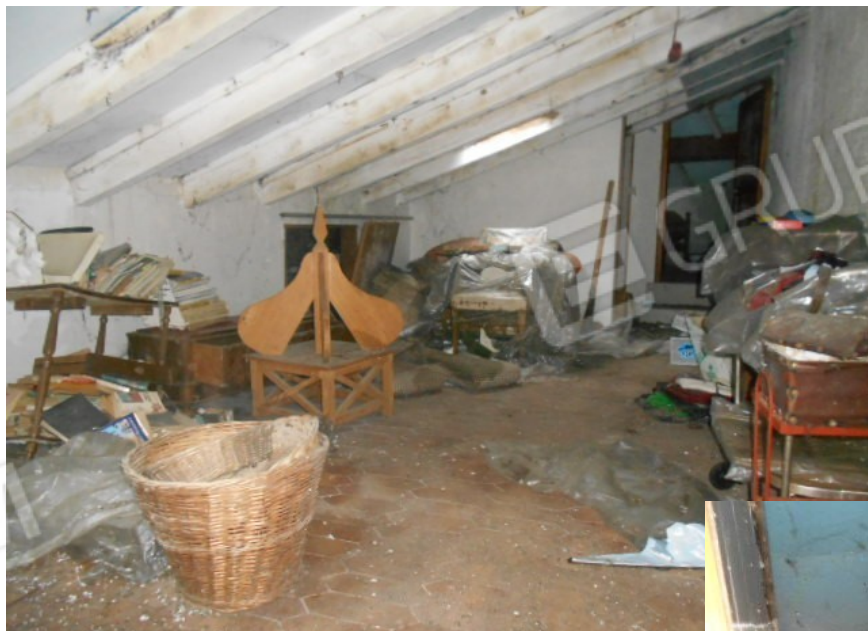
il piano soppalcato e il secondo servizio igienico