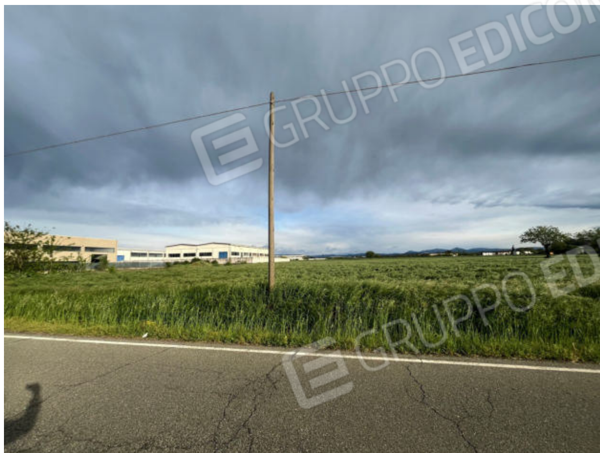
Bosco Marengo - Foglio 31 mappale 198-202-206-210-215