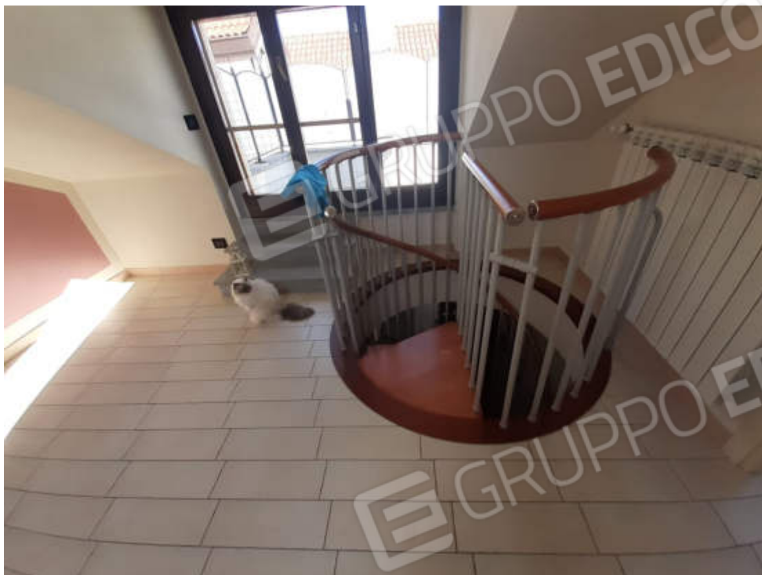
Vista interna scala collegamento quota piano secondo / sottotetto