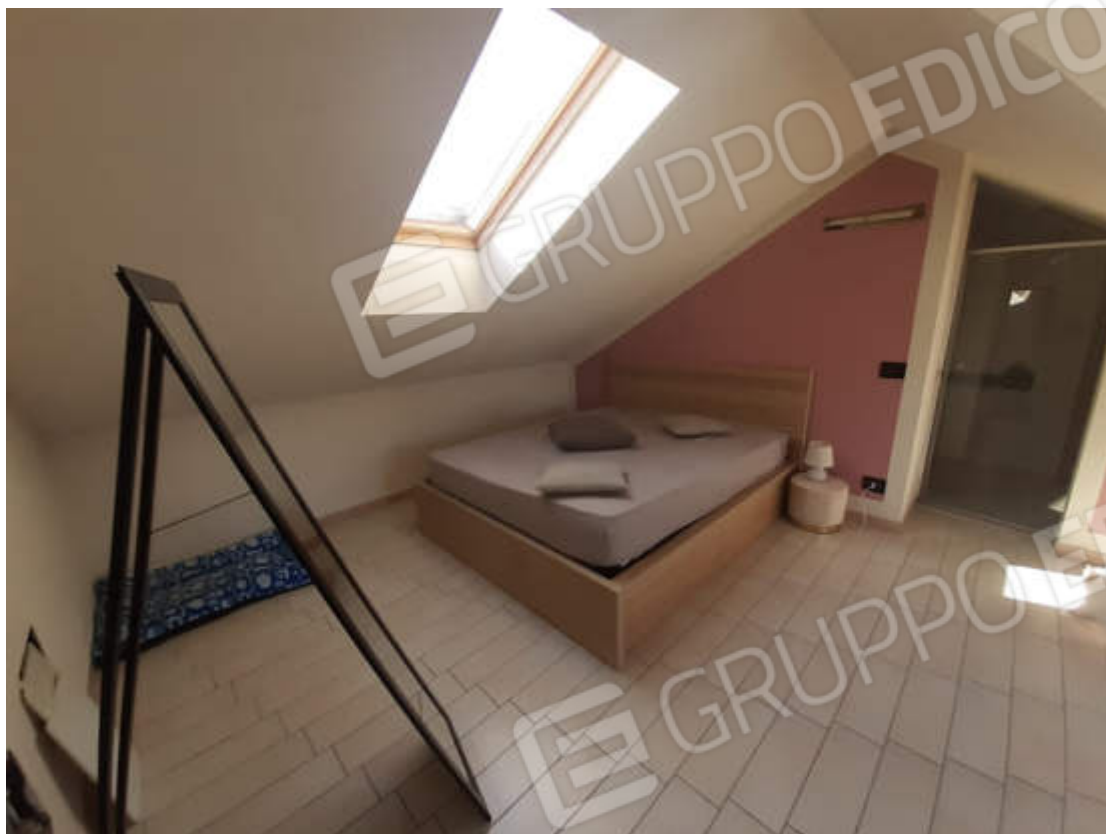
Vista interna locale camera letto in piano sottotetto