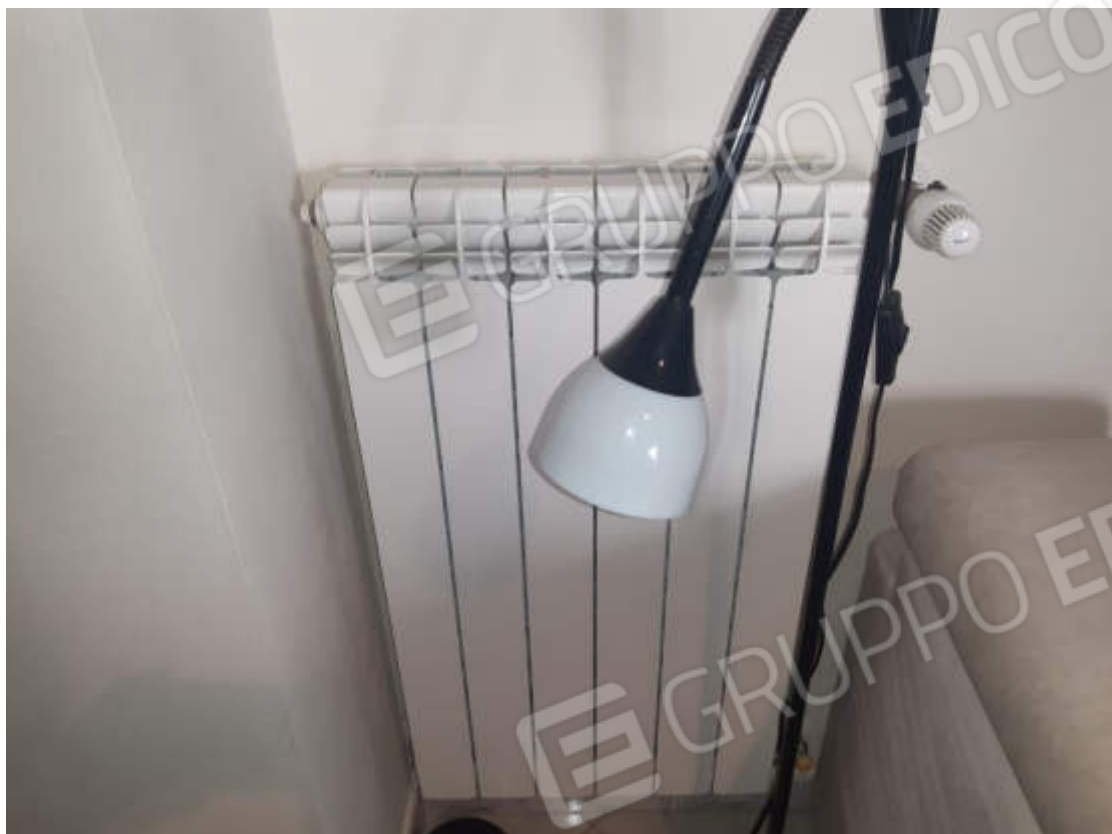
Vista particolare collettore impianto riscaldamento Tipologia batterie radianti a servizio dei locali di abitazione