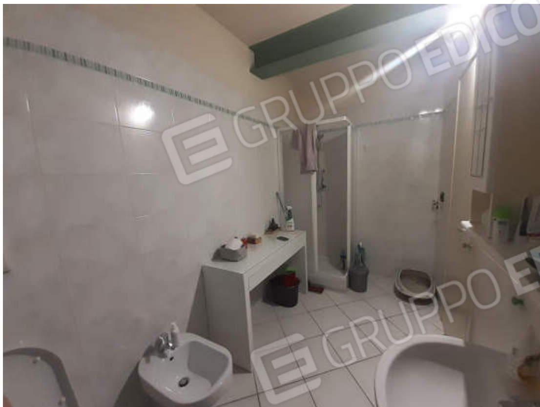
Vista interna locale bagno piano secondo