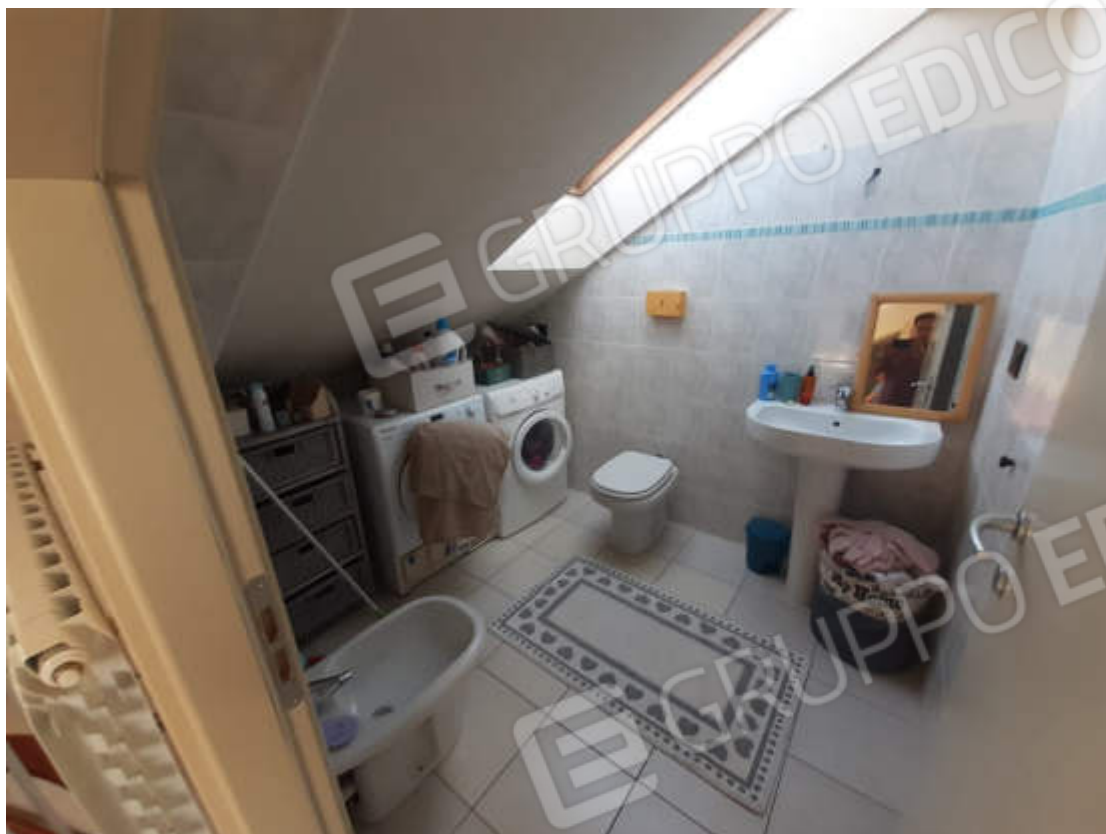
Vista interna locale bagno piano sottotetto