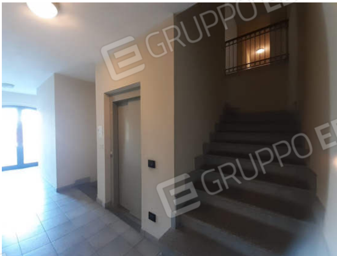
Vista interna dell'androne in piano terra di accesso alla scala condominiale “ C “