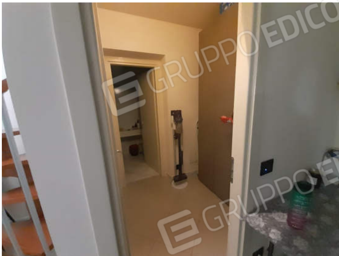
Vista interna locale antibagno piano secondo