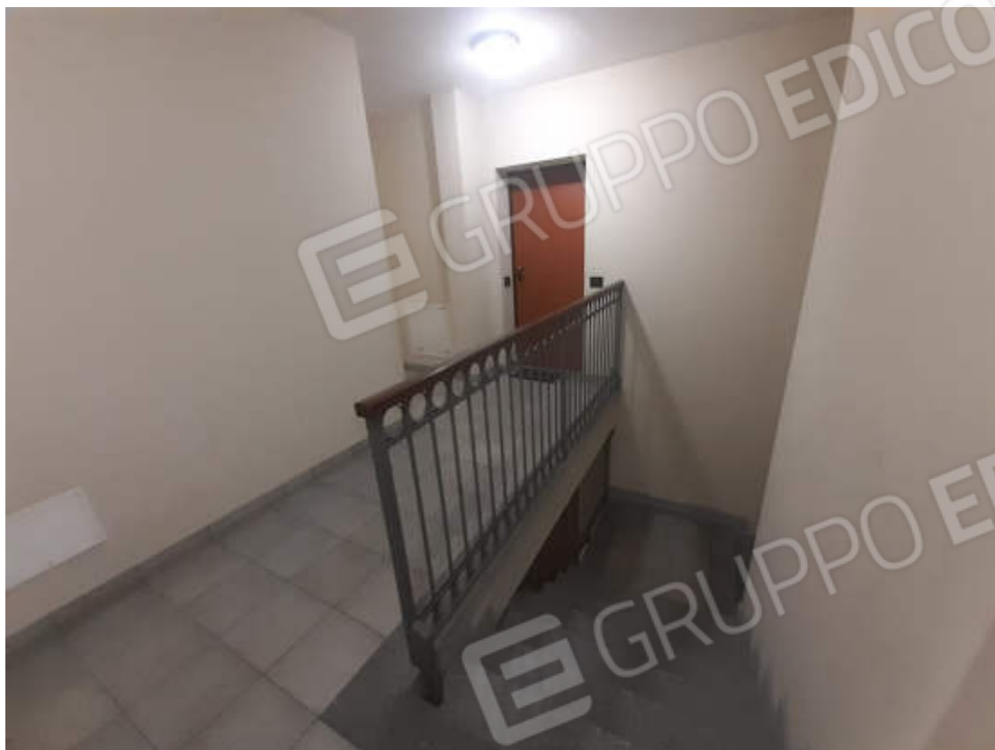
Vista corridoio comune in piano secondo di accesso alla U.I.U