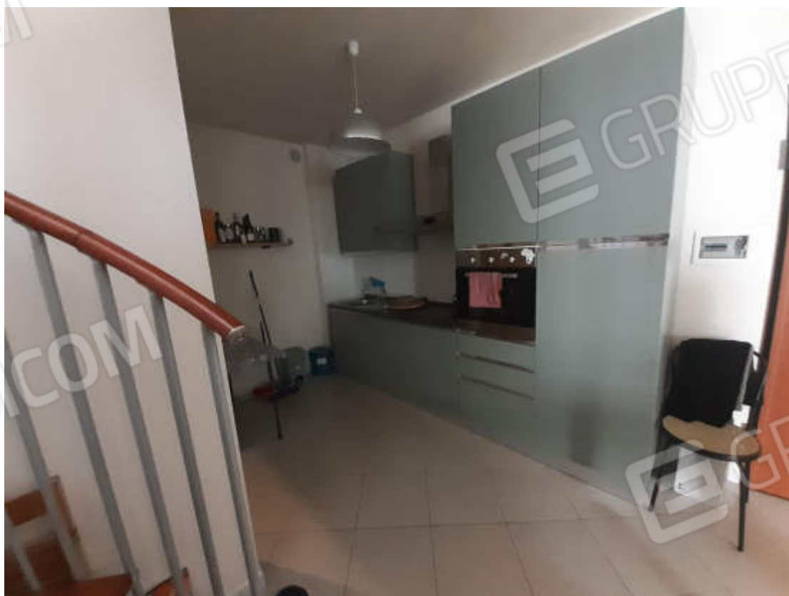
Vista interna zona cottura piano secondo