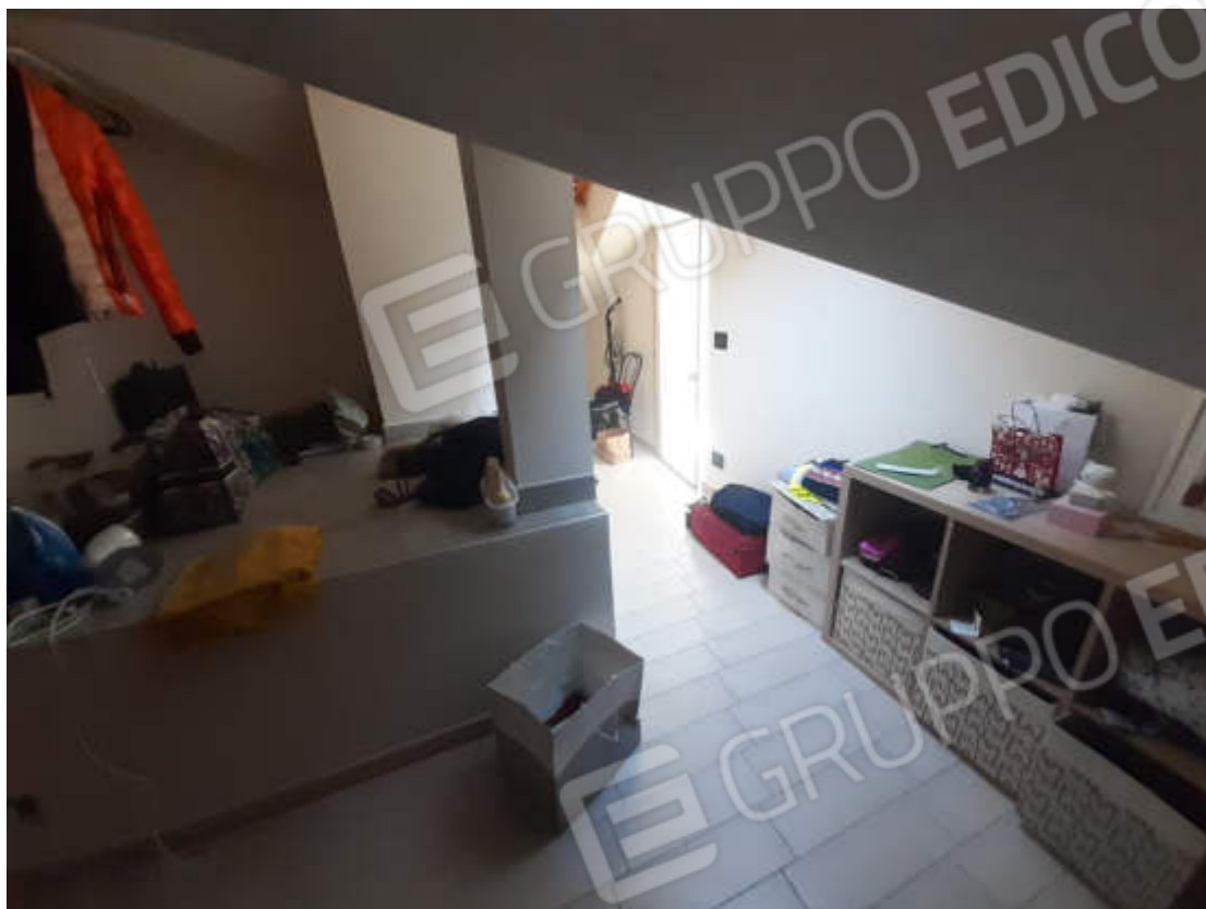
Vista interna locale cabina armadio / ripostiglio pano sottotetto