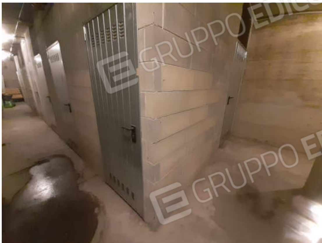
Vista da corridoio comune in piano interrato, del locale cantina pertinenziale