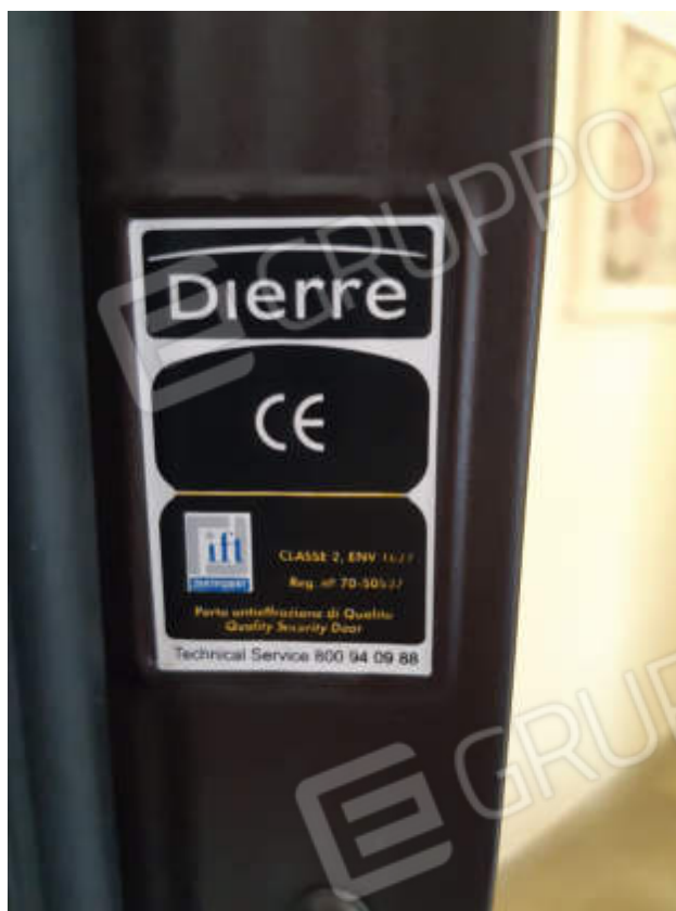
Vista del portoncino caposcala di accesso alla U.I.U.