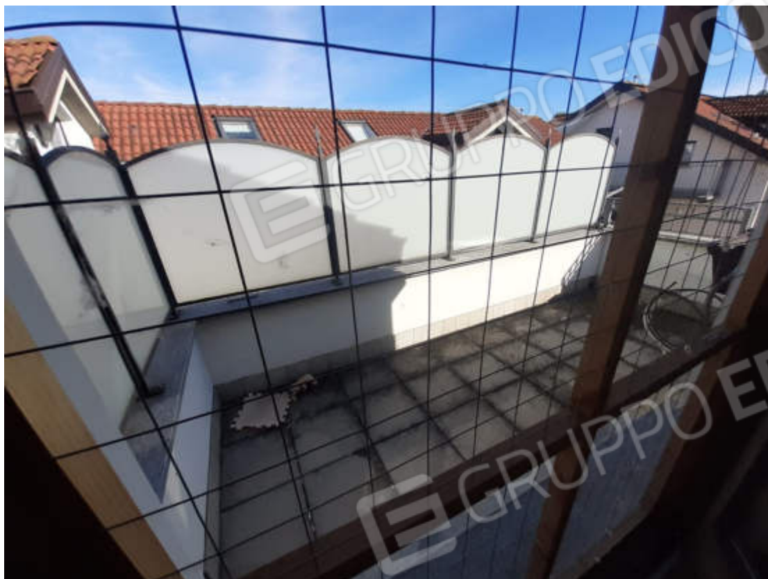
Vista esterna terrazzino pertinenziale piano sottotetto