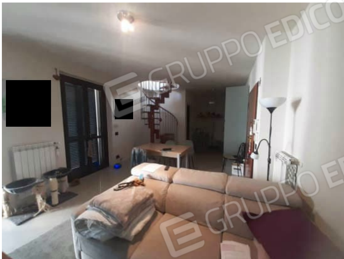
Vista interna locale ingresso / soggiorno piano secondo