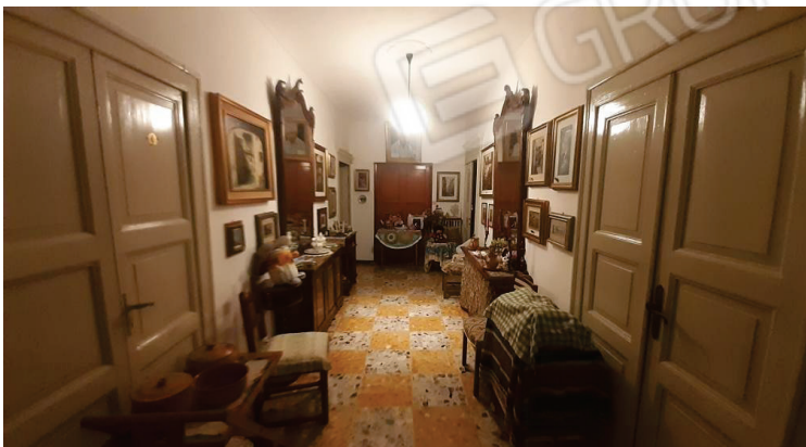
Vista interna, Corridoio - Lotto 2