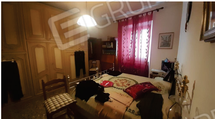
Vista interna, Camera - Lotto 2