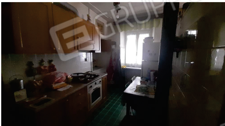
Vista interna, Cucina - Lotto 2