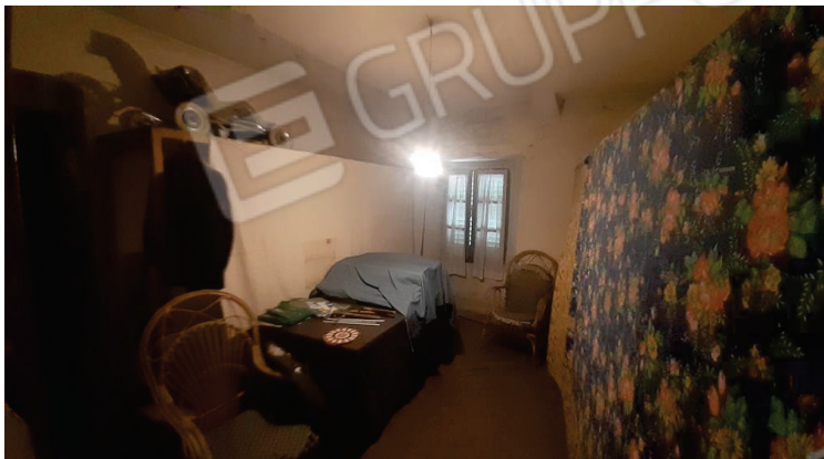
Vista interna, Camera - Lotto 2