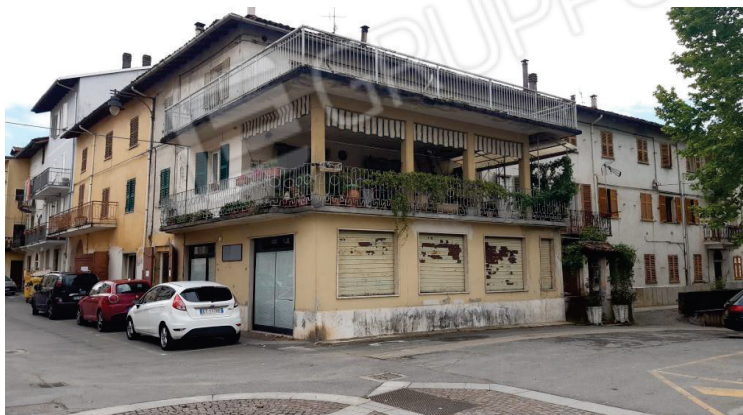
Vista generale del fabbricato