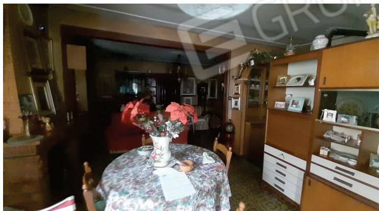
Vista interna, Soggiorno - Lotto 2