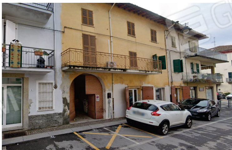
Accesso comune - androne carraio (Sub. 30)