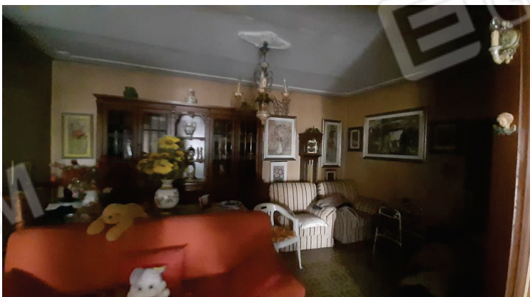
Vista interna, Soggiorno - Lotto 2