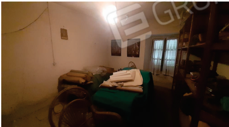
Vista interna, Camera - Lotto 2