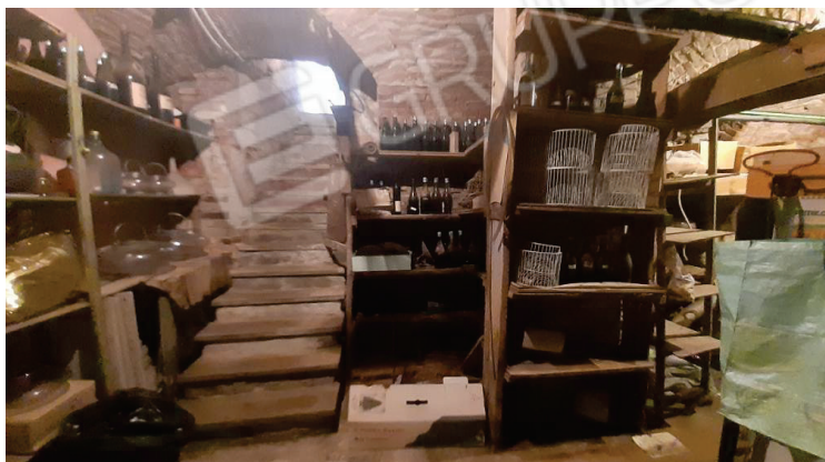
Vista della cantina - Lotto 2