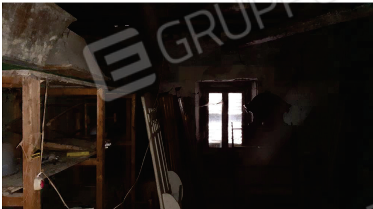
Piano secondo - Sottotetto - Lotto 2