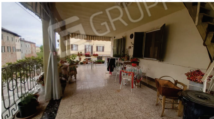
Vista del balcone su Piazza Umberto I - Lotto 2