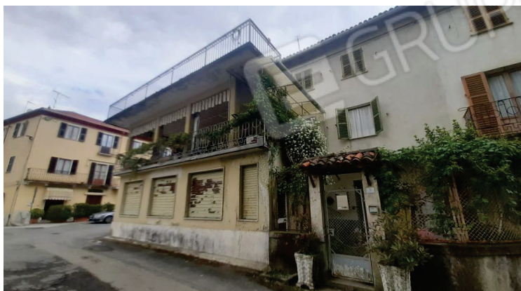
Vista del fabbricato dalla piazza Umberto I