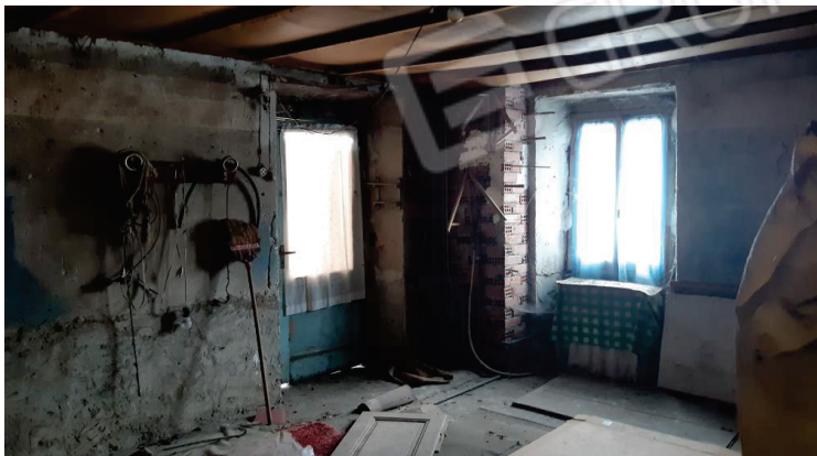
Piano secondo - Sottotetto - Lotto 2