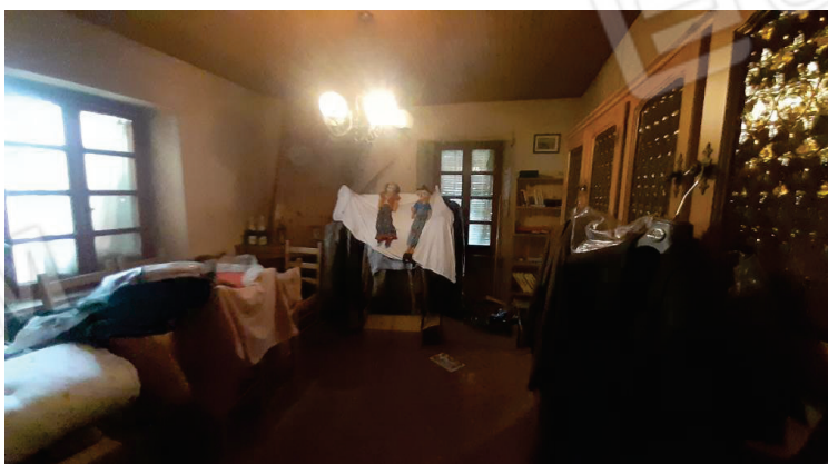
Vista interna, Camera - Lotto 2