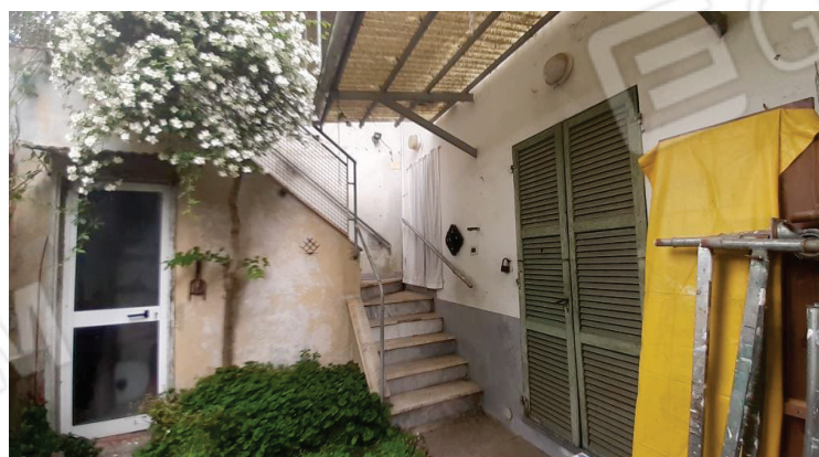
Vista della corte - Lotto 2