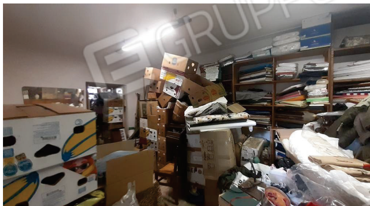
Vista interna, negozio - Lotto 1