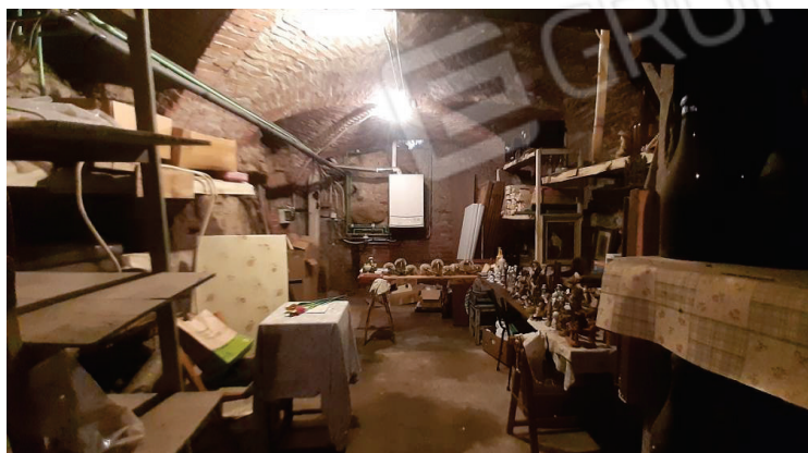
Vista della cantina - Lotto 2