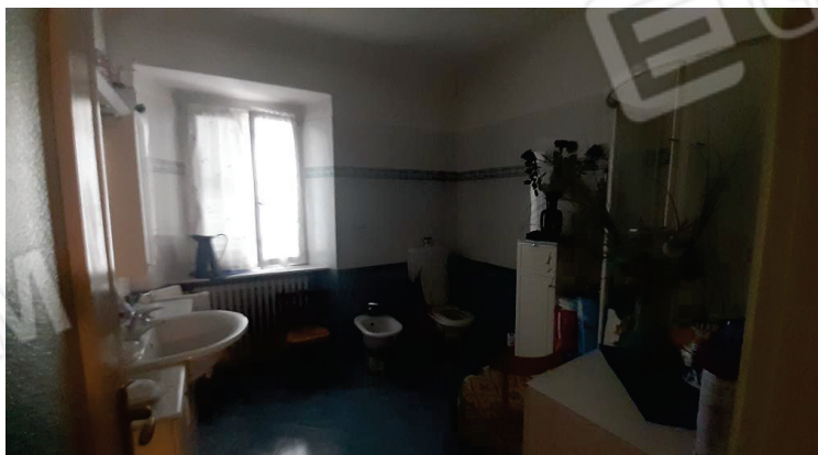
Vista interna, Bagno - Lotto 2