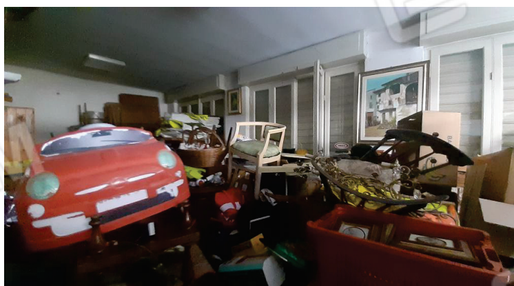
Vista interna, negozio - Lotto 1