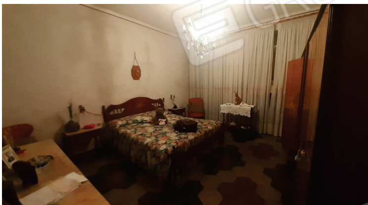
Vista interna, Camera - Lotto 2