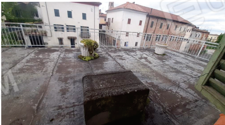
Vista interna, lastrico piano secondo - Lotto 2