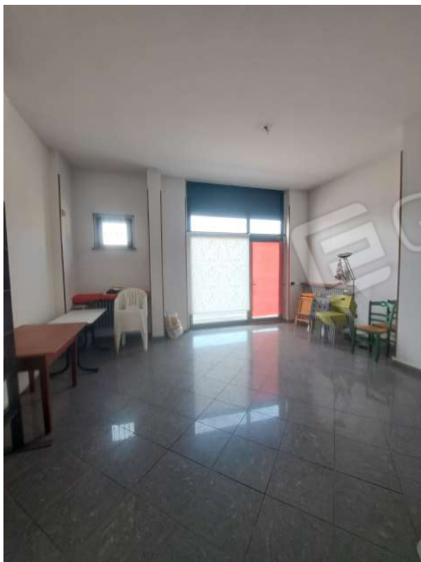
Figura 49- spazio verso via Casalbagliano