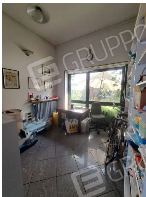
Figura 48- spazio verso area cortiliva