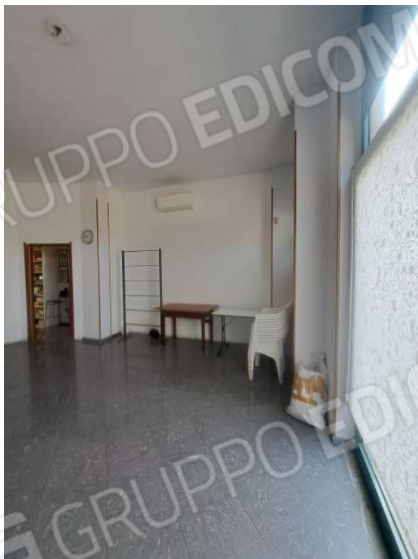
Figura 50- spazio verso via Casalbagliano