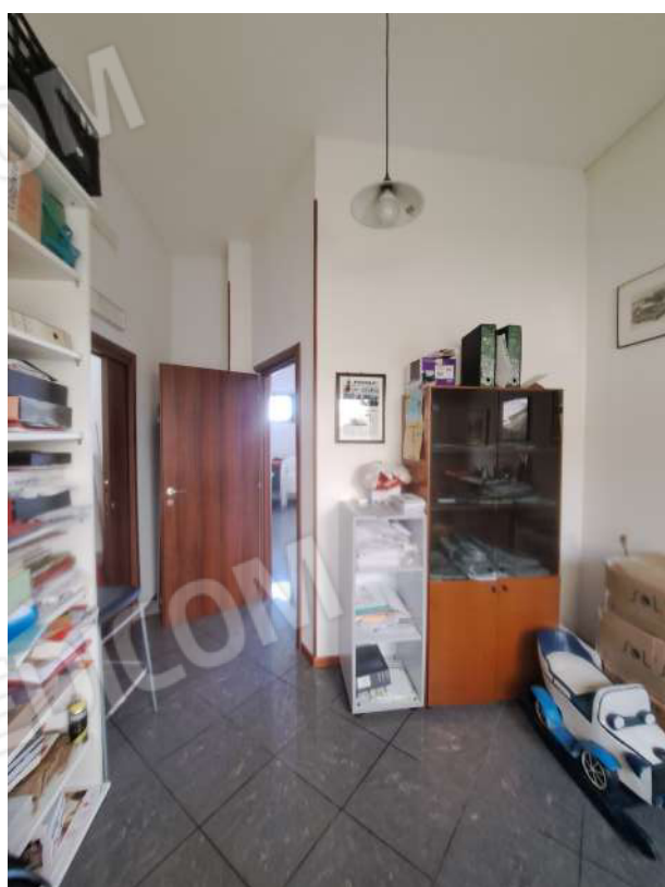
Figura 47- spazio verso area cortiliva