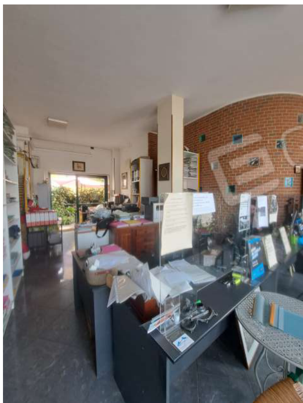
Figura 41- locale ad uso ufficio