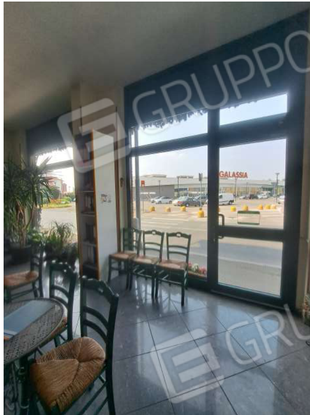
Figura 44- ingresso da via Casalbagliano