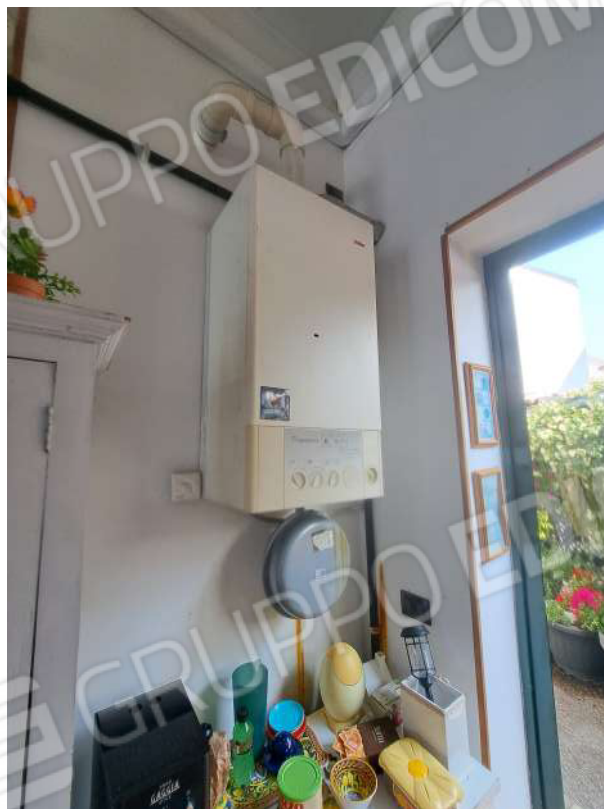
Figura 54- caldaia