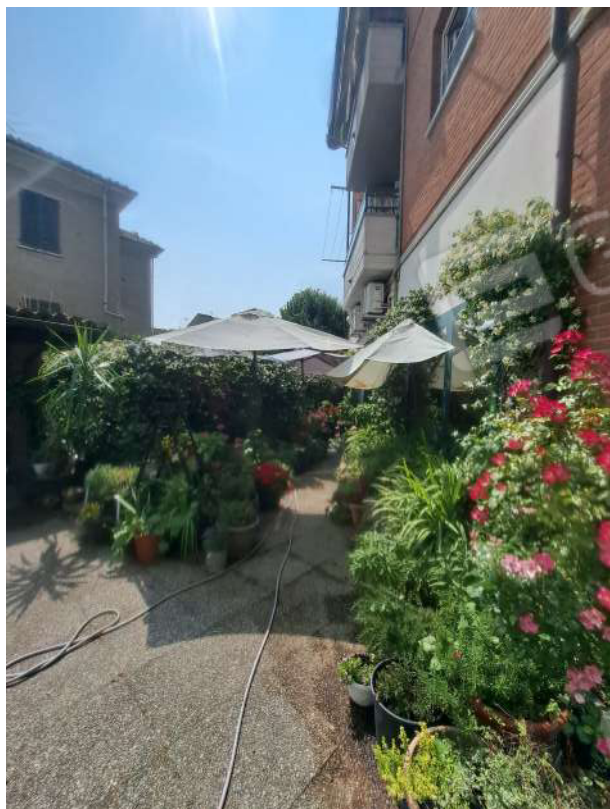
Figura 53- area cortiliva comune