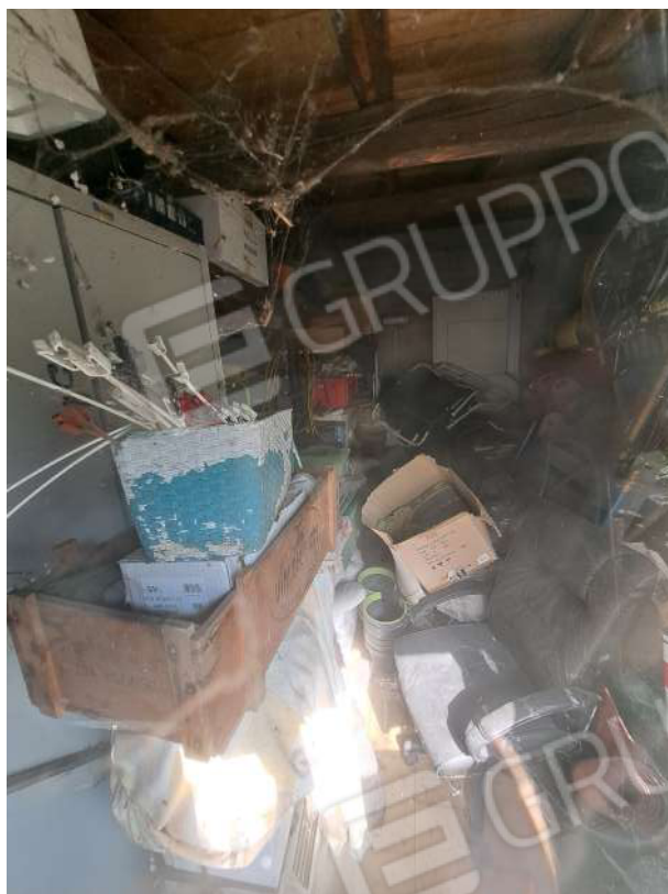
Figura 52- interno della tettoia lato Ovest