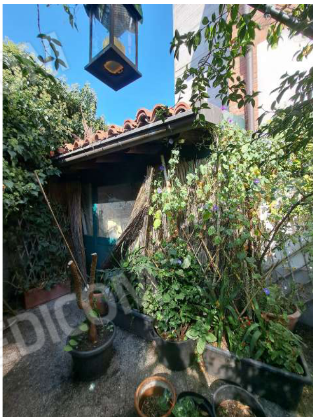
Figura 51- tettoia lato Ovest con serramento