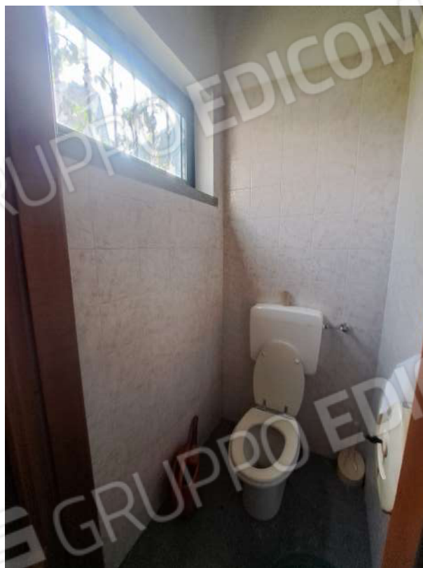
Figura 46- bagno