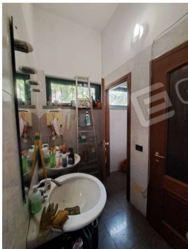
Figura 45- antibagno