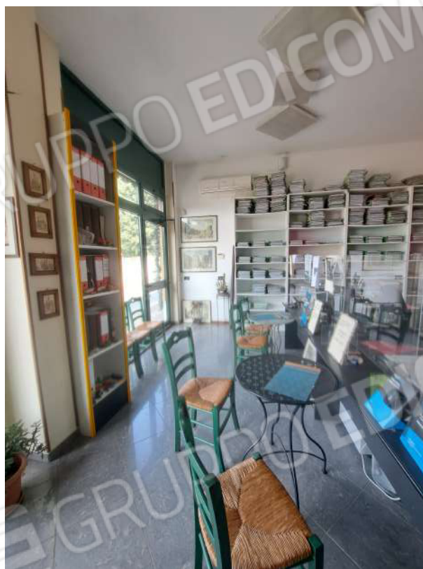
Figura 42- locale ad uso ufficio