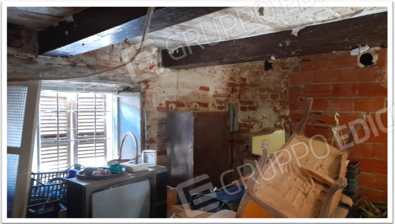
FOTOGRAMMA N. 13- ALTRA IMMAGINE DELL' INTERNO