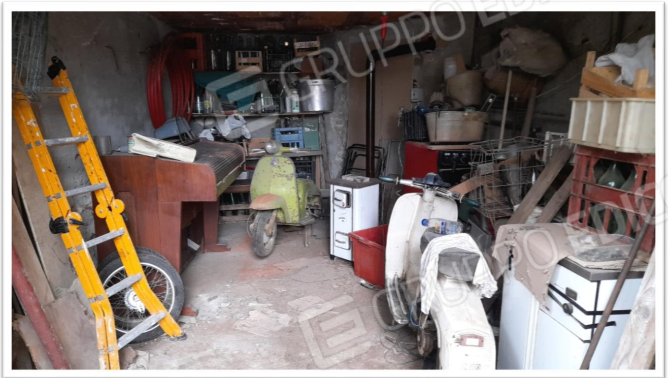
FOTOGRAMMA N 3- RIPOSTIGLIO A LATO DEI VANI DI ABITAZIONE