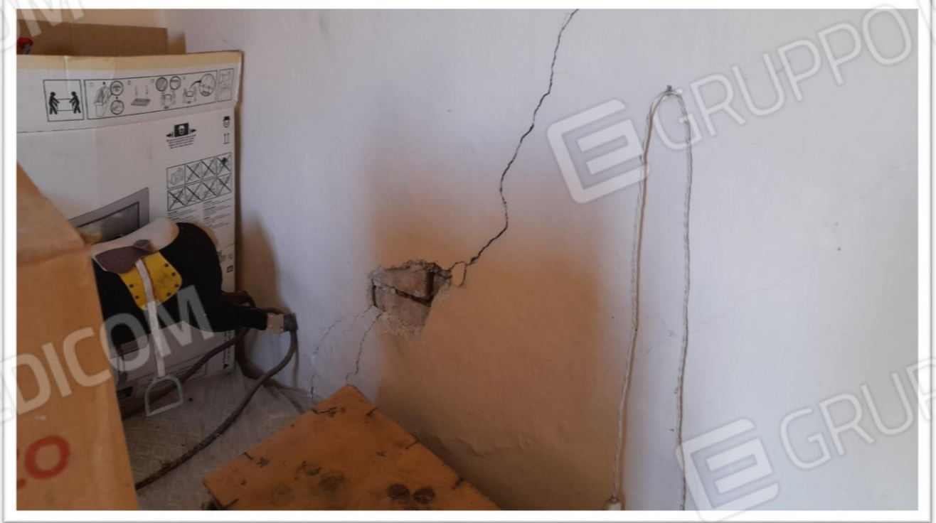
FOTOGRAMMA N. 12- FESSURAZIONE RILEVATE AL PIANO PRIMO