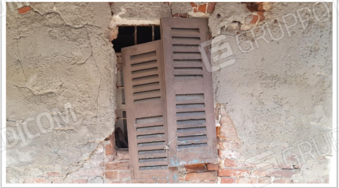
FOTOGRAMMA N. 14- SENZA COMMENTO