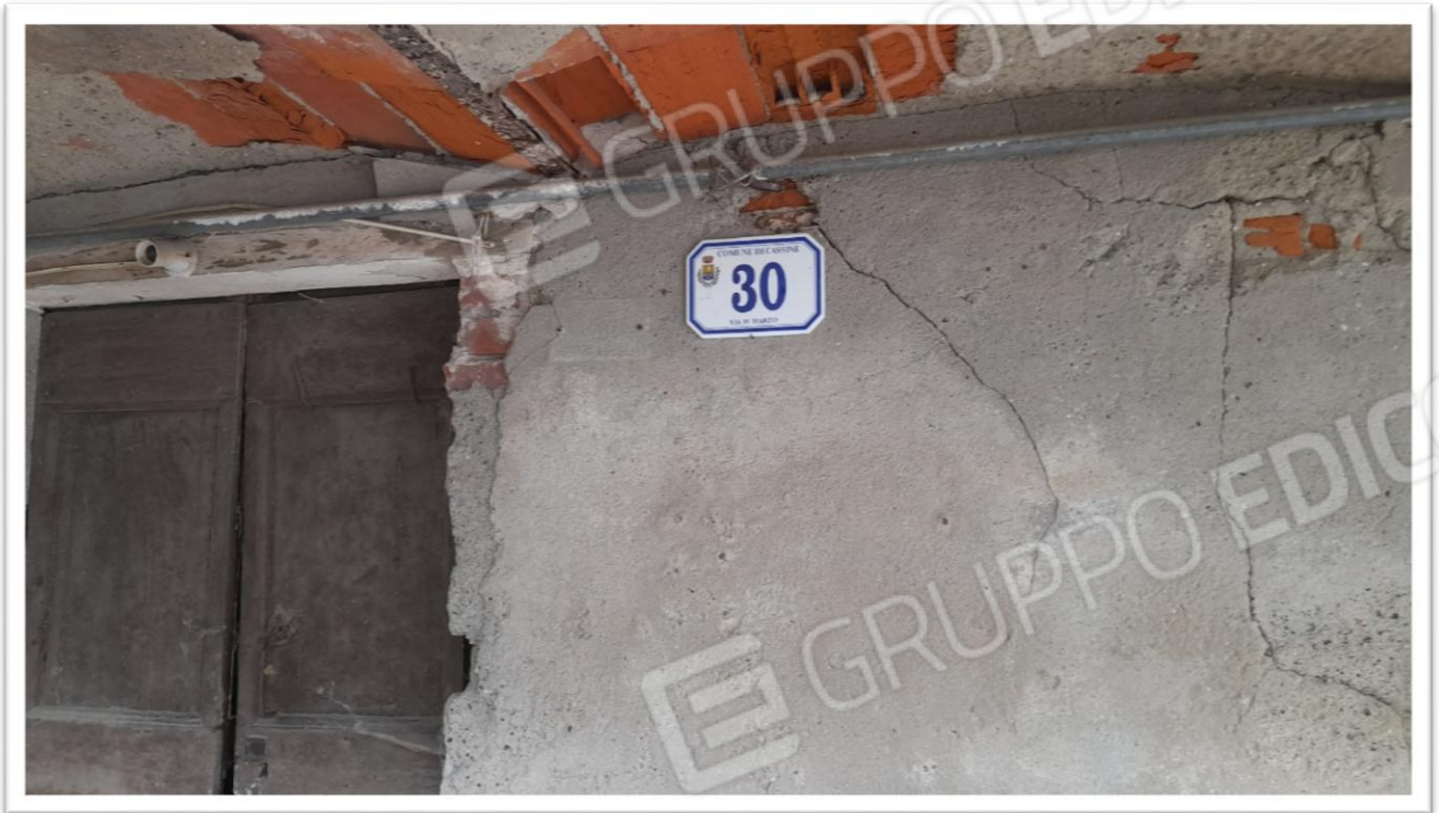
FOTOGRAMMA N. 7- NUMERO CIVICO CHE CONTRADDISTINGUE L' IMMOBILE PIGNORATO