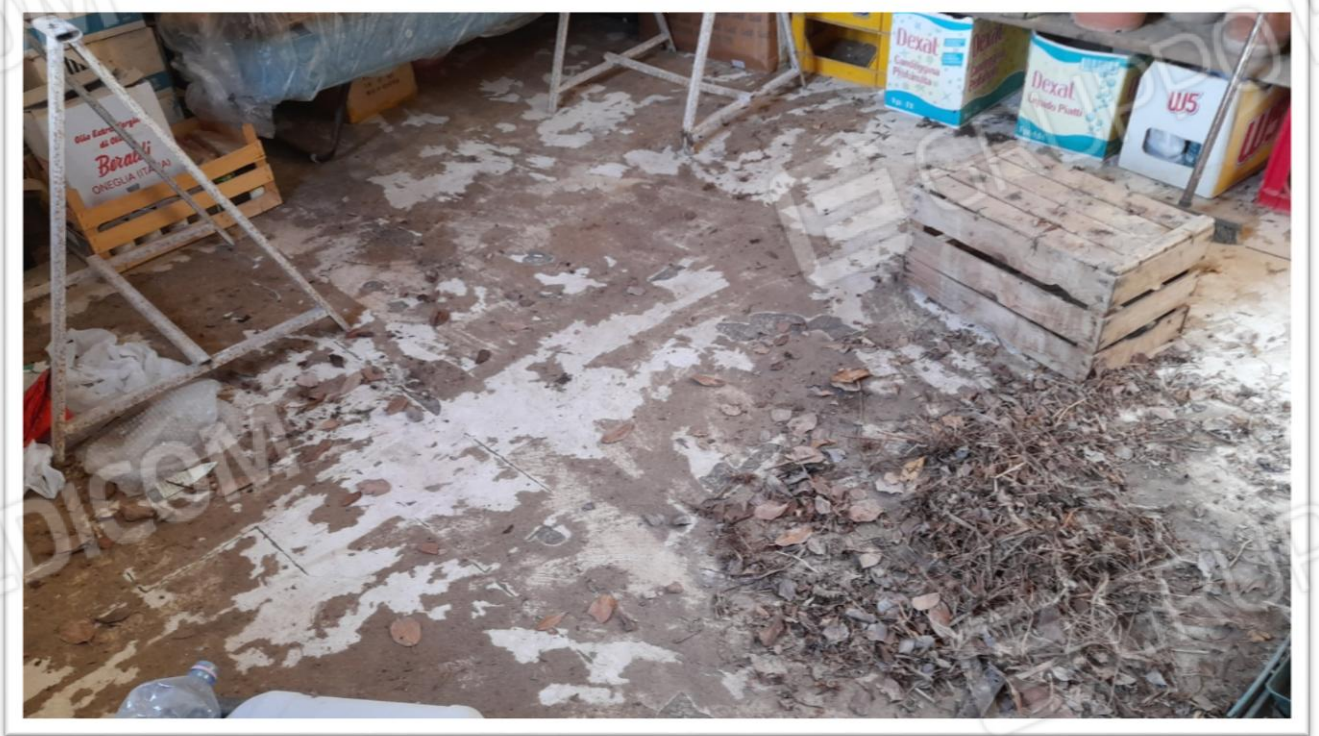
FOTOGRAMMA N. 10- ESEMPIO DI PAVIMENTI