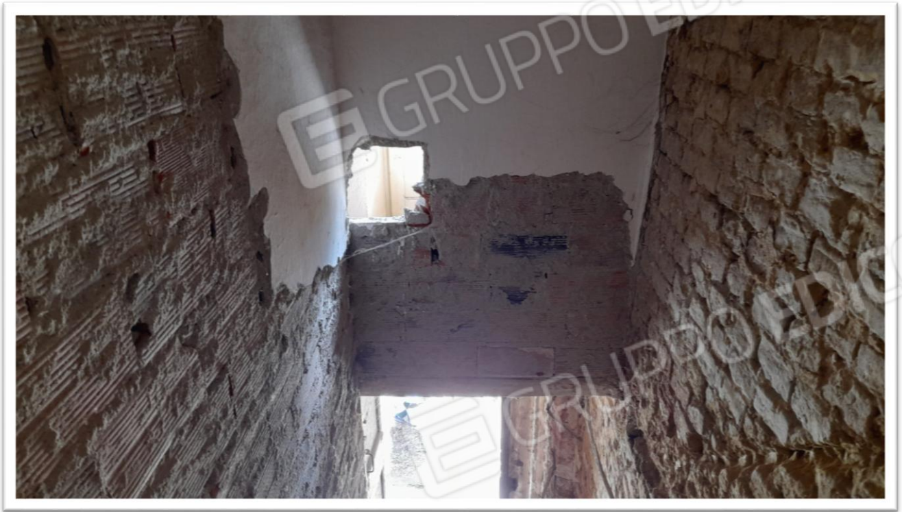
FOTOGRAMMA N. 11- PARTICOLARE DELLA SOLETTA CHE COPRE LA SCALA