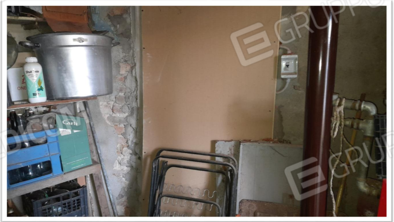
FOTOGRAMMA N. 4- ALTRA RAFFIGURAZIONE DEL RIPOSTIGLIO