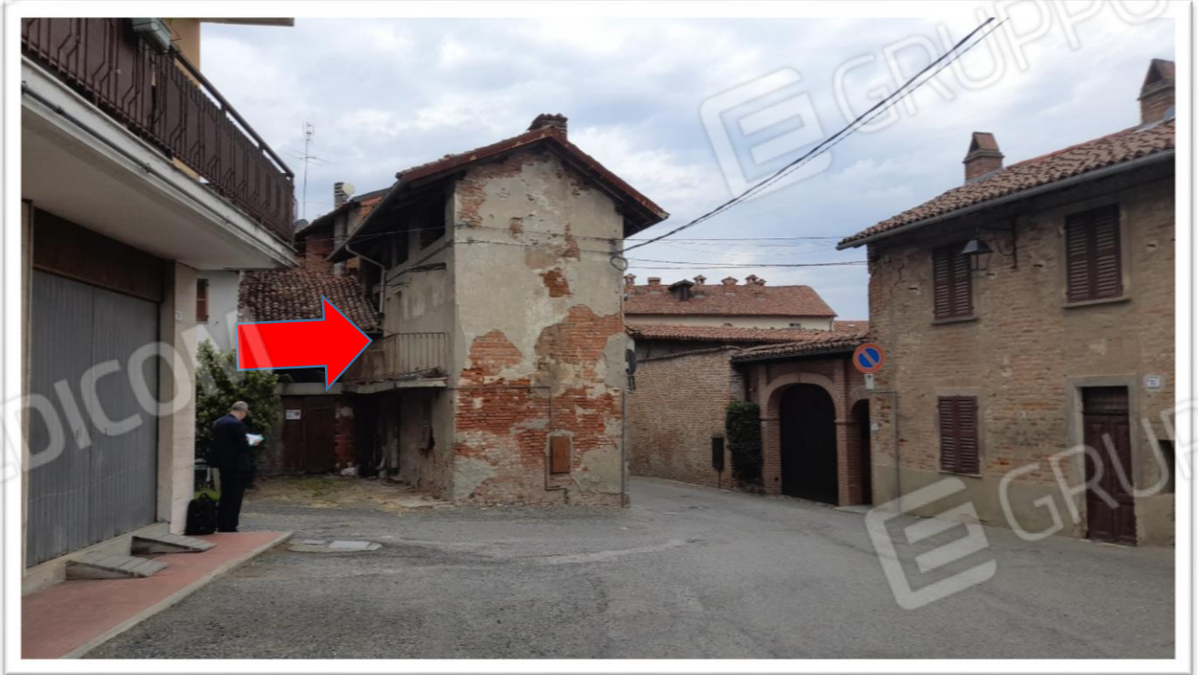
FOTOGRAMMA N. 6- VEDUTA PANORAMICA DELL' EDIFICIO