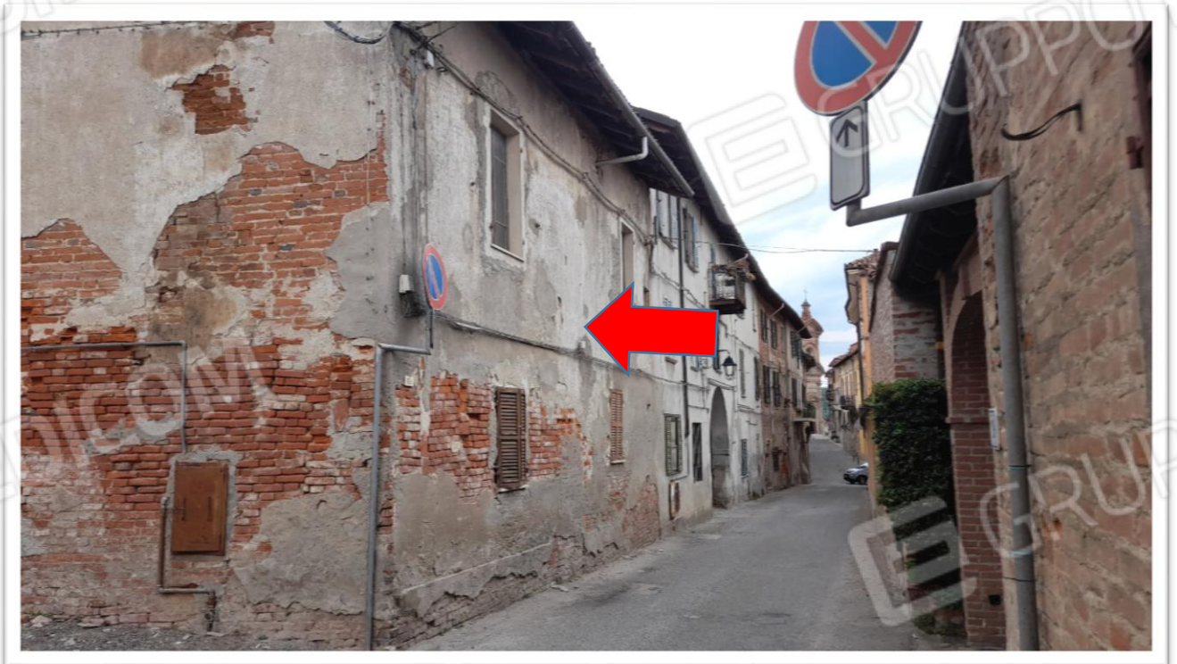
FOTOGRAMMA N. 2- FACCIATA SU STRADA