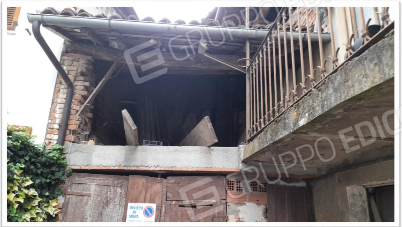
FOTOGRAMMA N. 5- VOLUME SOPRA IL RIPOSTIGLIO