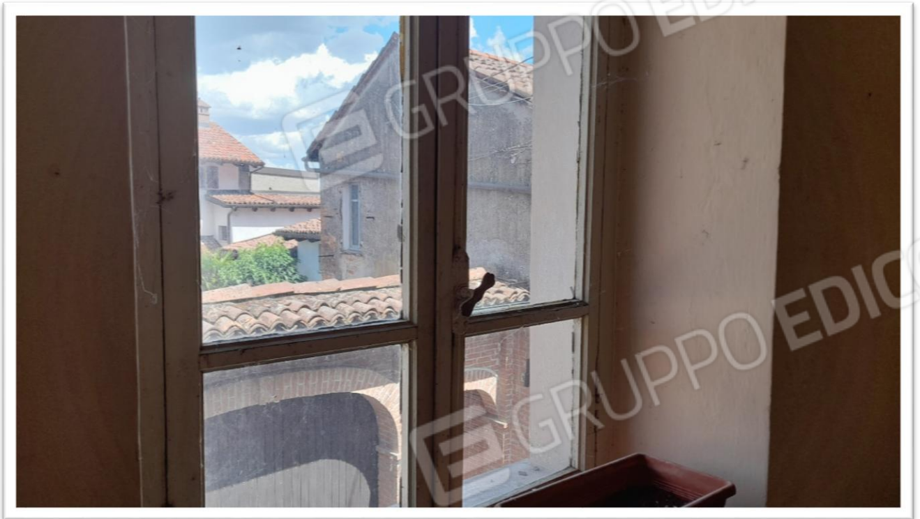
FOTOGRAMMA N. 9- SERRAMENTI IN LEGNO CON VETRI SEMPLICI