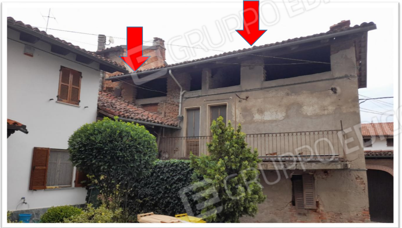
FOTOGRAMMA N. 1 - LE FRECCE INDICANO L' ESTENSIONE DELLA FACCIATA DELL' IMMOBILE PIGNORATO