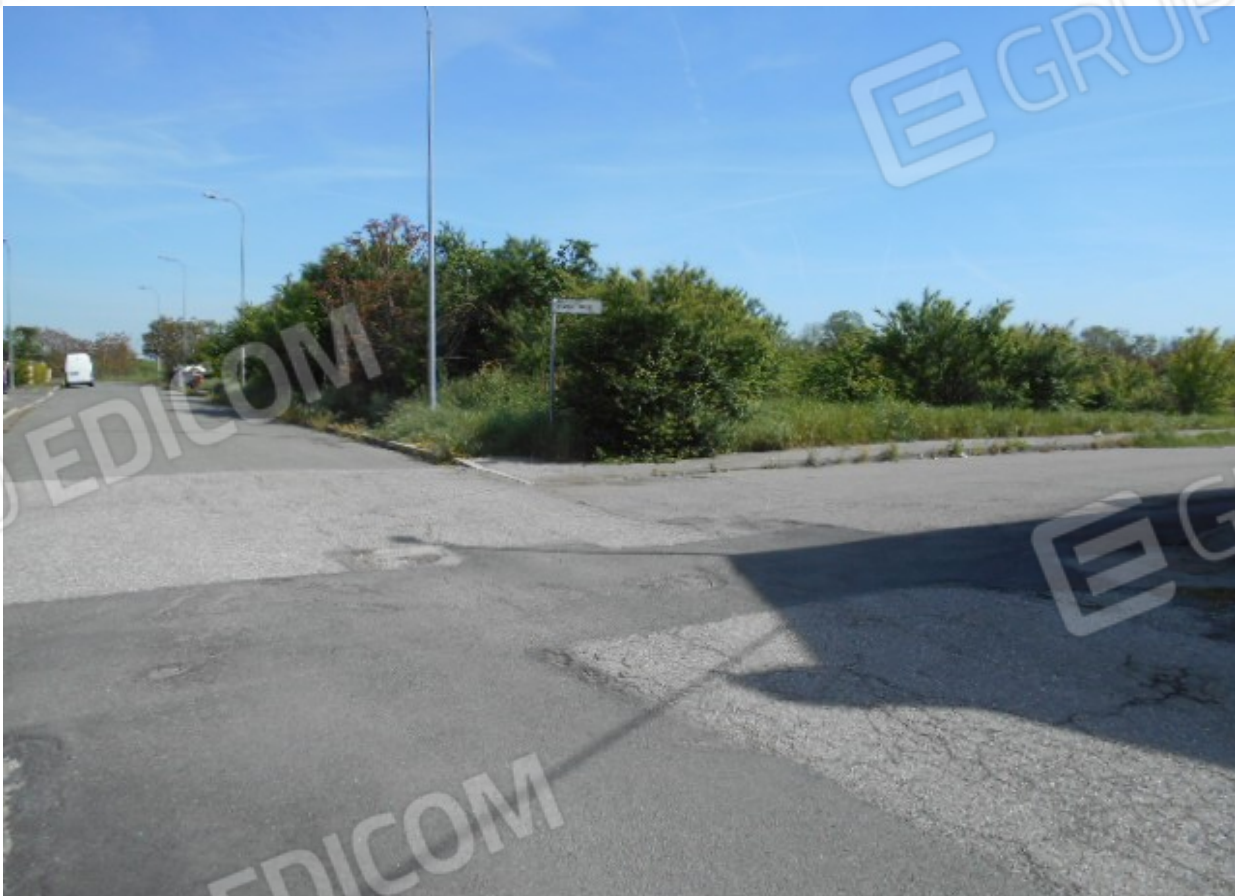
il terminale a T di via Torre delimita due dei lati del terreno