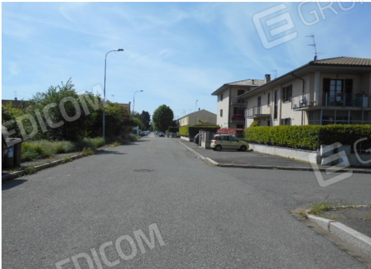
l'edilizia esistente lungo via Torre