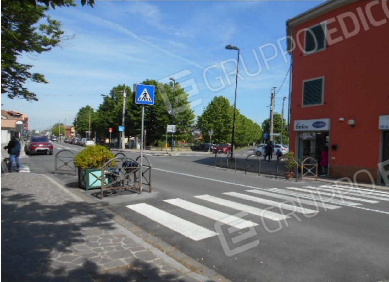
l'imbocco di via Ernesto Torre dall'asse di via Genova