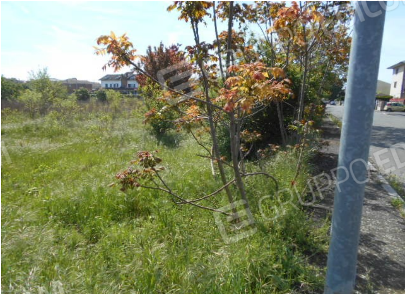
la vegetazione presente sull'area