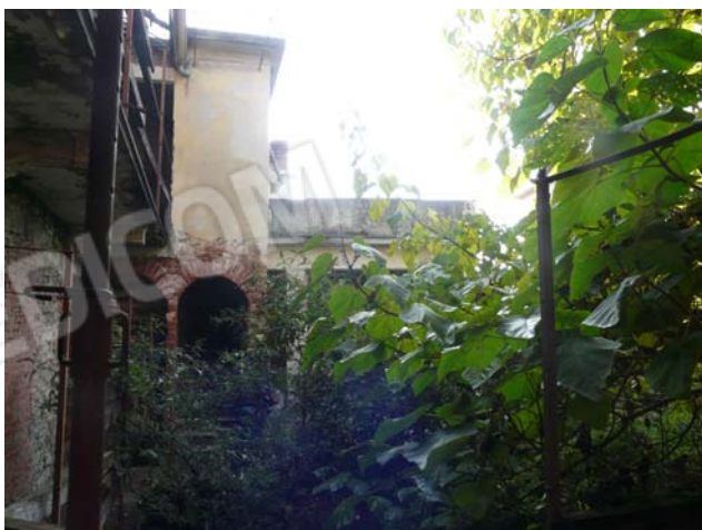
Foto 21 Vano scala al piano primo e secondo con porzione facciata ovest magazzino sub 11 al piano primo - terrazza sub.4 piano secondo