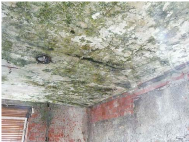
Foto 35 Intradosso solaio sub 4 piano secondo