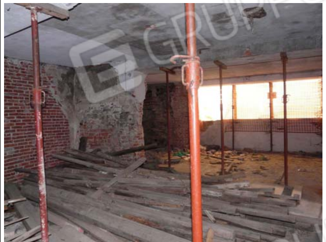
Foto 9 Interno sub 7 verso Nord - Via Don Guanella