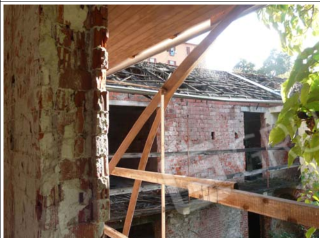
Foto 28 Facciata sud 4 secondo piano, porzione priva di copertura