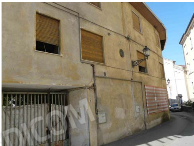
Foto n.2 Facciata Nord su Via Don Guanella