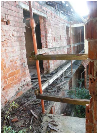
Foto 31 Balcone piano secondo