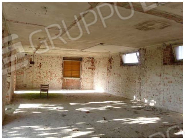
Foto 38 Interno sub 6 piano secondo