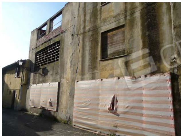
Foto 4 Facciata nord su Via Don Guanella terza porzione