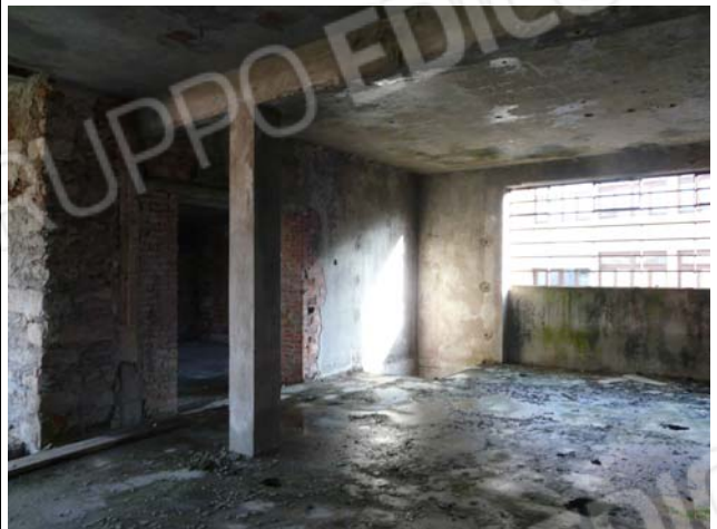
Foto 36 Facciata verso nord sub 4 piano secondo