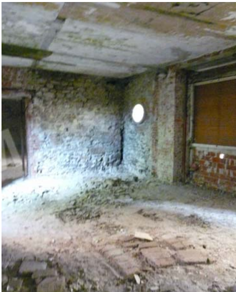
Foto 25 Interno magazzino piano primo sub 11