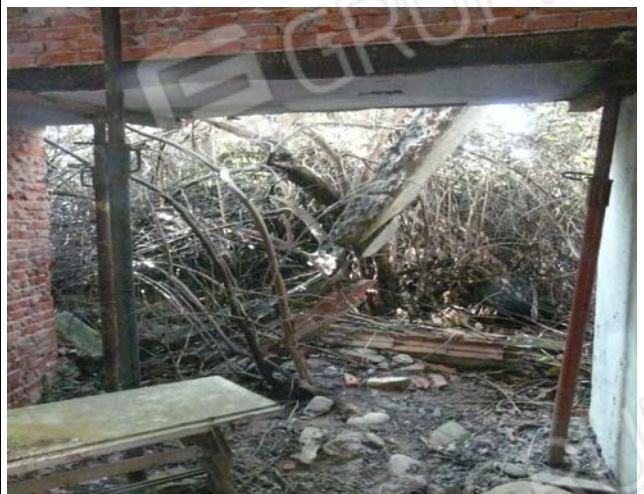
Foto 40 Facciata nord sub 8 magazzino "crollato" vista dal magazzino sub 7