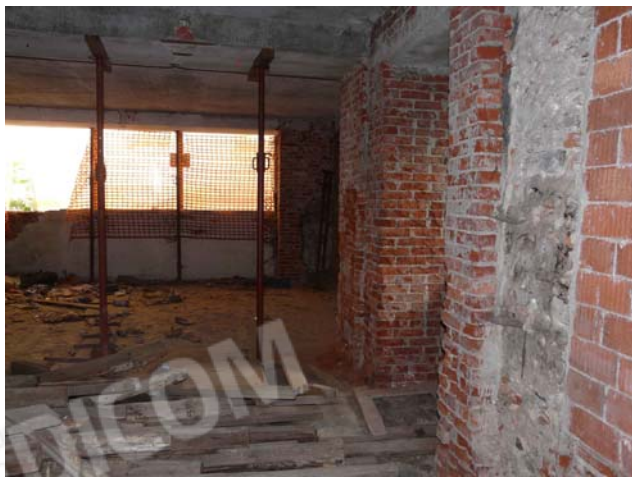
Foto 8 Interno sub 7 verso don Guanella