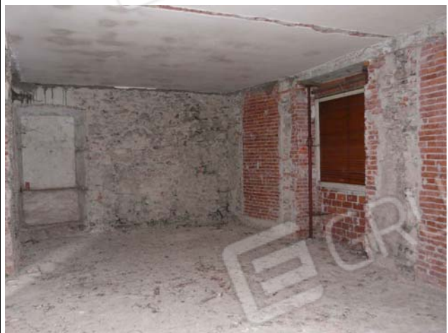
Foto 22 Interno sub 2 orientamento nord- ovest