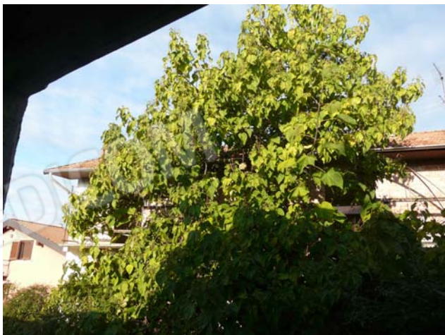
Foto 15 Facciata est sub 3 piano primo e sub 6 piano secondo