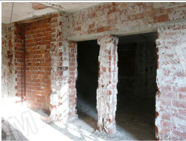
Foto 37 Interno sub 5 piano secondo