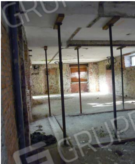
Foto 13 Interno sub 3 piano primo orientamento sud-ovest