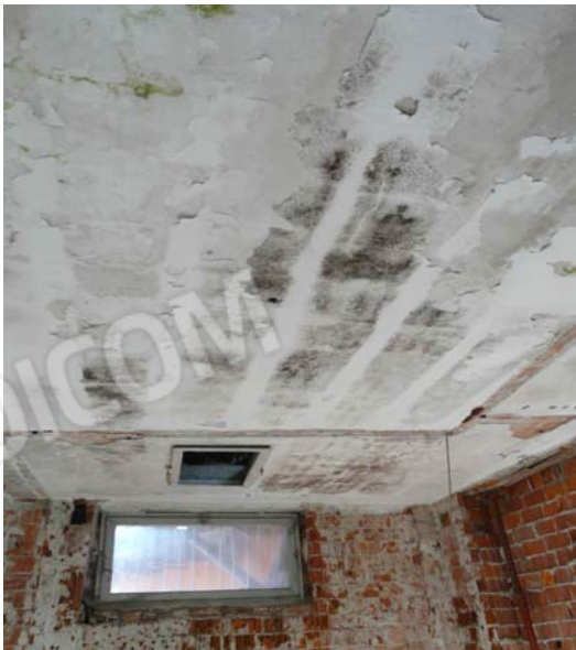
Foto 33 intradosso solaio piano secondo sub 11