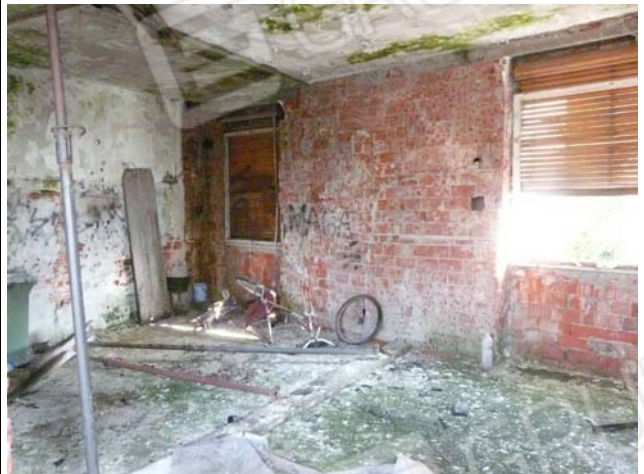
Foto 34 Interno sub 11 piano secondo