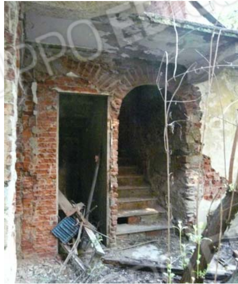
Foto 18 Vano scala comune piano terra a lato cantine