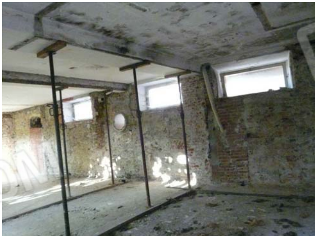
Foto 12 Interno sub 3 al piano primo orientamento ovest