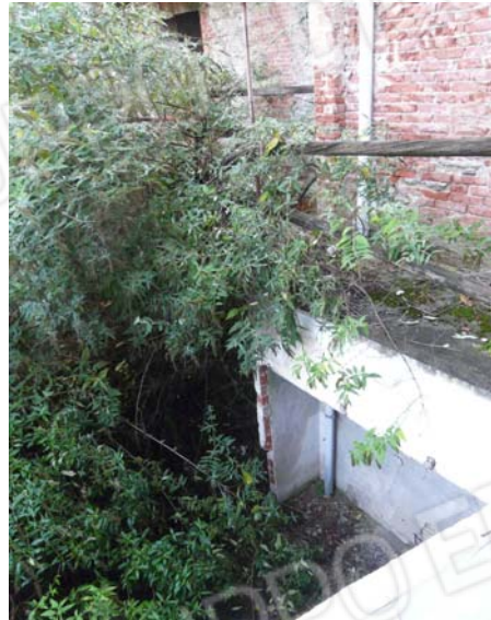
Foto 11 facciata sud vano scala e ballatoio di accesso al sub 11