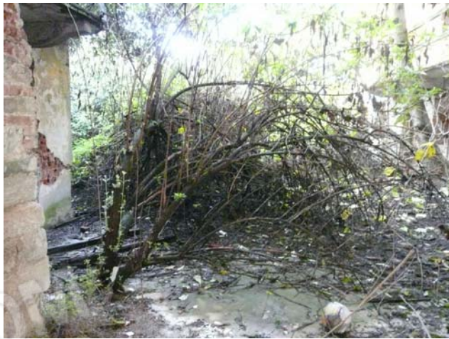
Foto 6 Corte Comune vista dall'androne carraio