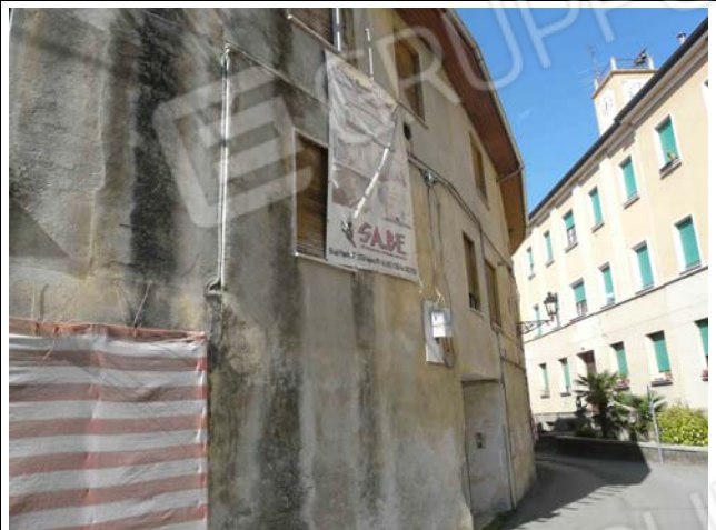
Foto n.3 Facciata Nord su Via Don Guanella seconda porzione