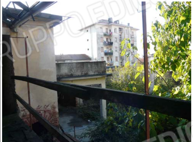
Foto 30 vano scala al piano secondo