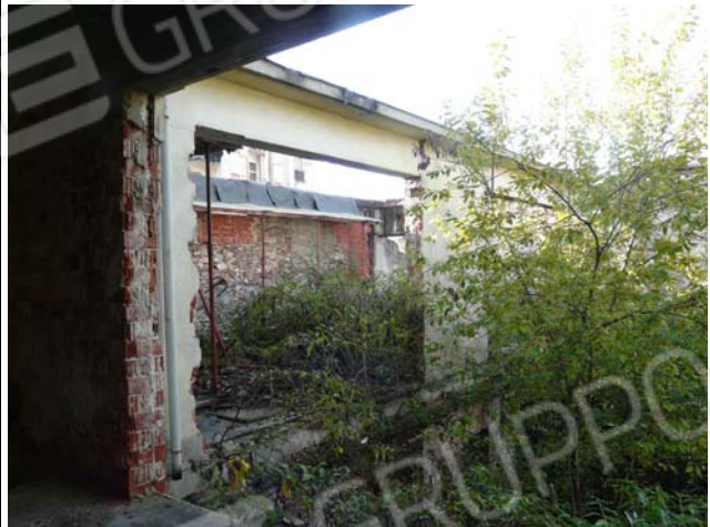
Foto 26 porzione sud magazzino sub 11 privo di solaio ,