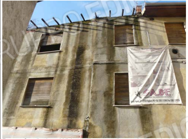
Foto n.5 Cartello che pubblicizzava l'intervento di recupero