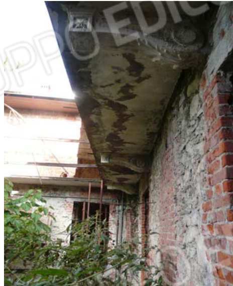
Foto 24 Facciata sud sub 2 verso la corte comune intradosso balcone piano secondo