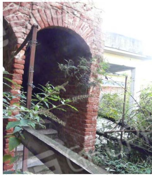
Foto 20 Vano scala al piano primo con porzione facciata ovest magazzino sub 11