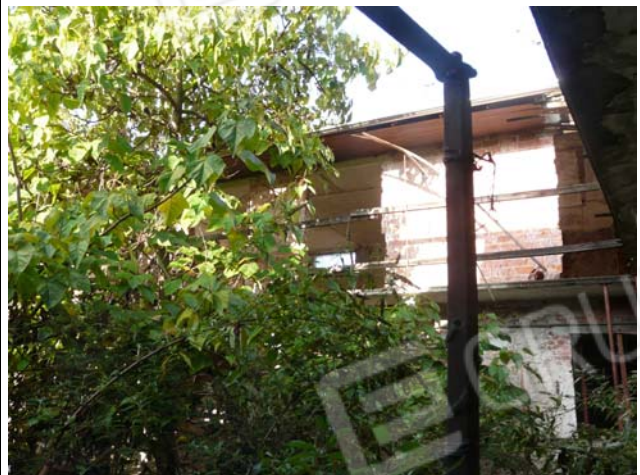
Foto 16 Facciata est sub 3 piano primo e sub 6 piano secondo