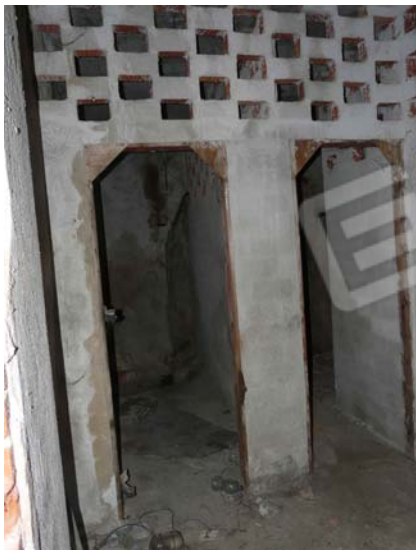
Foto 17 Cantine piano terreno annesse al sub 10