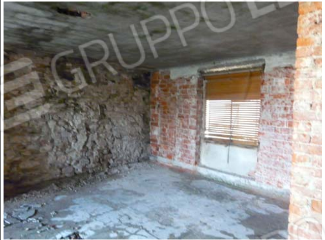
Foto 32 interno piano secondo con intradosso solaio degradato per infiltrazioni acqua piovana