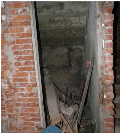
Foto 19 Sottoscala piano terreno