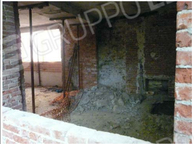
Foto 7 Interno magazzino sub. 7 piano terreno