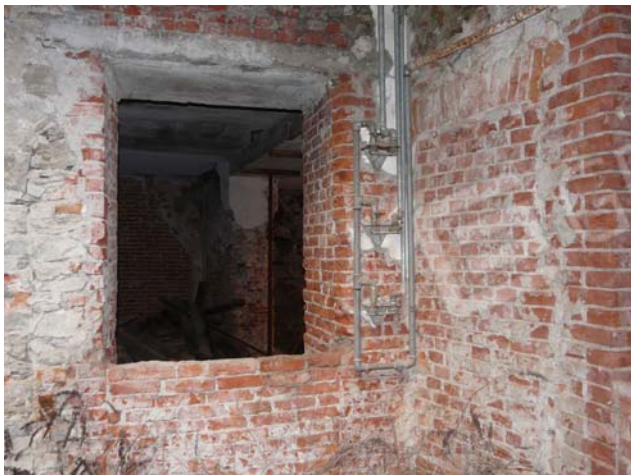
Foto 10 Facciata est sub 7 verso corte comune