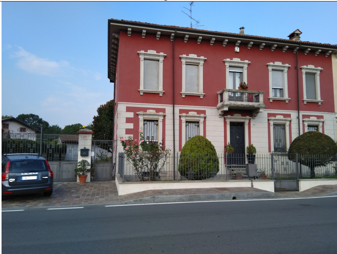
esterna: ingresso dalla pubblica viabilità, Via Cesare Battisti