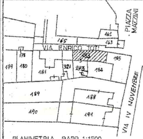
PLANIMETRIA RAPP. 1:1500

Planimetria di u.i.u. in Comune di VICOLUNGO via ENRICO TOTI civ. 1