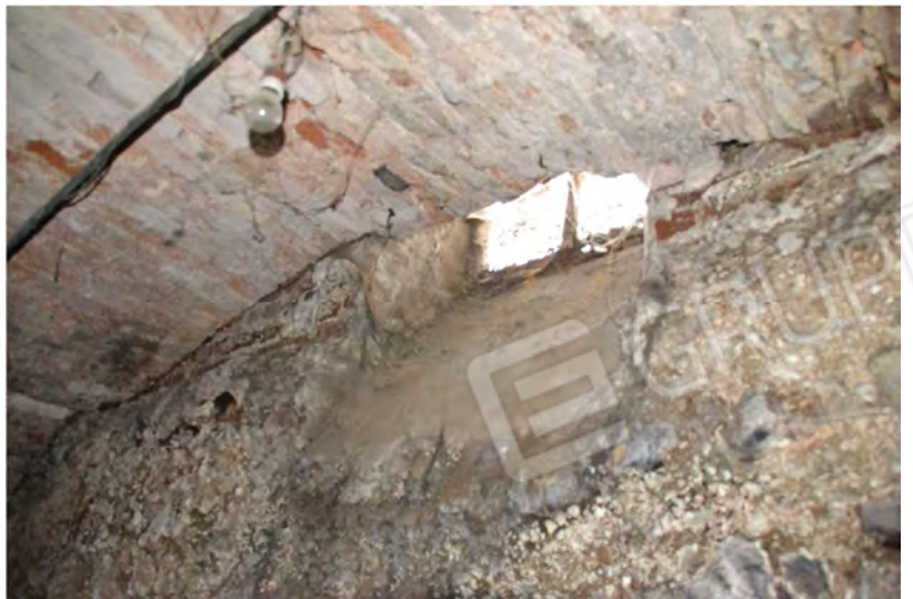
Viste fotografiche interno cantina