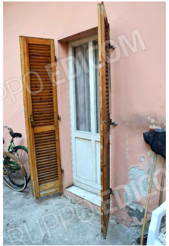
Vista fotografica porta-finestra verso cortile interno