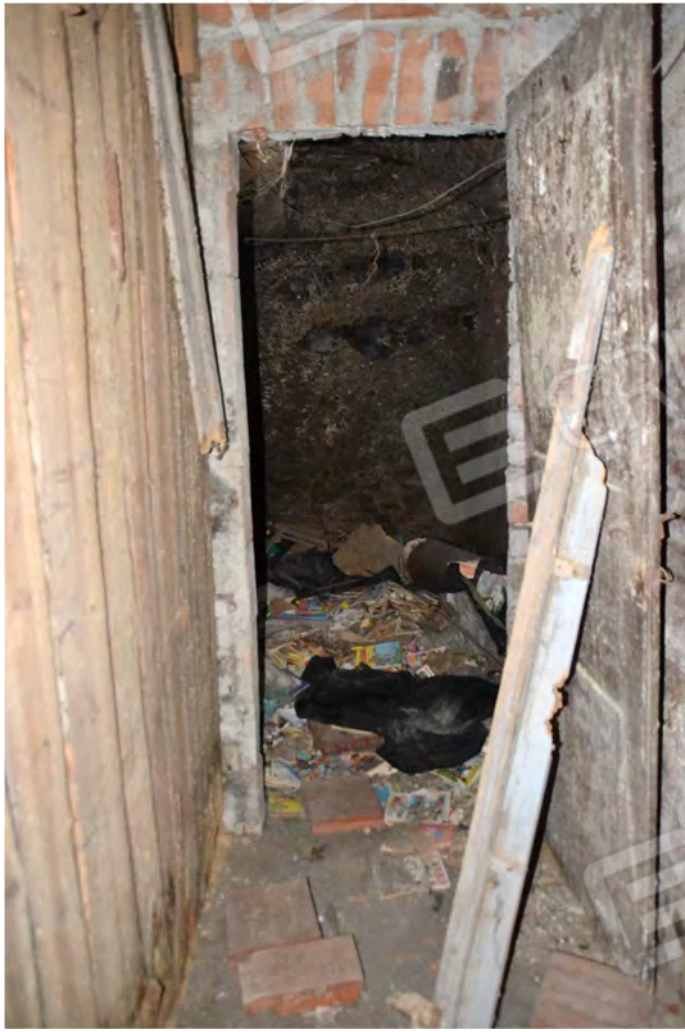
Vista fotografica porta accesso alla cantina