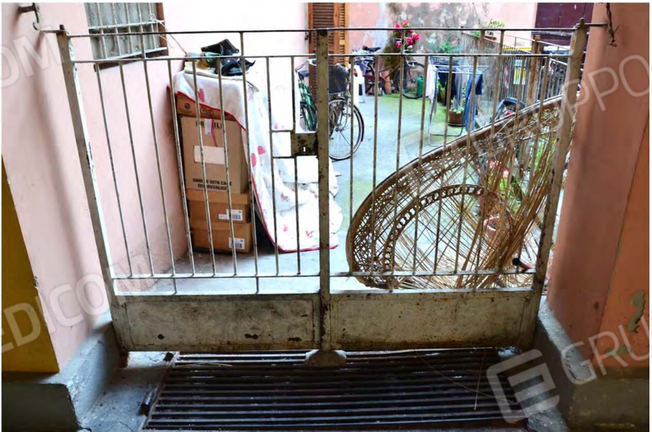
Vista fotografica 23