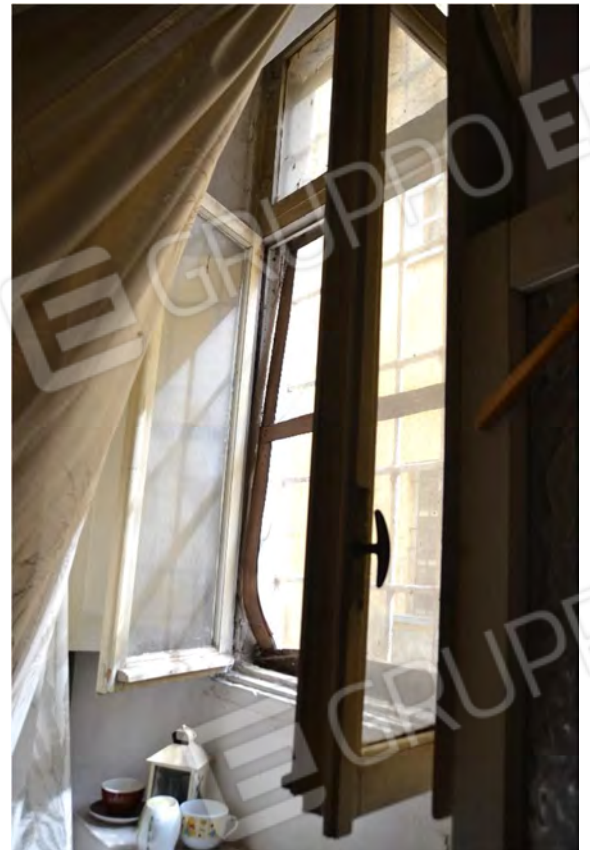
Vista fotografica finestra camera verso via V. Gioberti