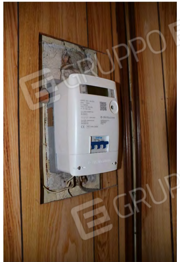
Vista fotografica contatore energia elettrica posto nell'ingresso