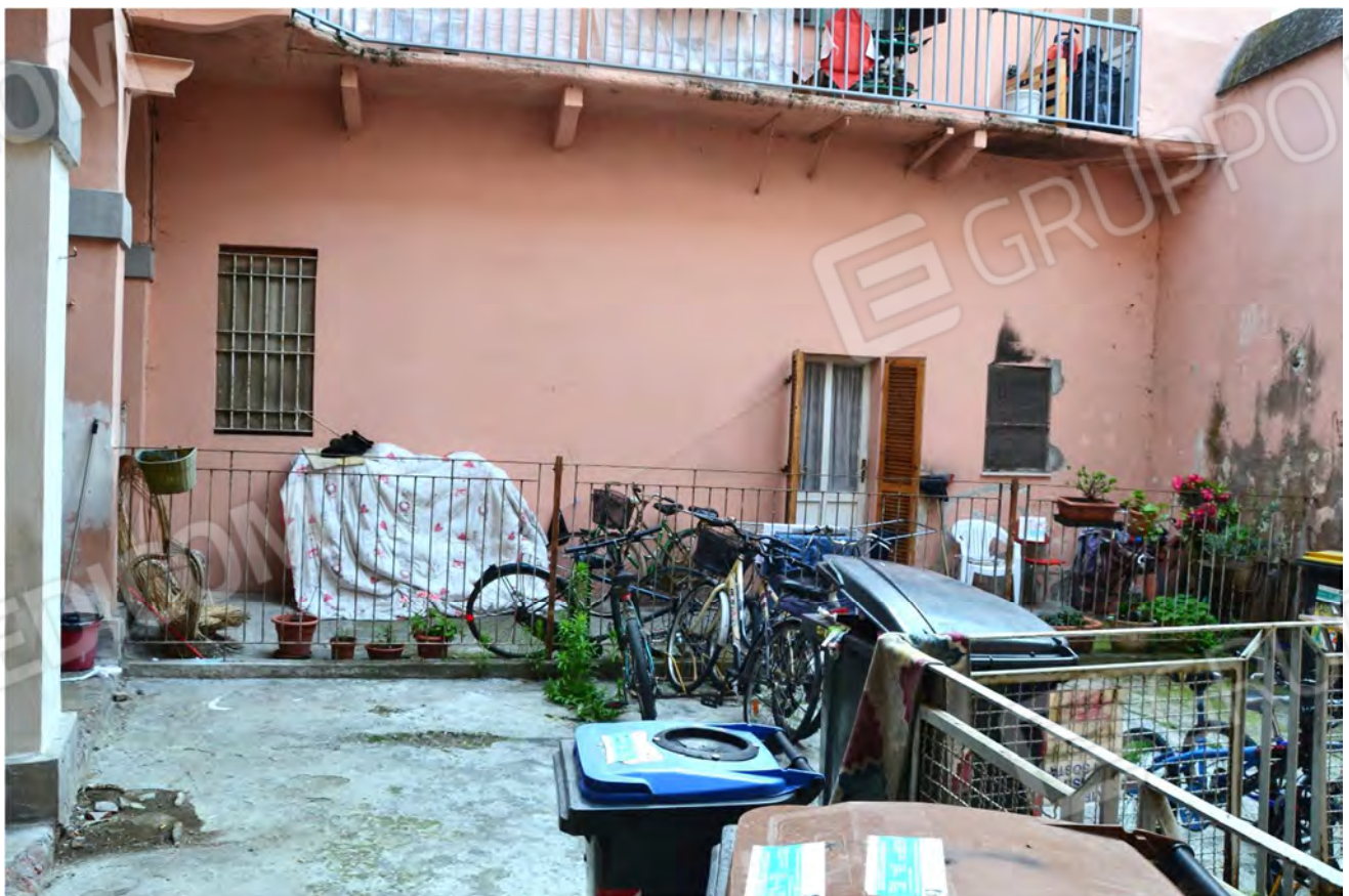
Vista fotografica 21