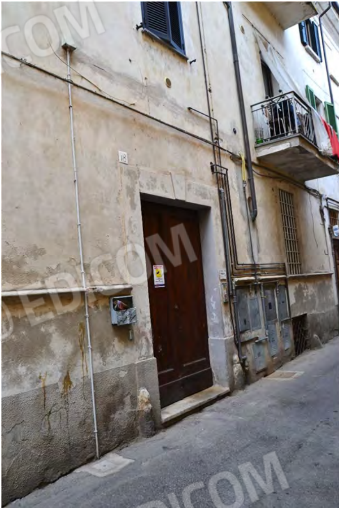
Vista fotografica 6