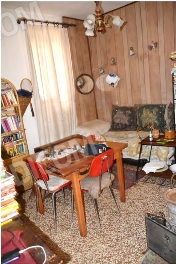
Vista fotografica 17