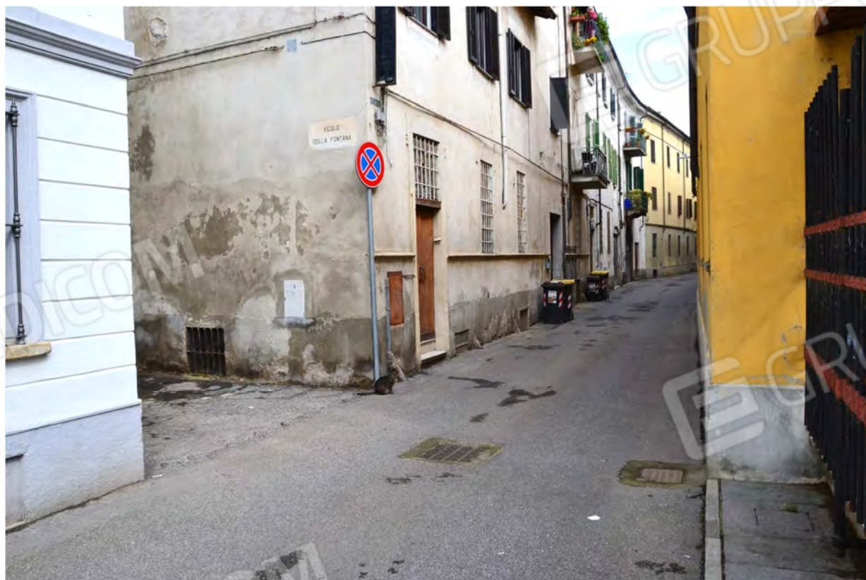
Vista fotografica 2