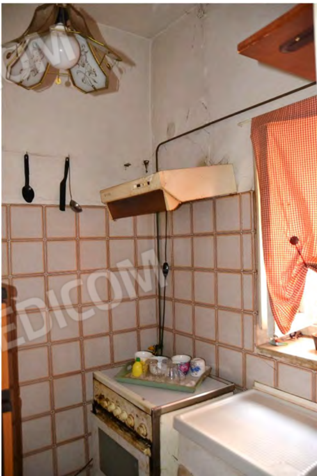
Vista fotografica 13