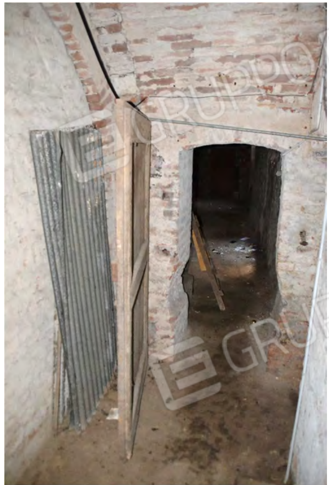
Viste fotografiche scala, corridoio accesso alla cantina