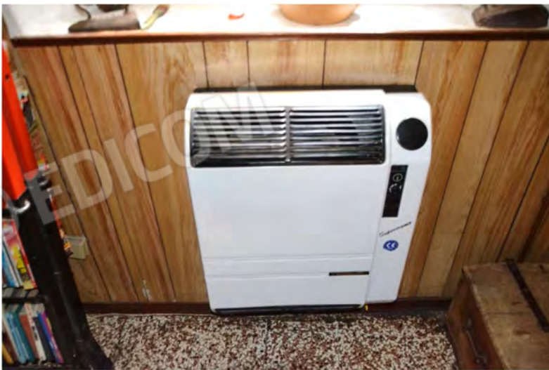
Vista fotografica Ventilconvettore