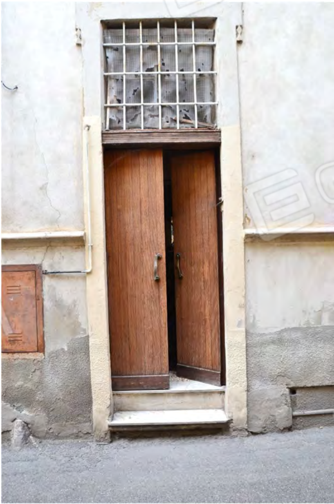
Vista fotografica 5