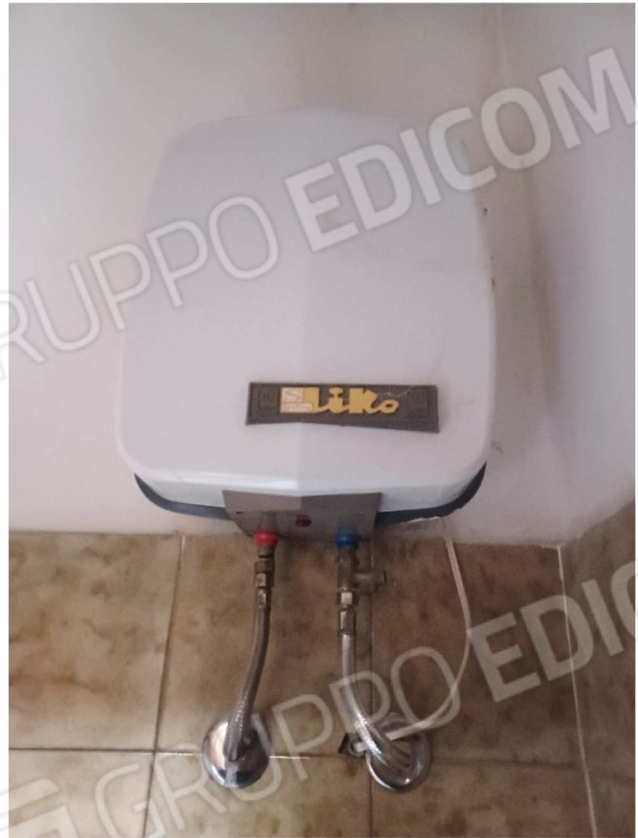
Vista fotografica boiler posto nel bagno