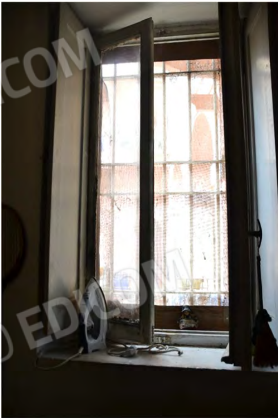
Vista fotografica finestra camera verso cortile interno