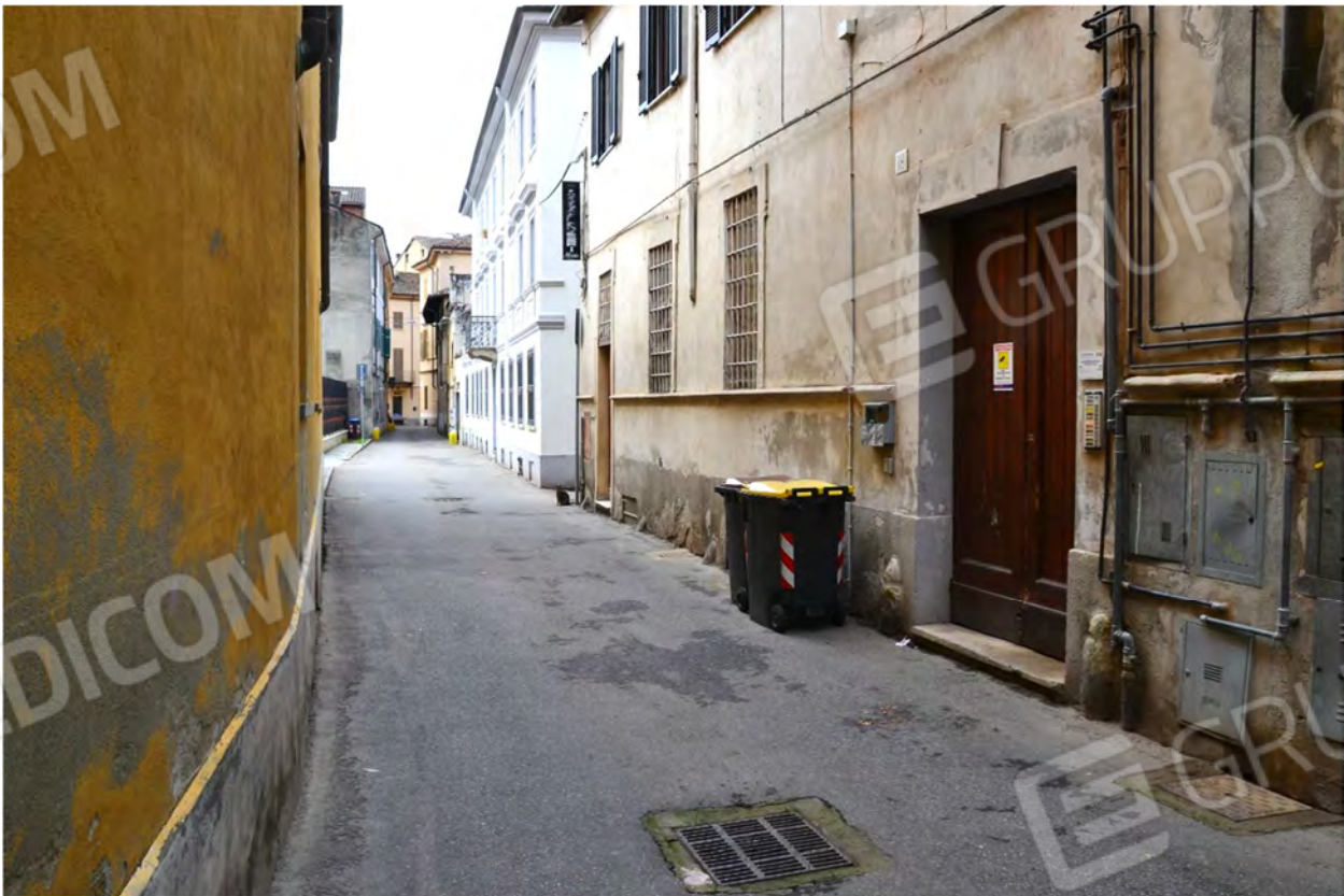
Vista fotografica 4