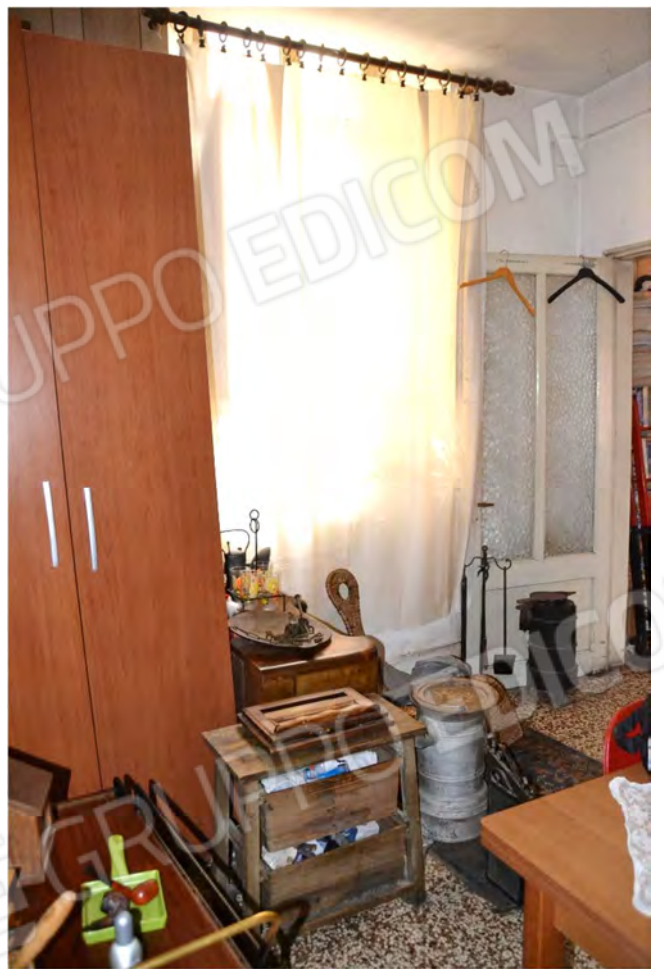
Vista fotografica 20