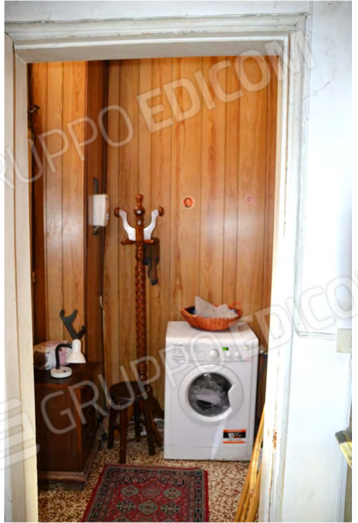
Vista fotografica 10