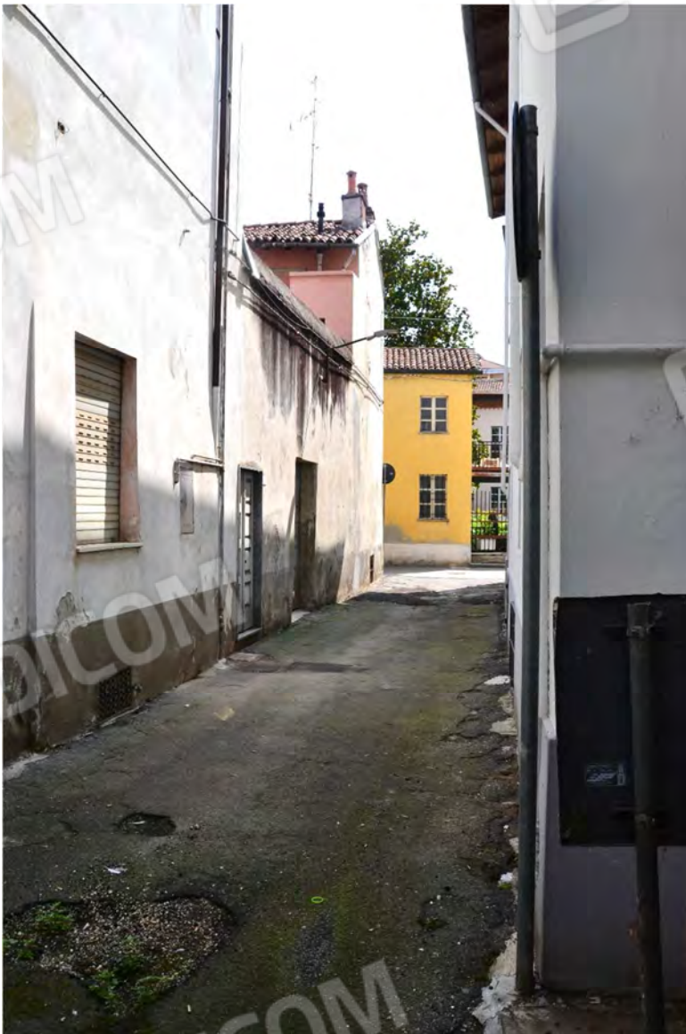
Vista fotografica 8