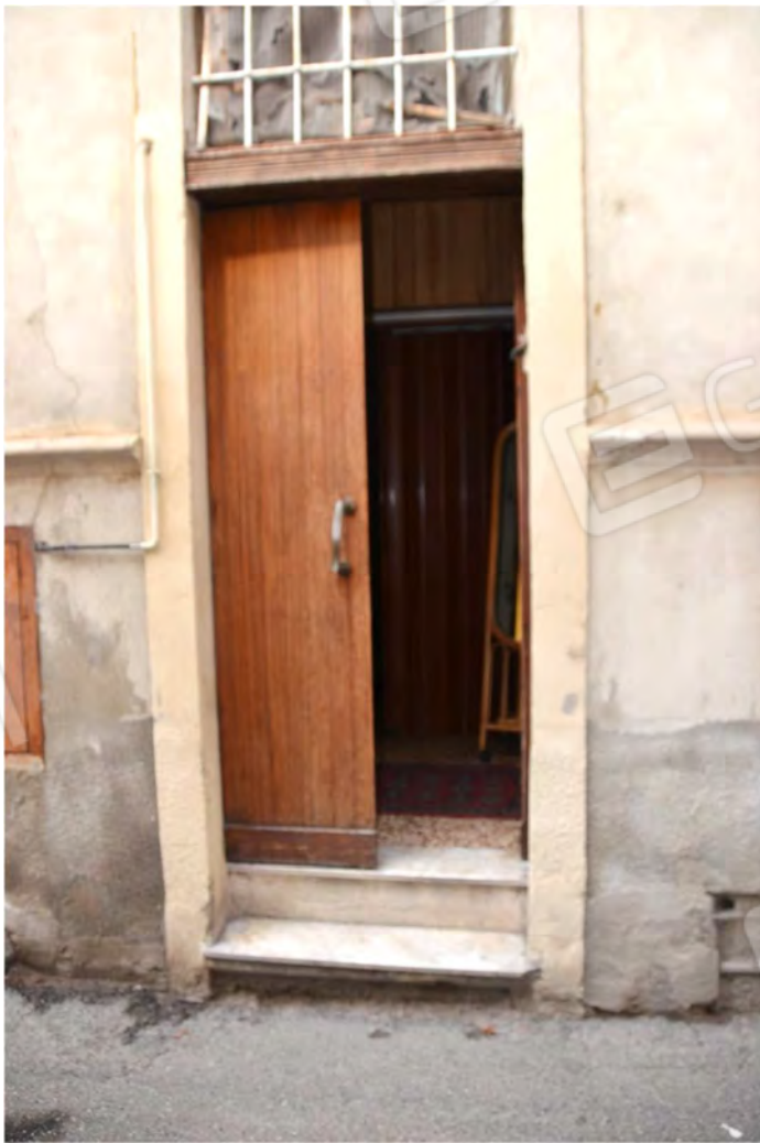
Vista fotografica 9