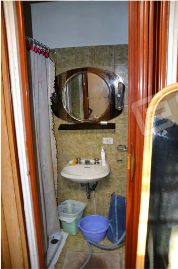
Vista fotografica 12