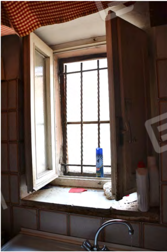
Vista fotografica finestra cucina verso cortile interno