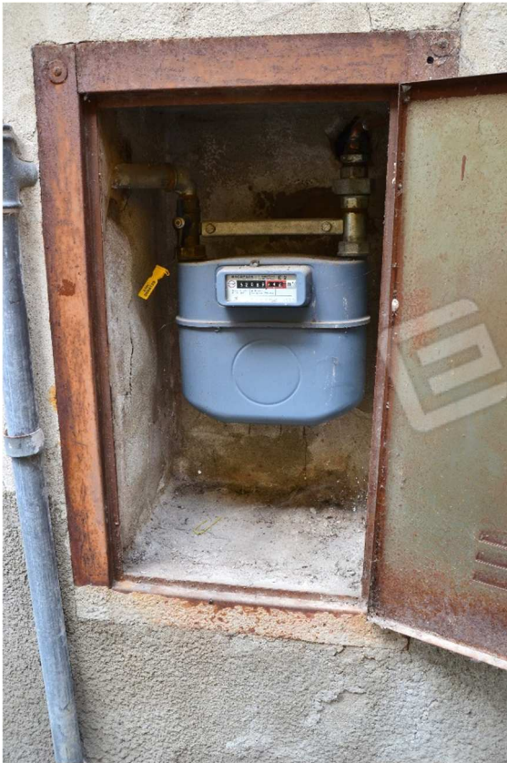
Vista fotografica Contatore gas metano posto sulla facciata verso via V. Gioberti