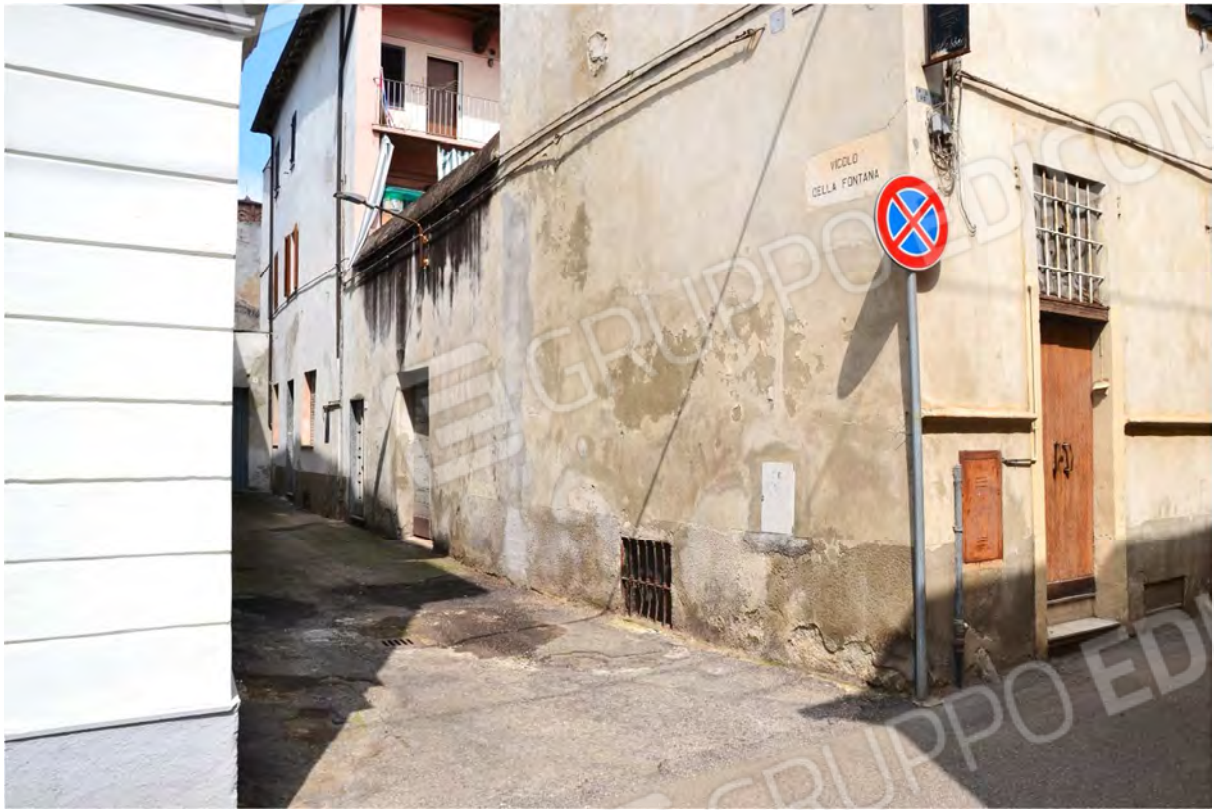
Vista fotografica 7