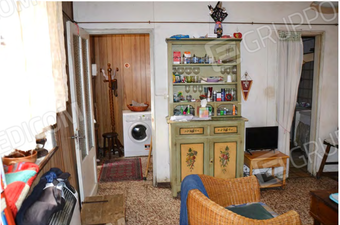
Vista fotografica 11