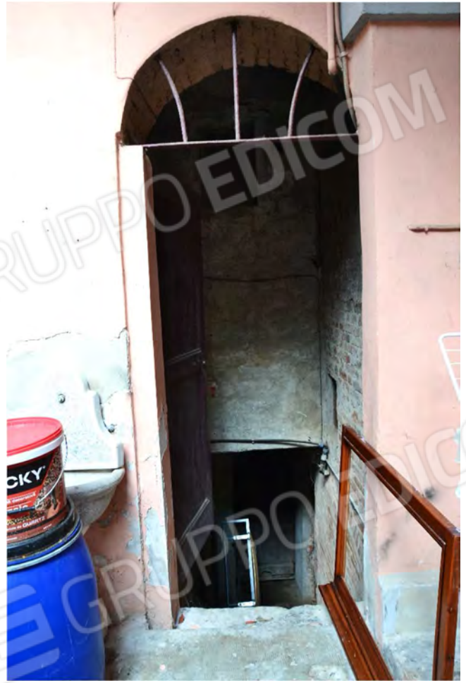
Vista fotografica accesso alle cantine