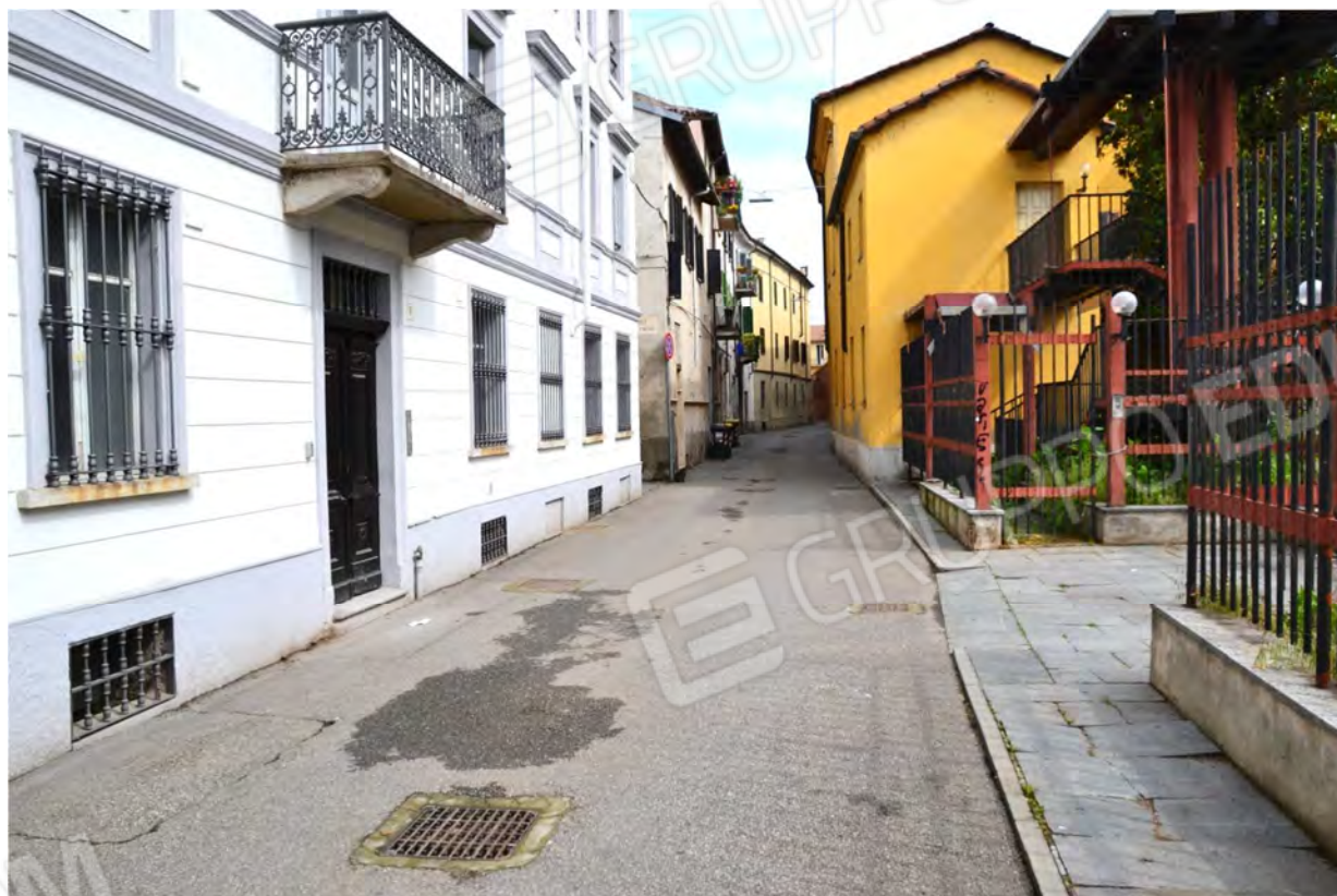
Vista fotografica 1