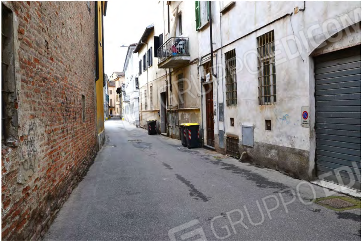
Vista fotografica 3