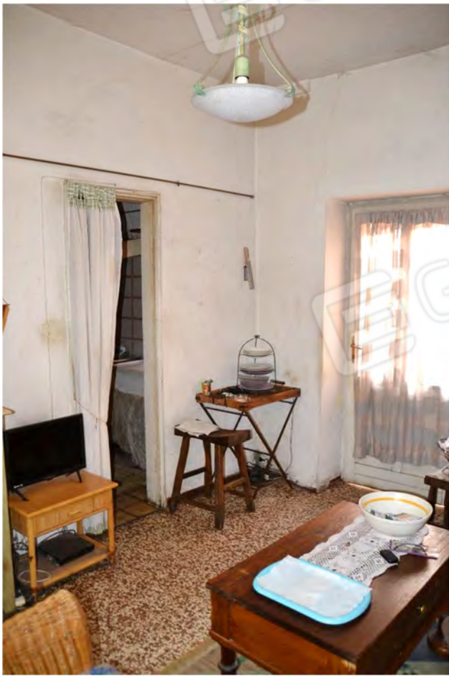
Vista fotografica 15