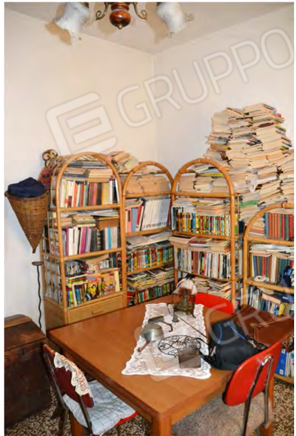
Vista fotografica 18