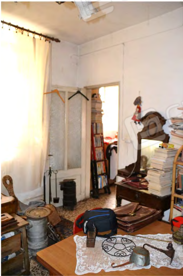
Vista fotografica 19