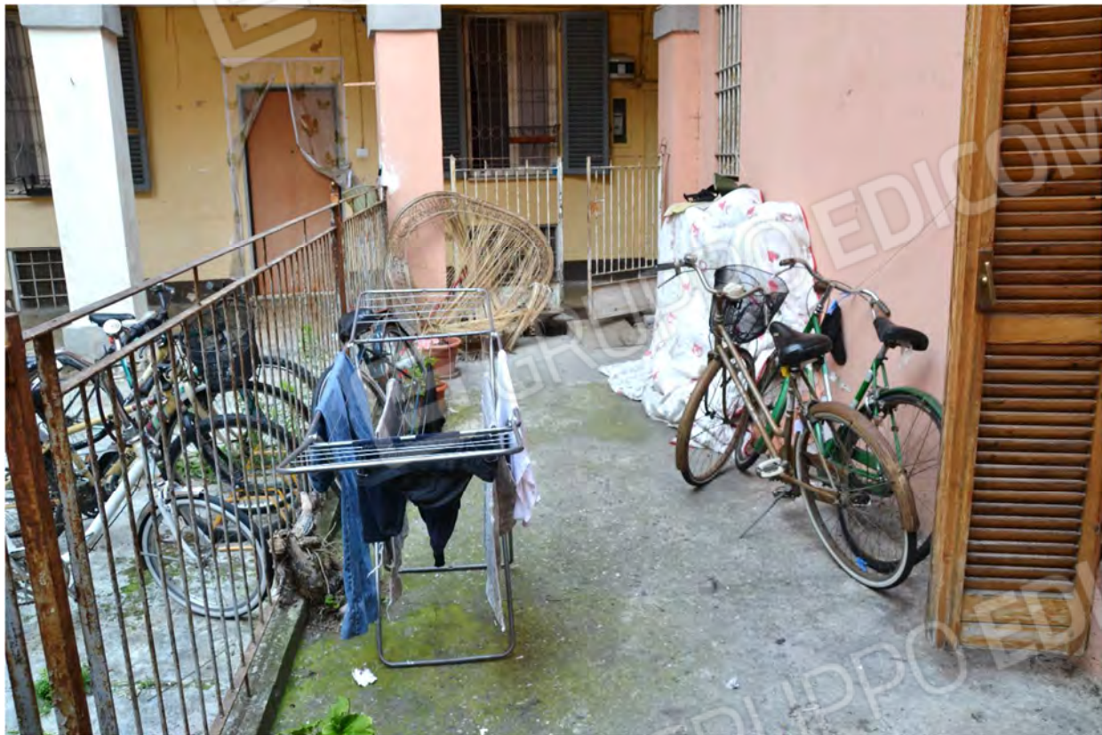
Vista fotografica 24