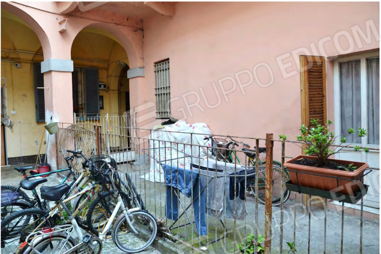
Vista fotografica 22