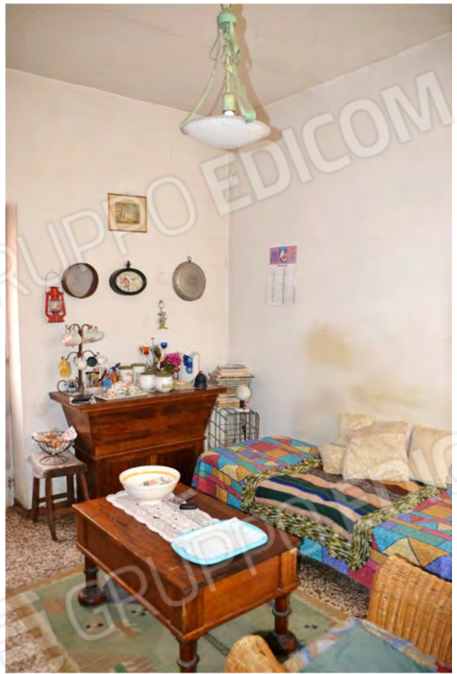
Vista fotografica 16