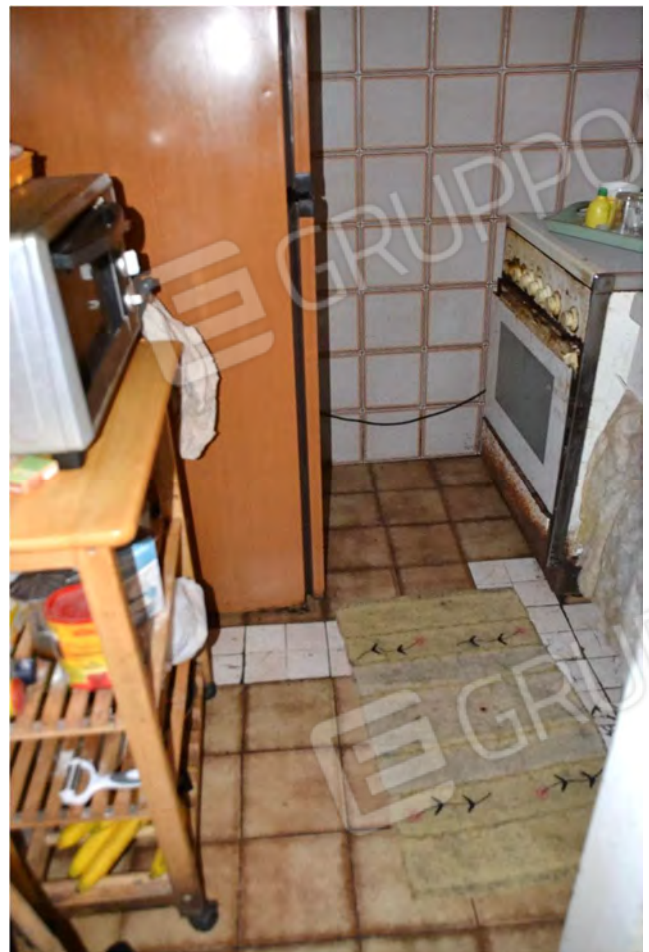
Vista fotografica 14