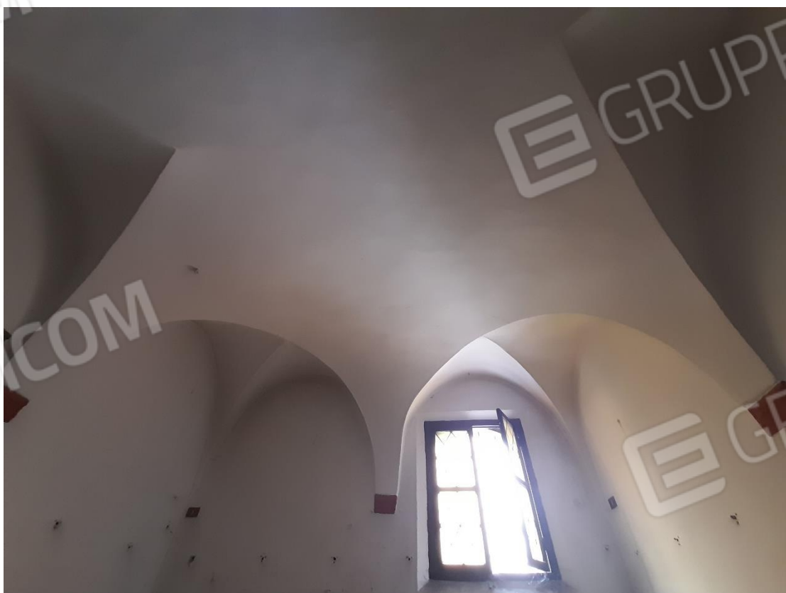
Foto 26 - Volta