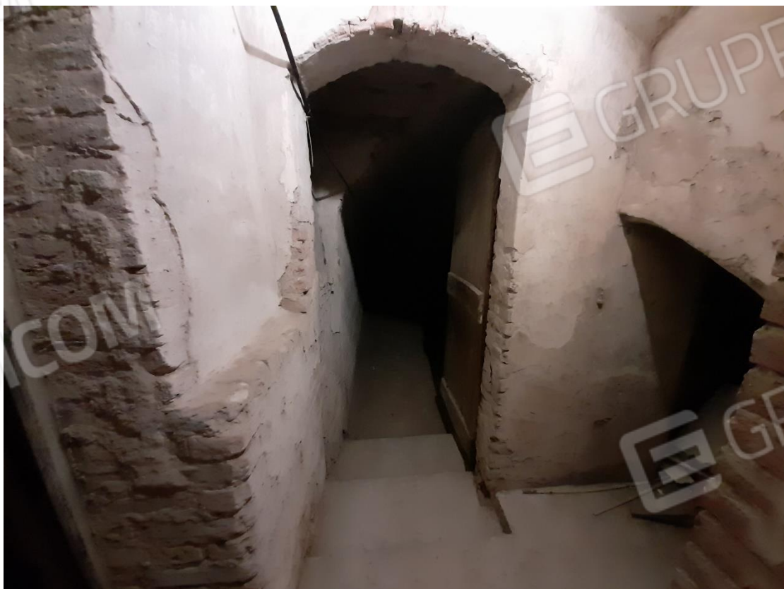
Foto 32 – Ingresso altra cantina con accesso ai vani censiti al sub. 40