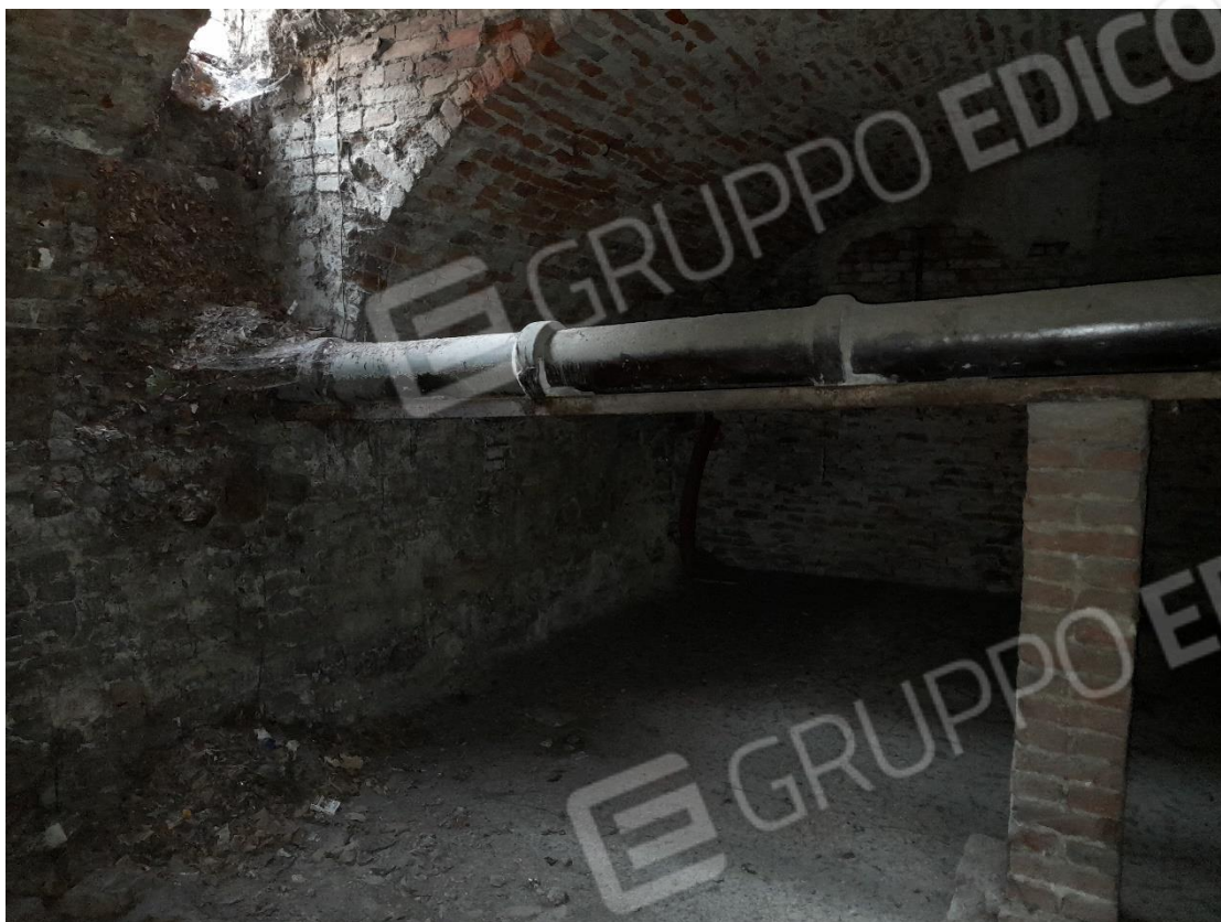
Foto 13 – Locale cantina sub. 40 con apertura su via Luigi Canina