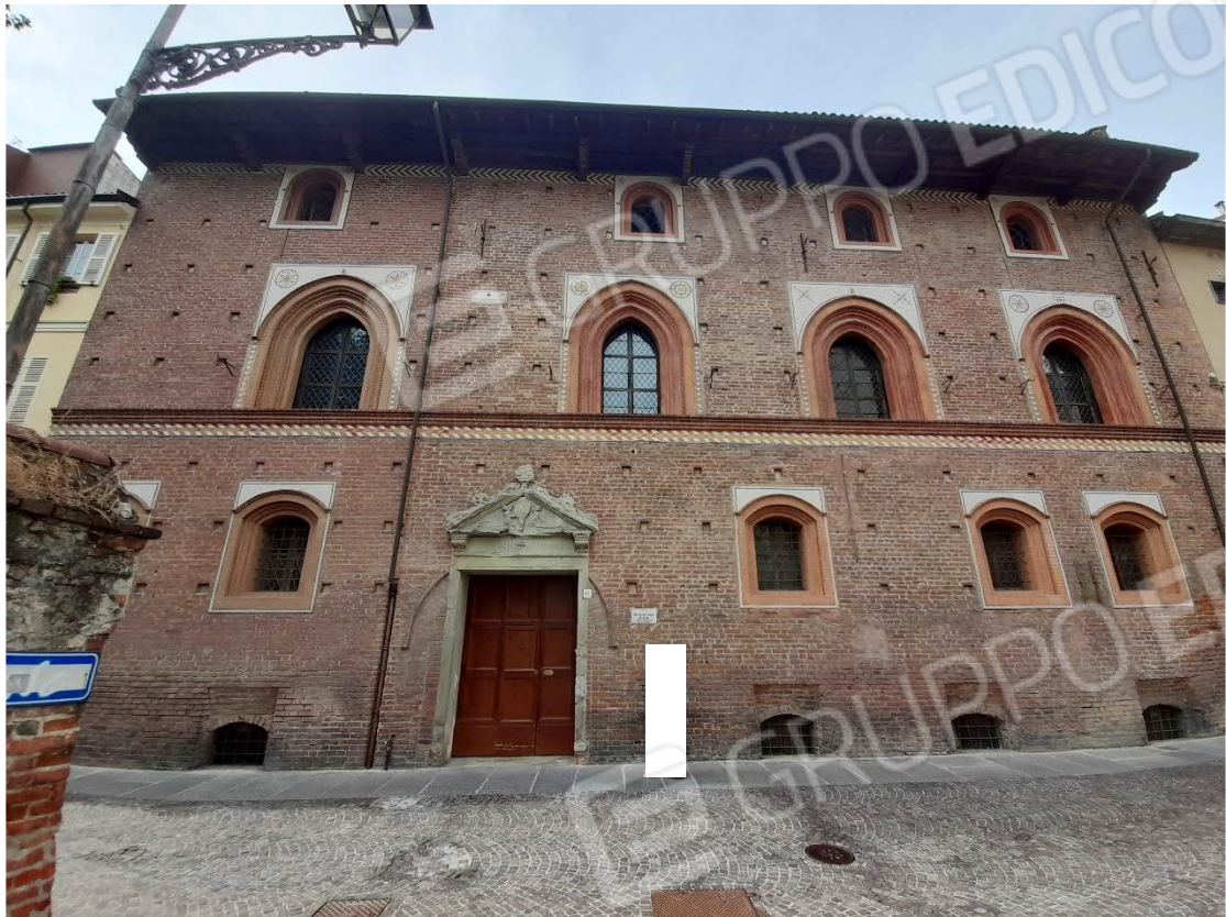
Foto 1 - Ingresso principale da Via Canina n.13