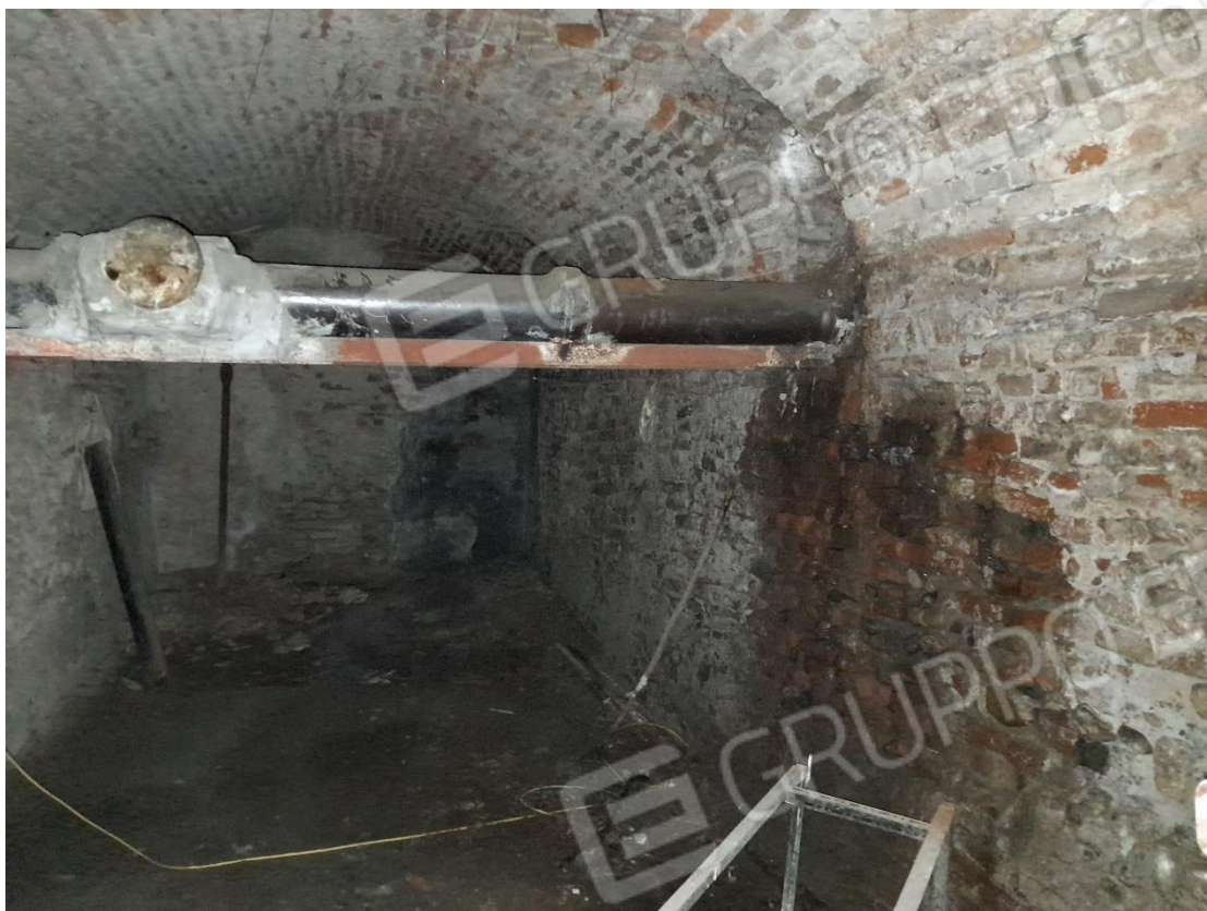
Foto 11 – Locale cantina sub.40 con tubazione fognaria condominiale