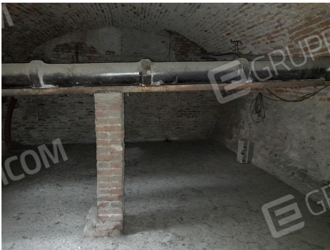
Foto 12 – Locale cantina sub. 40 con tubazione fognaria condominiale