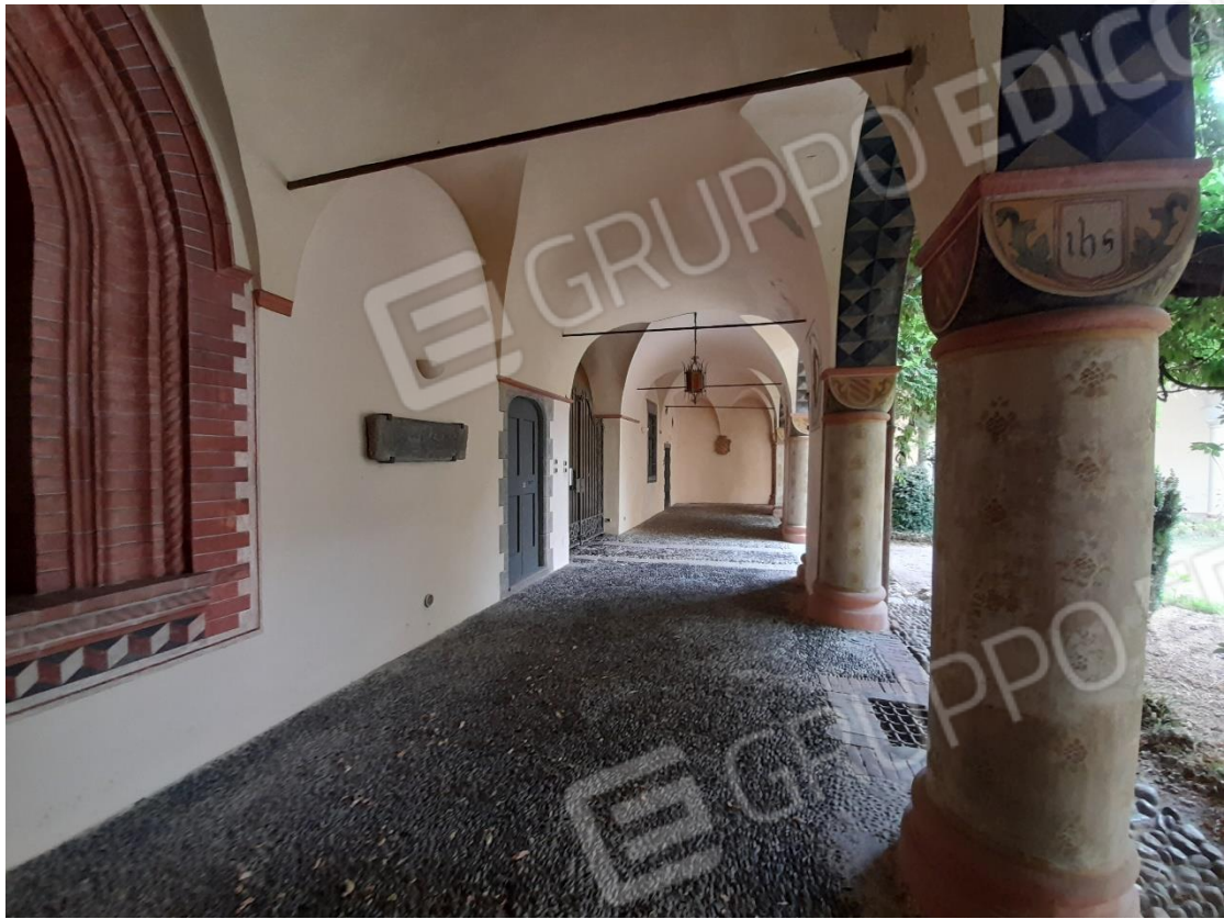
Foto 17 – Portico colonnato ad L con porta di ingresso al laboratorio