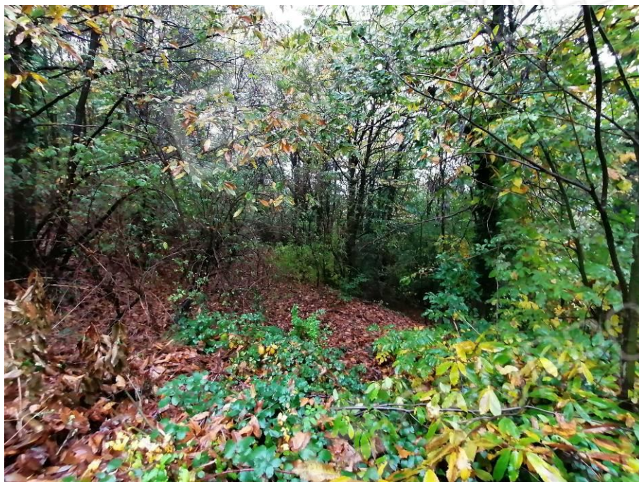
TERRENO (Fig. 19, mapp. 112)