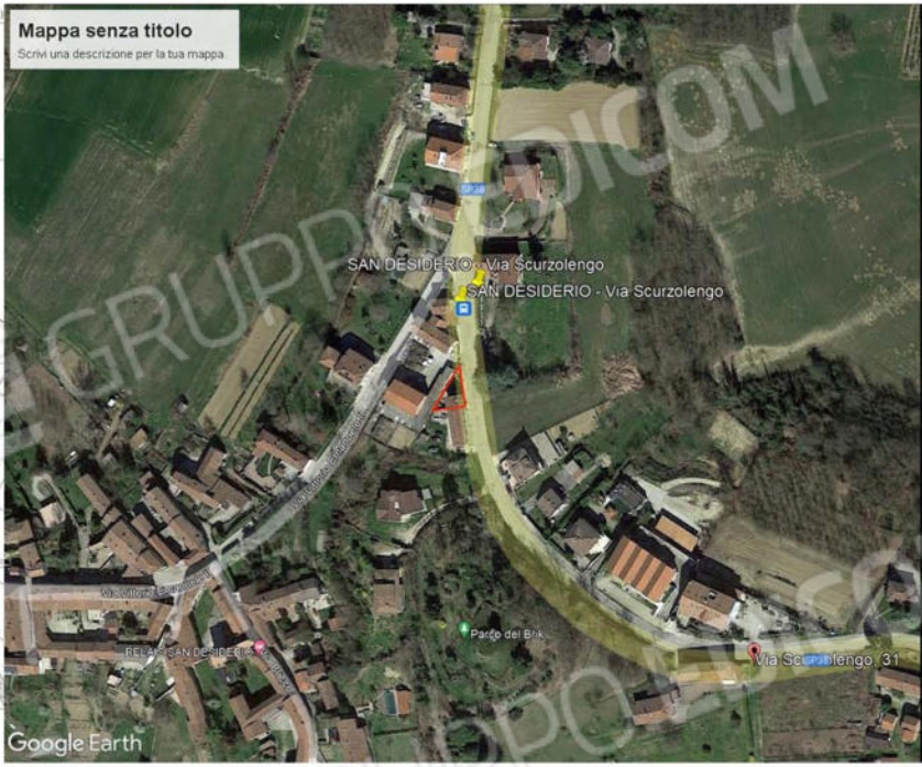
FOTO 01 foto aerea a confronto con stralcio di mappa (non in scala).