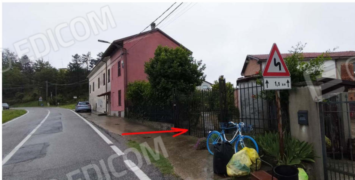
accesso alla proprietà dal cortile