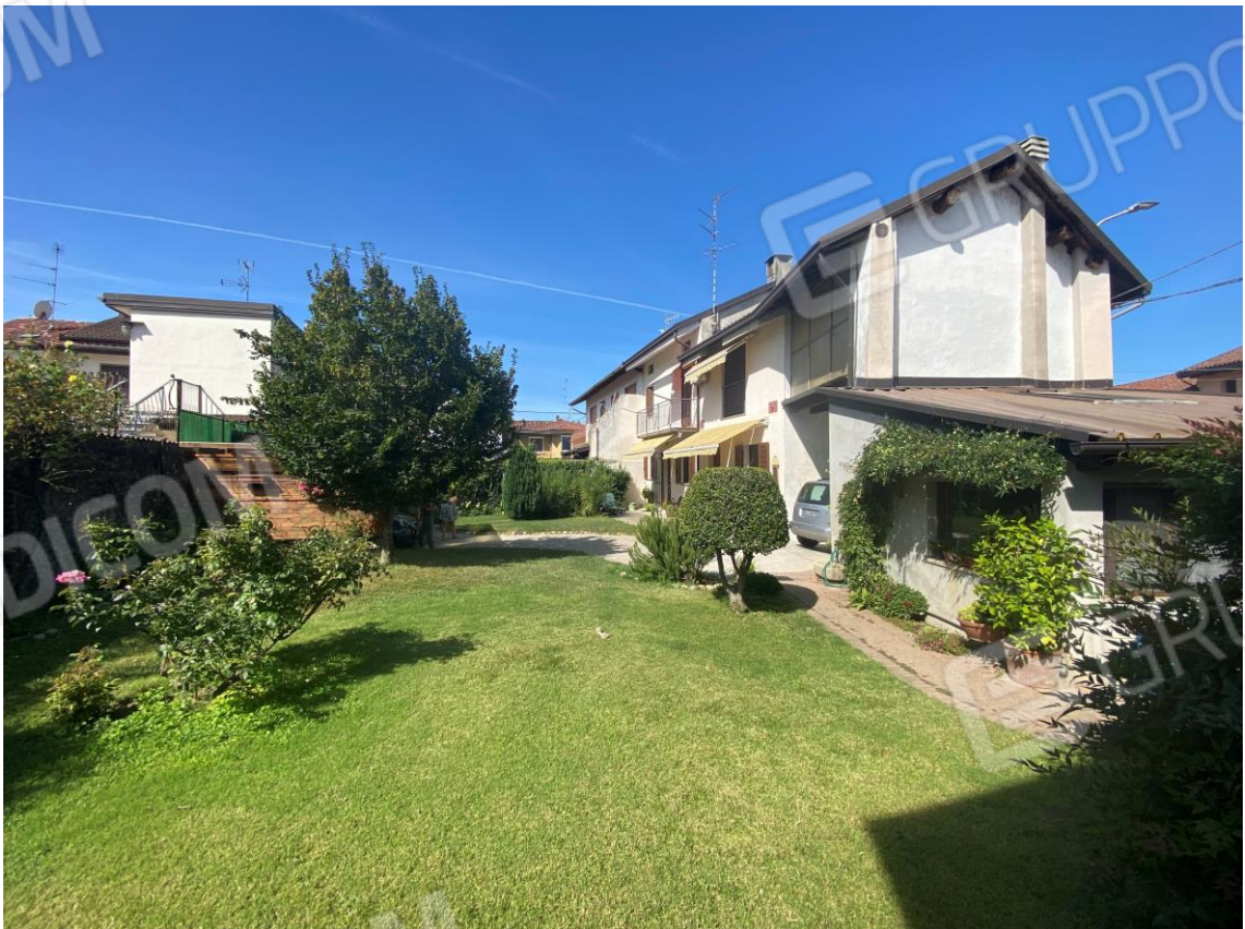
FOTO 20 : VISTA ESTERNA DELL'INTERNO IMMOBILE DA LATO CORTILE ESCLUSIVO