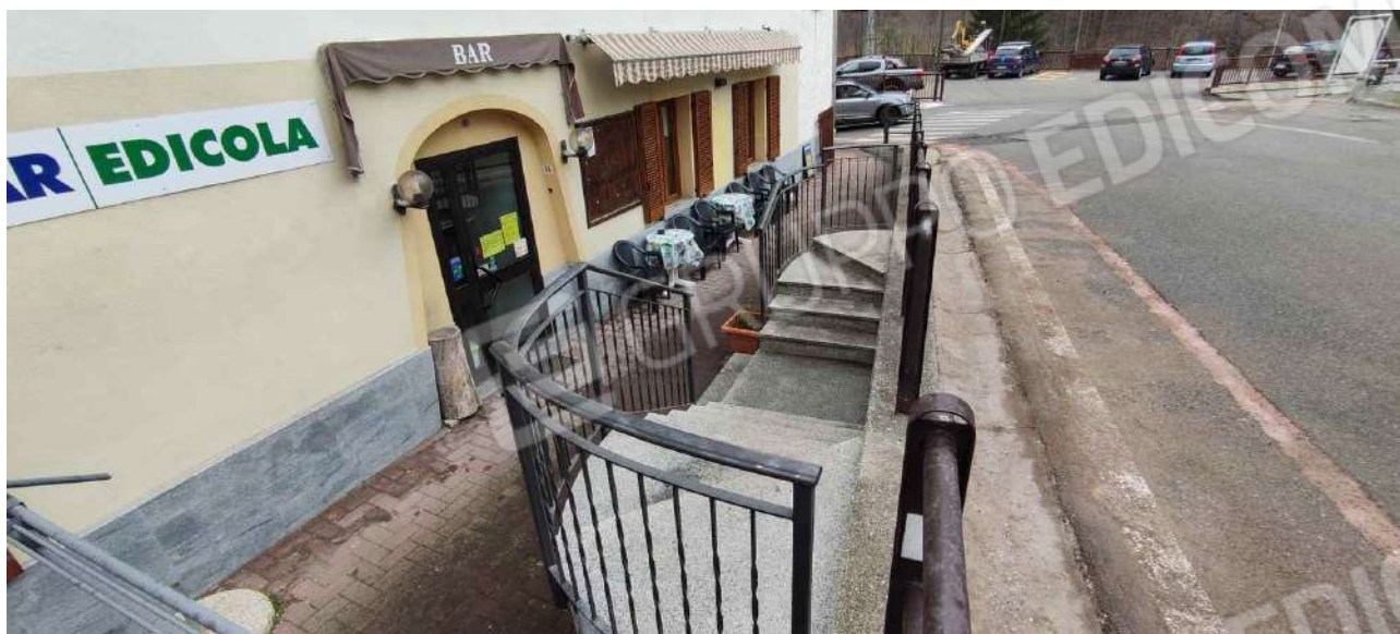
Accesso pedonale dalla strada e spazio esterno bar