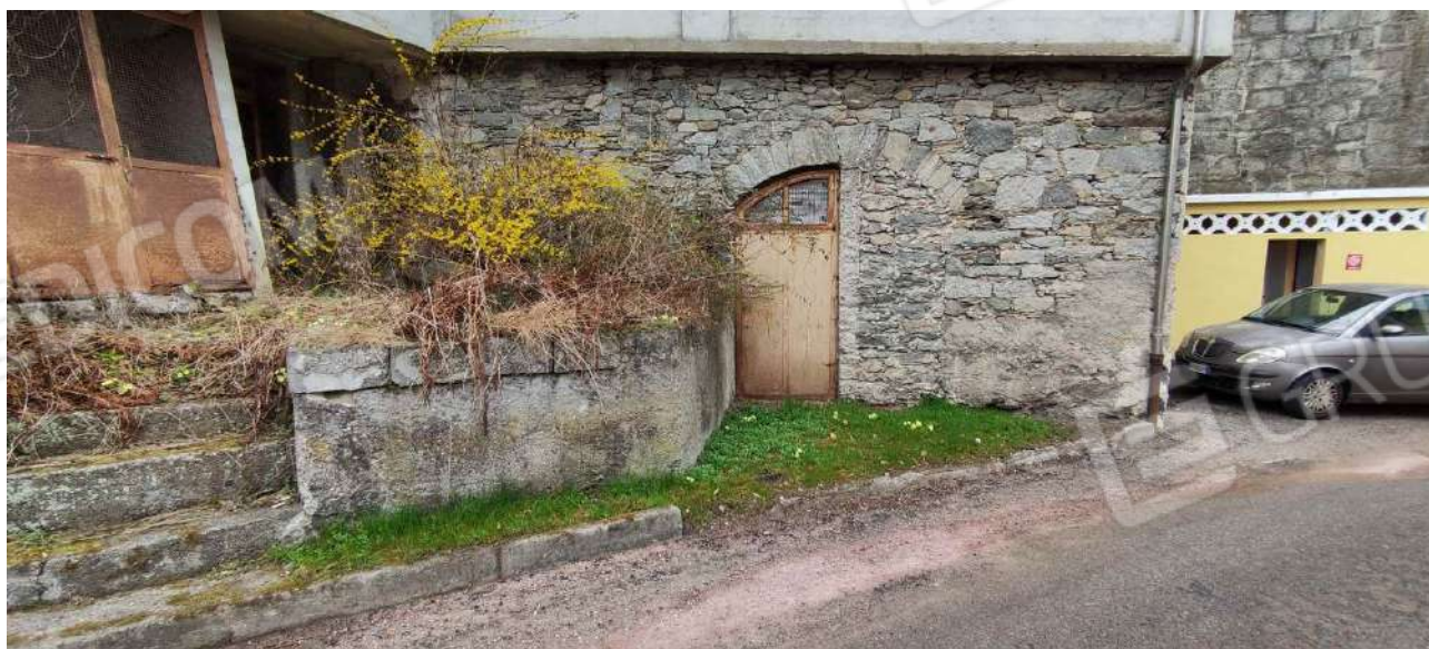
Ingresso locale caldaia