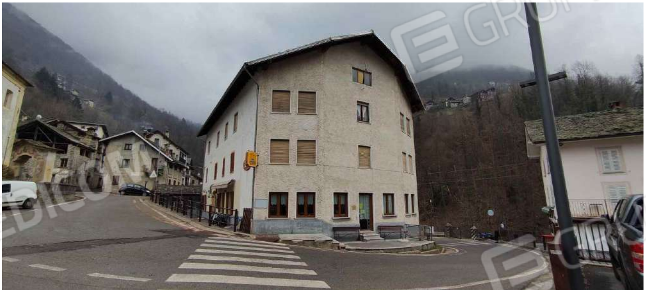
vista da Sud – Ovest – Ingresso minimarket