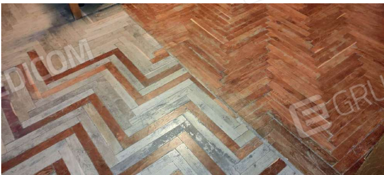
Pavimento camera 10