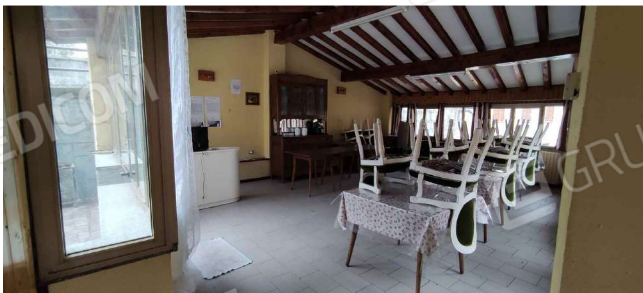
Reception dell'albergo utilizzato anche come sala colazioni