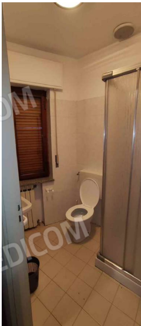
Bagno Camera 5