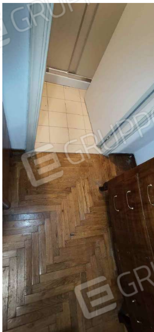
Pavimento tra camera e bagno