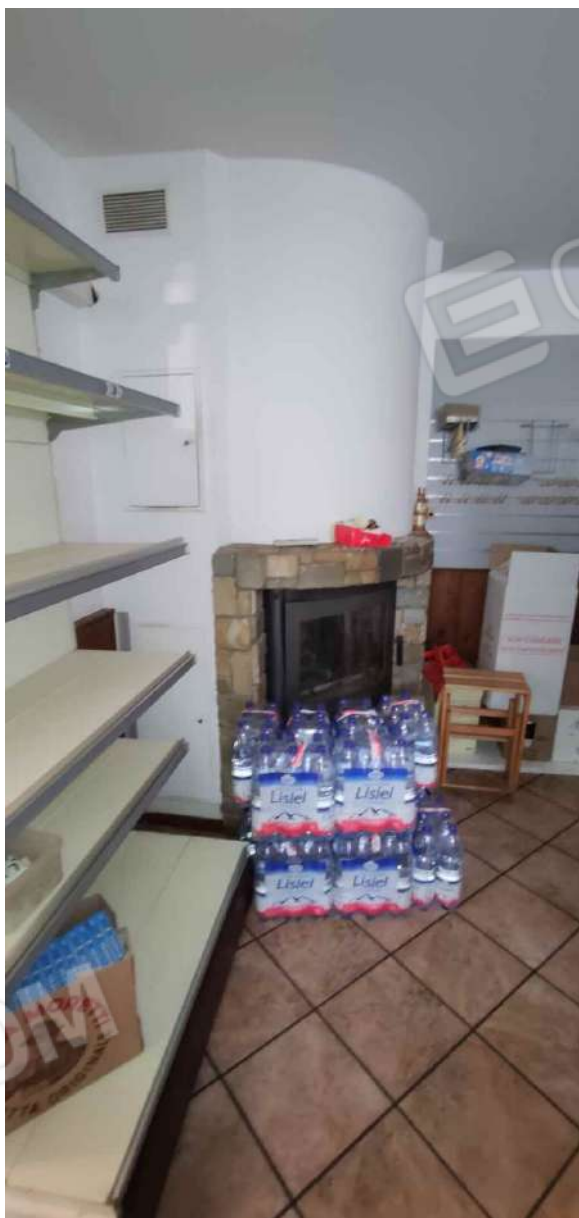
Camino presente nel locale minimarket dalla