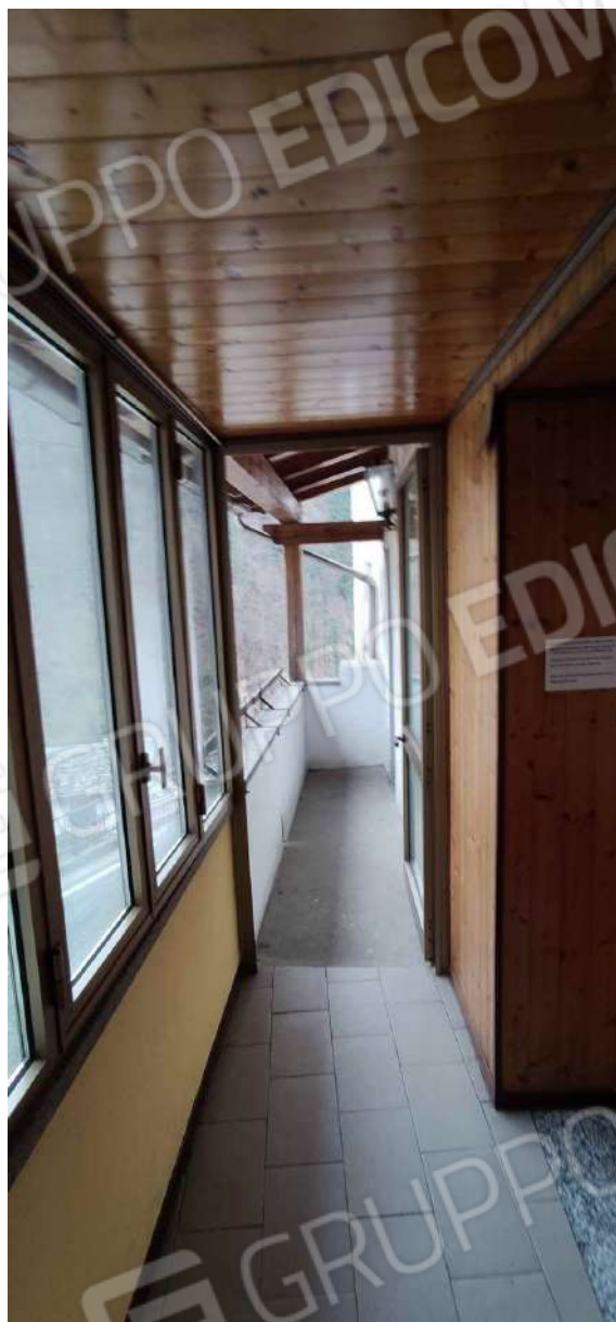
accesso alla loggia sul prospetto Nord reception dell'albergo