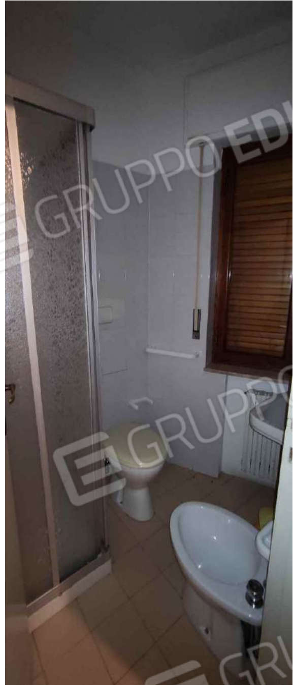
Bagno camera 6