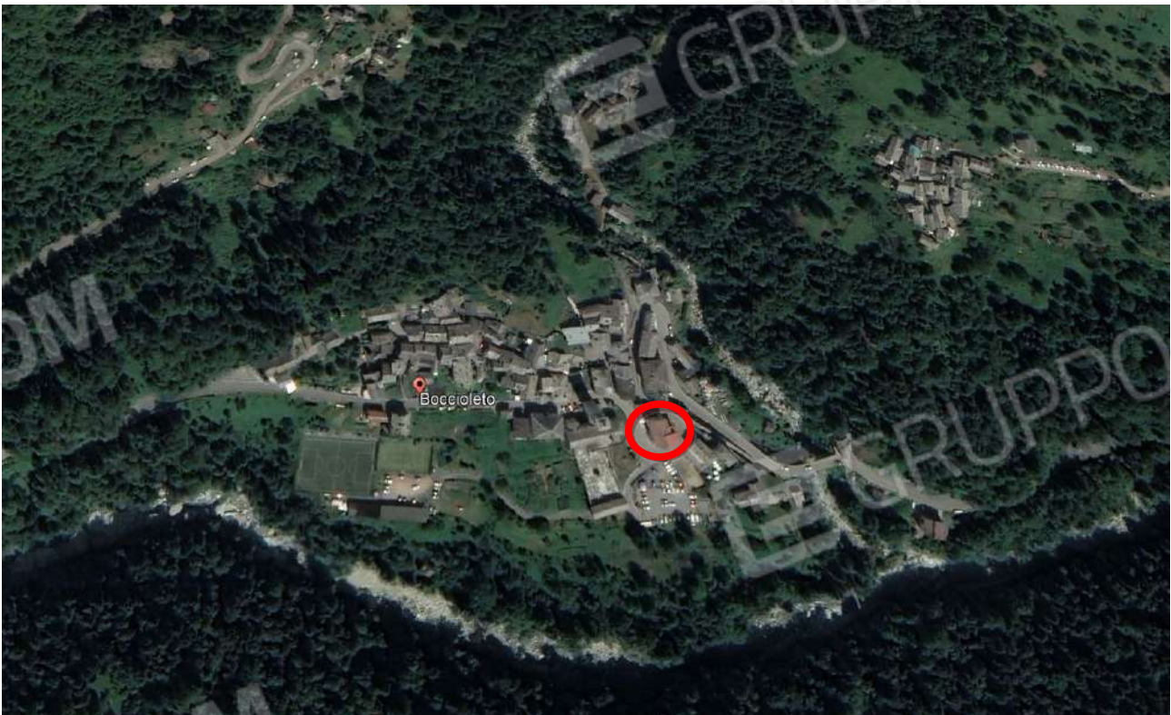
Individuazione beni nel territorio comunale di Boccioleto.