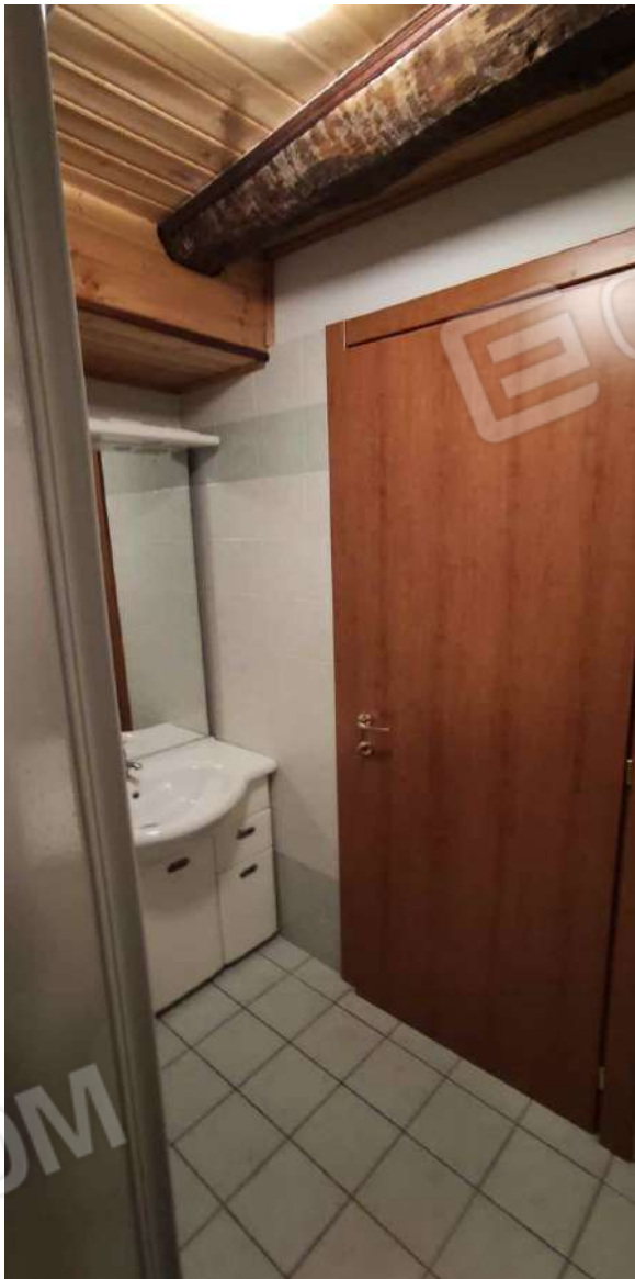
Bagno camera 10