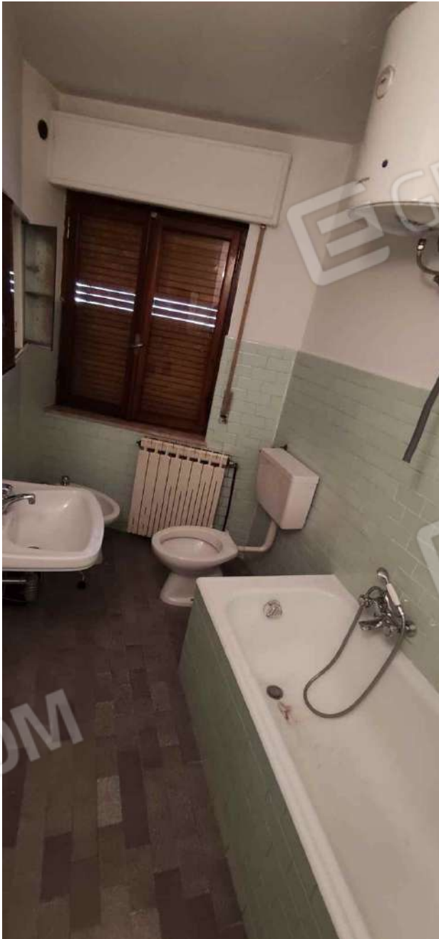
Bagno Camera 9