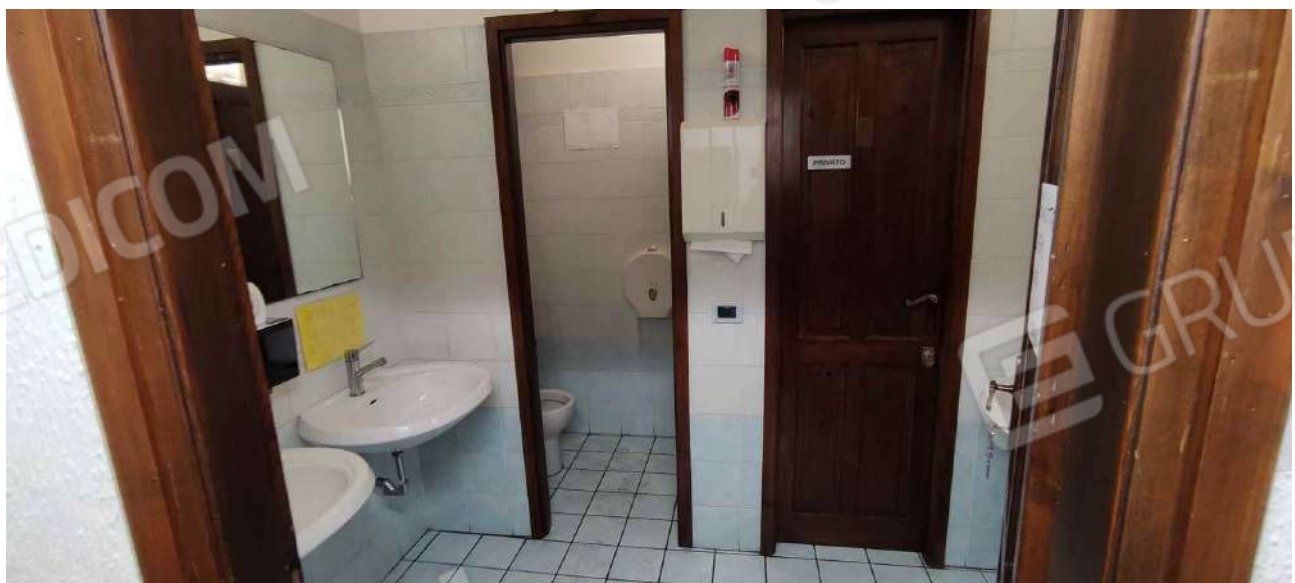
Bagni bar a minimarket