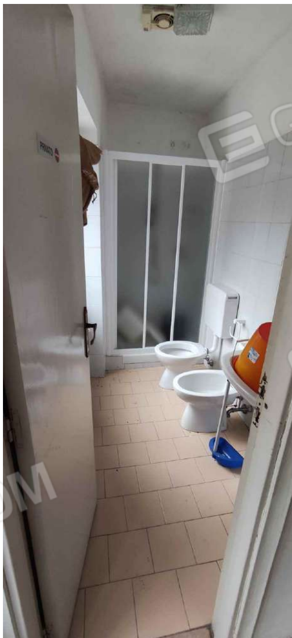
Bagno comune /di servizio