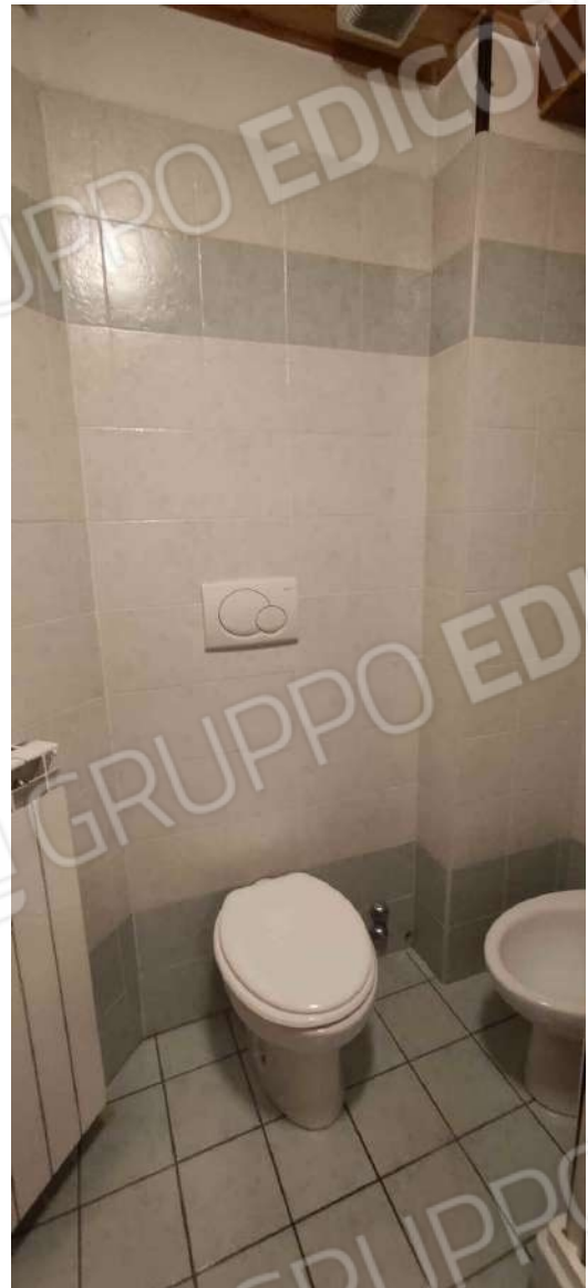
Bagno camera 10