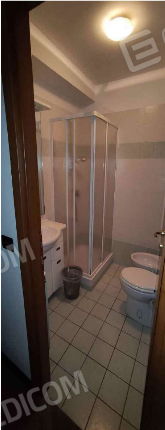
Bagno camera 2