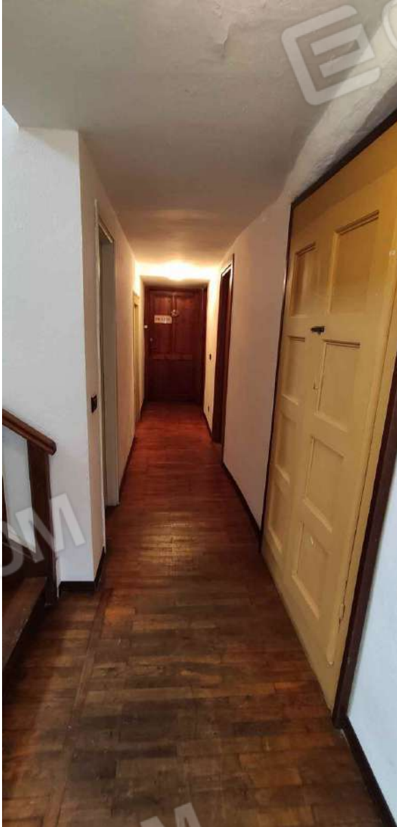
Corridoio di distribuzione