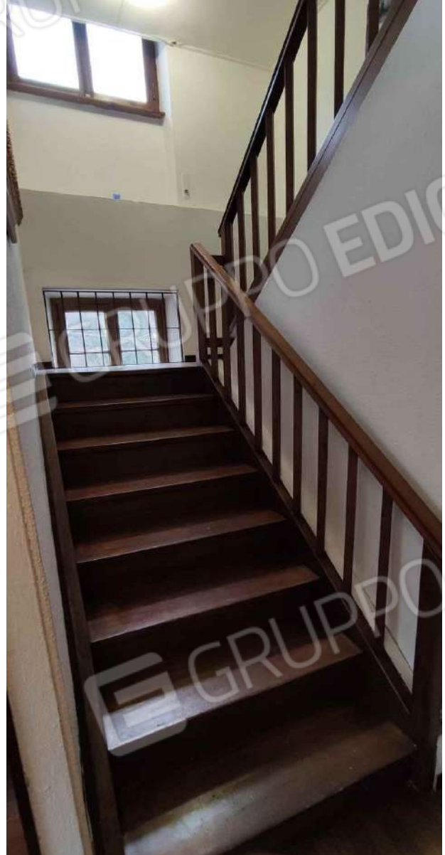
Scala tra piano secondo e piano terzo