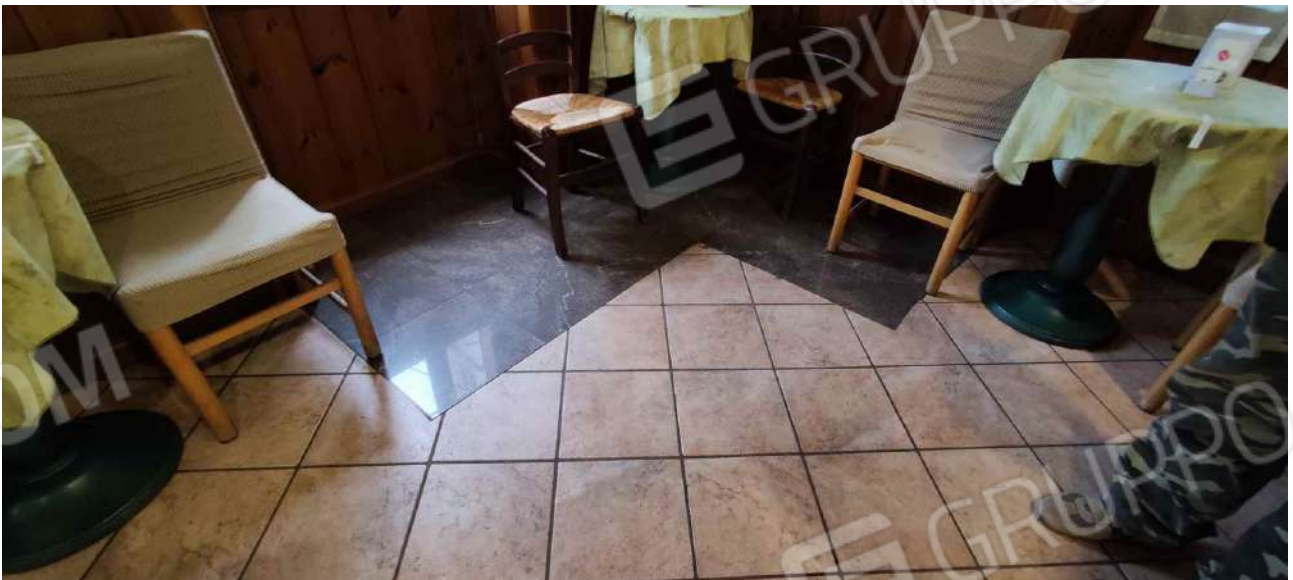
Porzione di solaio chiusa per eliminazione scala