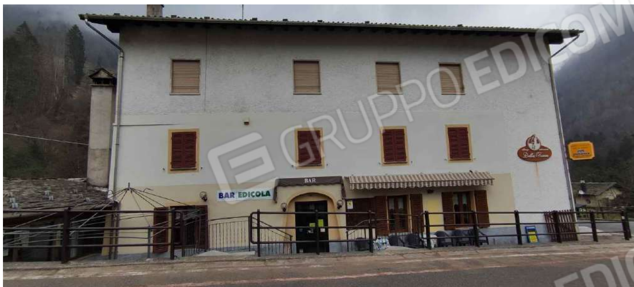
Prospetto Ovest - ingresso al bar-edicola