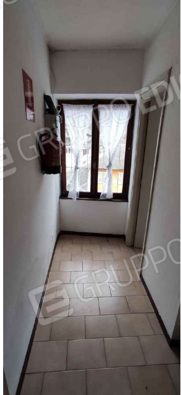
Corridoio di distribuzione