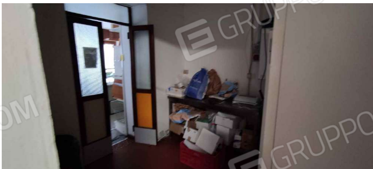
Deposito tra il locale cucina e il minimarket