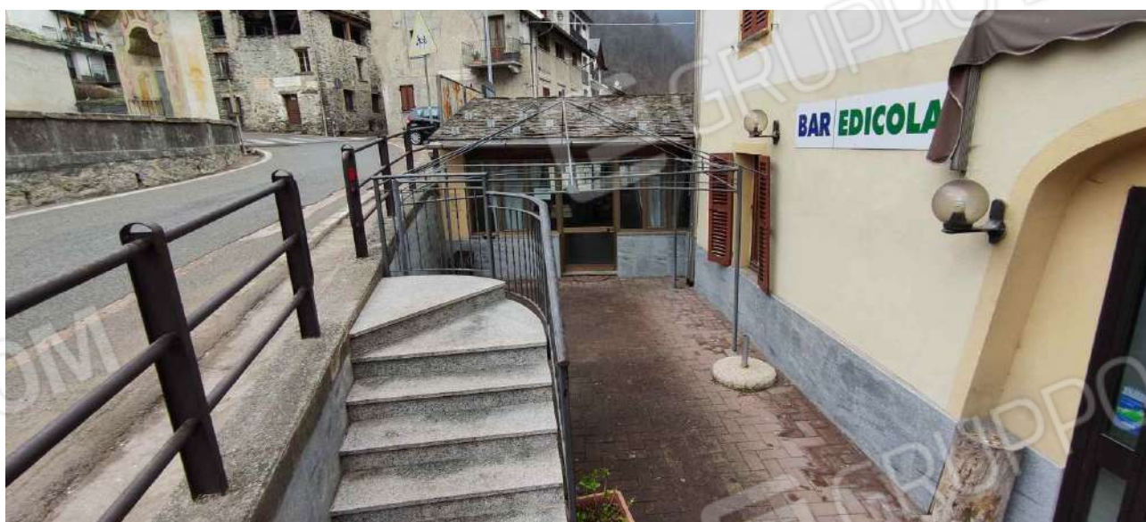
vista delle reception e sala colazioni ("sala-giochi" in planimetria catastale)