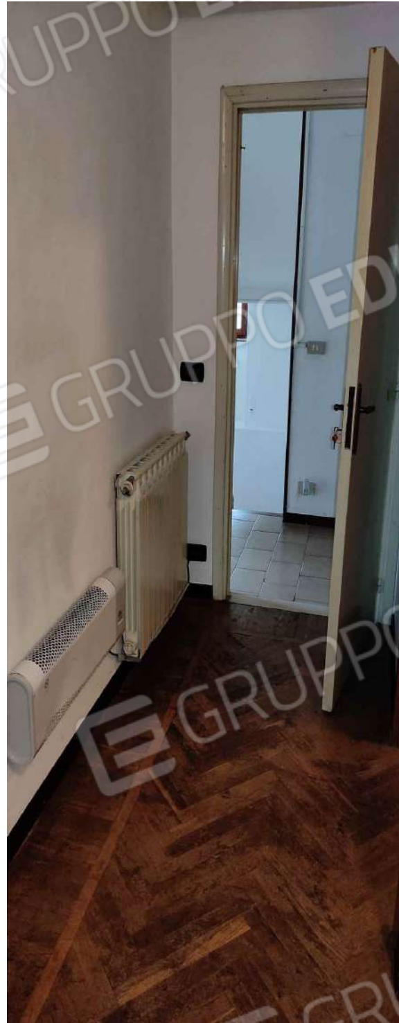
Ingresso camera 2