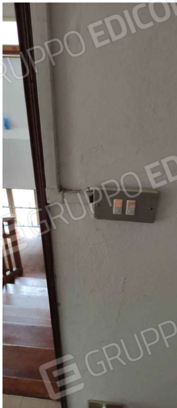
particolare corridoio piano terzo